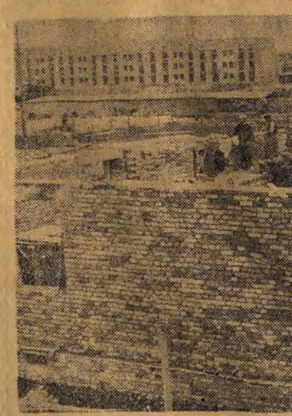
Wzrastają mury nowych domów

czym powinno być centralne ogrzewanie czy piece kaflowe - pierwsze jest ekonomiczniejsze.