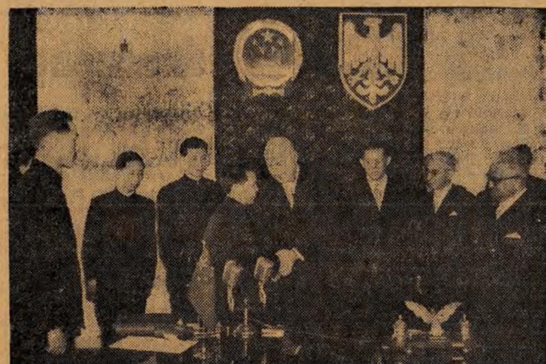
W dniu 3 kwietnia 1951 r. w gmachu Prezydium Rady Ministrów przedstawiciele rządów: Polski i Chińskiej Republiki Ludowej podpisali umowę o wymiarze kulturalnej między obu narodami. Z ramienia rządu polskiego umowę podpisał minister spraw zagranicznych — Skrzyszewski, a ze strony Centralnego Rządu Chińskiej Republiki Ludowej ambasador Peng Ming-chih. Na zdjęciu: premier Józef Cyrankiewicz i ambasador Peng Ming-chih po podpisaniu umowy składają sobie gratulacje.

BERLIN (PAP). — Wysocy komisarze trzech mocarstw zachodnich poczynili nowy krok w kierunku przekształcenia Niemiec Zachodnich w arsenał zbrojeniowy państw imperialistycznych, znosząc, względnie znaczenie łagodząc dotychczasowe ograniczenia obowiązujące w różnych kluczowych gałęziach przemysłu zachodnio-niemieckiego. Gwałtowne postanowienia układu poczdamskiego z roku 1945 oraz protokołu dodatkowego z roku 1946, wysocy komisarze zachodni zezwolili Niemcom adenauerowskim na nieograniczoną produkcję stali (dotychczasowy pułap wynosił 11.100 tys. ton), przy czym dodatkowa produkcja ma pójść na zwiększenie potencjału wojennego agresywnego bloku atlantyckiego. Niemcom Zachodnim ezwolono bez żadnych ograniczeń na produkcję aluminium oraz szeregu związków chemicznych niezbędnych dla produkcji zbrojeniowej. Zniesiono dotychczasowy zakaz produkcji paliw syntetycznych i sztucznego kauczuku. Uchylono obowiązujące