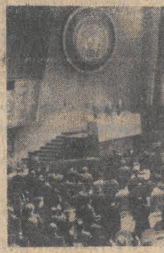
W siedzibie ONZ w Nowym Jorku rozpoczęła się 15 bm. czwarta sesja Światowej Konferencji Prawa Morza.