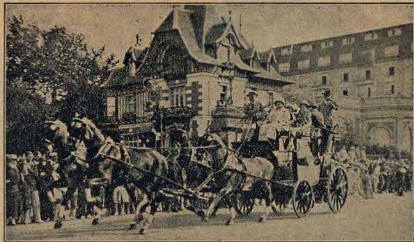
Zamożni a miłujący przeszłość paryżanie zrobili wycieczkę do Deauville starym koczem, który pamięta jeszcze czasy Napoleona I.