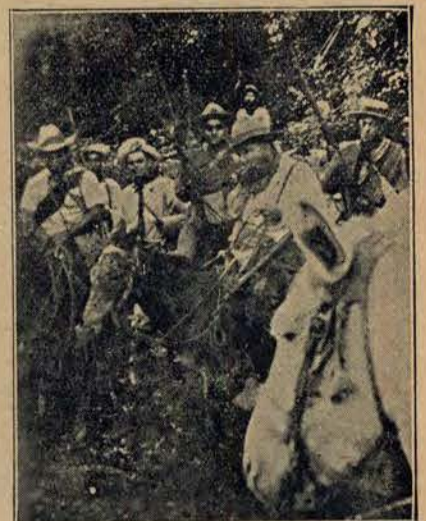
Partyzanci jenerała Sandino w zasadzce.