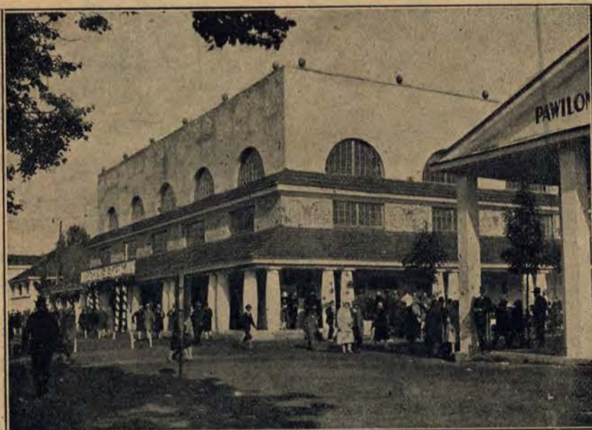
Tegoroczne Targi Wschodnie we Lwowie, których fragmenty powyżej po lewym boku cieszyły się wielką frekwencją cudzoziemców, interesujących się wytwórczością polską. Na otwarciu Targów była licznie reprezentowana prasa zagraniczna.