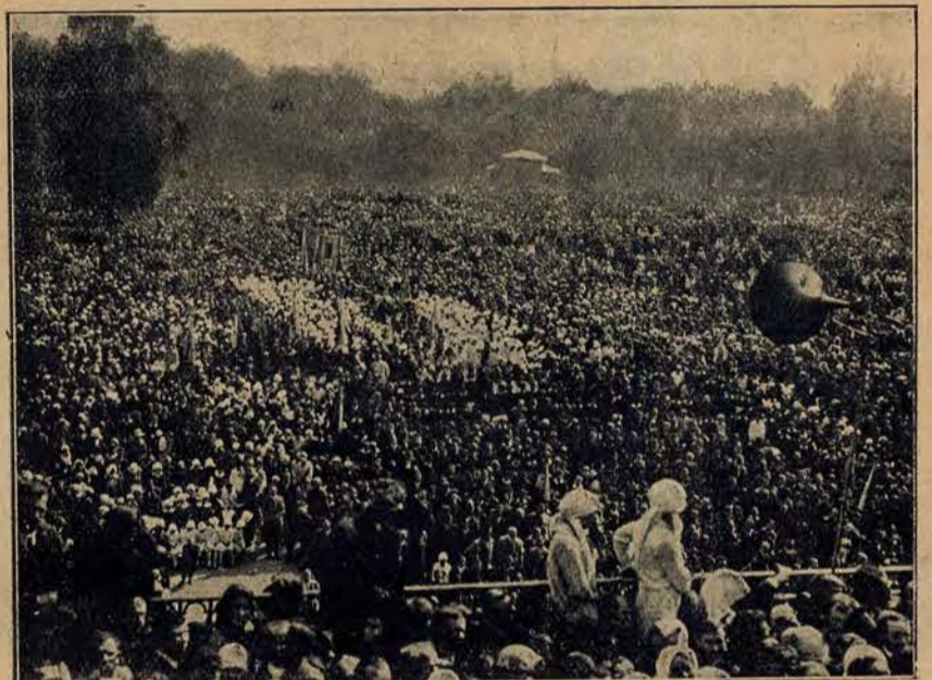
Wielkie tłumy uczestników Kongresu słuchają przemówień.