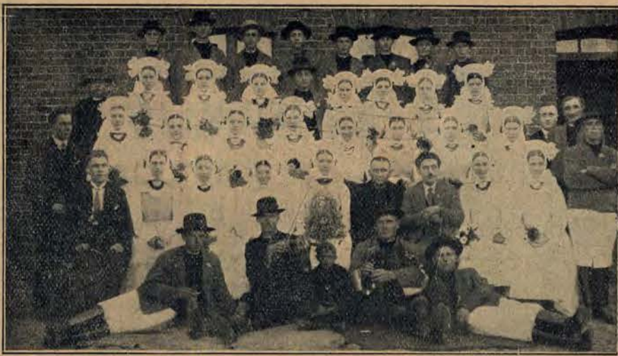
Dożynki „Biskupianów“ w Żytowiecku pod Krobia Wlkp.