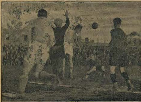
Mecz Legja — Hasmonia (7:1).