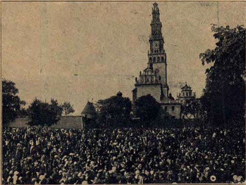
Jasna Góra w otoczeniu tłumu wiernych.