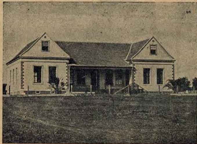
Szkola sióstr w Orleanie.