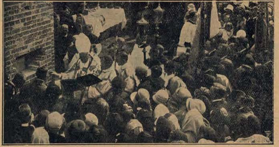
Moment poświęcenia kamienia węgielnego i murowanie.