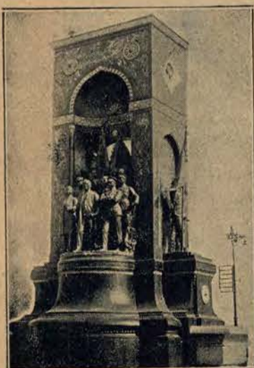
Pomnik Niepodległości w Konstantynopolu.