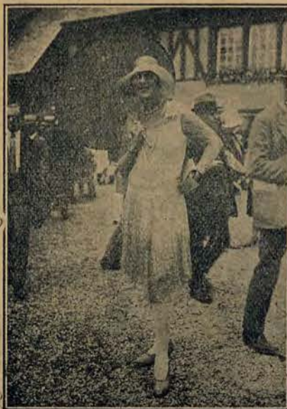
Ostatnie modele najpiękniejszych sukien w sezonie bieżącym w Deauville we Francji.

W październiku roku bieżącego zacznie wychodzić Wielka powieść zeszytowa dla młodzieży i ludu