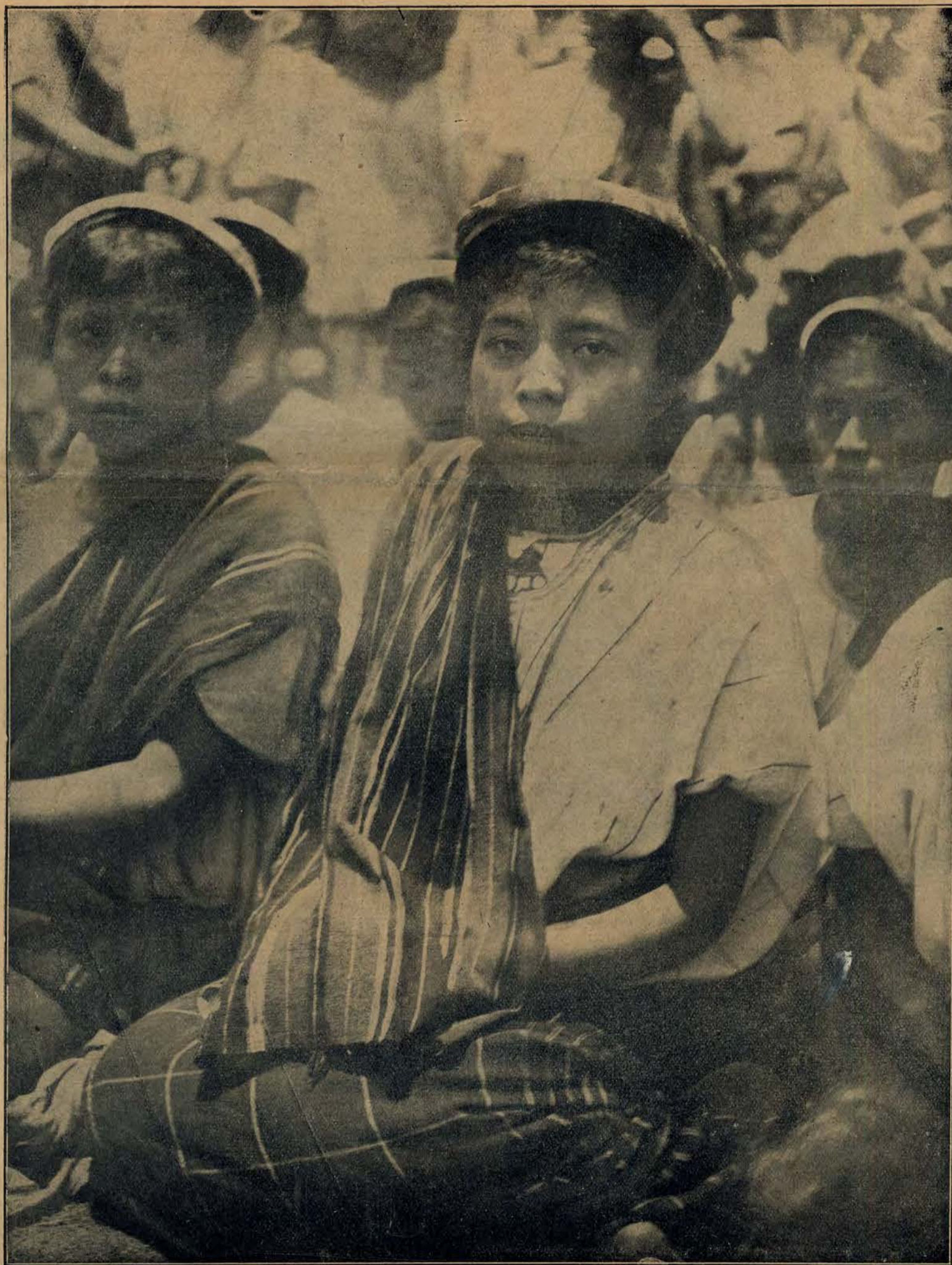
Urodziwe mieszkanki zrewoltowanej obecnie Repub. połud. Amerykańskiej Nikaragua.