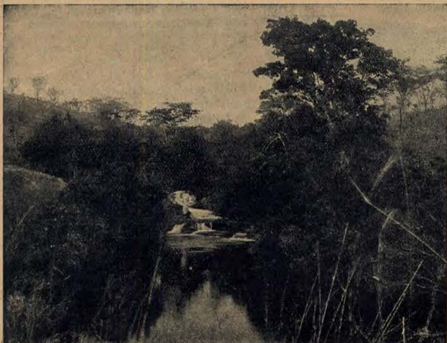
Malowniczy zakątek na płaskowyżu Angoli.