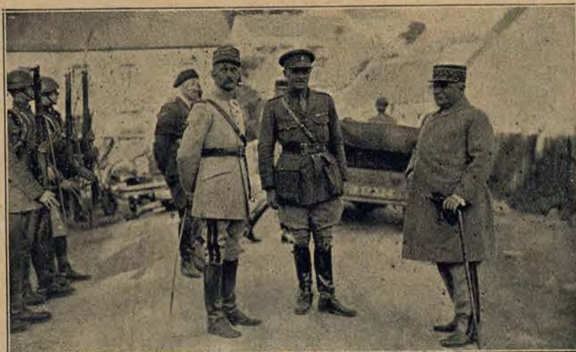
Jenerałowie francuscy de Partouneau i Gaillaumat, uczestniczący w manewrach nad Renem.