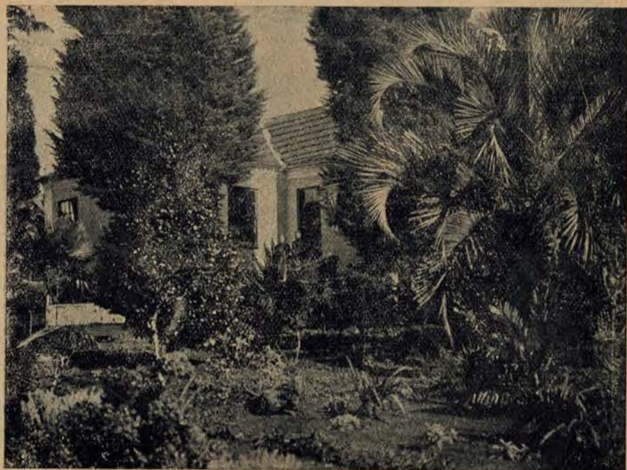
Ogród polskiej plebanji w Thomas Coelho.