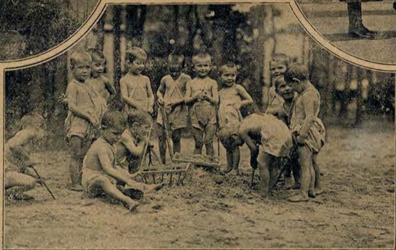
W raju małych ludków.