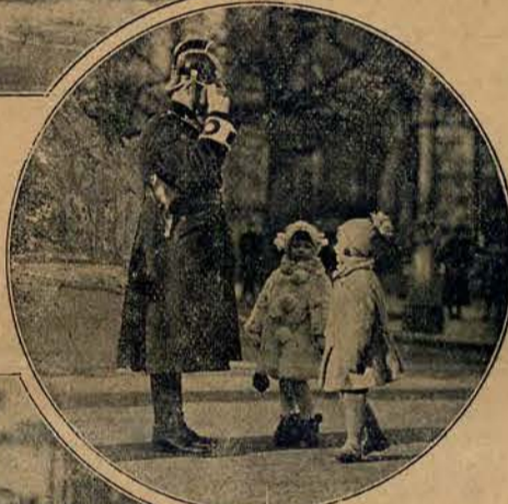
Proszę pana, zblądziliśmy, którą drogą do mamy?