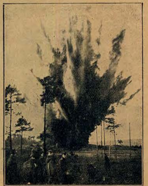
Wybuch miny wagi 30 kg.