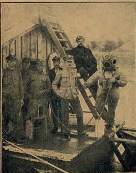
Nurek z ładunkiem dynamitu przed wstąpieniem do wody.