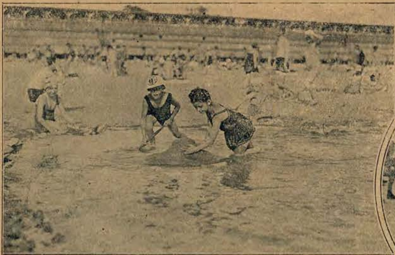
Zabawa na plaży.