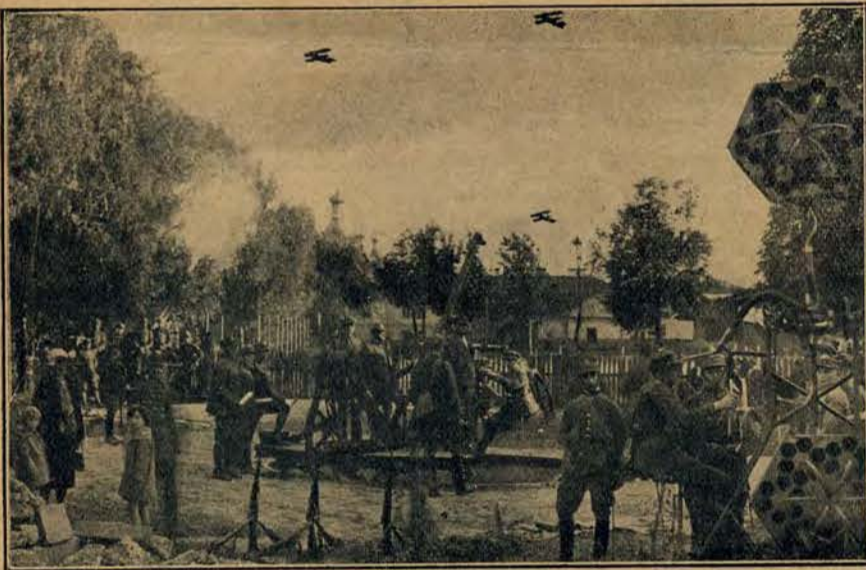
Propagandowy pokaz obrony przeciwlotniczej: artylerja ostrzeliwająca eskadrę lotniczą.