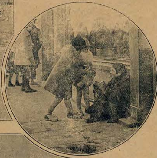
Ubogiemu z pomocą