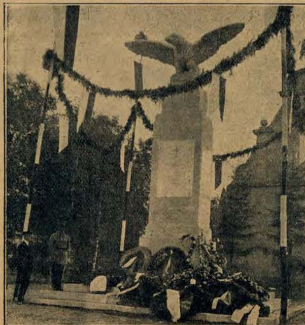
Nowoutfundowany przez Tow. Gimn. „Sokół” pomnik poległych bohaterów w Gąbicach, pow. mogileńskim, którego odsłonięcie nastąpiło dnia 16 b. m.