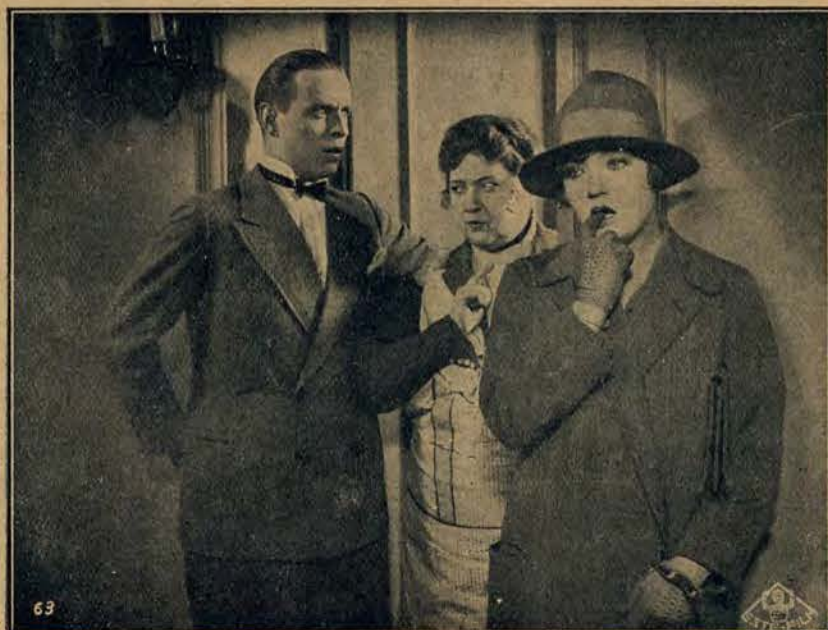
Fragment filmu „Tajemnica Pani Mary”, osnutego na tle słynnej powieści Langescheite p. t.: „Głupia Historia”.