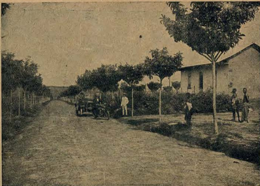
„Fozenda” kolonisty na płaskowyżu Angoli.