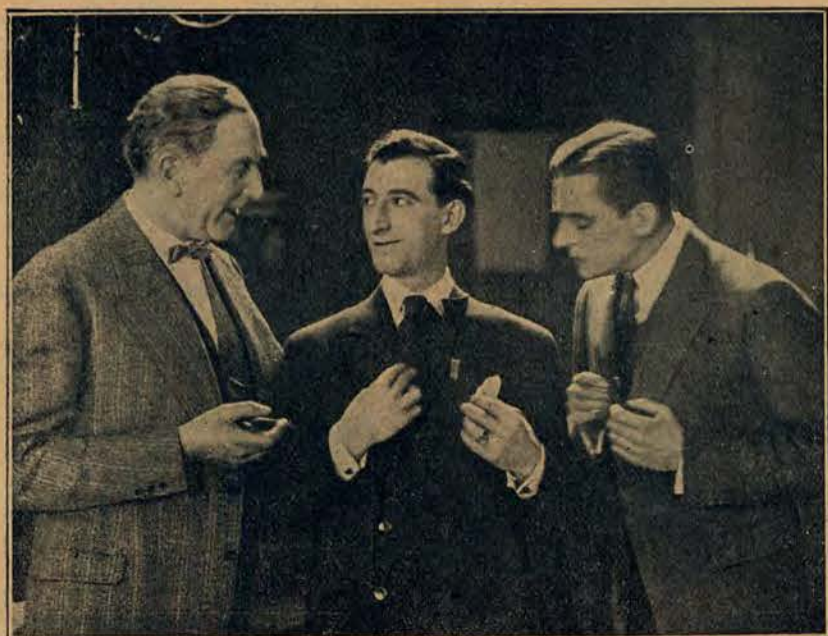
Scena z filmu: „Szofer Jaśnie Pani”. Na zdjęciu Fritz Alberti, Ziegfried Arno i Jack Treroz.