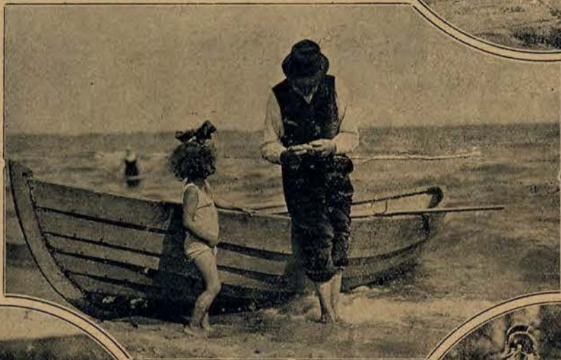
Poważna rozmowa z rybakim.