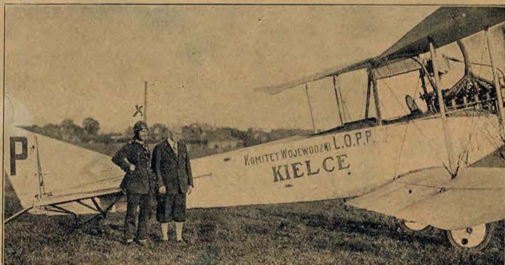
Samolot Ligi Obrony Powietrznej i Przeciwgazowej, na którym płk. Ocetkiewicz odbył lot propagandowy do wszystkich większych miast polskich.