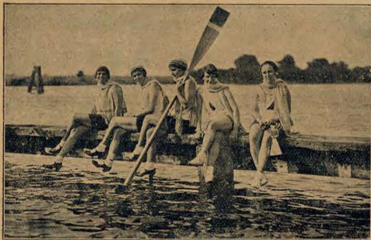
Jedna z osad Warsz. Klubu Wioślarek, która zdobyła szereg nagród krajowych i międzynarodowych.