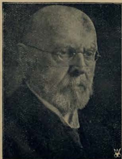
W Pradze zmarł ś. p. Alois Jirasek, znakomity czeski powieściopisarz.