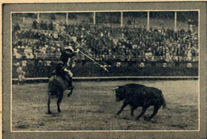
Rejoneador na wspaniałym arable poluje na kark byka.