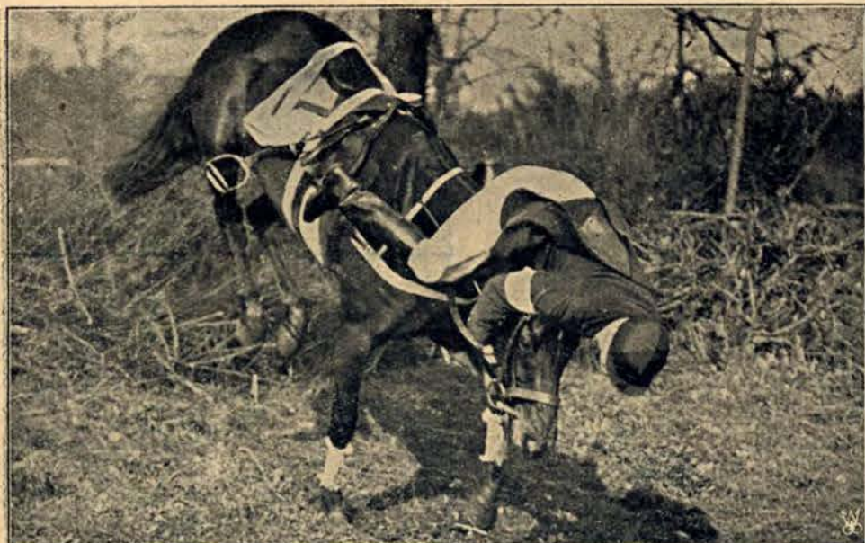
Fragment steeplechases, uchwycony przez fotografa.