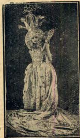
Kostjum z bajki.