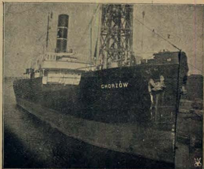
Nowonabyty przez państwową żeglugę statek „Chorzów”, przeznaczony do przewozu ładunków drobnicowych.