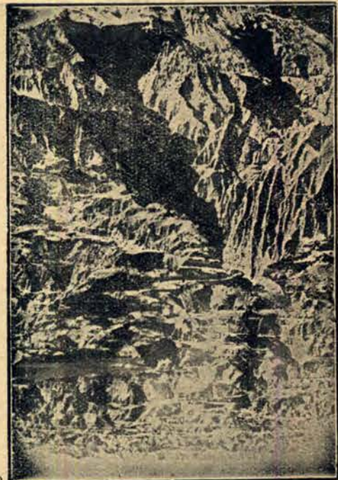
Dziko poszarpane bloki górskie w południowej Dakocie.