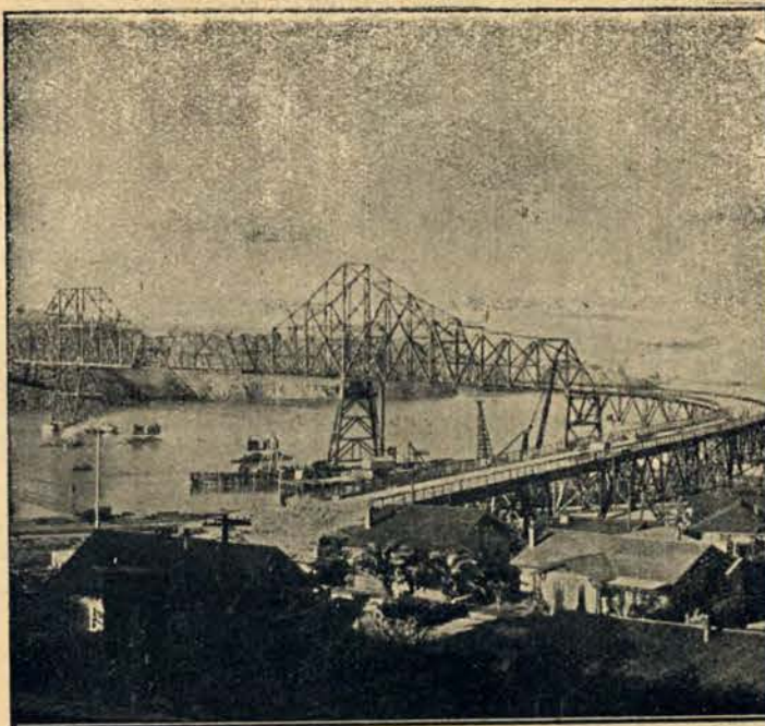
Olbrzymi most żelazny nad zatoką San Francisco