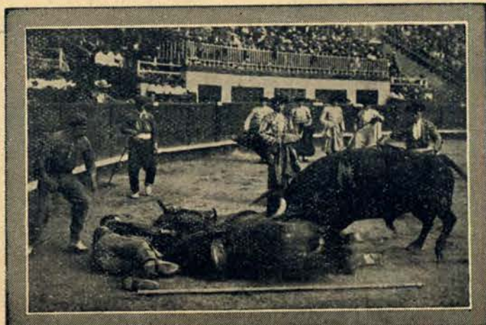
Śmierć konia na arenie.