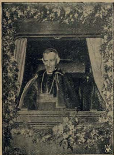
Nowy nuncjusz Stolicy Apostolskiej w Berlinie, Msgr. Cesare Orsenigo