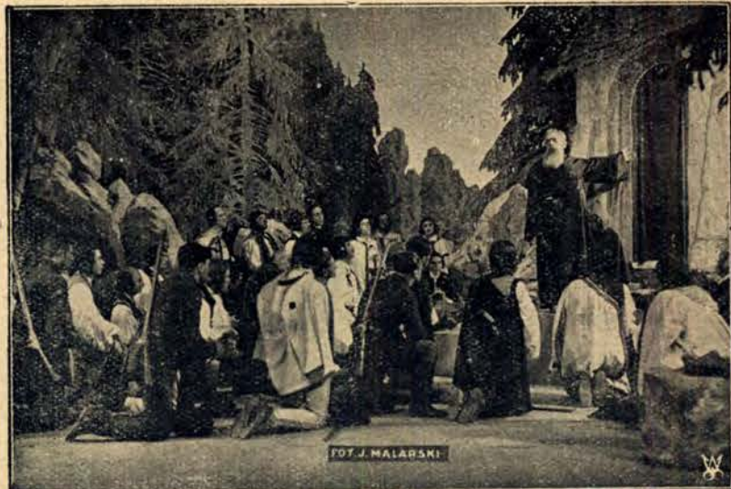
Scena z II aktu „Konfederatów Barskich” Mickiewicza.