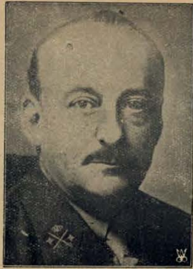
Gen. Primo de Rivera, b. dyktator Hiszpanji, zmarł w Paryżu w 60 roku życia.