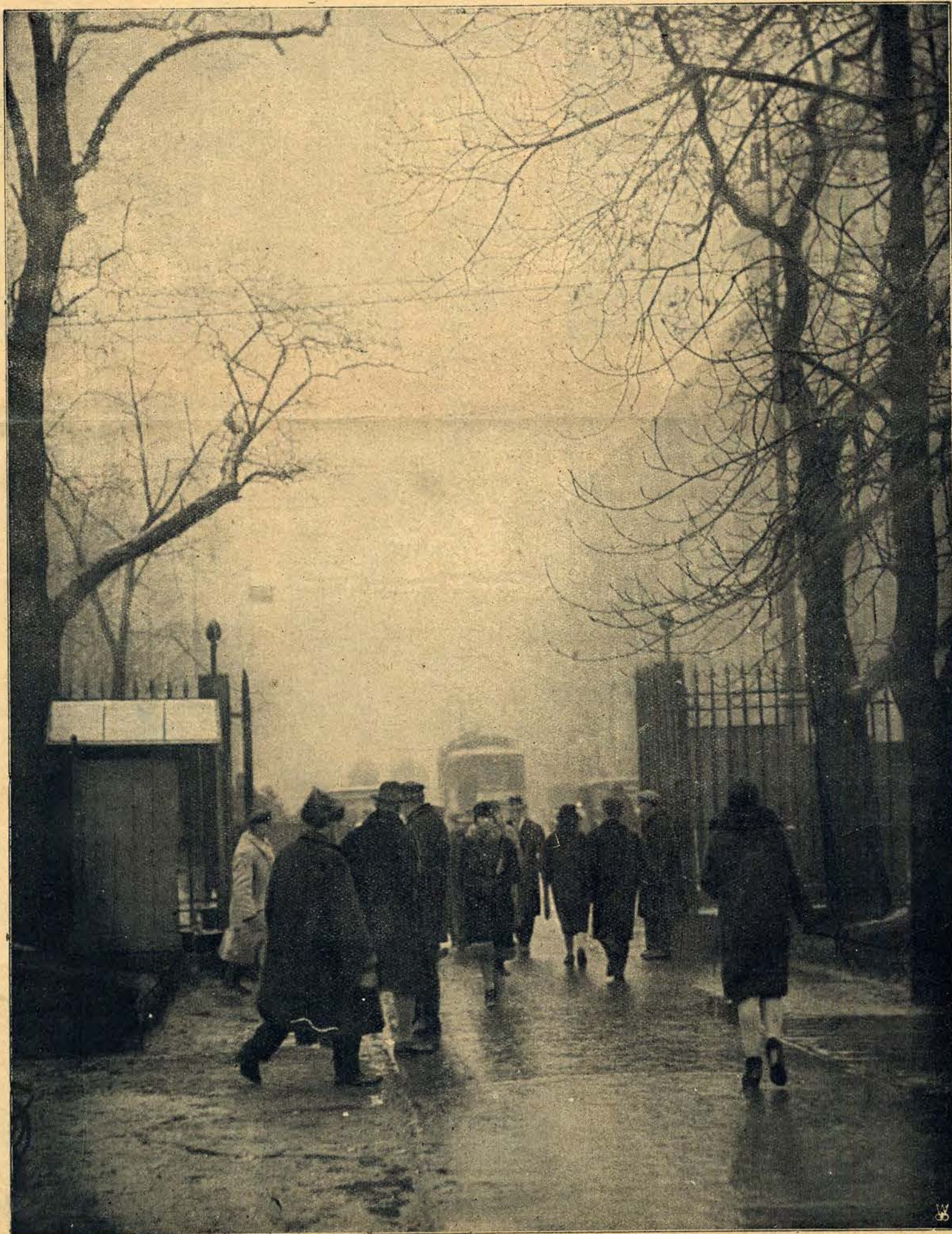
Saski Ogród w Warszawie, choć jeszcze nie rozkwitł urokami wiosennymi, przyciąga jednak codziennie tłumy publiczności.