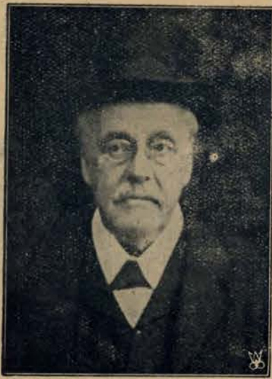
Zmarł lord Balfour, wybitny angielski mąż stanu.