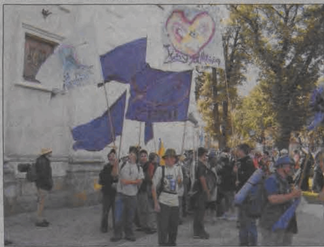
...wychodziła z Łowicza pod różnymi kolorami. Grupa biało-żółta była z Kutna, pomarańczowa to Salezianie z Żyrardowa i Kutna,ioletowa z...