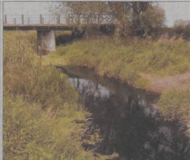
Woda w Słudwi na wysokości Żłakowa Kościelnego ciągle jeszcze pozostawia dużo do życzenia pod względem czystości.

Członkowie bractwa, obok noszenia medalików, mają za zadanie między innymi rozszerzać kult Matki Bożej, z zaangażowaniem uczestniczyć w życiu parafii, swoim życiem i postawą naśladować Maryję i Jezusa. Zobowiązani są też do odmawiania codziennej modlitwy „Pod Twoją obronę”, uczestnictwa w Eucharystii, przystępowania do spowiedzi i komunii świętej przynajmniej raz w miesiącu. - Do bractwa przyjęte może zostać każdy. Nie mających specjalnych wymogów - mówi proboszcz parafii w Bednarach. - Najważniejsze jest, aby w codziennym życiu naśladować Maryję. Taka przynależność wymaga po prostu nieco większego zaangażowania i wydaje mi się, że wynikające z niej obowiązki spełnić może każda osoba - dodaje.