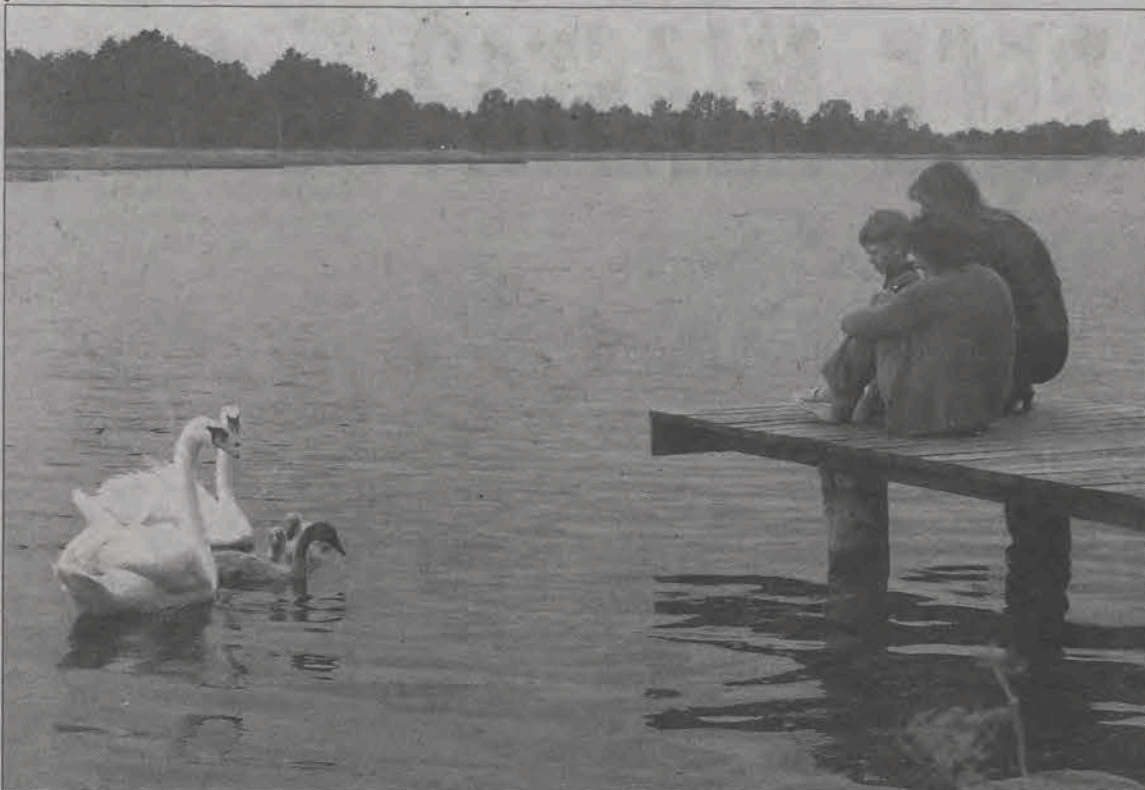
Na bolimowskim zalewie obok łabędzi bytują także dzikie kaczki i kurki wodne. Jest to jedna z nielicznych jak na razie atrakcji zbiornika.