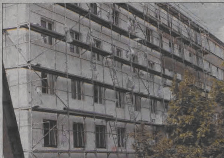
Blok numer 4 na Bratkowicach jest już pokryty styropianem w około 50%.

Główna nagroda - sześciodniowa wycieczka do Paryża