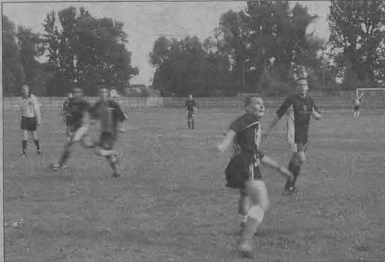
W ostatnich sparingach ekipa Pelikana II zaczęła w końcu wygrywać. Oby ta seria została przedłużona także na rozgrywki ligowe...