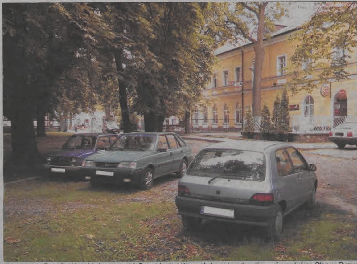
Tak wygląda Park Saski w dzień powszedni. Samochody, które parkują na jego terenie powinny stać na Starym Rynku.

R adni zgodzili się na przesunięcie 5 tys. złotych, zapisanych w dziale dotyczącym wydatków drogowych i dołożenie ich do 3 tys. zł zapisanych już na zakup agregatu. Zebrane w ten sposób 8 tys. zł to udział