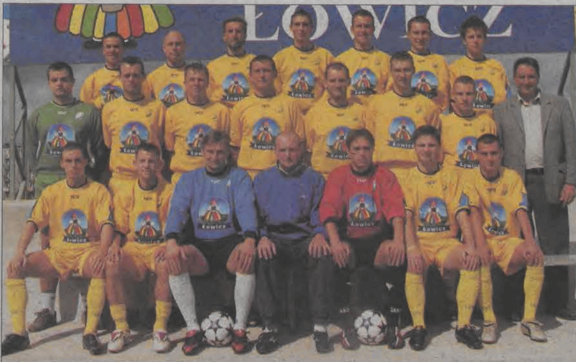
Z dużymi nadziejami na sukcesy w rundzie jesiennej w III lidze przystępują do gry gracze łowickiego Pelikana.

Piłkarska - w weekend inauguracja rozgrywek III i IV ligi