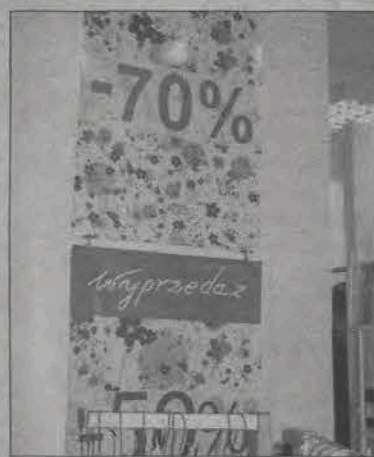
Nawet o 70% spadły ceny odzieży letniej w sklepie przy ulicy Krakowskiej.

oów maluchów, które ciągle rosną i potrzebują nowych ubrań.