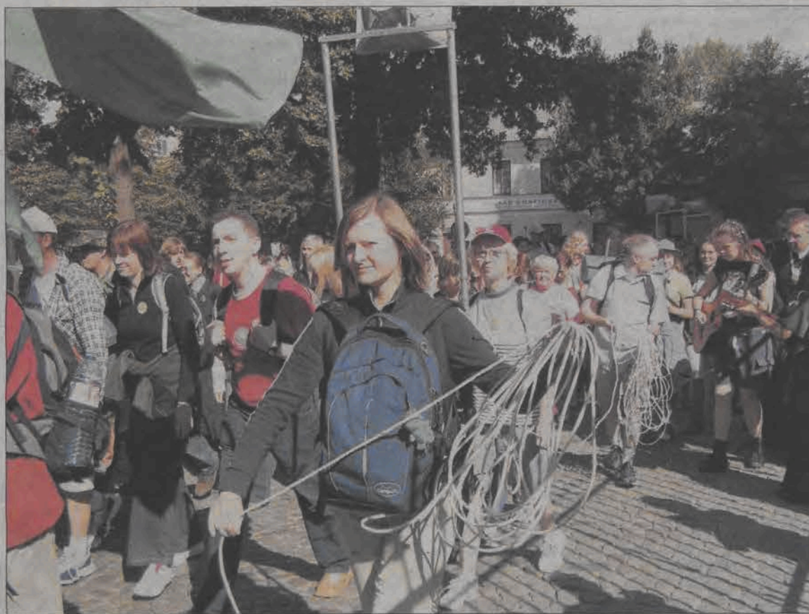
Ponad dwa tysiące pielgrzymów wyruszyło w ostatnią sobotę 6 sierpnia na jubileuszową X Łowicką Pielgrzymkę Młodzieżową. Dzisiaj, 11 sierpnia pielgrzymi są w Gosławicach, na Jasną Górę wejdą 14 sierpnia. Więcej piszemy na stronie 15.