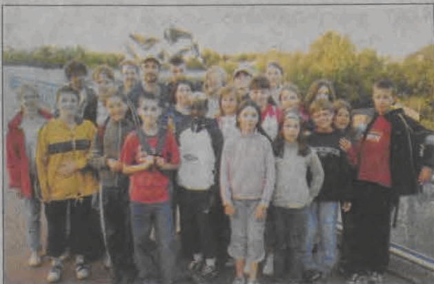
Polacy i Francuzi podczas wycieczek czuli się jak jedna wielka rodzina.

Wyprawa do Francji okazała się dla łowickich dzieci bardzo udana. Mają one nadzieję, że współpraca między naszymi miastami będzie się