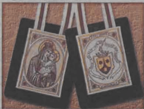
Pierwsze z osób, które przyjęte zostały do bednarskiego bractwa noszą szkaplerze takie jak ten na fotografii. Przyjęci w odpustową niedzielę mają medaliki.

pierwotnie przez zakon karmelitański jako zewnętrzny wyraz miłości Maryi do ludzi, oraz przyjęcia tej miłości przez nich i jej odwzajemnienia. - Jego historia sięga wspólnoty, która zawiązała się na górze Karmel w Palestynie - mówi proboszcz parafii w Bednarach. - Z powodu prześladowań bracia zakonnicy musieli przenieść się następnie do Europy, a w obawie przed kasacją generalnego zakonu zwrócił się do matki Bożej o opiekę i pomoc. Jak opowiada proboszcz, w 1251 roku Matka Boża w otoczeniu aniołów zwróciła się do generała zakonu Anglika Szymona Sztoka polecając mu noszenie szkaplerza jako symbolu jej miłości, wiecznego pokoju i zbawienia, znaku, dzięki któremu noszący go unikną ognia piekielnego.