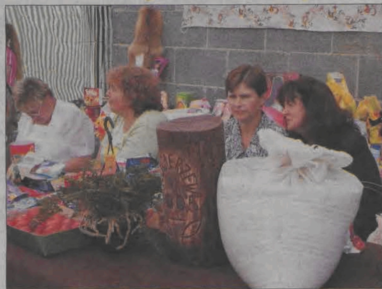
Koło Gospodyń Wiejskich zorganizowało loterię, w której każdy los wygrywał.

Strażacką zabawą taneczną zakończył się niedzielny piknik rodzinny na placu przy Ochotniczej Straży Pożarnej w Kocierzewie Południowym. Do godziny 20.00, kiedy zaczęła się zabawa, organizatorzy zapewnili mieszkańcom gminy szereg atrakcji. W „piknikowaniu” próbował przeszkadzać przelotny deszcz oraz wiatr niosący ze sobą chłodniejsze powietrze, ale wystraszyli się tylko nieliczni uczestnicy pikniku.