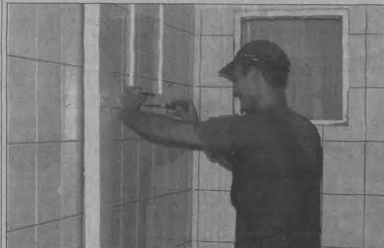
Remont w przedszkolu integracyjnym przy ul. Księżackiej idzie pełną parą.