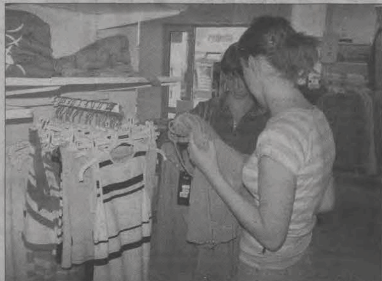
Każda z pań potrafi znaleźć dla siebie coś odpowiedniego w atrakcyjnej cenie.

Sklepikarze nie zapomnieli o najmłodszych. Również dla dzieci przewidziano promocje. Można teraz kupić dla nich letnie ubranka po nieco niższej cenie. Obniżki nie są zbyt duże, ale na pewno ucieszą rodziców.