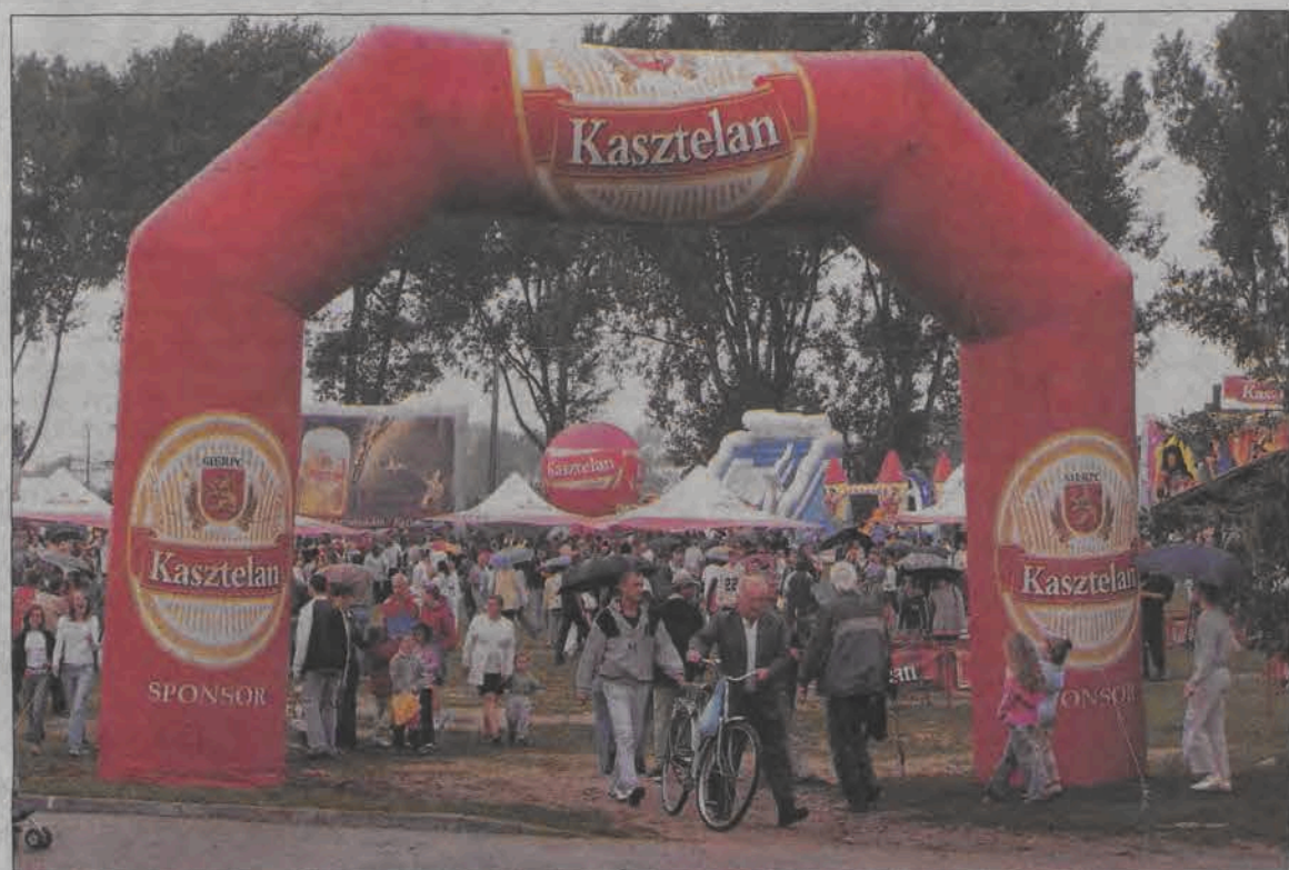
Biesiadę Kasztelańską było nie tylko słycać z daleka, ale było też ją z daleka widać.