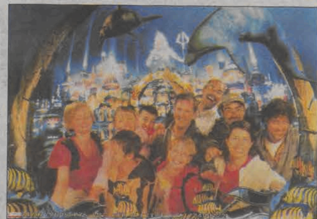
Pobyt we francuskim Futuroskop był atrakcją nie tylko dla dzieci, ale i dla ich opiekunów.