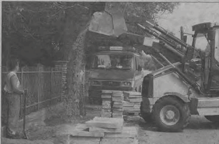
Chodnik w Boczku będzie szerszy i ułożony na nowo, ale z powodu braku pieniędzy nadal będą to płyty chodnikowe, a nie kostka.