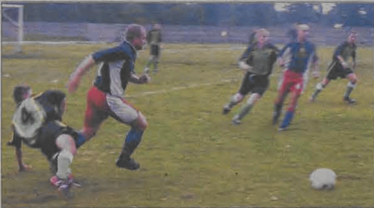
W ostatnim sparingu łowiczanie wygrali z Orkanem 3:2.