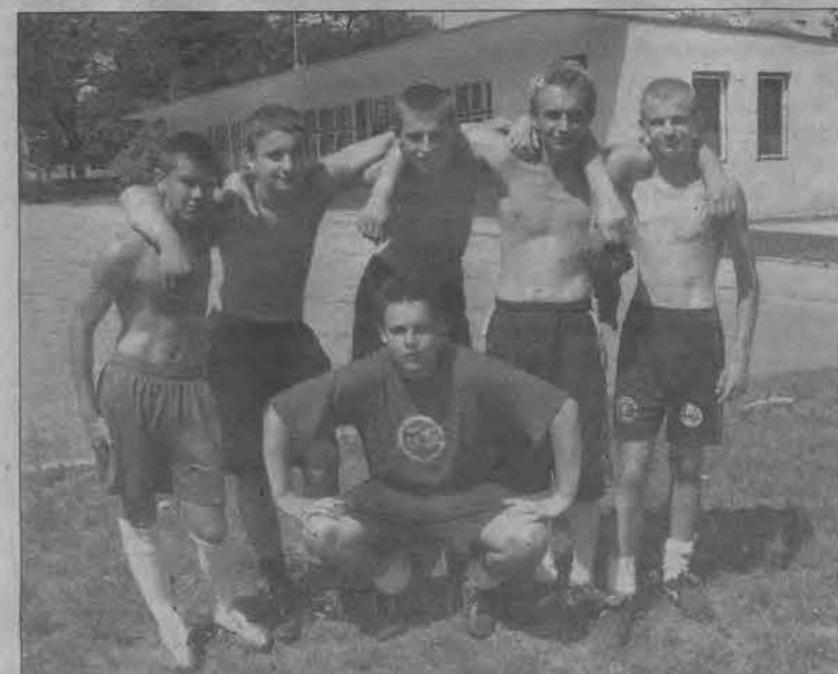
Najlepszą ekipą czwartego turnieju gracze zespołu FC Bambucza.