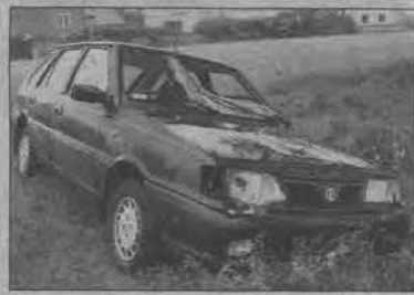
Potrącenie rowerzystki w Róźcach