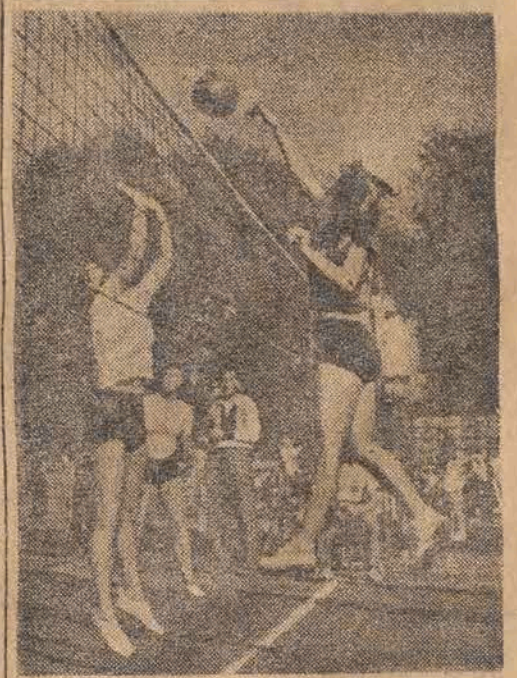
ATAK I BLOKADA

Najliczniejszą z wszystkich jest kolekcja owadów, jedyna w swoim rodzaju na świecie, bo licząca przeszło 7 milionów gatunków, ściągnięta tu niemal ze wszystkich zakątków kuli ziemskiej.