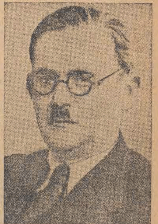
Min. Przemysłu i Handlu tow. Hilary Minca podpisał w Moskwie umowę gospodarczą z ZSRR.

Gomułkę i ministra przemysłu i handlu Hilarego Minca, którzy po powrocie z Moskwy złożyli mu sprawozdanie o wyniku pertraktacji i zawartych umowach gospodarczych między Polską a ZSRR.