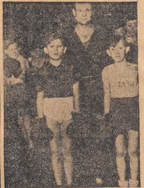
Byli mistrz Europy w wadze lekkiej Polus z dwoma najmłodszymi wychowankami Zrywu

— Jak się przedstawiają najbliższe plany pięściarzy Zrywu?