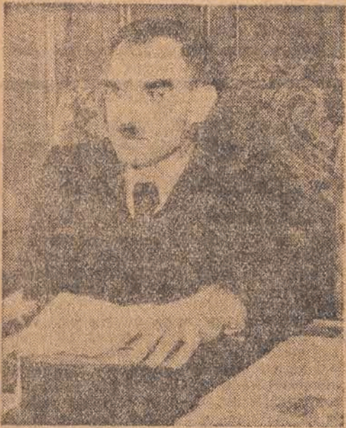
7-go stycznia b. r. minęło dwa lata od daty drugiego Statutowego Zjazdu Stronnictwa Ludowego woj. łódzkiego.

Dwa lata w historii narodu to bardzo mały odcinek, i w tak krótkim okresie zdawałoby się nie można dużo zrobić. Ale tak mówią tylko ludzie, którzy stoją na uboczu i nie dostrzegają czy też nie chcą dostrzec potężnych przemian, jakie się dokonywały w tym tak stosunkowo krótkim czasie.