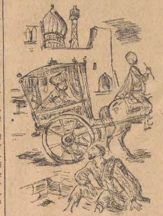
poborca podatków ogotocili mnie doszczętnie i jeszcze miał beczelność opowiadać o rozbójnikach!