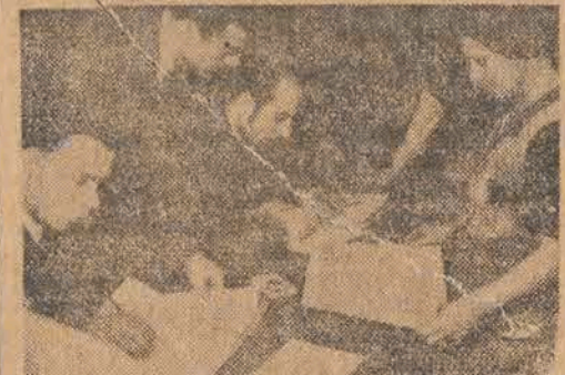
Komisja wyborcza urządza...

Największe kredyty w przemyśle włókienniczym otrzyma przemysł bawełniany. Przewiduje się więc wydatkowanie 45 mil. zł. na przebudowę przedziałni w PZPB Nr 1 (Księża Młyn), której koszt ogólny wyniesie 90 mil. zł. 21.000 wrzecion najnowszego typu zamówiono już zagranicą dla tej przedziałni.