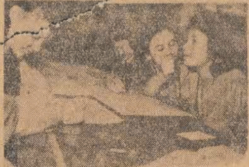
Chwila namysłu. — Trzeba wybrać najlepszych...