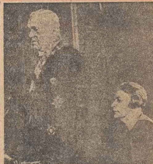
Premier Groza i minister spraw zagranicznych Anna Pauker

W okręgu wyborczym Brasov, w poważnym centrum przemysłowym, z pośród 119.549 wyborców głosowało 108.112. Na listę frontu demokracji ludowej padło 84.109 głosów, na obie listy opozycyjne — około 20 tys. głosów. W jednym z siedmiogrodzkich okręgów wyborczych o poważnym odsetku ludności węgierskiej, na 89.545 wyborców głosowało 86.127. Front demokracji ludowej otrzymał 80.423 głosy, na listę niezależnych 3.914 głosów. Partie opozycyjne w okręgu tym nie wysuwały swych kandydatów.