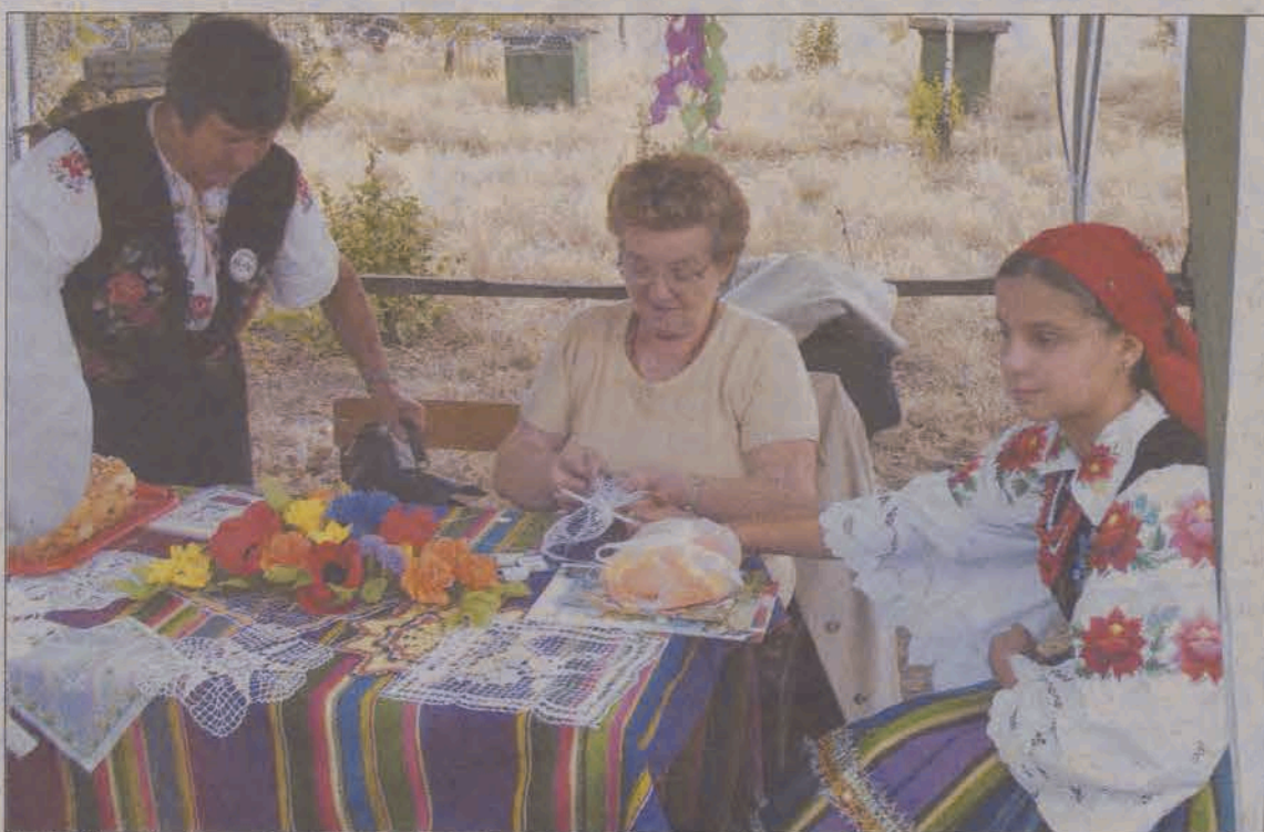
Na każdym kroku można było spotkać się z pięknymi łowiczankami...

Tegoroczna biesiada rozpoczęła się w centrum Łowicza. W sobotę około godziny 13 delegacje z trzech współpracujących ze sobą powiatów: łowickiego, kartuskiego i zakopiańskiego, zespoły folklorystyczne oraz inni goście, zebraли się przed budynkiem starostwa przy ulicy Stanisławskiego. Kolorowy korowód przeszedł ulicami miasta na Stary Rynek, gdzie czekały autobusy, które zawiozły gości do skansenu. Od razu po oficjalnym otwarciu biesiady przez starostę i burmistrza - obydwaj byli w strojach ludowych - wystąpił łowicki Zespół Pieśni i Tańca „Blichowiaczy”. Tym samym był to początek bloku folklorystycznego, w którym zaprezentowały się również zespoły folklorystyczne z zaprzyjaźnionych powiatów. Z ludowych rytmów publiczność wyrwały dziewczęta ze „Zgierskiej Grupy Tancerznej”, które zaprezentowały na scenie w kusych strojach odważny taniec nowoczesny przy muzyce dyskotekowej. Zaraz po występie dziewcząt na scenę wkroczyli prawdziwi mężczyźni z klasy o profilu obronnym z Zespołu Szkół Licealnych w Zdunach. Ubrani w czarne stroje uczniowie dali pokaz zasad obrony przed napastnikami z nożami, pałkami itp. Pokaz zorganizowany został w rytm głośnej muzyki, a odgłosy pola walki „wytwarzał” instruktor ze szkoły w Zdunach, wrzucając w pobliże sceny mini petardy. Pokaz wypadł imponująco. Dziewczęta ze Zgierskiej Grupy Tancerznej od razu po występie chłopaków