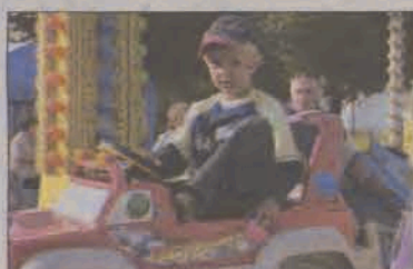
Głównie maluchy okupowały wesołe miasteczko a w nim karuzele.

w kraju wykonująca muzykę „The Beatles”, „The Shadows” oraz „Czerwonych Gitar”. Gwiazdą niedzielnej popołudnia była grupa Classic. Koncert zakończył się po północy.