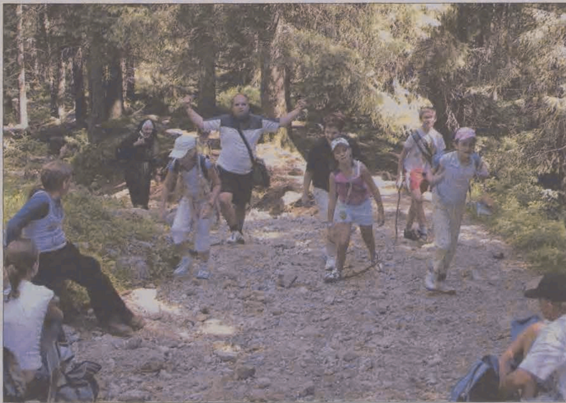
Wejście na Wielki Kopieniec.

W tej niecodziennej wyprawie udział wzięli członkowie działającej przy parafii św. Jakuba scholii, ministranci i ich znajomi