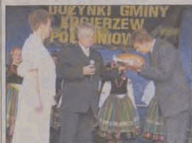
Starostowie dożynek przekazują bochen chleba wójtowi gminy.

Bezpośrednio po trwającej ponad półtorej godziny mszy dziękczynnej, przed kościołem uformował się korowód dożynkowy.