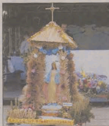
Wieniec dożynkowy z Wierznowic.