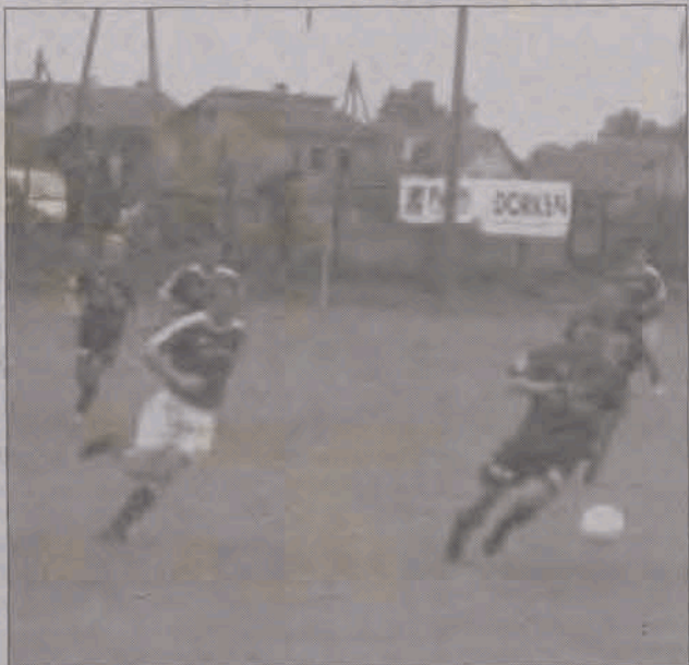
Strykowie nie przestraszyli się lidera i wywalczyli cenny remis.