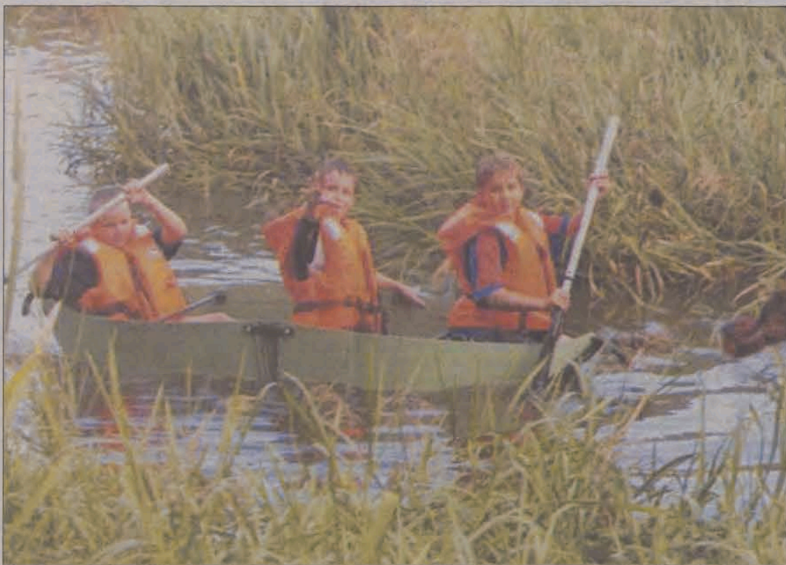
Nawet uczniowie szkół podstawowych radzili sobie sprawnie na spływie.

Wyprawa wzdłuż rzeki Mroźnicy zorganizowana została w ramach programu „Wodny Świat” realizowanego przez harcerzy przy pomocy Wojewódzkiego Funduszu Ochrony Środowiska. Program ten przewiduje szereg warsztatów i szkoleń wprowadzających do tematyki ekologicznej. Realizowane w programie zagadnienia zawierają zakres wiedzy i umiejętności z wielu dziedzin, ze szczególnym nastawieniem na edukację związaną z wodą i jej pochodnymi, które wplecione zostały w formie przystępnej i ciekawą dla uczestników. W ramach tej propozycji dzieci i młodzież okolicznych gmin oraz harcerki i harcerze podejmują działania na rzecz ochrony środowiska oraz uczą się właściwego gospodarowania bogactwem natury.