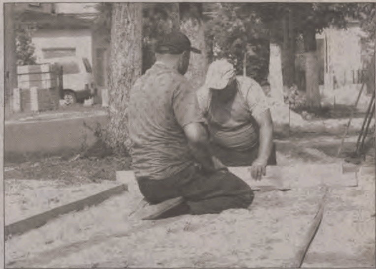
CHODNIK WSPÓLNYMI SIŁAMI. Trwa przekładanie chodnika na ul. Kościuszkę w Strykowie. Przedsięwzięcie wykonywane jest wspólnymi siłami Zarządu Dróg Wojewódzkich z oddziałem w Poddębicach oraz Jednostki Robót Publicznych w Strykowie. Materiał zapewnił ten pierwszy, a robocizną ta druga. Jeszcze w tym tygodniu wojewódzki zarządca drogi ma zamiar wykonać nową nakładkę asfaltową na ul. Kolejowej i wymienić część okrawężnika. (ljs)