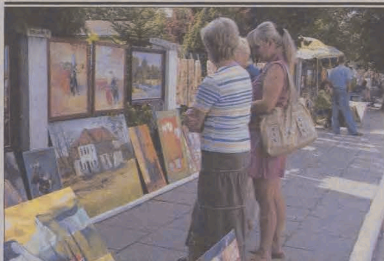
Na ul. Okrzei wystawiali swoje prace ponad dwudziestu artystów z Łodzi, narzekających na niewielką popularność miejsca.

Część rozrywkową dożynek rozpocznie o godz. 16 występ zespołu biesiadnego KALASZNIKÓW. O godz. 17 na scenie pojawi się zespół disco polo AKCENT. Między 18.30 a 21.30 organizatorzy przewidzieli zabawę taneczną, a o godz. 21.30 pokaz tańca z ogniem FIRE-SHOW. Dożynki zakończy dyskoteka prowadzona przez DJ. (ljs)