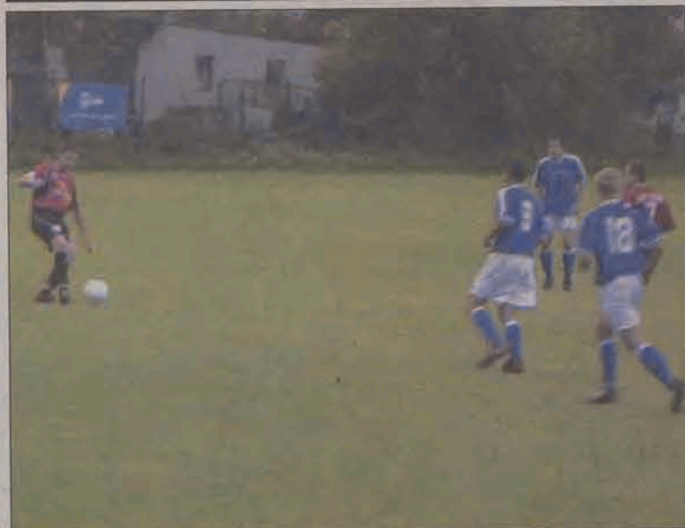
Piłkarze Zjednoczonych Stryków (niebieskie koszulki) sprawili wiele kłopotu liderowi ze Zduńskiej Woli i mało brakowało, a wygrałoby środkowe spotkanie