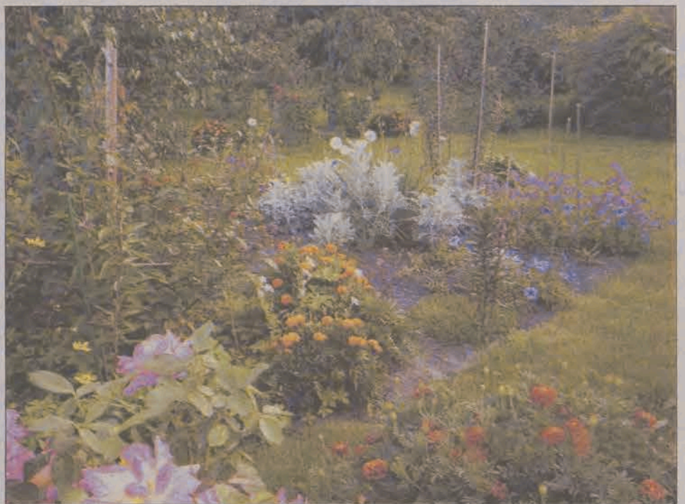
Utrzymanie tak barwnego ogrodu jest ciężką pracą, ale też i dobrą zabawą.