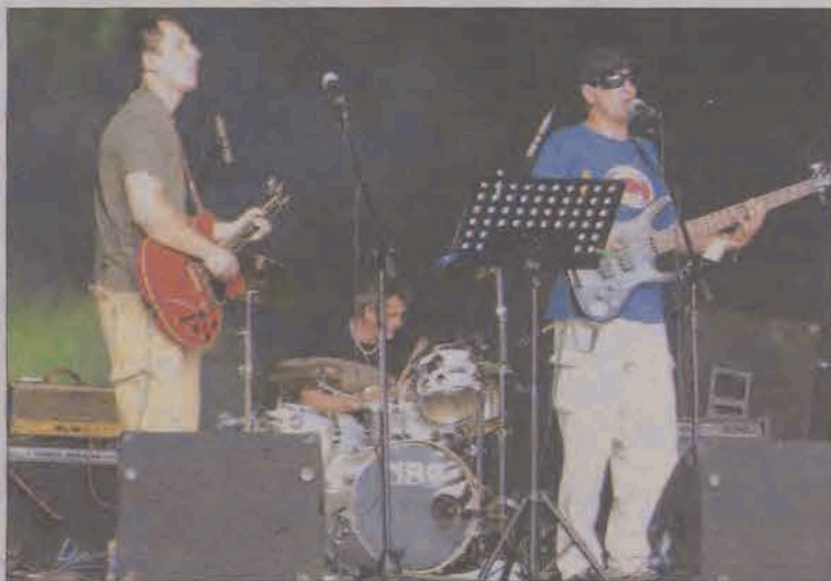
Zespół Format śpiewał covery popularnych utworów.