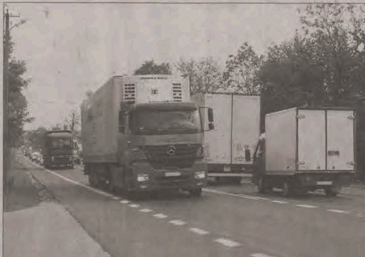
Mieszkańcy Strykowa chcą, aby premier wiedział o ich problemach z tirami i aby na nie reagował.

R easumując - były już dwie petycje do premiera i jedna blokada. Była też obietnica GDDKiA rozwiązania tego problemu w ciągu dwóch lat poprzez wybudowanie dalszego odcinka A-2 do skrzyżowania z A-1 i dalej drogi serwisowej w śladzie A-1, co pozwoliłoby tiram omijać Stryków. Mieszkańcy nie wierzą jednak w obiecane ekspresowe tempo budowy, dla nich nawet dwa lata to zbyt długo. W kolejnym proteście skierowanym do premiera domagają się oni wstrzymania ruchu tranzytowego trasą krajową nr 14 przez Stryków, dostosowa-