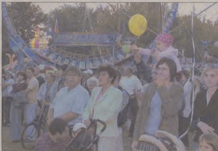
W niedzielę przed letnią sceną nad zalewem zebrały się prawdziwe tłumy. Bawiły się całe rodziny.