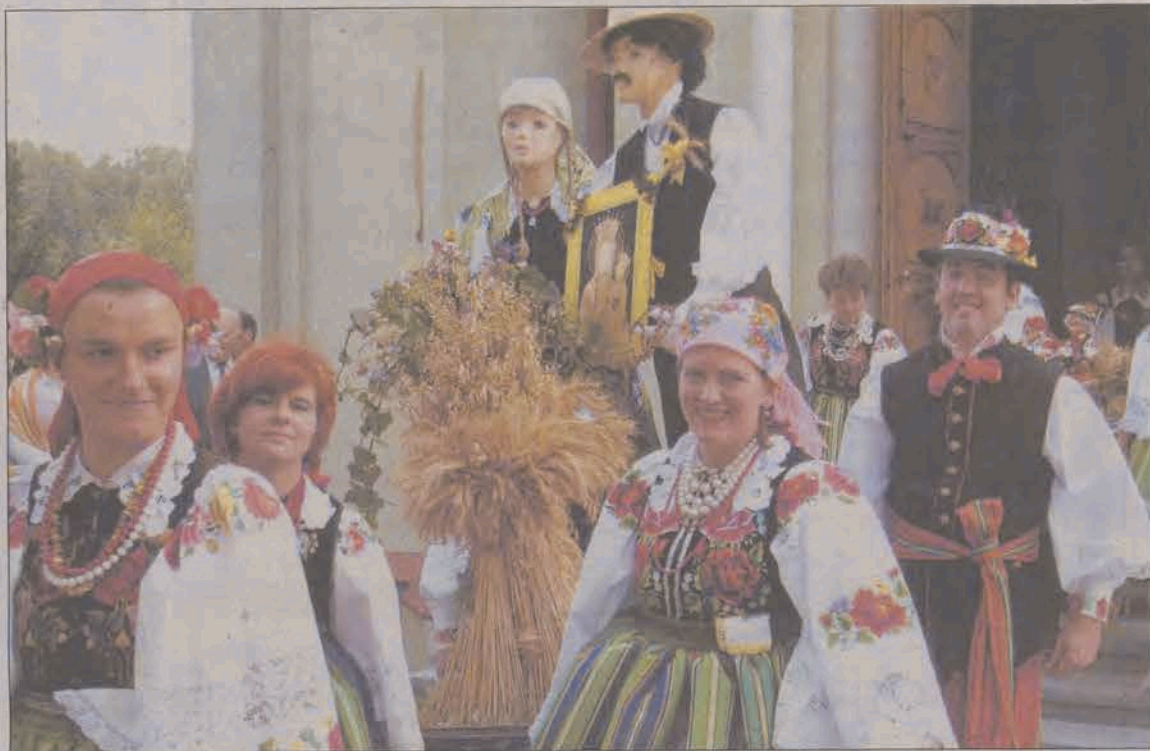
Kolorowa procesja z wieńcami dożynkowymi przeszła z kościoła na plac za OSP.