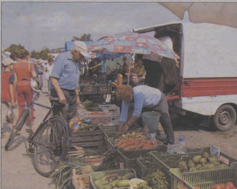
W Łowiczu po owoce i warzywa chodzimy nie na „rynek”, lecz na „targowicę”. Obie formy gramatycznie są poprawne, a najważniejsze - aby kupić warzywa smaczne i świeże - wprost od producenta.

chęć posyłać swoje dzieci. Łowicz, w którym w czerwcu od sprzedawcy na chodniku kupuje się truskawki, w lipcu czereśnie i maliny, a we wrześniu małe, ale jakże słodkie winogrona z przydomowych krzewów.