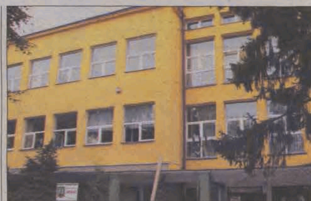
Barwa elewacji i LO zmieniła się na ciepłą piaskowo-żółtą.