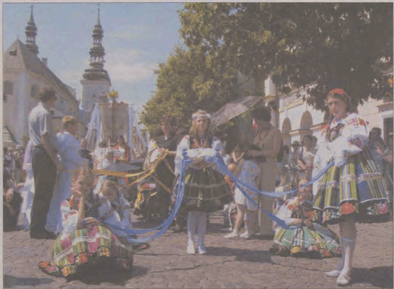
Przywiązanie do tradycji, umiłowanie folkloru - to cechy autentyczne. Rzesze turystów przyjeżdżają do Łowicza w Boże Ciało również dlatego, aby napatrzeć się na nasze pasiaki.