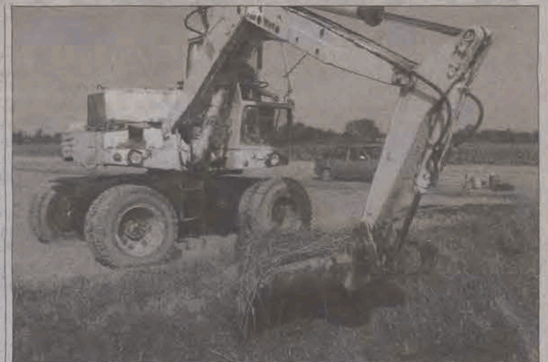
Mechaniczne odmulanie rowu w Woli Zbrożkowej potrwa do końca sierpnia.