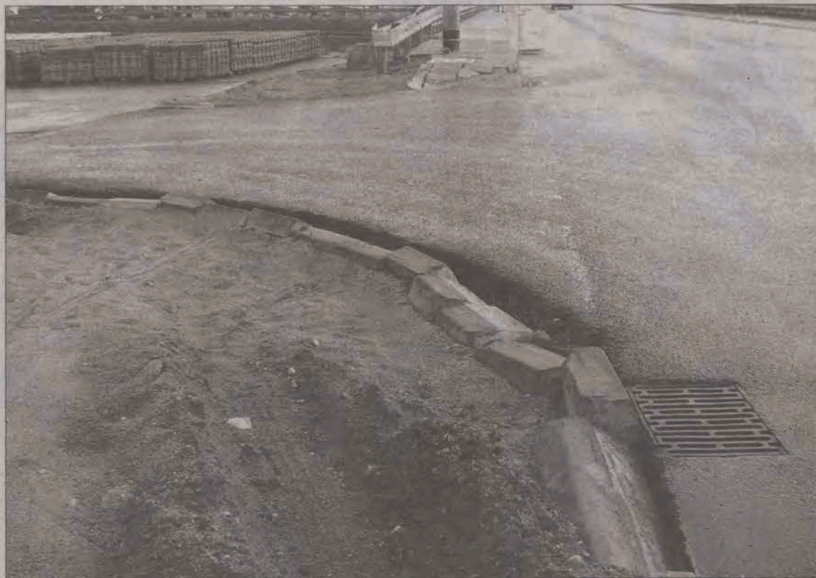
Tak wygląda nowy wjazd na parking przy ul. Warszawskiej.