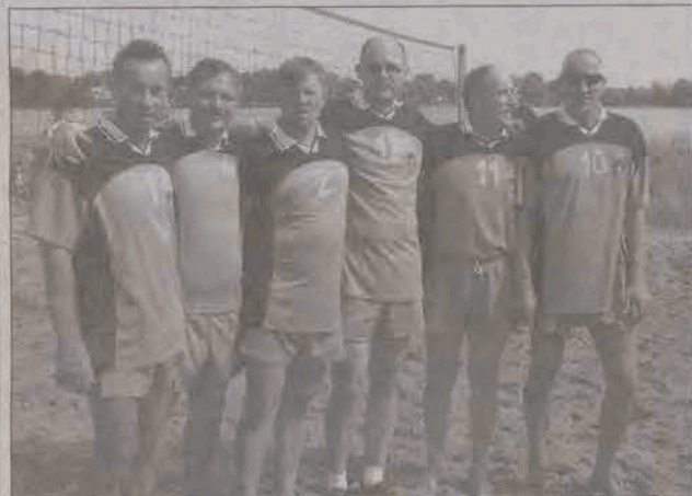
Reprezentacja samorządowców z Głowna okazała się najlepszą drużyną podczas XI Turnieju o Puchar Burmistrza Głowna.