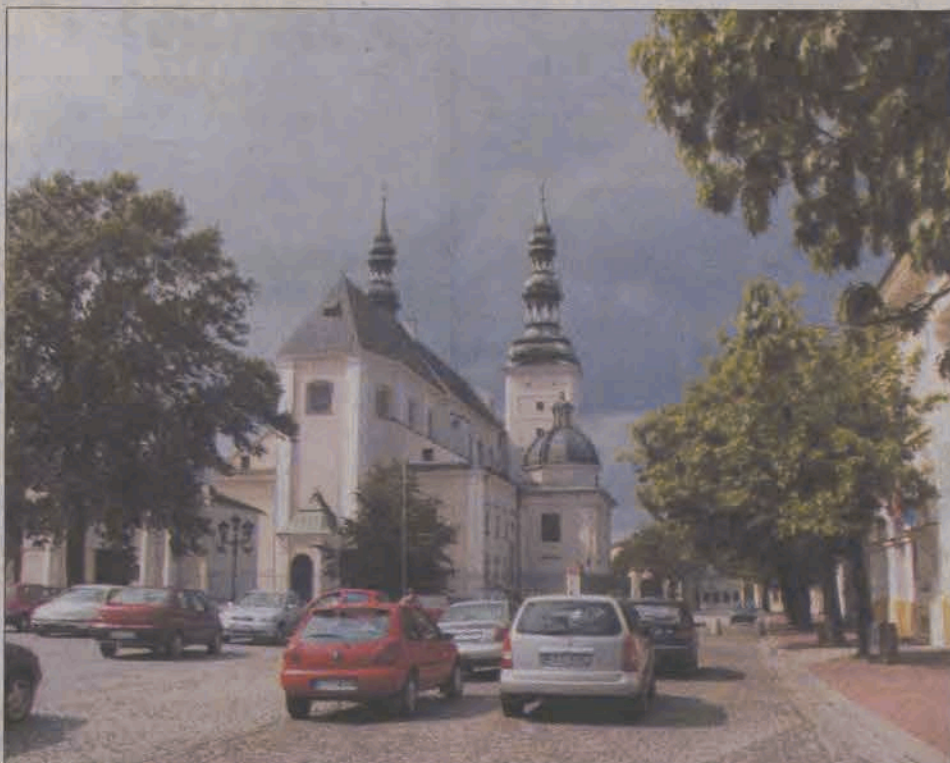
Parkując samochody na Starym Rynku wielu z nas nawet nie pomyśli, że otaczają go zabytki: katedra, ratusz, kamienice, kanonie... Częściej dostrzegają to odwiedzający Łowicz turyści.

Dziwił mnie język. Po raz pierwszy słyszałem, jak żona mówi do swej córki o swym mężu „on”. Usłyszałem, że można być rodziną „do” kogoś, a nie po prostu czyjaś rodzina. Uczylem się, że ksiądz „do ludzi”, to taki, który ich słucha i ma do nich szacunek, a jeśli gdzieś ktoś postawił „galanty” dom, to znaczy, że duży, ładny i zasobny. Że po warzywa chodzi się