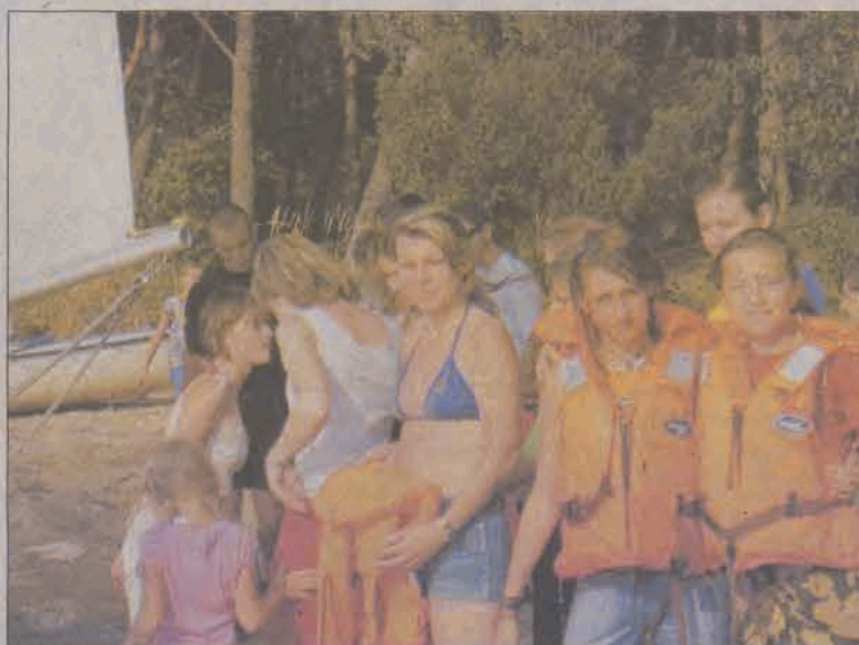
Młodzież z Ukrainy i Litwy wspólnie z głowniejskimi harcerzami zgłębiała tajniki żeglarstwa na obozie w Zarzęcinie.

Podczas wspólnych wakacji młodzież ze Wschodu doskonaliła z głownianami język polski podczas codziennych zajęć obozowych, a młodzież polska poznawała podstawy języka ukraińskiego i litewskiego.