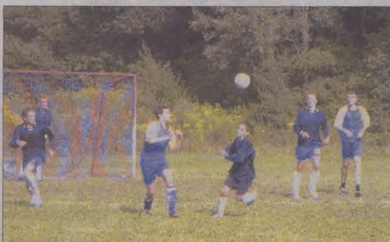
W meczu Victoria I Dobra - Stryków I lepsi okazali się piłkarze z Dobrej, którzy pokonali strykowian 5:1.