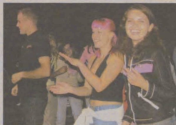
Młodzież bawiła się przy muzyce prezentowanej przez DJ-ów.