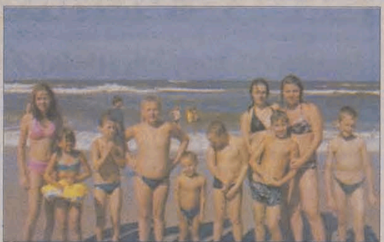
W pamięci obozowiczów na długo pozostaną codzienne kąpiele w Bałtyku.