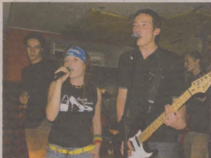
Dziańina zagrała zarówno w piątek jak i w sobotę. Wypadli świetnie.

Już rankiem organizatorzy zabrali się za sprzątanie placu. Uczestniczyła w tym społecznie łyszkowicka młodzież, której dyrektor GOK chce za to, jak i za wcześniejsze rozwieszanie plakatów serdecznie podziękować. (wcz)