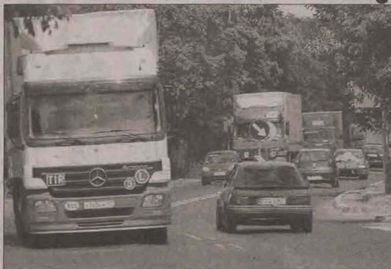
Według opinii mieszkańców natężenie ruchu w Strykowie wzrosło trzykrotnie.