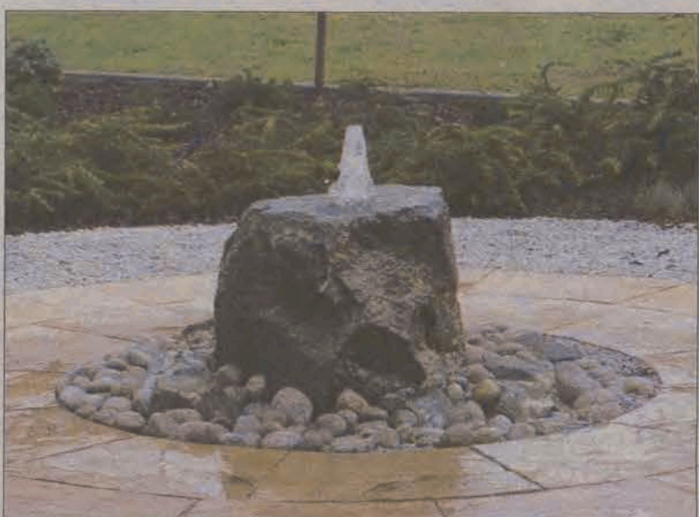
Już można podziwiać tryskające źródło przy siedzibie Banku Spółdzielczego w Głownie. Ten, kto spodziewał się tryskającej w niebo fontanny, zawiedzie się. Z głazu o zielonym zabarwieniu woda wydobywa się na wysokość zaledwie kilkudziesięciu centymetrów. Pojawiły się też nowe nasadzenia. Dopelnieniem całości aranżacji będzie oświetlenie. (rpm)