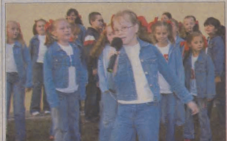
Atrakcją wieczoru był występ Bąkowskiej Barki.

Wycieczki organizowane będą zresztą także w przyszłości. Dla bezpieczeństwa uczestników, którzy przechodzą często na drugą stronę ulicy, organizatorzy chcą w przyszłości oznaczyć maszerującą grupę proporcem. Byłby to proporzec osiedla Starzyńskiego. Jego projekt zostanie jednak dopiero opracowany. (wcz)