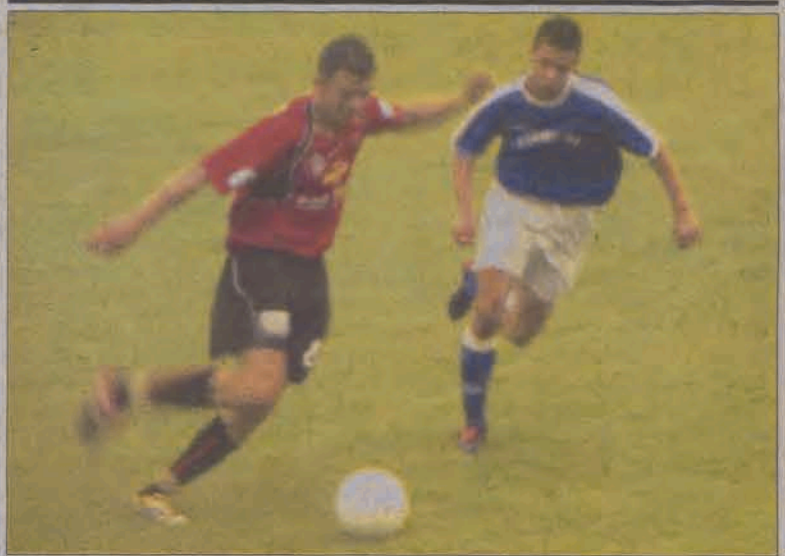
Nikt nie przypuszczał, że Zjednoczeni ulegną Sokolowi aż tak wysoko.

Po nazwie drużyny podano: w nawiasie miejsce po poprzedniej kolejce, ilość meczów, punkty, stosunek bramek, ilość zwycięstw, remisów i porażek oraz ilość meczów, punktów i stosunek bramek w meczach u siebie i na wyjazdach. Mistrz awansuje do II ligi, wicemistrz rozgrywa mecz barażowy, a III ligę opuści co najmniej jeden - ostatni zespół (w wypadku awansu dwóch zespołów do II ligi).