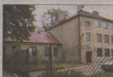
To co było gminne, przejdzie w ręce prywatne.

Już niebawem Dom Nauczyciela w Koźlu stanie się własnością prywatną. Gmina Stryków zaproponowała jego obecnym najemcom sprzedaż mieszkań na zasadach pierwokupu. Siedem rodzin mieszkających pod adresem Koźle 55 po przemyśleniu sprawy przystało na tę propozycję.