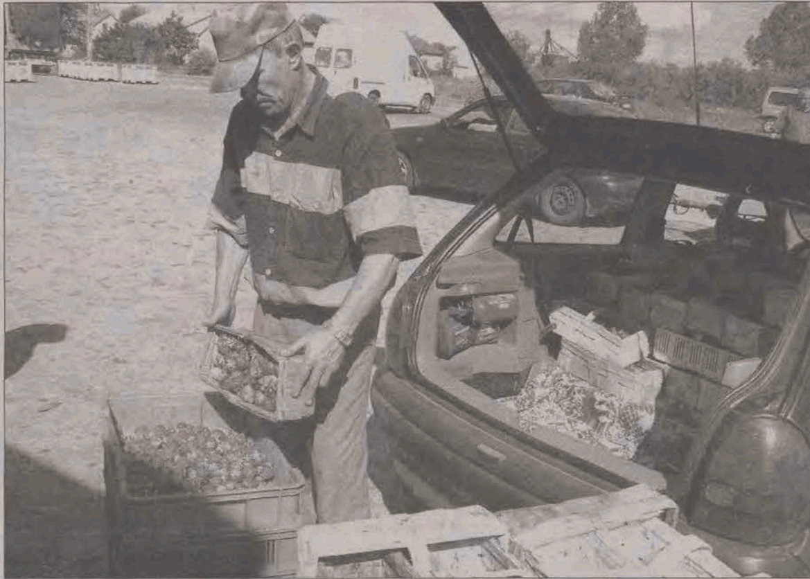
Na giełdzie truskawkowej w Sannikach handlujących i sprzedających było wielu, zarówno w tym tygodniu, jak i w ubiegłym.

- Ogórki zbierali u nas sami wykształceni ludzie - lekarz w stopniu pułkownika, człowiek który wcześniej prowadził renowację ołtarzy w cerkwiach, policjant, muzycy po konserwatorium - opowiada o pracujących w Polsce na czarno Ukraińcach rolnik z jednej z wsi powiatu łowickiego. - Jedna Ukrainka potrafiła zebrać dziennie nawet 190 lubianek truskawek, a zdarzało się, że leniwa Polka ledwie 15. Dzisiaj Ukraińcy prawie tu nie docierają, a Polacy nie nadają się do tej roboty. Coś się w końcu w tej sprawie zmieni? - pyta nas rolnik z nadzieją w oczach.