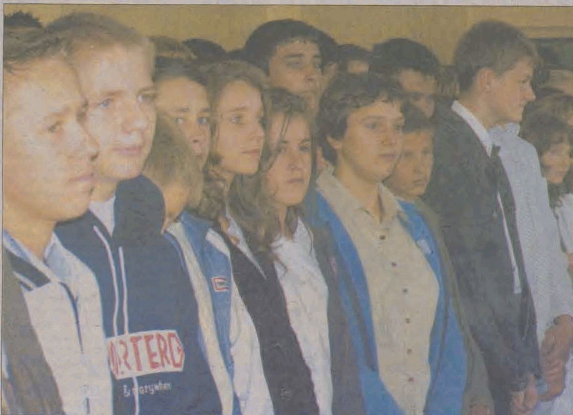
Barwy bieli i granatu nie są już rygorystycznie przestrzegane na uroczystościach szkolnych, do mundurków uczniom byłoby się chyba trudno przyzwyczaić.