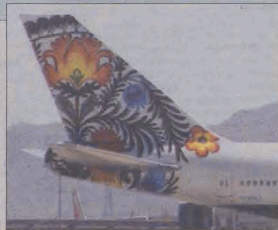
Pionowy statecznik samolotu wymalowany w tak bliższe nam wzory.

jak dawniej, powiedzieć pilotowi przez radio, by np. kierował się w ślad za samolotem British Airways, bo te wyglądały co rusz to inaczej. Swoją dezaprobatę dla malowideł z całego świata na ogonach brytyjskich samolotów dała wyraz podczas konferencji Partii Konserwatywnej w 1997 roku była premier Margaret Thatcher, zakrywając ogon modelu takiego samolotu własną chusteczką do nosa. Twierdziła ona, że samoloty w takich barwach wyglądają