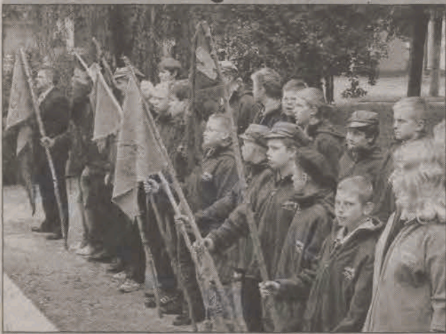
Na uroczystościach patriotycznych nie mogło zabraknąć głowieńskich harcerzy.

Jesienna aura towarzyszyła uczestnikom obchodów 67. rocznicy wybuchu II wojny światowej, jakie odbyły się w miniony piątek, 1 września w Głównie. Wiatr, pochmurne niebo w takiej scenarii przedstawiciele lokalnych władz, instytucji i organizacji, przy śladowym zaledwie udziale mieszkańców miasta, uczuli pamięć poległych, gromadząc się przed Pomnikiem Wolności. Po przemówieniu burmistrza złożono kwiaty pod tablicami pamięci przy kościele św. Jakuba, potem została tam odprawiona msza święta. Po niej na cmentarzu parafialnym złożono kwiaty i zapalono znicze przy miejscach pamięci poległych za Ojczyznę. (rpm)