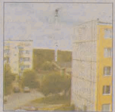
Do końca września ten komin kotłowni na osiedlu Kopernika zastąpiony zostanie zupełnie nowym.