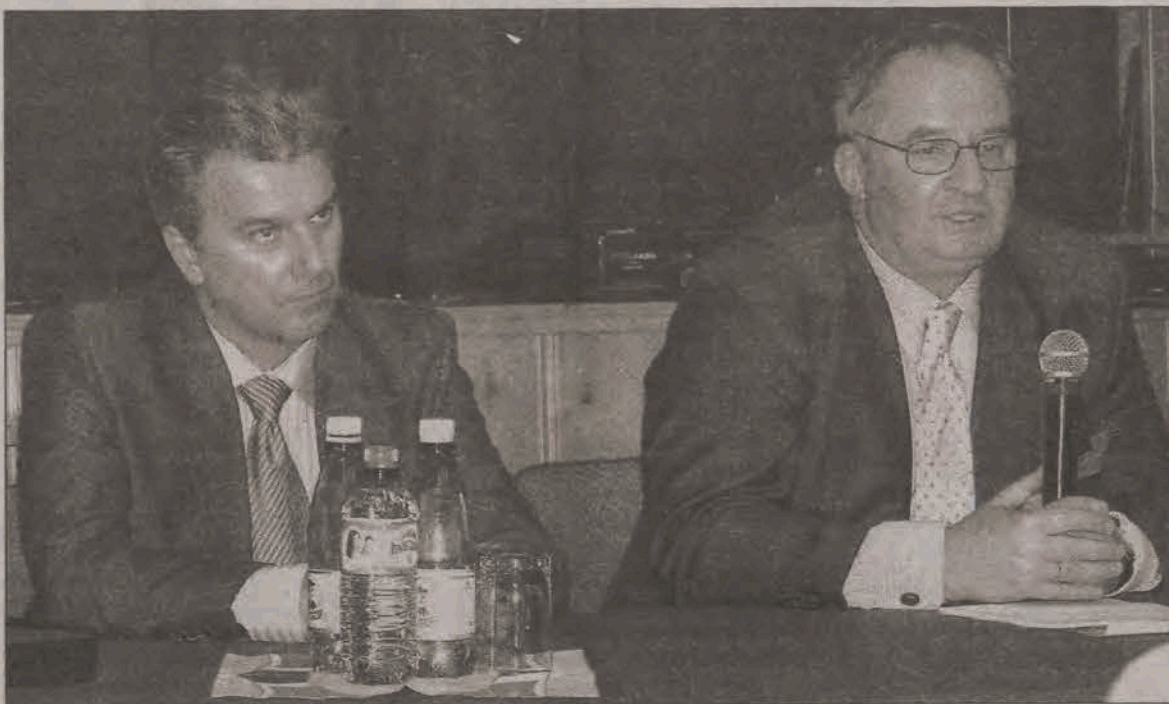
Podczas sobotniego spotkania ze strykowianami europoseł Jacek Saryusz Wolski (z prawej) i poseł Cezary Grabarczyk (z lewej).