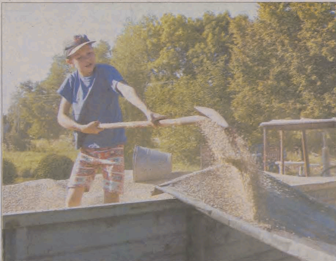
W gospodarstwach w Łowickim dzieci uczą się pracowitości od małego.

Oglądając w muzeum hafty, narzędzia, sprzęt domowy, widzimy, że tego nie mogła zrobić ręka niezdolna. Także dziś otwierane są sklepy, każdy czynny na terenie tego miasta się zajmuje. Podobnie na wsi, rolnicy potrafią dokonywać zmian. Nie ma sytuacji, że ktoś trzyma się przez kilkanaście lat dziedziny, która nie przynosi mu zysków. Rolnicy potrafią dostosować się do tego, co niesie im życie.