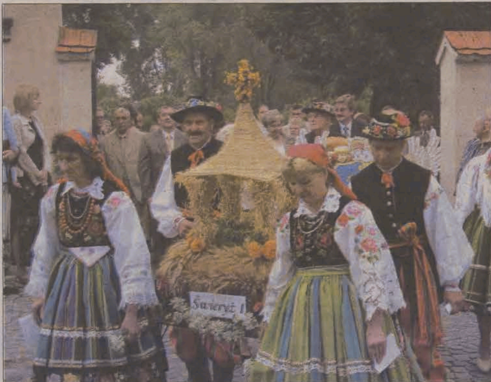
Poświęcone wieńce, w barwnej procesji zaniesiono do kościoła katedralnego