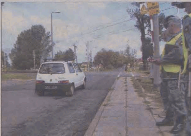
W ostatni czwartek kontrolowany był przejazd kolejowy przy ulicy Seminaryjnej.

„Kiedy widzę samochód, który wtargnął na przejazd, mogę tylko włączyć hamulec i patrzeć jak ginie człowiek” - takie wyznanie maszynisty pociągu znaleźć możemy w ulotce, wydanej przez Polskie Koleje Państwowe w ramach akcji „Bezpieczny przejazd zależy także od Ciebie”.