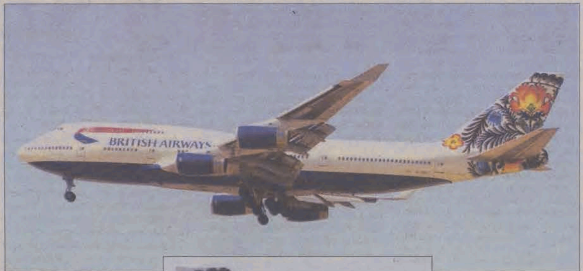
Łowicki kogucik British Airways w locie.

Barwne ogony mogły się podobać, ale przysparzały kłopotów kontrolerom ruchu lotniczego, którzy nie byli w stanie