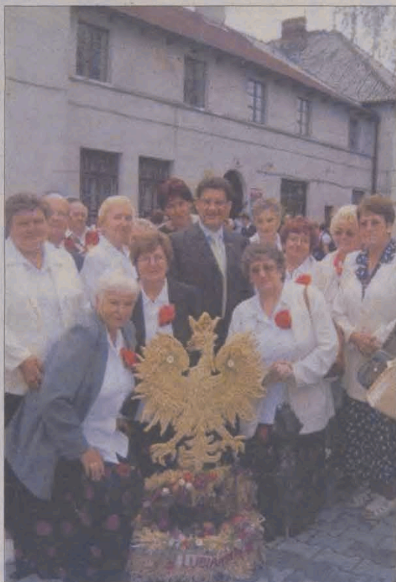
„CZEREMCHA” OBŚPIEWAŁA BURMISTRZA. W minioną niedzielę, 3 września w Luśmierzu w gminie Ozorków odbyły się Dożynki Powiatowe, podczas których święto plonów uczcili przedstawiciele miast i gmin wchodzących w skład powiatu zgierskiego. Na zdjęciu burmistrz Głowna z wieńcem dożynkowym, który otrzymał od Koła Gospodyń Wiejskich z Lubiankowa. Burmistrza obśpiewała głowieńska „Czeremcha”. Wieniec dożynkowy dla wójta gminy Głowno przygotowało natomiast KGW z Mąkolc, zaś dla burmistrza miasta i gminy Stryków - KGW z Rokitnicy. KGW z Lipki w gminie Stryków wręczyło wieniec dożynkowy marszałkowi województwa.

kus” z reprezentacją Urzędu Miejskiego w Głownie. Oficjalne otwarcie imprezy zaplanowano na 15. O tej godzinie rozpoczyna się ponadto rodzinne turnieje sportowe. Przed 16.00 na scenie pojawi się zespół Blow z Głowna, a po nim zagości na niej Krzysztof Cwynar, Anna Pietrzak oraz zespół „Patria”. Na 18.30 zaplanowano, również na placu przy „Mroźycze”, projekcję filmu „Wszyscy jesteśmy Chrystusami”. Impreza zakończy się około godziny 20.00.