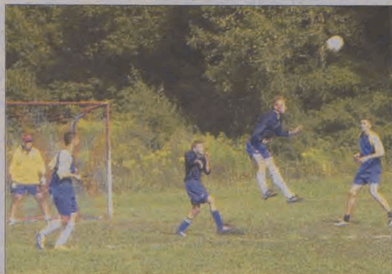
Podczas Turnieju Szóstek Piłkarskich na boisku w Dobieszku rywalizowało około stu zawodników z gminy Stryków.