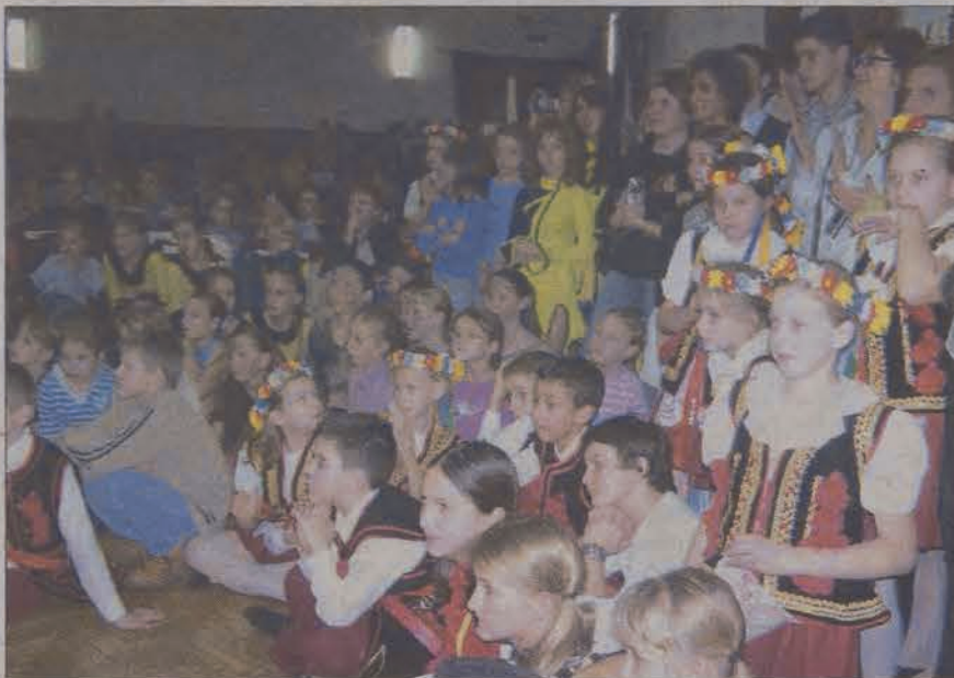
W sali widowiskowej MOK zebrało się około 500 osób.

po raz ostatni tancerze i instruktorzy spotykają się w ośrodku kultury. W przyszłym roku przegląd odbędzie się już w nowej hali sportowej, głównie ze względu na coraz większą liczbę uczestników. W ośrodku przy Kopernika pomieścili się tylko blisko związani z zespołami kibice, dla szerszej publiczności zabrakło już miejsc. Z uwagi na liczebność samych zespołów, występowały one na parkiecie pod sceną, gdzie jest więcej miejsca niż na samej scenie, która zamieniła się w wygodne miejsce do obserwacji popisów tanecznych. Równie dużą popularnością cieszyły się miejsca na balkonie.