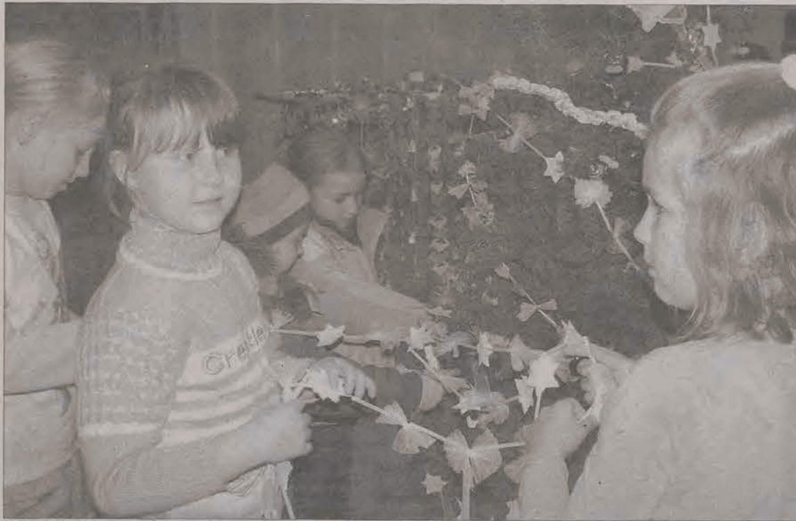
Najwięcej radości sprawiło dzieciom ubieranie choinki we własnoręcznie wykonane łańcuchy.