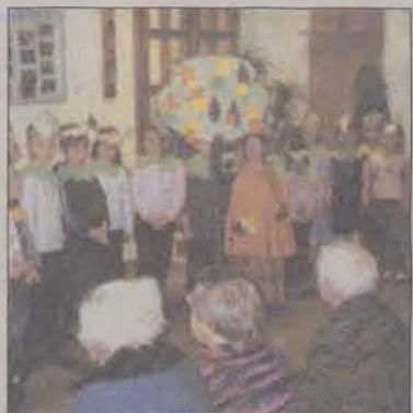
Pensionariusze DPS w Głownie zastępczani w jesienne opowieści przedszkolaków.