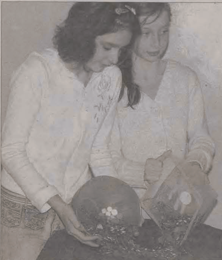
Wszystkie grosze trzeba było dokładnie policzyć.