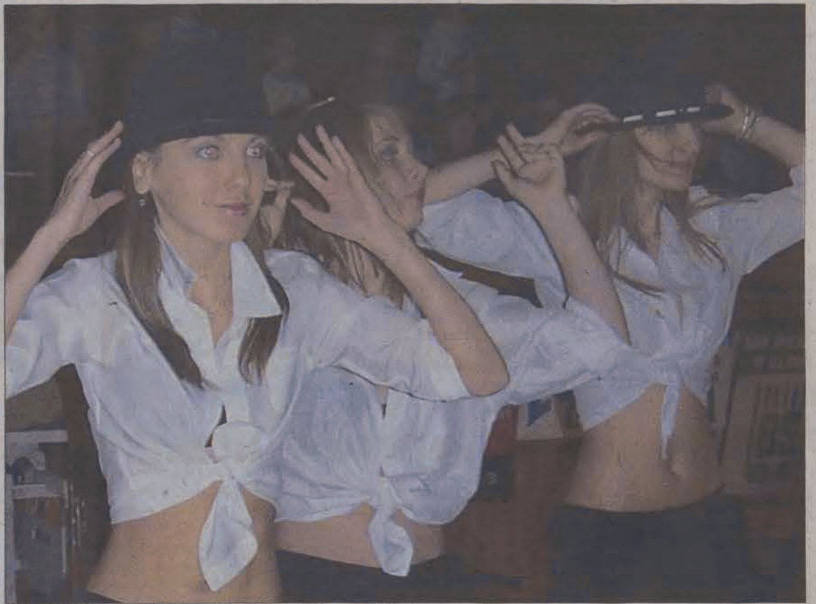
„Stand by Me” w wykonaniu zespołu Perfektus z Pabianic.

- Dla zespołów początkujących taki konkurs jest niemal jedynym, podczas którego mogą się pokazać i być może jeszcze zdobyć jakieś miejsce. Łódzkie Konfrontacje zostały opanowane już przez zawo-