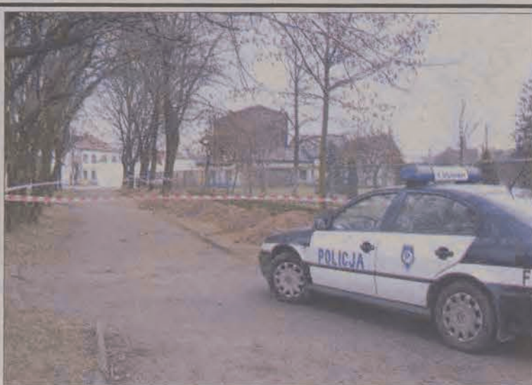
Prace w parku zostały wstrzymane, teren zabezpieczyła policja.

Jak na razie, 30 miejsc w pojeździe zaspokajają potrzeby pasażerów. Na niektórych kursach, zwłaszcza rannych w dni targowe, pojazd jest zapełniony, ale jeszcze nie zdarzyło się, aby ktoś został na przystanku. W godzinach południowych, gdy z komunikacji miejskiej korzysta znikoma liczba głownian, doskonale sprawdza się taki niewielki pojazd. (eb)