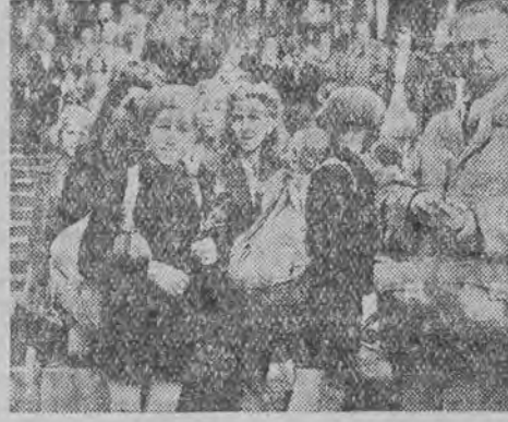
Dzieci polskie z Berlina przyjechały do Łodzi, aby spędzić wakacje wśród swoich. W Łodzi witane były serdecznie przez dzieci łódzkie.