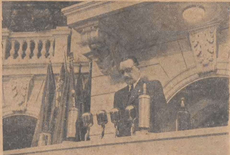
Towarzysz BOLESŁAW BIERUT wygłasza referat ideologiczny na I Kongresie Polskiej Zjednoczonej Partii Robotniczej.

Dowództwo Czang-Kai-Szeka ściąga z południa do Nankinu wszelkie rozporządzone posiłki i fortyfikuje miasto.