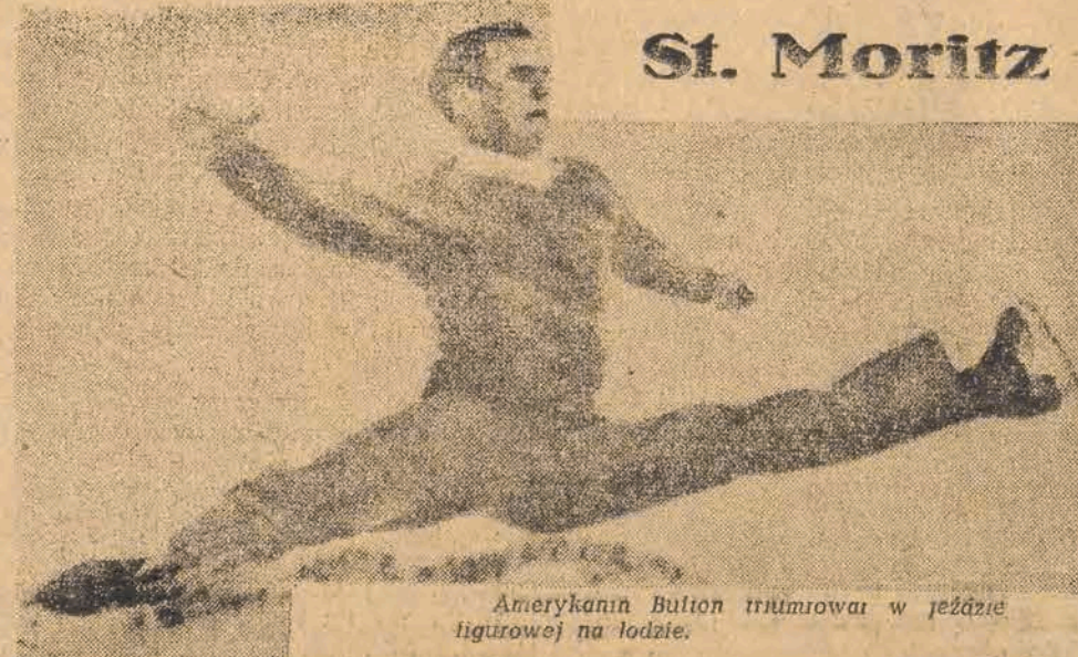
Amerikanin Bulton triumfował w jeździe tigurowej na lodzie.

Kanada zdobyła tytuł mistrza olimpijskiego w hokeju, mając równą ilość punktów z Czechosłowacją, przewyższając ją jednak stosunkiem bramek.