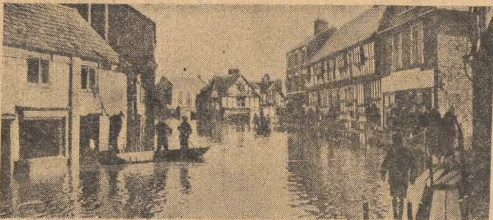
No skutek długotrwałych deszczów szereg rzek w Anglii wystąpiło z brzegów. Szczególnie silnie wylała rzeka Severn w hrabstwie Shrewsbury i Worcester. Na fl. — miasto Shrewsbury pod wodą.