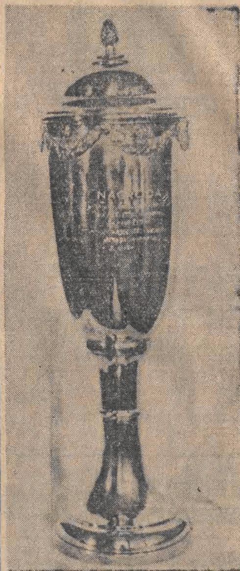
Puchar „Głosu Robotniczego” dla pierwszego łodzianina na mecie pierwszego etapu wyścigu Warszawa — Praga

Specjalnym sprawozdawcą „Głosu Robotniczego” z wyścigu Warszawa — Praga będzie red. Zd. Królewski.