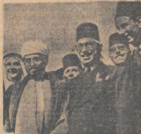
Gen. Ismail Saifal — wychowanek brytyjskiej akademii wojskowej — szef sztabu króla Abdullaha — kieruje obecnie akcją wojkową w Palestynie za pieniądze Bevina.