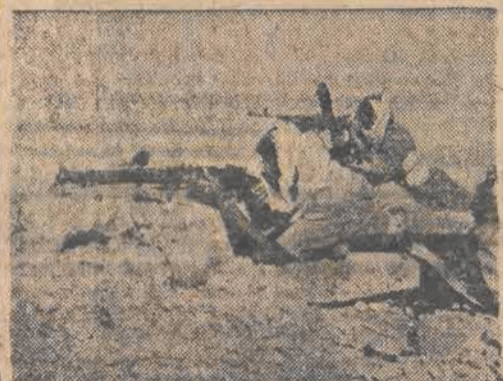
Na pograniczu Transjordanii.

LONDYN (PAP). — Specjalny korespondent Reutera, akredytowany przy sztabie generalnym armii arabskiej w Damaszku, podaje, że do Transjordanii przybyła zmotoryzowana Brygada z Iraku. Brygada ta kończy przygotowania do podjęcia marszu na Palestynę. Oficerowie sztabu generalnego armii arabskiej podają, że w najbliższym czasie rozpocznie się inwazja na Palestynę. Termin inwazji został ustalony na ostatniej konferencji w Amman.