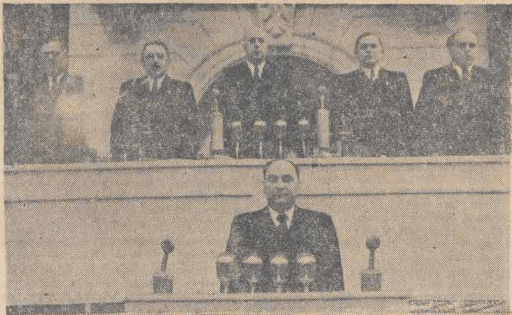
Tow. Ponomarenko wita I-szy Kongres Polskiej Zjednoczonej Partii Robotniczej i delegatów Partii Komunistycznej ZSRR.