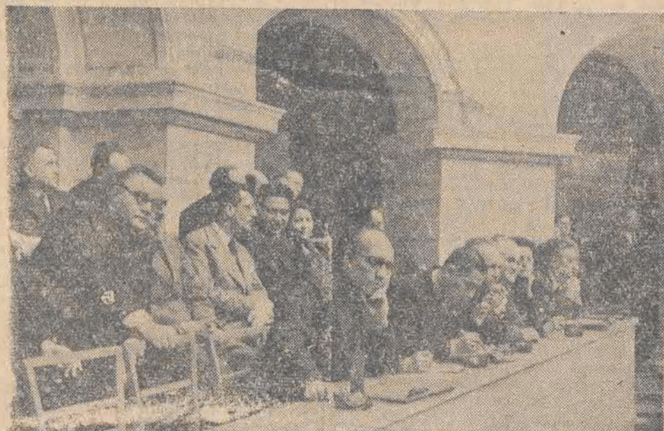
Delegaci partii komunistycznych i robotniczych z całego świata biorą udział w 12 Kongresie w charakterze gości.