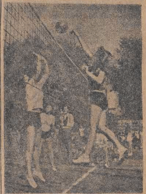
ATAK I BLOKADA

Wśród przebogatej kolekcji ptaków, liczącej ponad 20 tys. gatunków, znajdują się rzadkie okazy ptaków rajskich, które przywieźli podróżnicy rosyjscy z Nowej Gwinei. Najliczniejszą z wszystkich jest kolekcja owadów, jedyna w swoim rodzaju na świecie, bo licząca przeszło 7 milionów gatunków, ściągająca tu niemal ze wszystkich zakątków kuli ziemskiej.