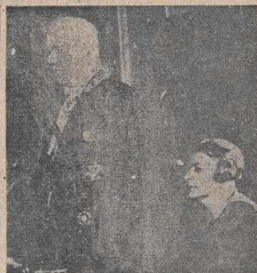
Premier Groza i minister spraw zagranicznych Anna Pauker

W okręgu wyborczym Brasov, w poważnym centrum przemysłowym, z pośród 119.549 wyborców głosowało 108.112. Na listę frontu demokracji ludowej padło 84.109 głosów, na obie listy opozycyjne — około 20 tys. głosów. W jednym z siedmiogrodzkich okręgów wyborczych o poważnym odsetku ludności węgierskiej, na 89.545 wyborców głosowało 86.127. Front demokracji ludowej otrzymał 80.423 głosy, na listę niezależnych 3.914 głosów. Partie opozycyjne w okręgu tym nie wysuwały swych kandydatów.