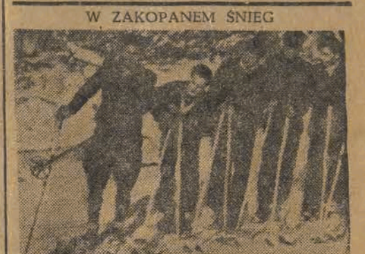
W Zakopanem odbył się sztafetowy bieg narciarski 4 razy 10 km o mistrzostwo Polski. Zwyciężyła drużyna „Wisły“ (Zakopane) w czasie 3:13,20