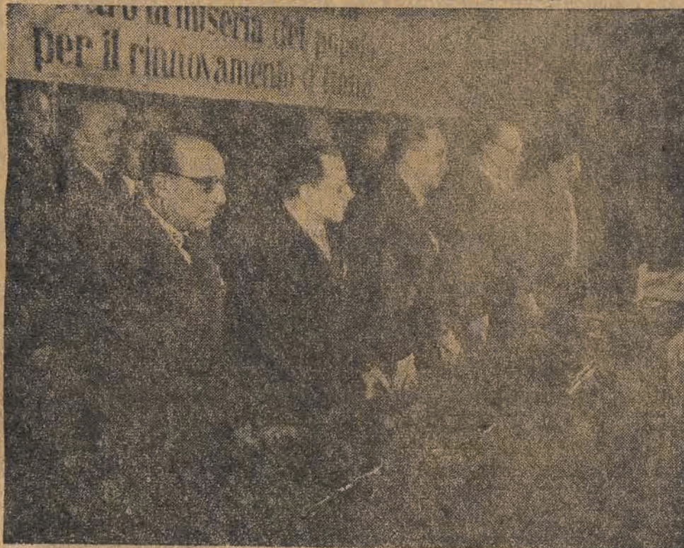
Prezydium Kongresu Włoskiej Partii Komunistycznej w Mediolanie — z tow. Palmiro Togliatti na czele — drugi od prawej.