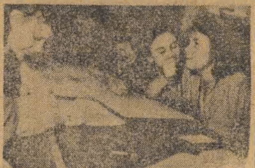
Chwila namysłu. — Trzeba wybrać najlepszych...