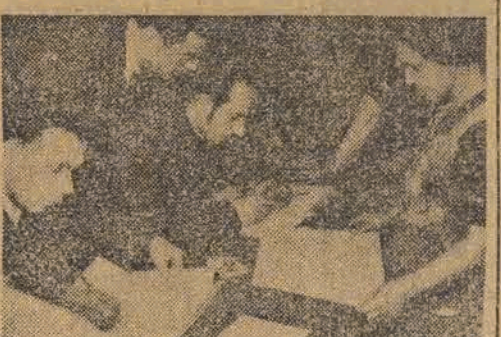
Komisja wyborcza urządza...

Największe kredyty w przemyśle włókienniczym otrzyma przemysł bawełniany. Przewiduje się więc wydatkowanie 45 mil. zł. na przebudowę przedziałni w PZPB Nr 1 (Księży Młyn), której koszt ogólny wyniesie 90 mil. zł. 21.000 wrzecion najnowszego typu zamówiono już zagranicą dla tej przedziałni.