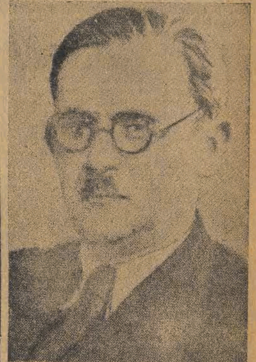
Min. Przemysłu i Handlu tow. Hilary Minc podpisał w Moskwie umowę gospodarczą z ZSRR.

Gomułkę i ministra przemysłu i handlu Hilarego Mince, którzy po powrocie z Moskwy złożyli mu sprawozdanie o wyniku pertraktacji i zawartych umowach gospodarczych między Polską a ZSRR.