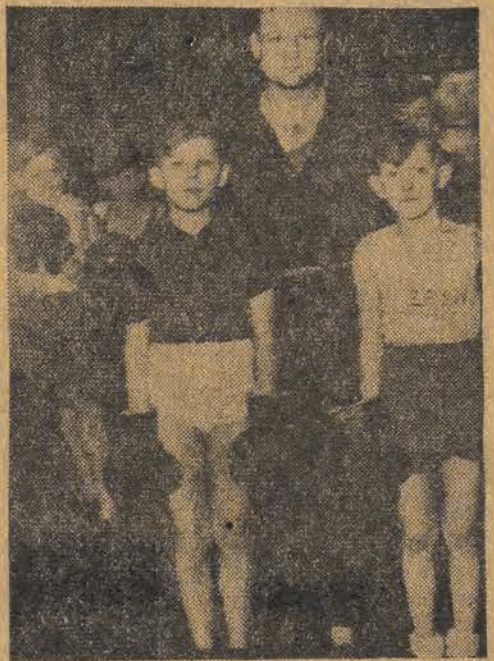
Były mistrz Europy w wadze lekkiej Polus z dwoma najmłodszymi wychowankami Zrywu

— Jak się przedstawiają najbliższe plany pięściarzy Zrywu?