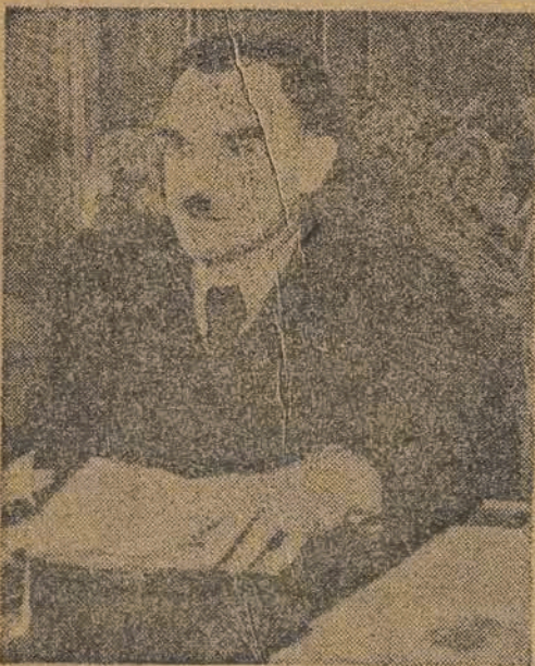
7-go stycznia b. r. minęło dwa lata od daty drugiego Statutowego Zjazdu Stronnictwa Ludowego woj. łódzkiego.

Dwa lata w historii narodu to bardzo mały odcinek, i w tak krótkim okresie zdawałoby się nie można dużo zrobić. Ale tak mówią tylko ludzie, którzy stoją na uboczu i nie dostrzegają czy też nie chcą dostrzec potrzebnych przemian, jakie się dokonywały w tym tak stosunkowo krótkim czasie.