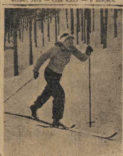
ZOJA BOŁOTOWA czołowa narciarka Związku Radzieckiego

we wszystkich Oddziałach Robotniczej Spółdzielni Wydawniczej „PRASA”