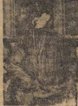
Jan Gawliński spinacz na stacji Bydgoszcz Główna

nia których można było mieć poważne wątpliwości. Do 1 stycznia 1948 roku w „szpitalu” tym wyremontowano kompletnie aż 700 parowozów (naprawa główna i średnia), 929 wagonów osobowych, odbudowano 429 wagonów towarowych i podano rewizji prawie 5 tysięcy.