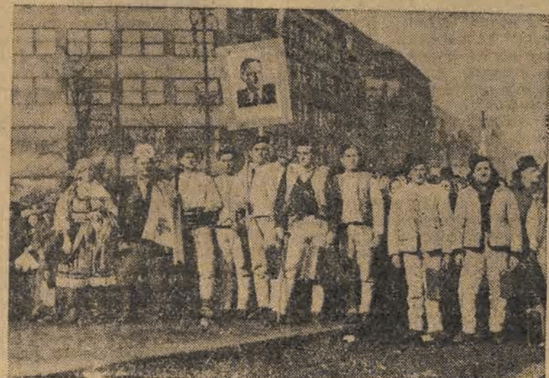
Manifestacja rolników w Pradze w dniu 29 lutego br.

JEDNYM z najbardziej jaskrawych i pouczających przykładów pod tym względem jest działalność dra Drtiny w charakterze ministra sprawiedliwości. Stale i systematycznie uprawiał on politykę „oszczędzania” reakcjonistów, szpiegów i kolaborantów i — należy przyznać — czynił to, niestety, z dużym powodzeniem.