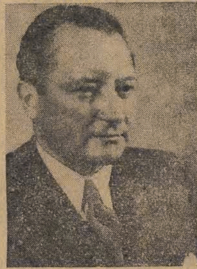
Vlado Clementis wiceminister spraw zagr. Czechosłowacji

Przypomnę tutaj fakt następujący: W grudniu 1943 r. podczas pobytu prezydenta Beneša w Moskwie została podpisana umowa sojusznicza między Czechosłowacją i ZSRR. W tym samym czasie w Słowacji zebrał się działający podziemny ruch o poporze w celu stworzenia Słowackiej Rady Narodowej, tej właśnie Rady, która przygotowała i prowadziła w 1944 r. masowe powstanie narodu słowackiego. Na oowym zebraniu przyjęto program walki o wyzwolenie, ustalono główne wytyczne budownictwa nowego naszego państwa. Pierwszym punktem tego programu była, oczywiście odbudowa Republiki Czechosłowackiej, jako państwa dwóch równouprawnionych narodów, Czechów i Słowaków; drugi punkt natomiast stwierdza, że nowa republika ma zawrzeć trwały i nierozdzielny sojusz polityczny i wojskowy ze Związkiem Radzieckim. Następnym punktem programu było