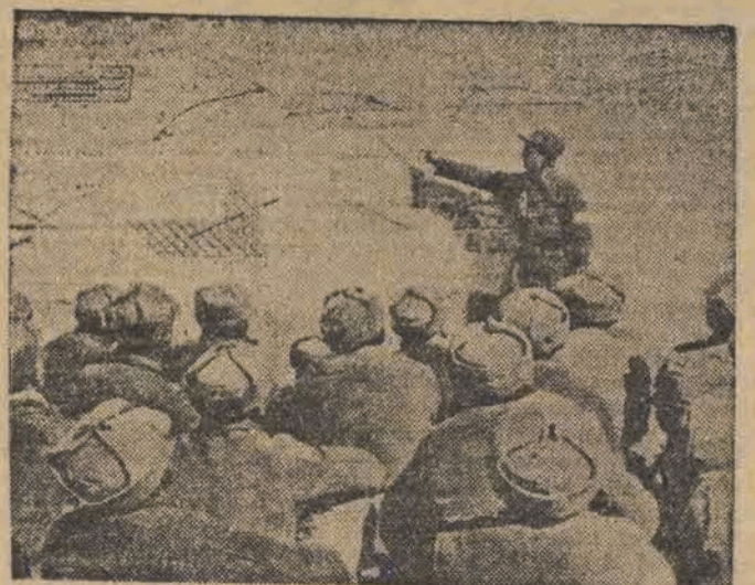
Żołnierze Chińskiej Armii Ludowej w czasie lekcji w przerwie działań wojennych.