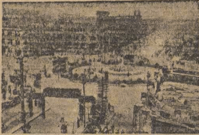
Nankin — stolica Chin Kuomintangu na którą skierowany jest ostatni atak wojsk ludowych.

ciaż najwspanialsze zwycięstwa odniesione zostały w Mandżurii przez wojska, pozostające pod dowództwem gen. Lin-Piao, na wszystkich innych odcinkach frontu również osiągnięte zostały postępy i odniesione zwycięstwa.