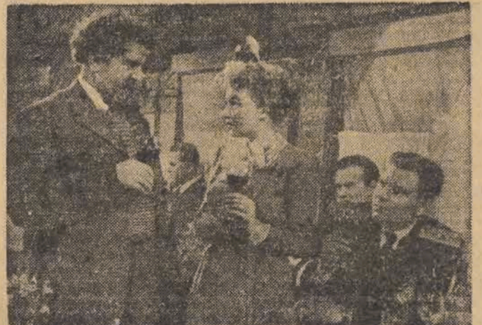
Wesoła scena w pociągu transsyberyjskim

Trzęść filmu — to perypetie dwójga młodych, przygodnych towarzyszy podróży — absolwentki instytutu rolniczego i oficera marynarki — zmuszonych nieoczekiwanymi wypadkami do odbycia wspólnej jazdy pociągiem, samolotem, furmanką i innymi środkami lokomocji, na trasie transzasiatyckiego ekspresu jadącego z Moskwy do Władywostoku. Na tych dwóch podróżniach w prze-