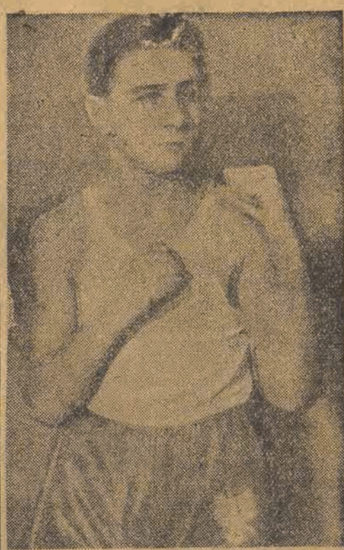
BRZÓSKA Na zebraniu tym postanowiono również, że międzypaństwowy mecz pięściarski z Belgią nie dojdzie do skutku ze względu na zbyt wygórowane warunki, postawione przez Belgów.

ski (Pomorze), 5) Komuda (Warszawa), 6) Biłbrzycki (śląsk), 7) Marcinia (Lublin), 8) Szczepan (Wrocław), 9) Piotrowski (Pomorze), 10) Ratajczak (Poznań); Waga półśrednia — 1) Chychla (Gdańsk), 2) Kaźmierczak (Poznań), 3) Iwański (Gdańsk), 4) Sznajder (śląsk), 5) Olejduk (Łódź), 6) Skierka (Gdańsk), 7) Styś (Kraków), 8) Zieliński (Lublin), 9) Paliński (Pomorze), 10) Szkularek (Poznań); Waga średnia — 1) Koloński (Warszawa), 2) Nowara (śląsk), 3) Pisarski (Łódź), 4) Kwiatkowski (Gdańsk), 5) Trzęsowski (Łódź), 6) Taborek (Łódź), 7) Rapacz (Kraków), 8) Matuła (Kraków), 9) Kranze (Poznań), 10) Wilczek (Warszawa); Waga półciężka — 1) Szymura (Warszawa), 2) Archadzki (Warszawa), 3) Gnat (Pomorze), 4) Kubiśki (Częstochowa), 5) Głębocki (Lublin), 6) Franek (Poznań), 7) Rudzki (Gdańsk), 8) Urbanik (śląsk), 9) Smyk (Wrocław), 10) Turek (Poznań); Waga ciężka — 1) Klimecki (Wrocław), 2) Koleczko (Poznań), 3) Białkowski (Gdańsk), 4) Jaskóła (Łódź), 5) Stec (Łódź), 6) Jadrzyk (Poznań), 7) Lisia (Lublin), 8) Chyla (Pomo-