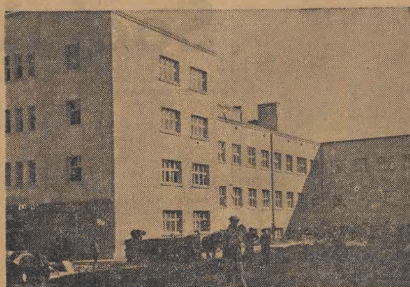
Karolew — robotnicza dzielnica Łodzi — otrzymuje w dniu dzisiejszym do użytku nowy, wspaniały budynek szkolny — obliczony na 1200 dzieci.