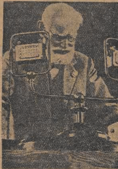
IWAN PAWŁÓW przemawia na XV Międzynarodowym Zjeździe Fizjologów

Te natchnione słowa są zaprawą de hymnem przodującej nauki radzieckiej. Uczą one — wytrwale i ofiarne pracować dla dobra na rod i całą swoją pracę usprawniać dla celu i w wielką uwagą i troską, którą otoczył się działacz nauki w państwie radzieckim.