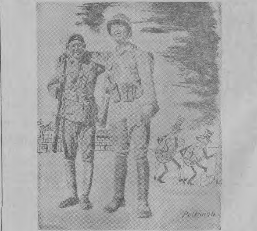
Narody kolonialne przepędzają imperialistów

Waszyngtoński komediant Oficjalne kółka Waszyngtonu doszły do wniosku, że należy zaprzestać używania terminu „zimna wojna”, jako niefortunnego wyrażenia demaskującego agresywną treść polityki a merykańskiej. (Z gazet)