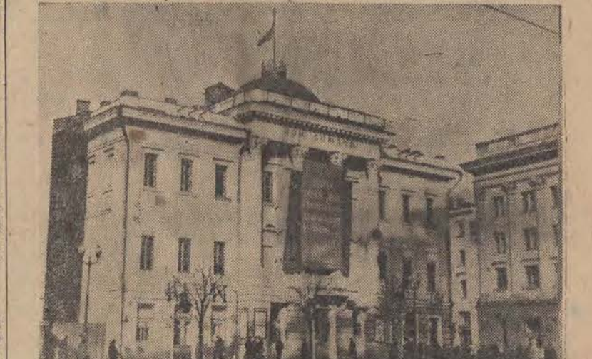
Gmach Domu Związków Zawodowych w Moskwie, w którym ohywały się obrady II Wszechnarodowej Konferencji Obronców Pokoju.

PEKIN. — Agencja Nowych Chin donosi, że w Pekinie zmarł członek Biura Politycznego i sekretarz Komitetu Centralnego Komunistycznej Partii Chin — Zen Bi-szi.