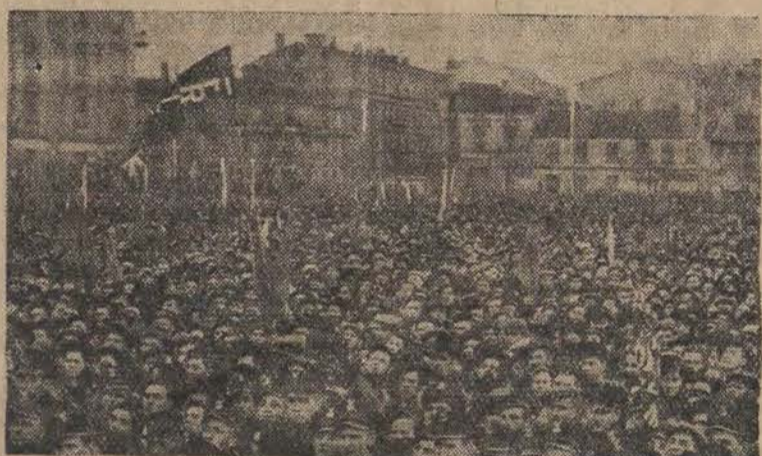
Onegdaj, w niedzielę, na Pl. Niepodległości odbył się centralny wiec, na którym wielotysięczna rzesza łódzian manifestowała swą niezłomną wolę walki o trwały pokój.