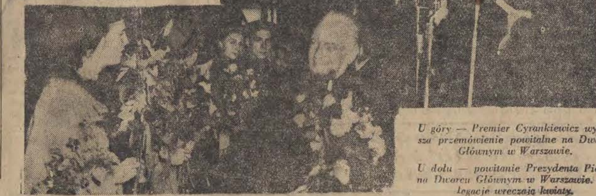
U góry — Premier Cyrankiewicz wygłasza przemówienie powitalne na Dworcu Głównym w Warszawie.

W tej intencji prezes Rady Ministrów przekazał na zakup podarków dla dzieci koreańskich kwotę złotych 500.