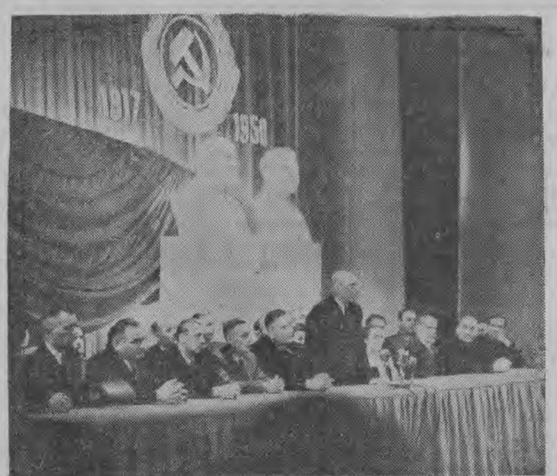
Robotnicza Łódź uroczystie obchodziła 33 rocznicę Wielkiej Rewolucji Październikowej...