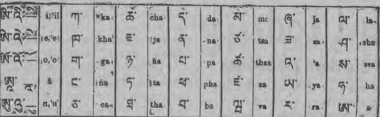
Pismo lamów tybetańskich — znane było dotychczas jedynie zakonnikom buddyjskim

Gazetka ścienna jest organem organizacji partyjnej i rady zakładowej — a to obowiązuje.