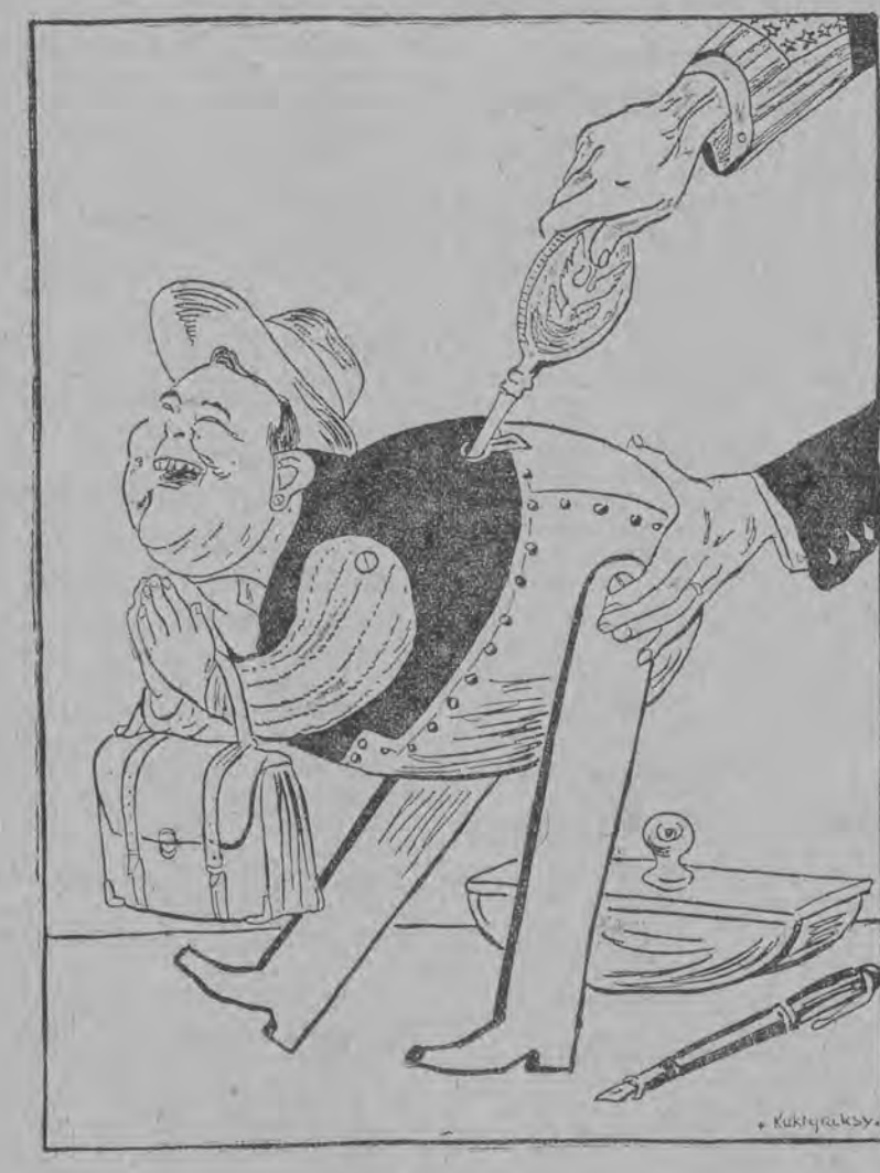
Trygve Lie — czyli amerykańska zabawka, nakrecona na dalsze trzy lata