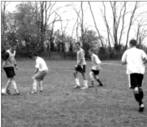
Tylko piłkarzom ZSL-G Głowno było dane dotrzeć do półfinału. Jednak i głównianom nie udało się pokonać silnej ekipy z Ozorkowa.