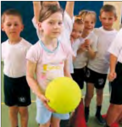
Dla pierwszaków udział w konkursie był doskonałą zabawą.