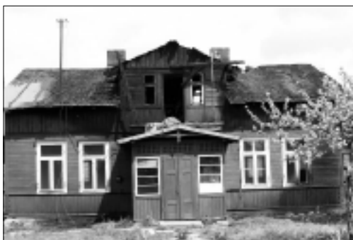
Spaleniu uległo całe poddasze drewnianego budynku.