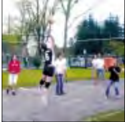
Siatkarki LKS Niesułków pokonały LKS Byszewy 2:0.