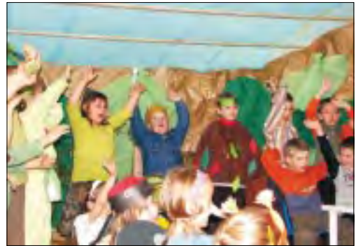
Spektakl „Dzień drzewa” przygotowała najstarsza grupa przedszkolaków, sześciolatkowie.

W trzeci dzień tygodnia ekologicznego sześciolatkowie wystawili swój spektakl dla pięcio- i czterolatków ze swojego przedszkola oraz dla przedszkolaków z „Piątki” z ulicy Chelmońskiego. Natomiast pod koniec tygodnia dzieci wykonywały różną techniką prace plastyczne o tematyce ekologicznej.