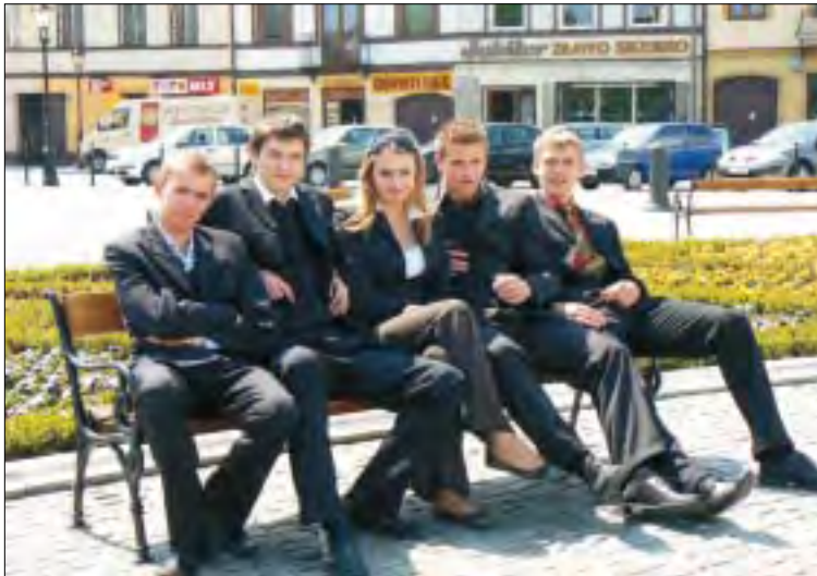
Przed nimi jeszcze kilka egzaminów, a potem wybór - gdzie uczyć się dalej? Tegoroczni maturzyści z I i II LO na Nowym Rynku w Łowiczu. Zdjęcie zrobione w poniedziałek 7 maja, po egzaminie z języka angielskiego.