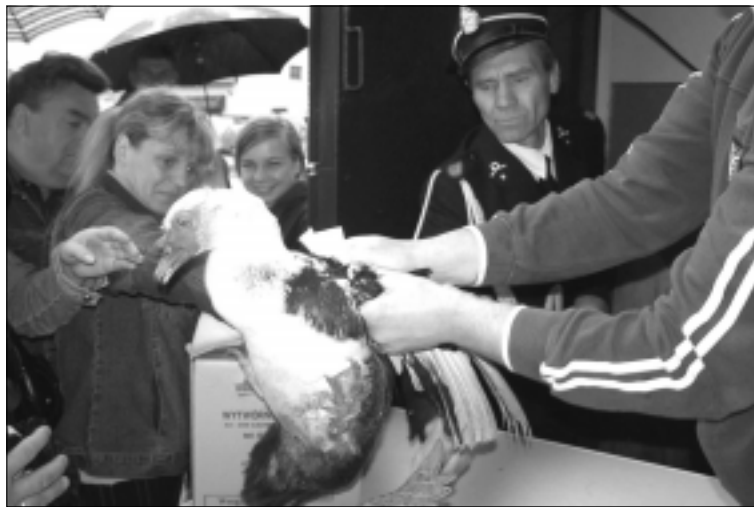
Wśród fantów znalazły się również kaczki.

Błędną (II etap) - 72.500 zł, modernizację drogi w Kolonii Koźle (II etap) - 11.500 zł, modernizację drogi w Tymiance Małej - 8.000 zł, na OSP - 5 tys. zł, remont strażnicy OSP w Warszewicach - 6 tys. zł, zakup wyposażenia dla OSP Ługi - 1.200 zł, wykonanie toru przeszkód na potrzeby OSP - 2.500 zł, zakup umundurowania i remont strażnicy OSP Gozdów - 5 tys. zł. Nadto sfinansowany zostanie zakup wyposażenia dla domu kultury w Niesułkowie - 5 tys. zł, zakup wyposażenia na plac zabaw w Strykowie - 3.500 zł, opracowanie dokumenta-