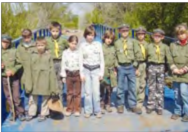
Iskry prezentują zakupione przez Urząd Gminy mundury. Bednarska drużyna była zwycięzcą rajdu.

Do końca maja w Bibliotece Publicznej w Zdunach będzie trwał kiermasz książek dla dzieci. Ceny zaczynają się od 1,5 zł. Są to zarówno bajki, jak i lektury dla klas I - III. Kiermasz udało się zorganizować we współpracy z księgarnią z Pacyni, która wystawiła książki bez wygórowanej marży. Z możliwości taniego zakupu korzystają zarówno rodzice, jak i same dzieci. Te ostatnie, z klas 0, będą zresztą odwiedzać bibliotekę w maju, poznając, jak ona funkcjonuje.