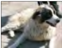
Bernardyńka - ma około roku, przebywa w schronisku niecały rok. Lubi dzieci, jest łagodna. Suka.