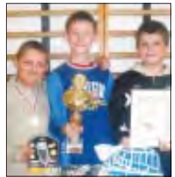
Nowi Mistrzowie Powiatu Zgierskiego

Za zajęcie I miejsca uczniowie Szkoły Podstawowej z Lubiankowa otrzymali puchar „Mistrza Powiatu Zgierskiego”, dyplomy oraz nagrody rzeczowe - kaski rowerowe i odwarzaczę mp3. Drużynę do kon-