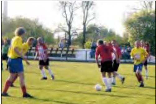
Piłkarze rezerw GOSSO Stal Głowno (żółte koszulki) doznali dość niespodziewanej porażki w sobotnie popołudnie na własnym boisku LKS Kalonka 1:2.