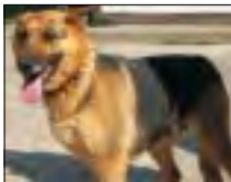
Owczarek niemiecki. Ma około 3 lat. Jest przyjazny, lubi dzieci. W schronisku przebywa od 2 miesięcy.