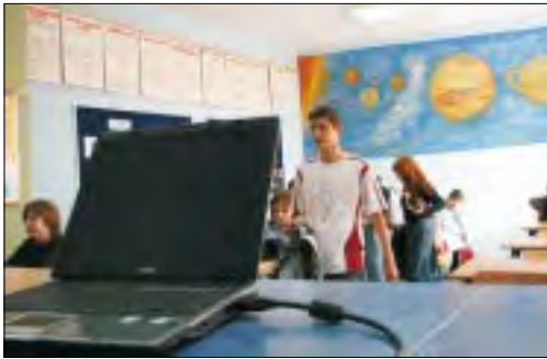
Laptop pozostaje na stałym wyposażeniu pracowni. Na tylnej ścianie widac namalowany Układ Słoneczny.