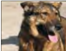
Suka Saba. Ma około 3 lat. Wysterylizowana. Mieszaniec. W schronisku przebywa od 3 lat.