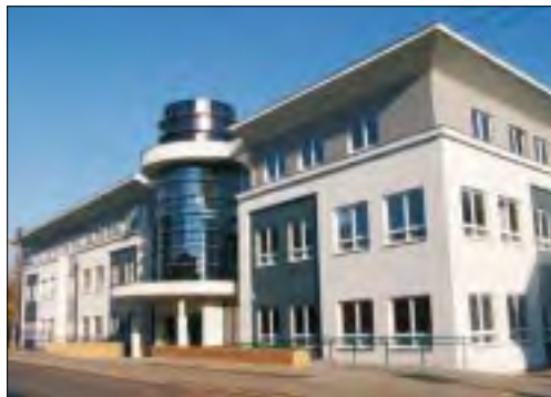
Wydział Elektroniki i Telekomunikacji Politechniki Poznańskiej. Nie tak daleko od Łowicza, a dojazd pociągiem bardzo dogodny.

Oczywiście, powyższe miasta to nie wszystkie spośród tych, które wybierać przyszło łowickim studentom. Istnieje jeszcze wiele niezbadanych zakątków, wiele mniejszych i większych osad, gdzie swoją przystań znaleźli Łowiczanie. Miejsmy nadzieję, że podobnie jak Polacy wyjeżdżający za granicę, tak i Książacy wrócą do swojego rodzimego grodu, by służyć wiedzą i doświadczeniem, tak by „Łowicz rości w siłę, a ludzie żyli dostatniej”