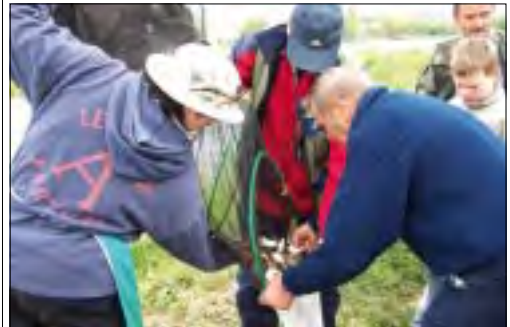
Najbardziej emocjonujący moment zawodów - ważenie ryb złowionych przez poszczególnych zawodników.

Koło szykuje już kolejne zawody. Tym razem będą to zawody dla dzieci z okazji ich święta Dnia Dziecka. Odbędą się one w niedzielę 3 czerwca. Trwają już zapisy. Przyjmowane są w każdą środę w godz. 15-17 w biurze koła przy ul. Młynarskiej 8. (ljs)