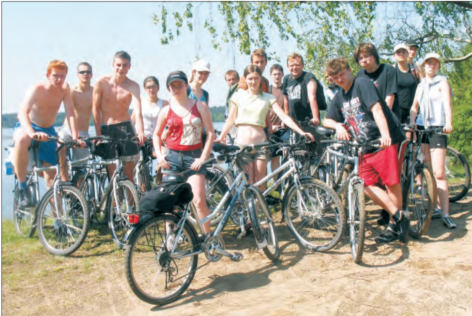
Licealiści pobili rekord ośrodka, w którym mieszkali - 68 km rowerami w ciągu jednego dnia.