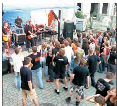
Ponad 100 osób było na koncercie. Znaczna część pod sceną.