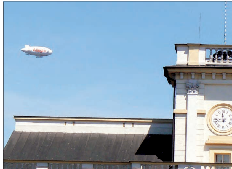
Sterowiec z reklamą serwisu aukcyjnego Allegro.pl pojawił się w poniedziałek 11 czerwca nad Łowiczem. Z informacji, jaką uzyskaliśmy od jednego z naszych czytelników wynika, że leciał od strony południowo-zachodniej na północny wschód. W centrum miasta był widoczny około południa, jednak leciał na tyle szybko i wysoko, że jego pojawienia się mogło ująć uwagę łowiczan.