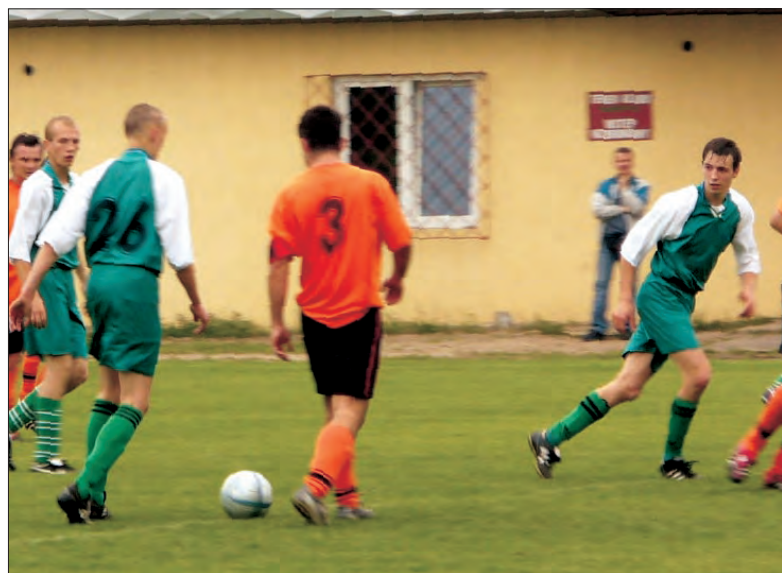
Ekipie dobiezskowskiej Strugi nie udało się nawiązać równorzędnej walki z mistrzem klasy „B” LZS-em Justynów.