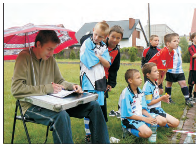
Zawodnicy nie boją się deszczu, ale sędzia schronił się pod parasolem. Tak wyglądała impreza na Bratkowicach.

W chwili, gdy lunął deszcz, duża część uczestników imprezy opuściła boisko. Zostało na nim jednak kilkadziesiąt dzieci najwytrwalszych. Zmuszeni byli oni do zrobienia krótkiej przerwy w meczu. Czas ten wykorzystali na posilenie się kiełbaskami z grilla, po przerwie grę kontynuowali. Zwycięskie drużyny nagrodzone zostały pucharami