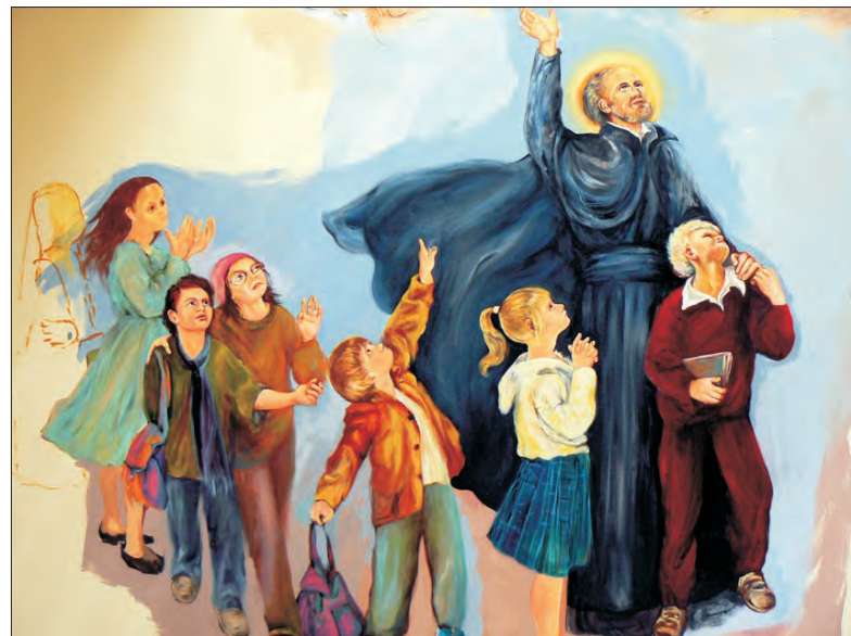
Dzieci prowadzi ku wierze i nauce założyciel szkół, Józef Kalasancjusz.

ności Bożej, niżej gołębicą, czyli symbol Ducha Świętego. Od gołębic rozchodzą się promienie, obejmując namalowane niżej anioły, Maryję oraz adorujące Trójcę Świętą dzieci. Matka Boża namalowana została pod postacią Madonny z Medjugorie, w jej pierwotnej postaci, jaką stworzono zaraz po pierwszym objawieniu. Dzieciom po lewej stronie ołtarza towarzyszy św. Józef Kalasancjusz, założyciel szkół pijarskich, który