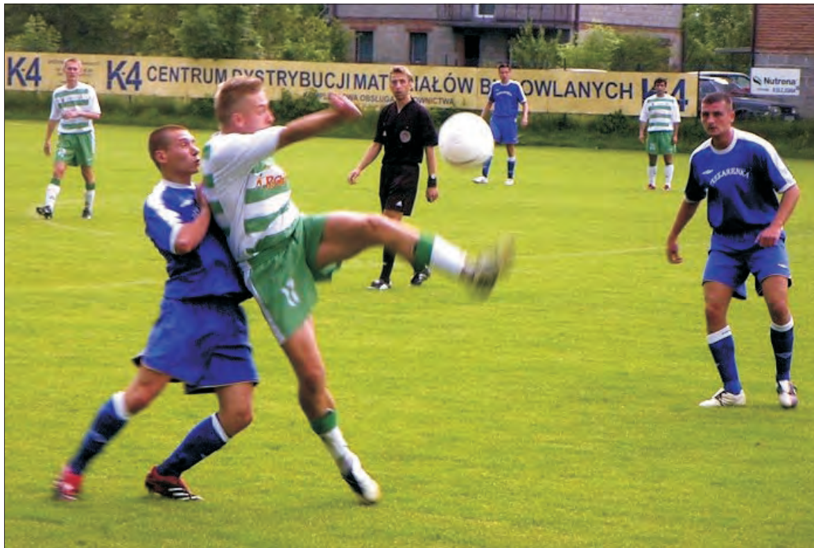
Piłkarze Warty Sieradz (zielono-białe stroje) byli bardziej umotywowani w sobotnie popołudnie.