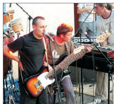
Lao Che - zespół tworzyło siedmiu muzyków.

Wszyscy uczestnicy konkursu otrzymali markowe wieczne pióra, okolicznościową pozycję „Pierwsze wzloty” z utworami laureatów tegorocznej, dwunastej edycji konkursu oraz „Pomysł na ortografię” autorstwa Elżbiety Skonecznej - pozycję podsumowującą konkurs „Mistrz Ortografii” wydaną przez Bibliotekę Miejską. (eb)