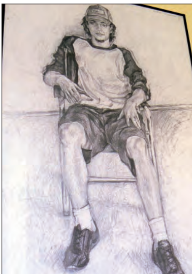
Rysunki Eweliny Masztanowicz do niedawna można oglądać w Bibliotece Powiatowej w Łowiczu.