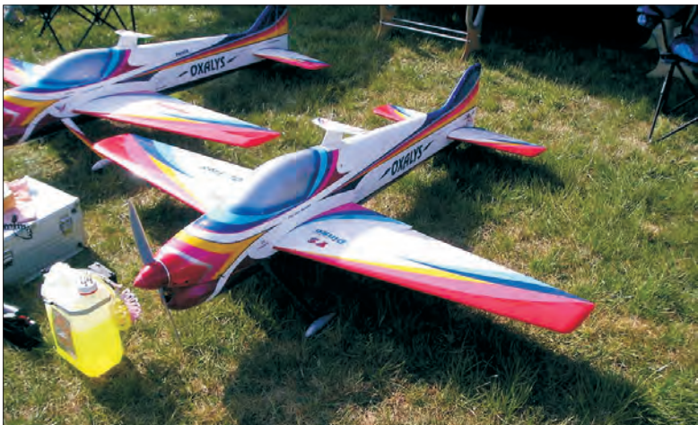
Model Piotra Oxalys tuż przed startem.

kolejności i odległościach. Ten sam program figur obowiązuje na całym świecie. Są to figury geometryczne połączone z pętlami i beczkami. Sędziowie ustalają go raz na 2 lata.