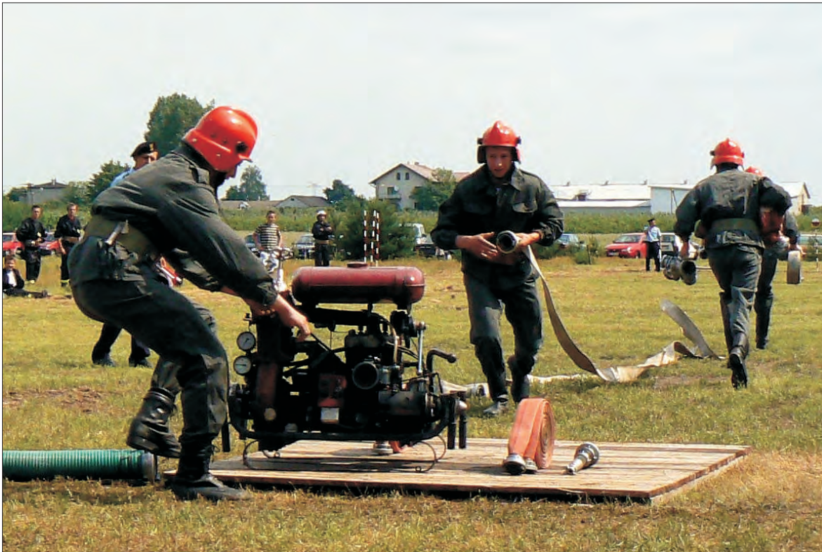
W ćwiczeniach bojowych liczy się czas i poprawne wykonanie wszystkich czynności.