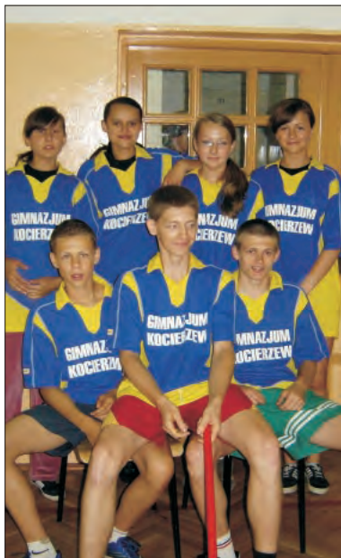
Ekipa gimnazjum w Kocierzewie tym razem była jedną z sześciu drużyn gimnazjady.