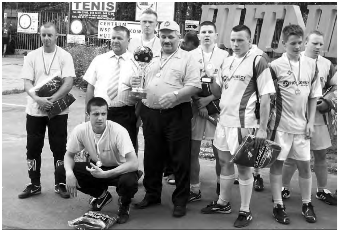
Drużyna Ubojni Drobiu „Piórkowscy” z Woli Cyrusowej zajął pierwsze miejsce w mistrzostwach Polski branży spożywczej.