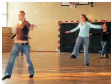
Próby Mrożan odbywają się w gościnniej sali w SP w Kołacinie.