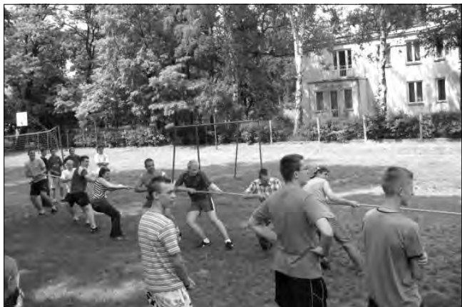
Przeciąganie liny to jedno ze sportowych zmagani podczas pikniku w III LO.