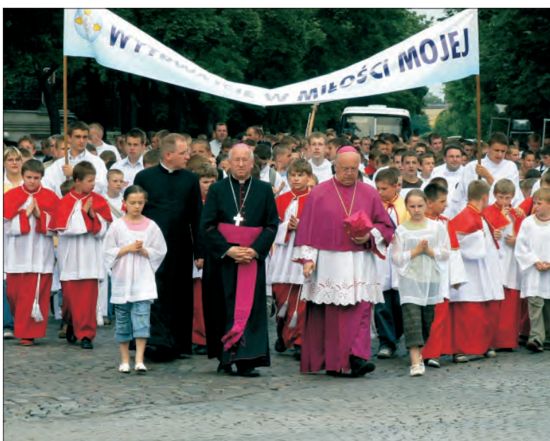
Procesję ministrantów i lektorów z seminarium do katedry prowadzili obydwaj biskupi.

Potem był posiłek, pokaz strażacki i około godziny 17 procesja ulicami Łowicza z seminarium w albach i białych strojach lektorów pod pomnik papieża Jana Pawła II na Starym Rynku. Tam przedstawiciele ministrantów i lektorów złożyli kwiaty i wszyscy przeszli na mszę świętą do katedry. W czasie gdy w Łowiczu spotykali się ministranci i lektorzy, przy Sanktuarium Maryjnym w Domaniewicach odbywało się diecezjalne spotkanie bielank. Słońce przypiekało tak bardzo, że nie wszystkim dziewczętom udało się dotrzeć do końca mszy świętej. Część z nich próbowała schować się pod parasolami, inne szukały cienia pod drzewami obok placu. Pod koniec mszy wszyscy otrzymali pamiątkowe różańce. Bezpośrednio po mszy na wszystkich czekały zimne napoje oraz pączki i słodkie bułki. Potem były wspólne płąsy.