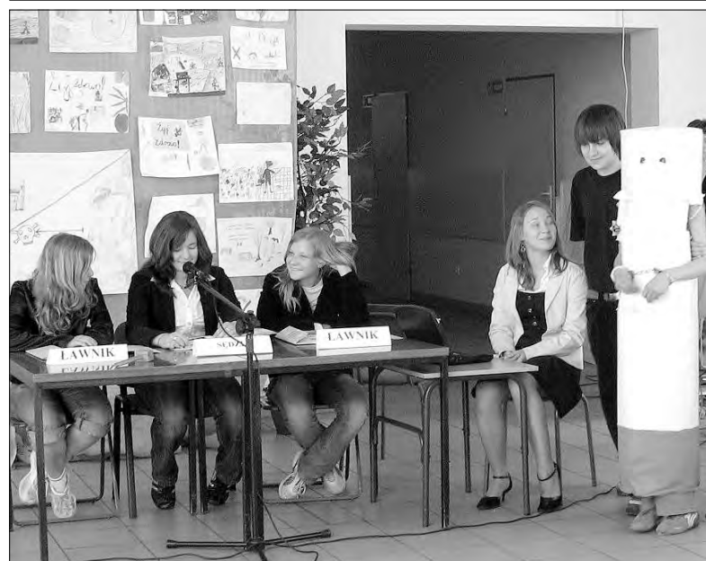
Sąd nad papierosem. W ostatnim dniu maja w ramach akcji „Dzień bez papierosa” uczniowie klasy V1b Szkoły Podstawowej nr 2 w Głownie zaprezentowali krótką inscenizację profilaktyczną. Jej akcja toczyła się na sali sądowej przy aktywnym udziale publiczności. Oskarżony papieros, pomimo głębokiego przekonania o swojej niewinności, otrzymał wyrok dożywotniego zakazu opuszczania paki. Wyrok został wykonany przy ogromnym aplauzie widzów.

Rzucisz chłodnym okiem na dokumenty finansowe SPZOZ w Głownie prezes Roślewski stwierdził, że nie wystarczy zmniejszyć straty. dok. na str. 37