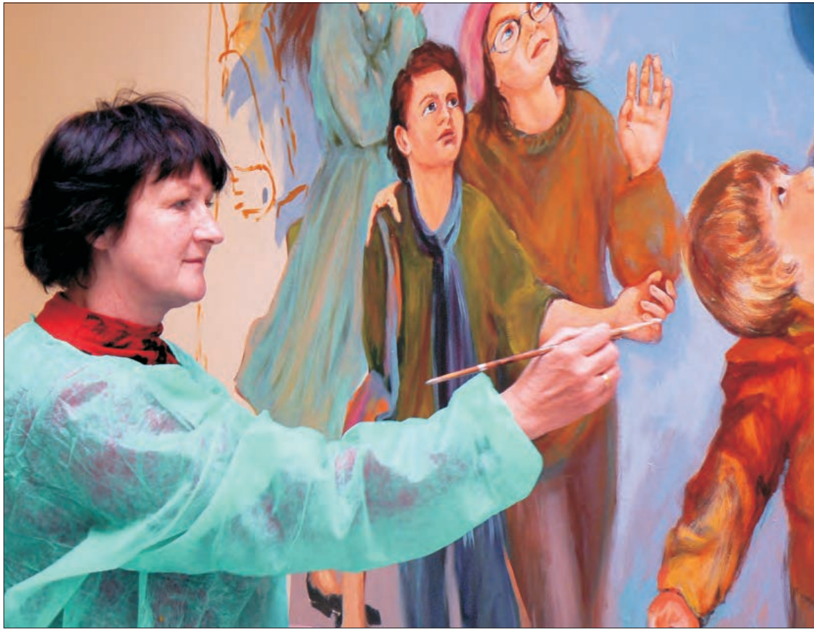
Postaci namalowane w kaplicy ujęte zostały w sposób współczesny, aby modlący się uczniowie identyfikowali się z nimi.

Na ścianie ołtarzowej wisi na razie atrapa krzyża, miejsce na tabernakulum zaznaczone jest iksem, nie wiadomo też, jak wyglądać będzie podłoga itd. Mimo to ocenić już można wizję artystki. Na samej górze, tuż pod przeszkolonym dachem, widnieje znak Opatrz-