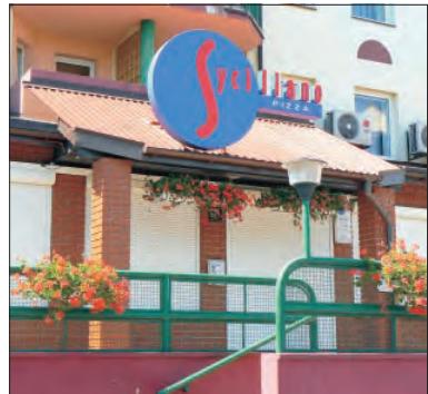
Ten lokal raczej nie zostanie ponownie otwarty.

W wypowiedziach młodych ludzi przewijała się opinia, że przyczyną takiego stanu rzeczy jest to, że większość 3/4 pracujących w tym lokalu pracowników wyjechało do Londynu. Czyżby istotnie emigrujący za chlebem do Anglii? Czy rzeczywiście?