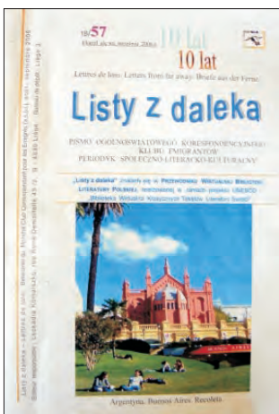
Strona tytułowa periodyku „Listy z daleka”.

„Listów z daleka” nie można kupić w kiosku czy w saloniku