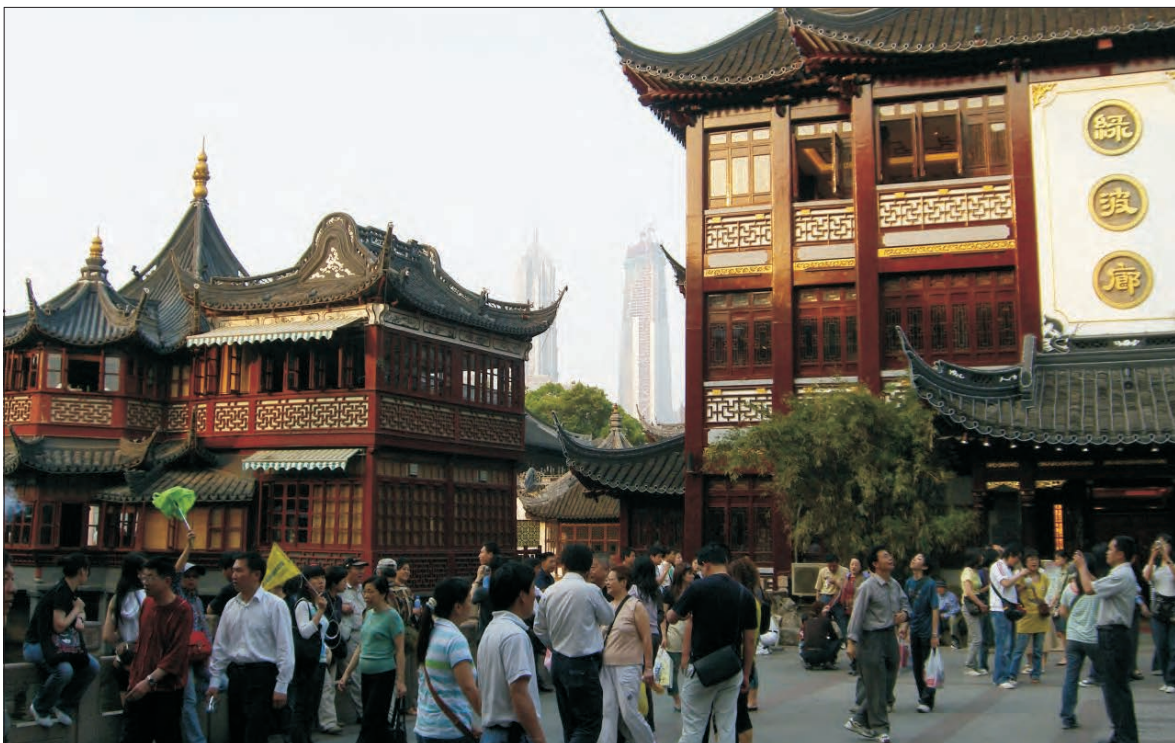
Łowiccy przedsiębiorcy podziwiali dwa światy: zabytkowe, orientalne budowle Szanghaju oraz widoczne w tle wieżowce, jedne z najwyższych na świecie.

Dopiero po zakończeniu tej pierwszej części szkolenia następowała druga część -