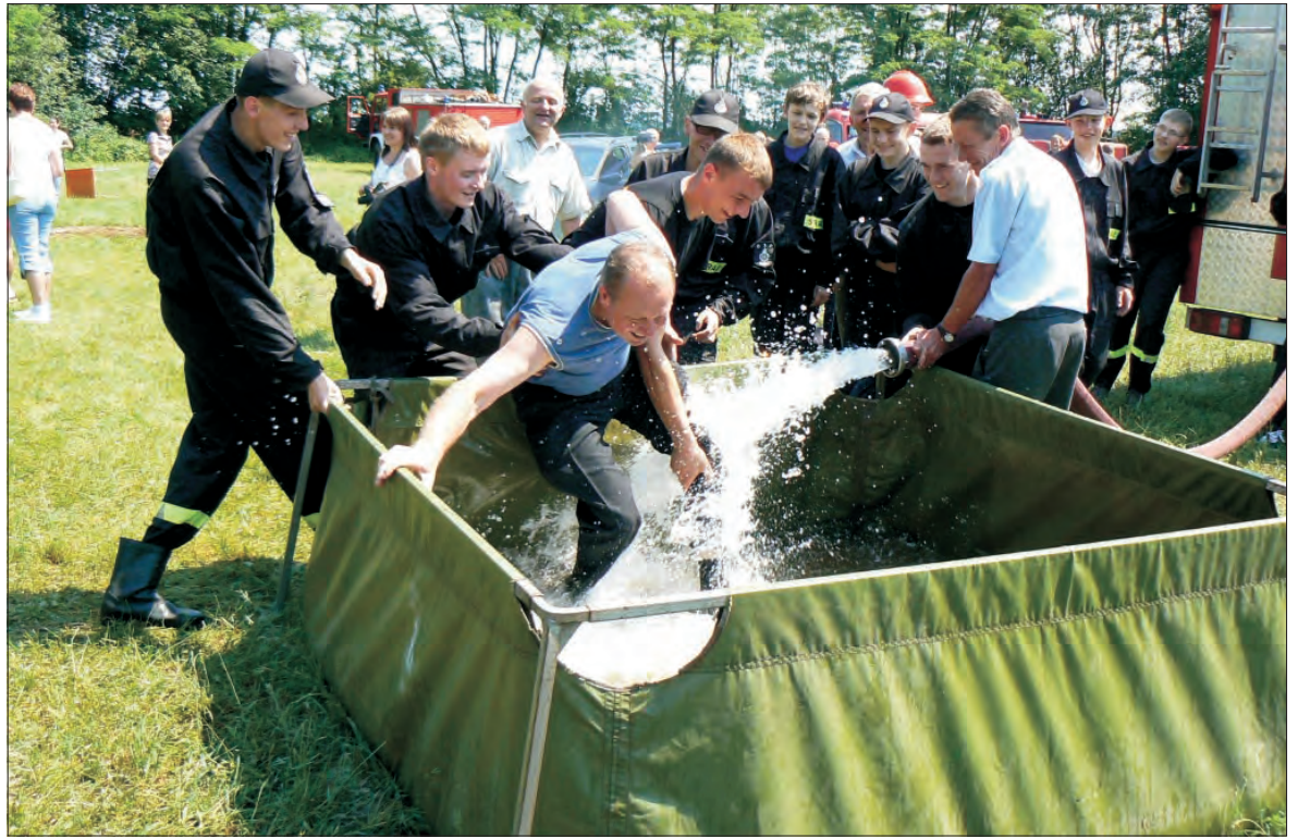
Tradycyjne „moczenie” kapitanów i dowódców najlepszych drużyn podczas zawodów strażackich w Bratoszowicach w gminie Stryków. Czytaj na str. 4

- Z Sanepidem nigdy nie mieliśmy kłopotu - twierdzi WB. - Lokal był wzorowy jak na warunki głowieńskie. Było w nim zatrudnionych na pełne etaty osiem osób. Jak Pani sobie wyobraża przy takim zatrudnieniu nadgodziny? - pyta retorycznie współwłaściciel. Twierdzi on ponadto, że doniesienie do PIP złożyła osoba, która sama z pracy w pizzerii się zwolniła. WB poinformował też, że PIP żadnych uchybień nie stwierdził. - Jako jedyny lokal w Głownie posiadaliśmy pełną klimatyzację na sali i na kuchni. Po prostu mamy dosyć walki z ludźmi, którym się wydaje, że wszystko można - uzasadnia dość zagadkowo zamknięcie pizzerii jej współwłaściciel - To, gdzie przeniesiemy lokal jest na razie tajemnicą, na pewno nie będzie to Głowno - podsumował. (rpm)