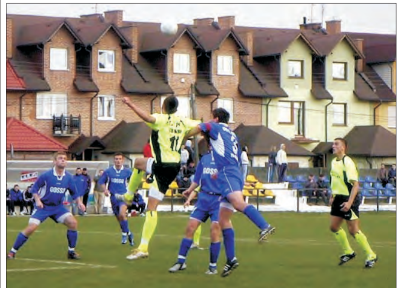
Piłkarze GOSSO Stali Główno (niebieskie stroje) zrehabilitowali się za porażkę z Nadnarwią i pokonali Warmię Grajewo 2:1.