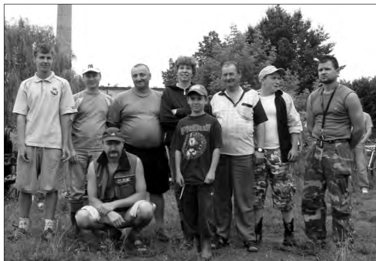
Laureaci Towarzyskich Zawodów Splawikowych.

Co do tej pory było ciekawego na Kongresie? W piątek w Seminarium odbył się Kongres Ruchów i Stowarzyszeń Katolickich z diecezji. dok. na str. 11