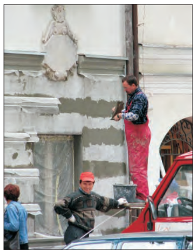
Prace mają zakończyć się w ciągu dwóch, może trzech tygodni.

Dotychczasowa elewacja tylko na pierwszy rzut oka wyglądała dobrze. Podczas ostatniego remontu w 1998 roku zostały tylko uzupełnione braki i pomalowano ją. Tymczasem w wielu miejscach tynk pękał i opadał i władze banku zdecydowały, że należy ją wykonać jeszcze w tym sezonie budowlanym. Ze względu na zabytkowy charakter budynku każdy detal został dokładnie opisany, co gwarantowało, że po remoncie odtworzony zostanie tak samo i w tym samym miejscu.