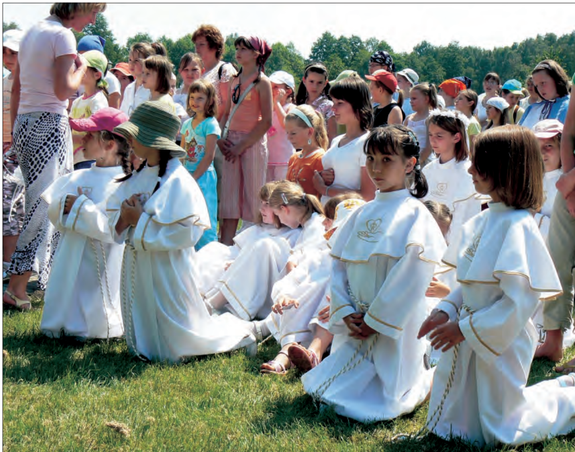
Bielanki spotkały się w Domaniewicach w upalnym słońcu.