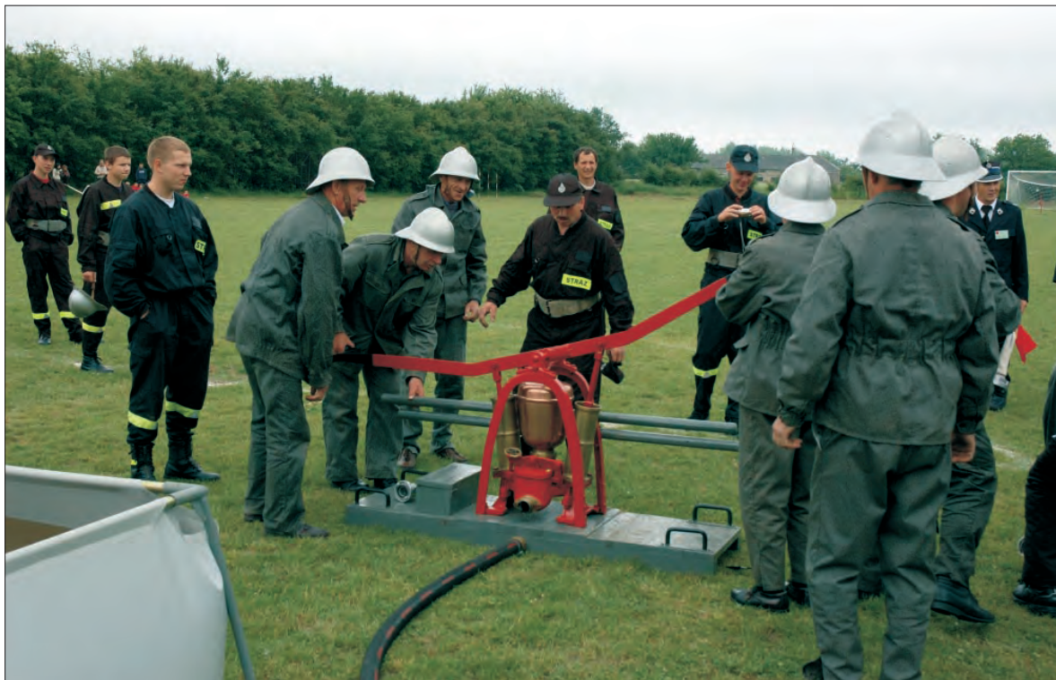
Pompa ręczna strażaków z Chruśli wygląda jak nowa, a co najważniejsze - znów działa.