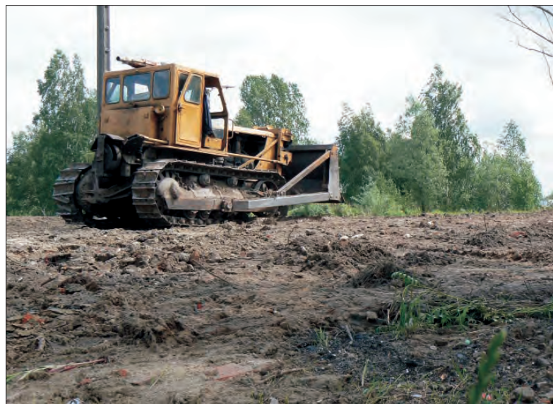
Teren wysypiska został uprzątnięty i wyrównany.

Co stanie się dalej z odnowioną pompą? - Zatrzymamy ją dla siebie - deklaruje prezes. - Mieliśmy propozycję zamiany na spalino- wa, ale z niej nie skorzystamy. Ta stara pompa jest chyba więcej warta. (mwk)