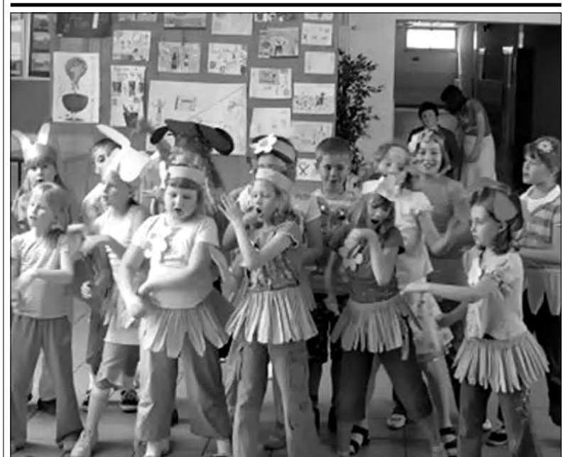
„Dwójka” promuje ekologię. W ubiegłym tygodniu uczniowie klas IIb i IIIc Szkoły Podstawowej nr 2 w Głownie zaprezentowali swoim kolegom przedstawienie o tematyce ekologicznej, w którym namawiali do segregowania odpadów, oszczędzania wody i dbania o czystość najbliższego otoczenia. Biermy z nich przykład.