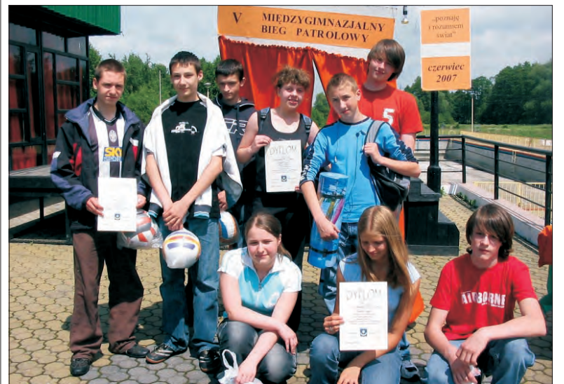
Zwycięzcy V Międzygimnazjalnego Biegu Patrolowego.