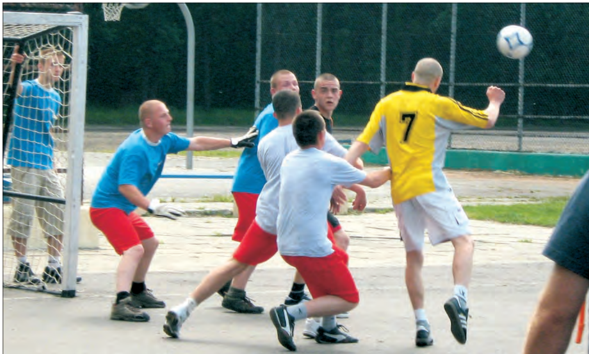
Podczas turnieju piłki nożnej walka była niezwykle zacięta i emocjonująca.