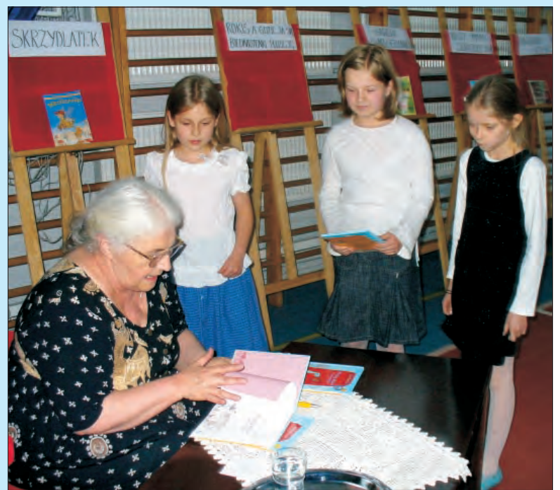
Uczniowie „Siódemki” z niecierpliwością czekają na autograf pisarki.