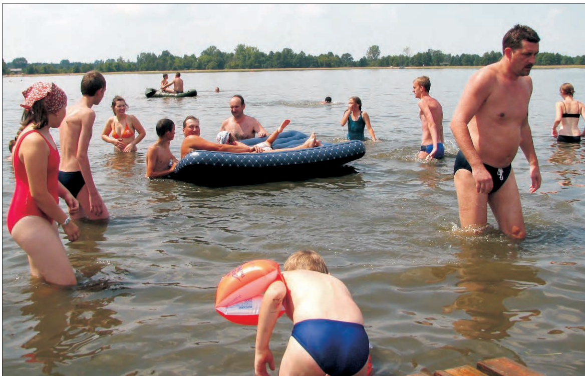
Wielbiciele letnich kąpiei korzystają ze zbiornika na własną rękę. Przygotowywany plan ureguluje te sprawy.

W przypadku planu dotyczącego terenów przy zbiorniku jest to jedna z najistotniejszych opinii, gdyż marszałek ma podjąć decyzję zezwalającą na odlesianie działek. Innymi słowy, to od zgody marszałka zależy, czy posiadacze działek leśnych w Joachimowie Mogiłach, będą mogli karczować te tereny w celu budowania na nich domków letniskowych.