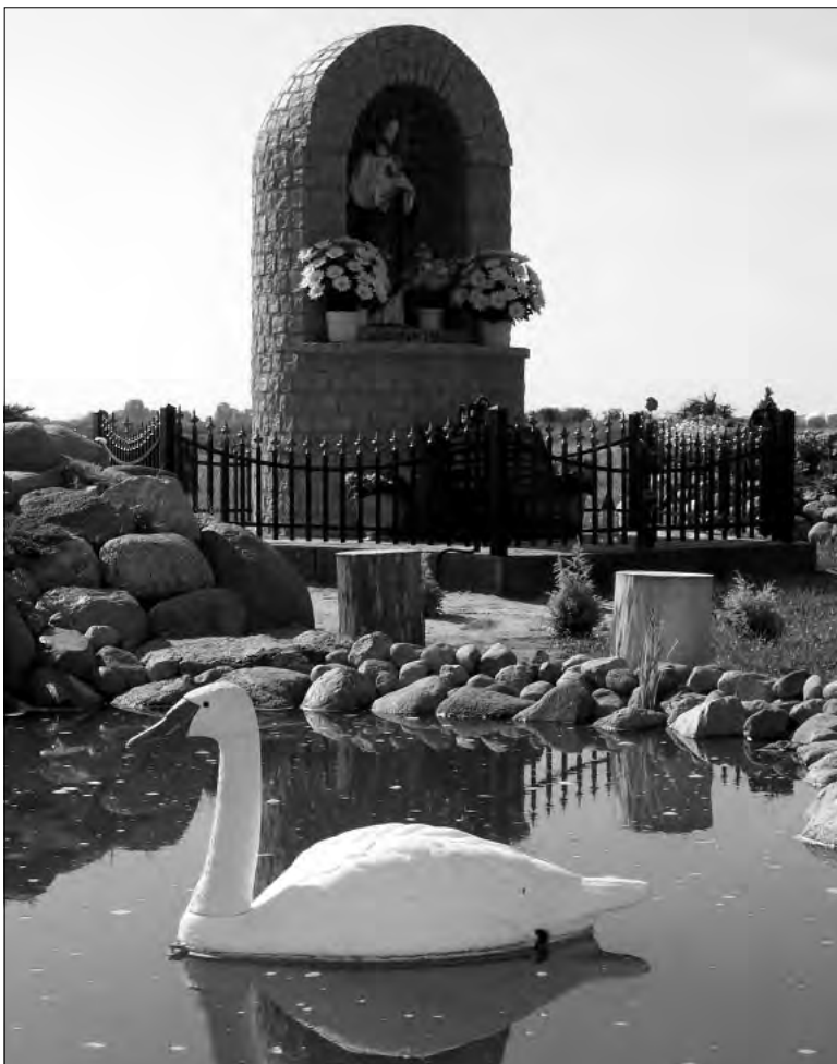
W tym urokliwym zakątku z przyjemnością można zatrzymać się na chwilę refleksji.

zatrzymać się i chwilę pomodlić. Już dziś nad miniaturowymi stawami ustawiono ławki z bali, by miejscowi i przyjezdni, odwiedzając te strony, mogli spocząć przed wizerunkiem Syna Bożego. Po zapadnięciu zmroku kapliczkę oświetlają reflektory.