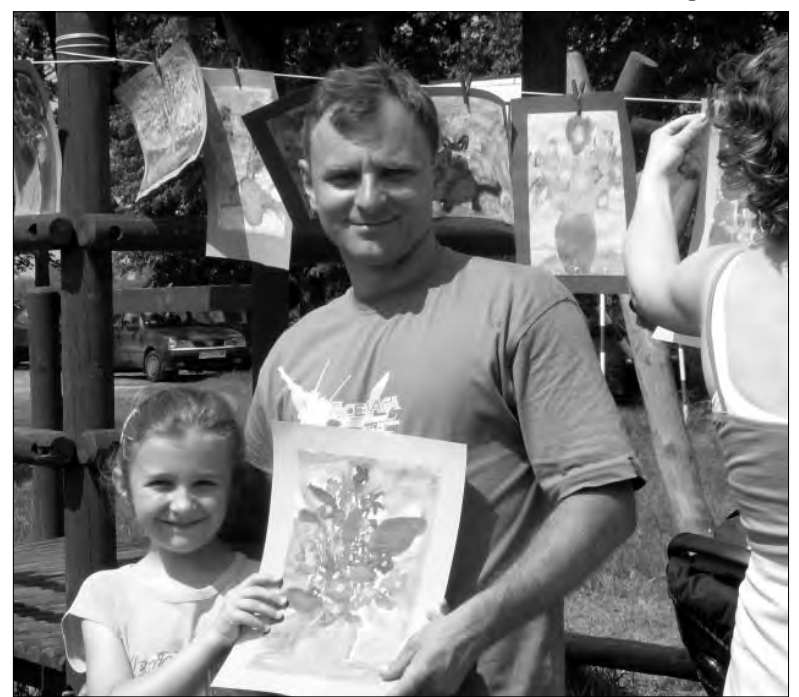
Obrazy małych artystów, uczniów szkoły im. Józefa Chełmońskiego.

Po występach pod rozłożystymi jabłkami pojawiły się koce i ogrodowe parasol-