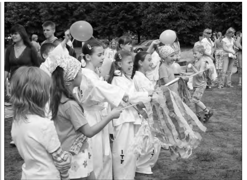
Uczniowie SP 3 w oczekiwaniu na swój występ świetnie bawili się przy piosenkach przedszkolaków.