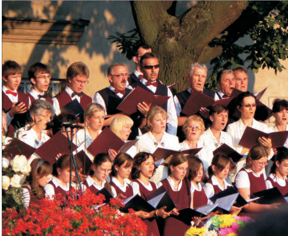
Pięknie wyglądali w zachodzącym słońcu chórzyci z Sochaczewa. Śpiewali jeszcze pięknie.