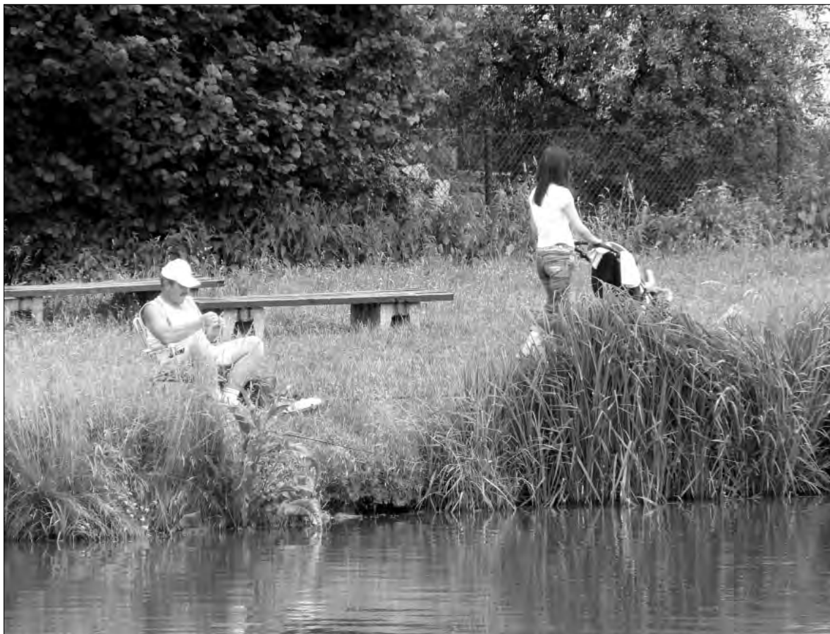
Obecnie zalew w Strykowie oferuje niewiele, od przyszłego roku ma być lepiej.