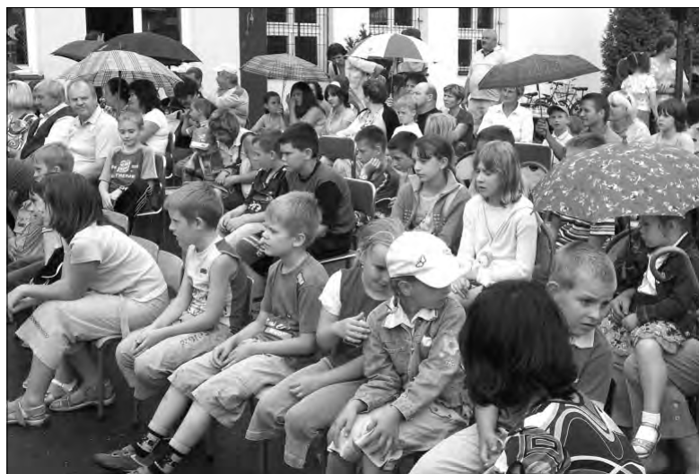
Wierna publiczność, nie zważając na kaprysy aury, doczekała do końca występów.