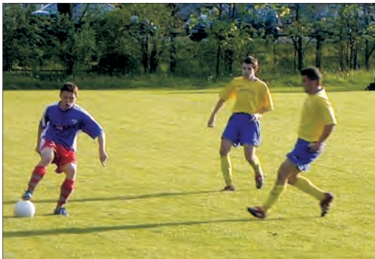
Piłkarze Zjednoczonych Stryków (żółte koszulki) nie dali rady wywieźć nawet punktu z Kleszczowa.