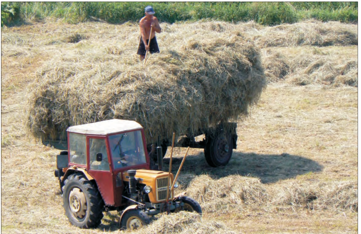
Czy rolnicy, którzy obecnie sprzątają siano ze swoich pól, skuszą się również na to z gminnych działek?