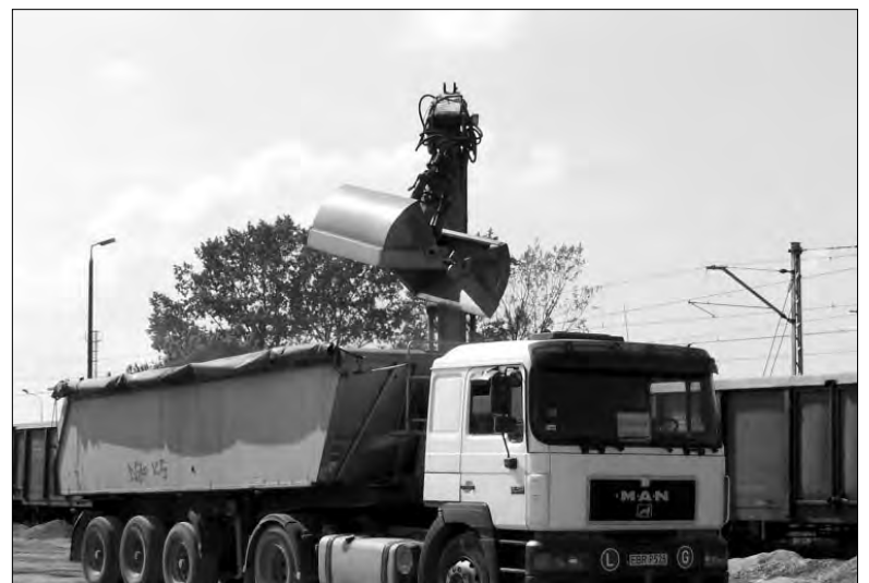
Hałas, jaki towarzyszy przetrucaniu kruszywa z wagonów na samochody, to nie jedyne utrapienie okolicznych mieszkańców.

Czy po obietnicach przedstawicieli Erbedimu można się jednak spodziewać cho-