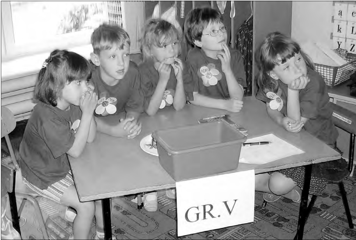
Mali głownianie wykazać musieli się nie lada wiedzą o swoim mieście.