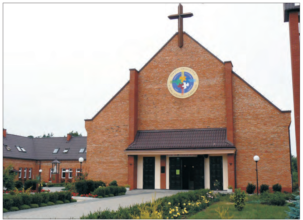
Parafia na Korabce erygowana była w 2000 roku, o czym przypomina napis z symbolem Wielkiego Jubileuszu. 30 czerwca odbędzie się konsekracja kościoła.

Przed tą uroczystością w kościele na Korabce zamontowany zostanie nowy ołtarz z granitu, wykonany przez firmę Granmos z okolic Radomia. Nowy ołtarz będzie repliką drewnianego ołtarza papieskiego, który na Korabce jest od początku istnienia kościoła. Przypomnijmy, że jest to ten ołtarz, przy którym 14 czerwca 1999 roku mszę św. w Łowiczu sprawował Jan Paweł II. Na ołtarzu tym znajdują się rzeźby symbolizujące ewangelistów, które odtwo-