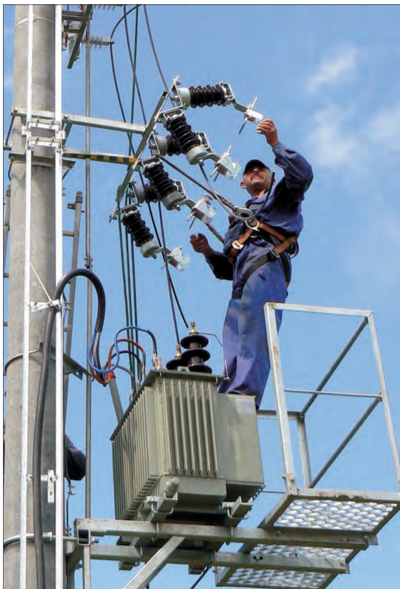
Lepsze zasilanie na Wiejskiej. W miniony wtorek, 19 czerwca, pracownicy Łódzkiego Zakładu Energetycznego zamontowali na ul. Wiejskiej w Głownie nową stację transformatorową. Ma ona poprawić warunki zasilania odbiorców energii w tym rejonie. (rpm)

Do Urzędu Skarbowego w Głownie na chwilę zamykania tego numeru „Więści” dotarło już pół tysiąca tytułów wykonawczych ze starostwa, na podstawie których, jak na razie, dokonano 6 egzekucji w postaci potrąceń ze zwrotu podatku. Zająć wypłat na kontach bankowych ani dóbr rzeczowych komornicy jeszcze nie dokonywali. (ljs)