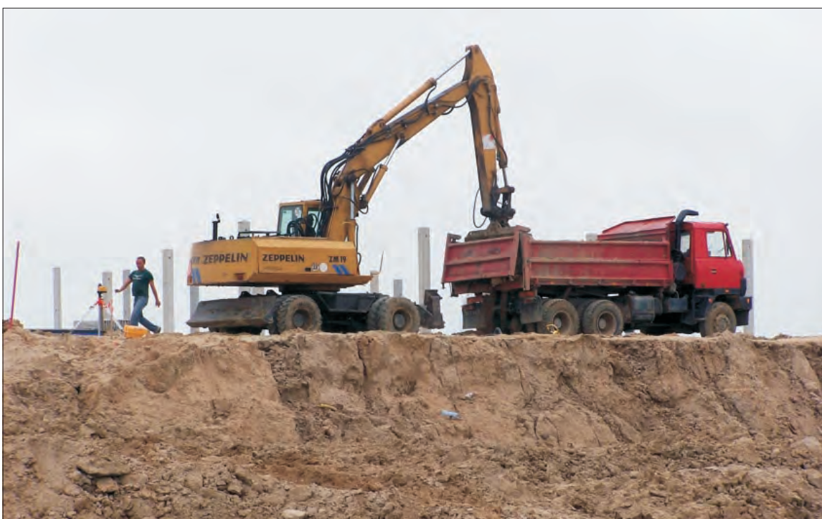
Koparki, spycharki, ciężarówki, czyli budowa kolejnego magazynu w Tulipan Park rozpoczęta.

Generalna Dyrekcja Dróg Krajowych i Autostrad w 1996 roku wykupując działki