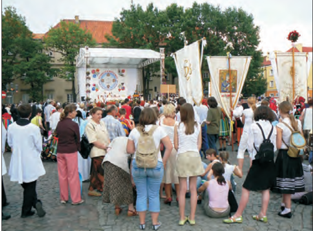
Wierni przyszedli na mszę św. kończącą Kongres, ale tłumów nie było.

Być może też formuła Kongresu Eucharystycznego, jako sposobu publicznego wyrażenia wiary, już się przeżyła, być może trzeba szukać form innych, bardziej odpowiadających wrażliwości współczesnego człowieka. Ci jednak, którzy w mszy św. przed gmachem muzeum