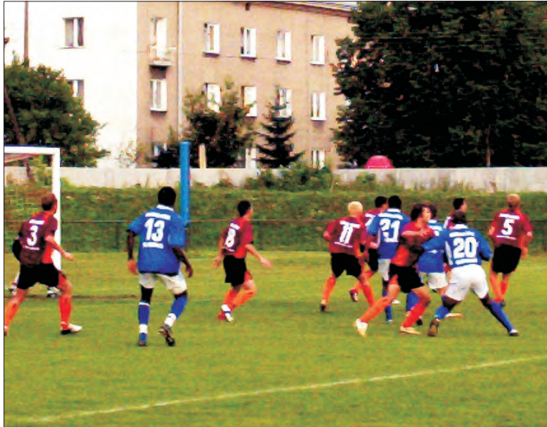
W środowym trzecioligowym meczu gorących spięć nie brakowało także pod bramką OKS-u Olsztyn.