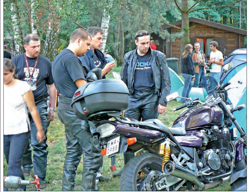
Wspólne oglądanie motocykli i rozmowy o niuansach technicznych...

Po rozstrzygnięciu konkursów i koncercie Don Wasyla część widzów opuściła Nowy Rynek. Nie było jednak koniec atrakcji. Można jeszcze było zobaczyć na scenie tańce średniowieczne, pokaz luznicztwa, usłyszeć ponowną prelekcję na temat zdrowej żywności. Wystąpił też poznański kabaret Afera - trzech panów przebranych a la The Beatles z drewnianymi gitarami. Po znrroku z krótkim pokazem wystąpił teatr ognia. To była jedna z najbardziej udanych tegorocznych imprez w mieście. (mak)