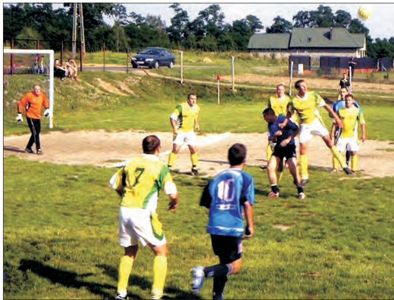
W charytatywnym meczu drużyna firmy Ubojni Drobiu „Piórkowscy” (żółte stroje) zmierzyła się z a-klasowymi Błękitnymi Dmosin.

● godz. 17:00 , w meczu o mistrzostwo Młodzieżowej Ekstraklasy na boisku w Głownie piłkarze ŁKS-u Łódź zmierzą się z Cracovią Kraków. AK