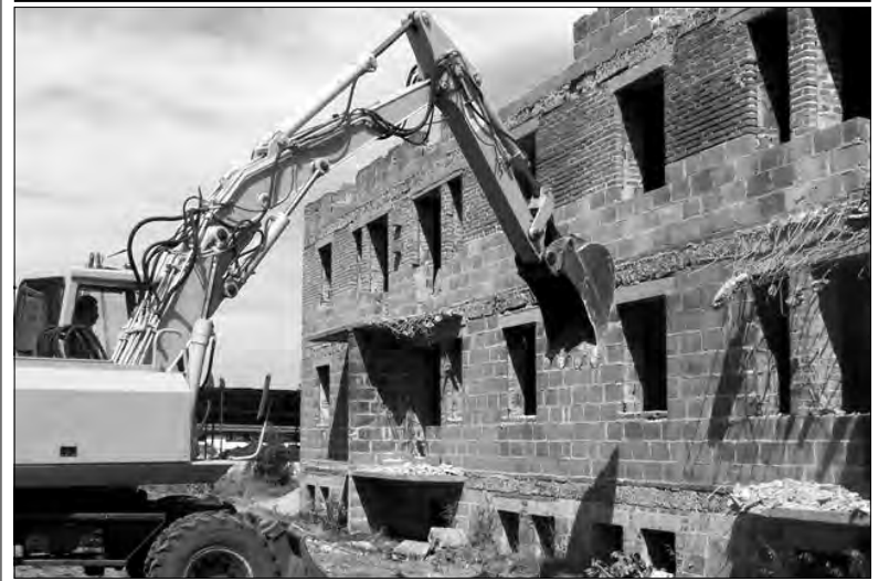
Prace na ul. Nowosólnej rozpoczęto kilka dni temu.

Jeśli uda się do pomysłów przekonać zarządcę trasy krajowej nr 14, wówczas strykwscy radni chcieliby już w przyszłym budżecie Strykowa zarezerwować pieniądze na modernizację parkingu. (ljs)