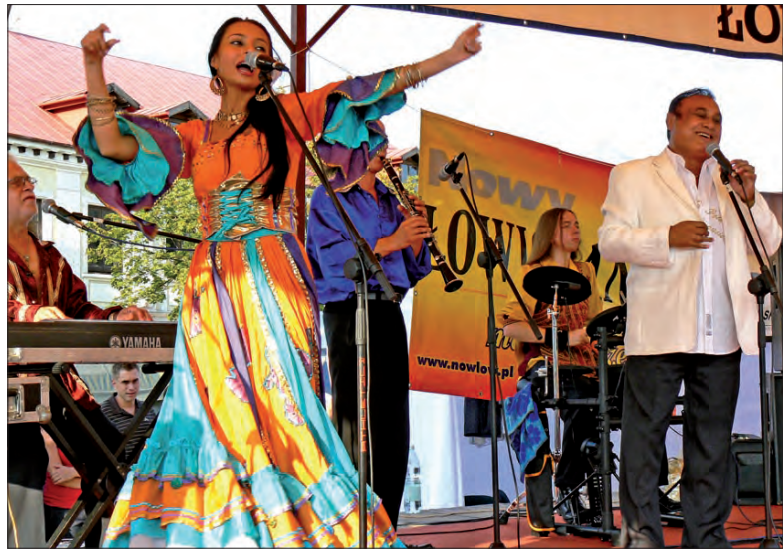
Don Wasyl z zespołem - wielki show, ale z playbacku.