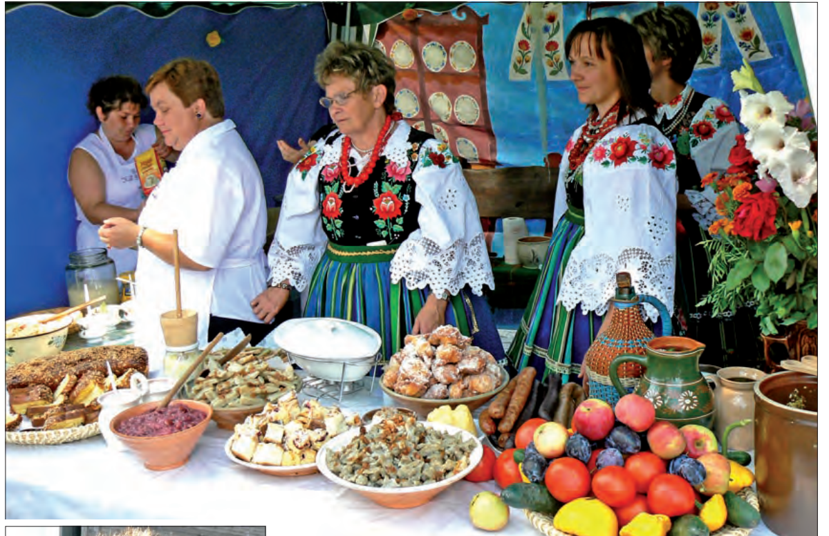
Koło Gospodyń Wiejskich z Kocierzewa. Nie tylko potrawy regionalne, ale również stroje ludowe.

Na większości stoisk można było czegoś spróbować, na znacznej części z nich nawet za darmo. Pyszny był smalec na chlebie własnego wypieku i ogórek małosolny od gospodyń z Zielkowic, równie dobre specjały, w tym kielbasy, kaszanki i „czarne”, mnóstwo różnych ciast i pączków znaleźliśmy na stoisku gospodyń z Kocierzewa. Był też na przykład biały ser przygotowany przez gospodynie ze Strzelcowa, pyszne pyzy przygotowane przez gospodynie z osiedla Starzyńskiego i pierogi łowickie,