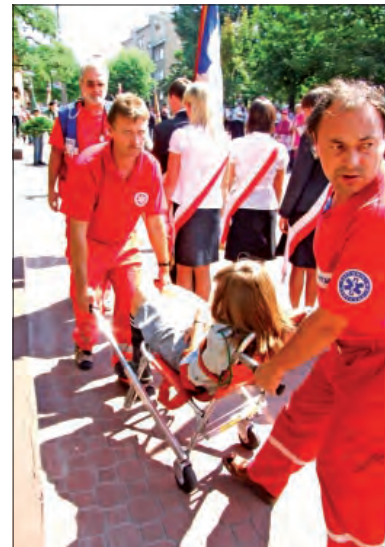
Co roku w czasie uroczystości 15 sierpnia jest upał. W tym roku był szczególnie dokuczliwy, do omdlełej harcerki przyjechać musiała pogotowie.

Wcześniej jednak wierni wychodząc ze świątyni przeszli pod pomnik Synom Ziemi Łowickiej oraz pod pomnik Jana Pawła II, gdzie zostały złożone wieńce. (tb)