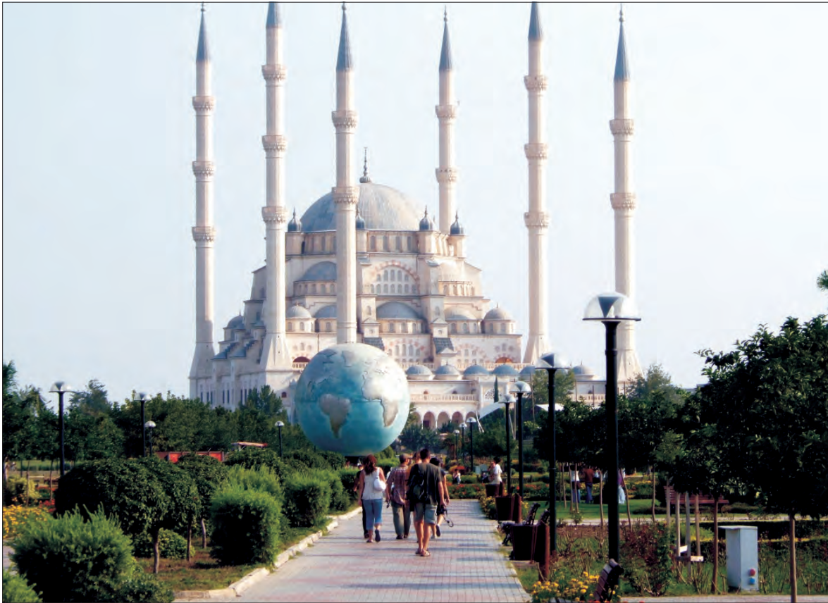
Widok na meczet.