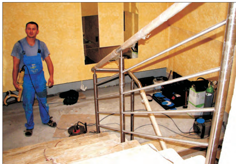
Klatka schodowa nabiera kształtu - w obiekcie trwają prace wykończeniowe.

Obiekt z pierwotnych 900 m 2 powierzchni użytkowej, przebudowany został do 1200 m 2 . W środku wyburzono wszystkie ścianki działowe, zabudowane zostały tarasy na piętrach, budynek zyskał też szereg pomieszczeń zaplecza na parterze. Przede wszystkim jednak na wygląd zewnętrzny wpływ miało użycie atrap mansardowych dachów, miedziane obróbki blacharskie, drewniane wykończenia, użycie piaszkowca, nowe tynki itp.