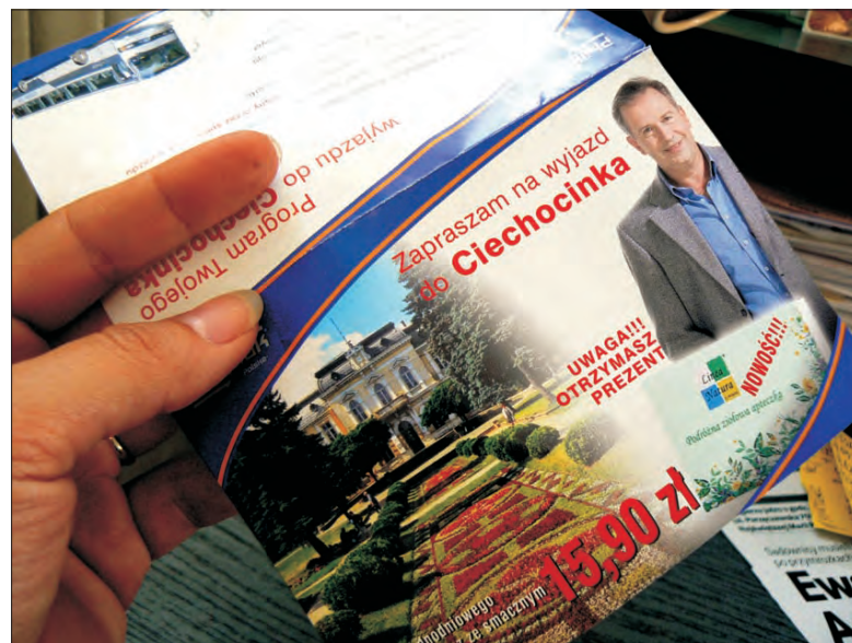
Takie ulotki-zaproszenia na wyjątkowo tanią wycieczkę do Ciechocinka trafiały w ostatnich dniach do skrzynek pocztowych mieszkańców Głowna.

Tematem zainteresowaliśmy się dlatego, że zaledwie przed dwoma miesiącami w naszej redakcji pojawiła się blisko 80-letnia mieszkanka Głowna, która podczas jednego z takich właśnie wyjazdów - wówczas była to wycieczka do Płocka - po wielogodzinnej prezentacji dała się skusić na zakup fotela do masażu za prawie 3 tys. zł. Gdy po powrocie z wycieczki z zakupu chciała zrezygnować, napotkała na trudności ze strony organizatora wycieczki - firmy Beck Imperial z Warszawy.