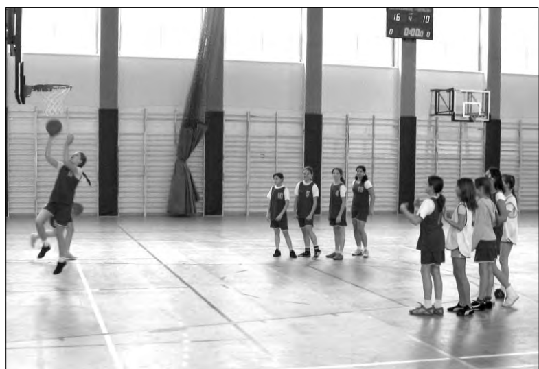
W zmaganiach szkół podstawowych uczennice i uczniowie Szkoły Podstawowej nr 3 z Głowna wywalczyły dziesiątą lokatę, a sportowcy głowickiej „dwójki” zajęli trzynaste miejsce w powiecie zgierskim.