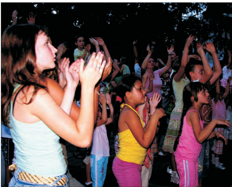
Nie tylko pod sceną, nieborowska biesiada parafialna godna była oklasków.