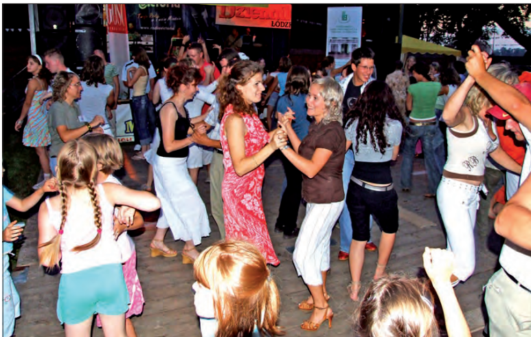
Ostatni element zabawy w czasie festynu w Bąkowie, wspólna zabawa przy muzyce tanecznej.

W klasyfikacji o puchar proboszcza parafii w Bąkowie, na którą składały się punkty zdobyte w rywalizacji w biegach, rodzinnego turnieju wiosek i siatkówce, zwyciężyła reprezentacja Dębowej Góry, drugie miejsce zajęła Bogoria Góma (jeden punkt mniej niż zwycięzcy) a trzecie Bogoria Dolna.