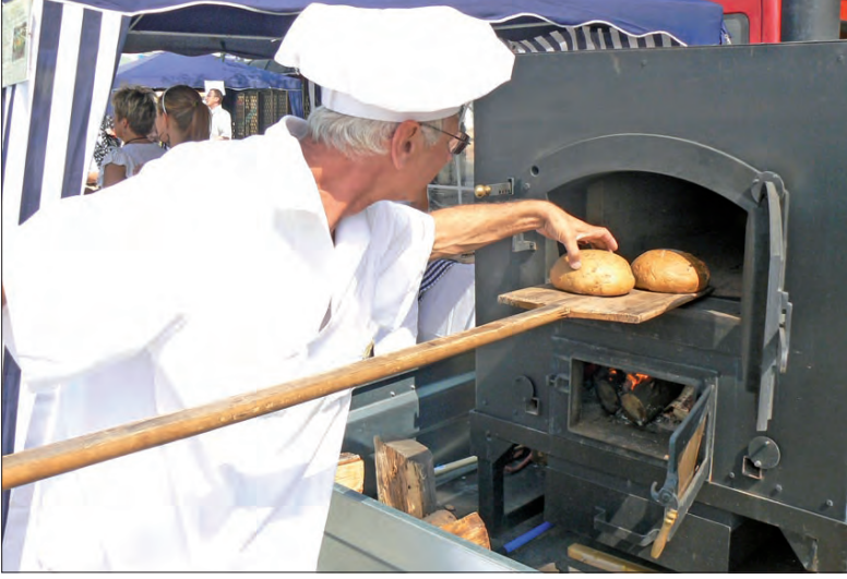
Pieczenie chleba na Nowym Rynku.

dziesięciu lat pracuje jako jeden z szefów kuchni w hotelu Bristol w Warszawie. Okrasa w Łowiczu pokazał, w dwóch odsłonach, gotowanie dwóch potraw: pstrąga z risotto i zdrowych kopytek z pieczonej dyni z sosem ogórkowym. Wiele osób potem mówiło, że gotowanie w telewizji wygląda o wiele lepiej. Kamera często pokazuje zbliżenia potraw w miskach, a tutaj publiczność musiała bardziej polegać na słownym opisie potrawy przez gotującego.