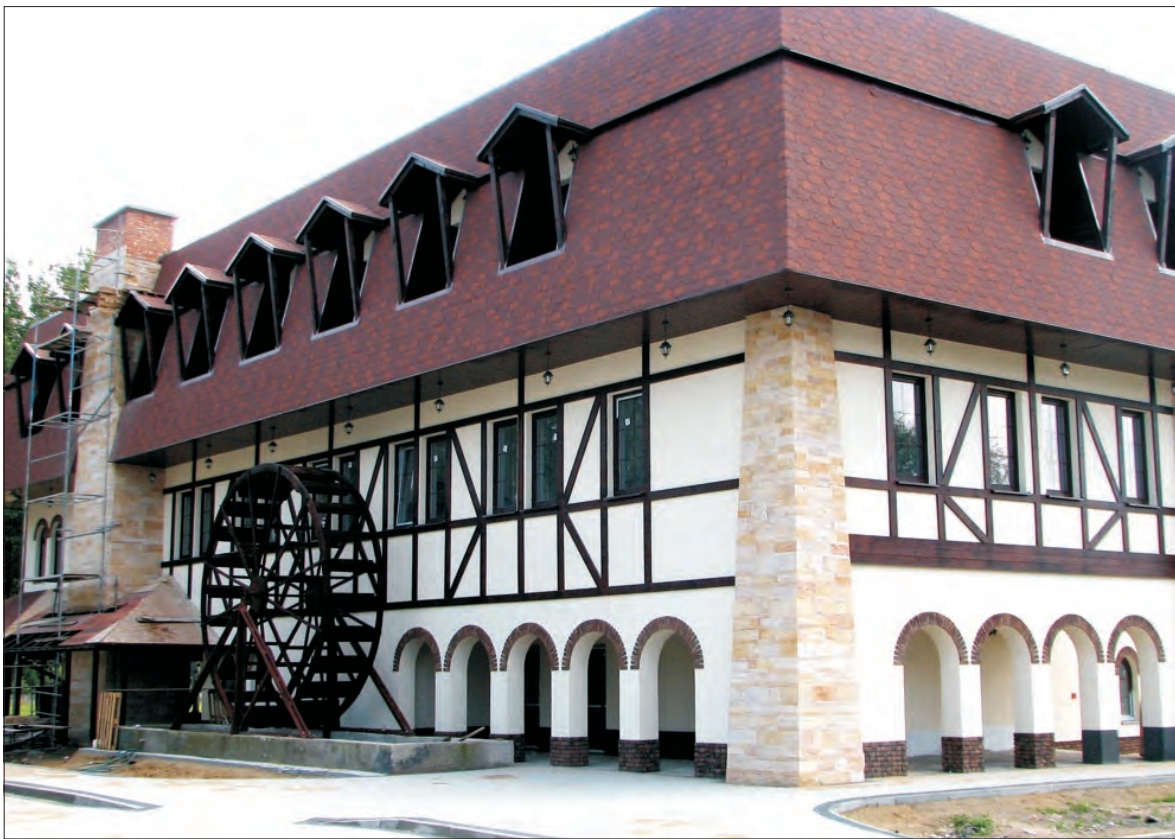
Budynek w niczym już nie przypomina obskurnego żelbetowego klocka. Teraz stał się ozdobą tego miejsca.

Wokół obiektu ułożony został parking z ozdobnej kostki mogący pomieścić około