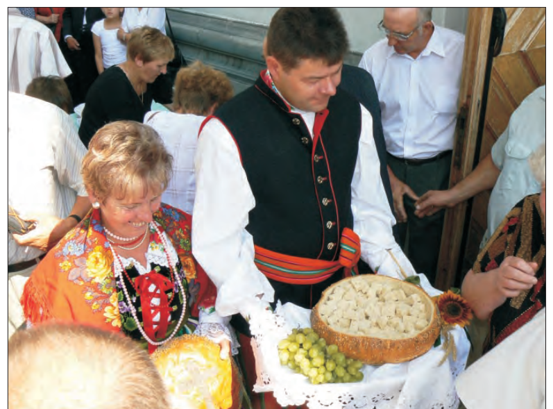
Starosta i starościna dożynek pochodzący z Pilaszkowa.

Przed mszą świętą, która rozpoczęła się w samo południe, wokół kościoła przeszła procesja z wieniem dożynkowym i kapelą ludową. Przy dźwiękach muzyki wieniec został wprowadzony do kościoła i ustawiony bezpośrednio przed ołtarzem. Przed ołtarzem stała też delegacja z chlebami własnego wypieku, które zostały na mszy poświęcone. Jeszcze przed mszą świętą przy kościele ustawione zostały stoły na potrawy dożynkowe. Aż ugięły się od kielbas, kaszanki, szynek, smalcu ze skwarkami, ogórków kiszonych w kamionkowych naczyniach, owoców i warzyw oraz ciast.