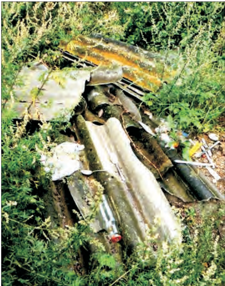
Najprawdopodobniej eternitowe pokrycie dachowe zostało wyrzucone w odludnym miejscu w zaroślach przy drodze Osiny - Szczecin w gminie Dmosin.

W Polsce stał się on szczególnie popularny w latach 70. Wówczas masowo, zwłaszcza na wsiach, pokrywano nim dachy domów i budynków gospodarczych. Jednak w latach 80. wyszło na jaw, że azbest jest materiałem rakotwórczym - powoduje m.in. groźny i długo rozwijający się nowotwór o nazwie międzybłonniak płucnej. Obecnie stosowanie eternitu jest zakazane w większości rozwiniętych państw świata i trwa proces jego usuwania z budynków. Na wymianę eternitowych dachów na inne (np. blaszane bądź dachówki) właściciele budynków mają czas do 2032 roku. Do końca 2005 roku gminy były zobowiązane do zebrania danych dotyczących liczby takich pokryć na ich terenie. Co roku przeprowadza się aktualizację tych danych. W styczniu 2007 roku gminie Dmosin doliczono się w sumie 274 pokryć eternitowych.