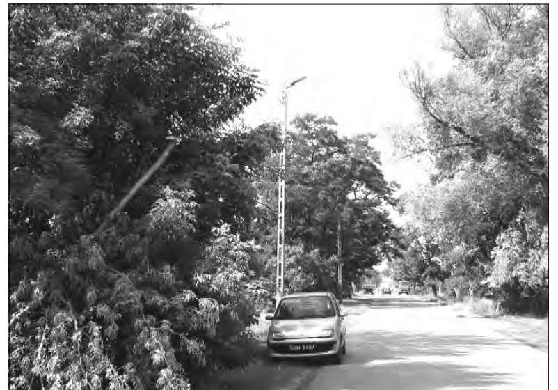
Gałąź złamana przez wiatr kilka dni po burzy usunięta została z drutów. Nie od razu zaświeciły jednak lampy.