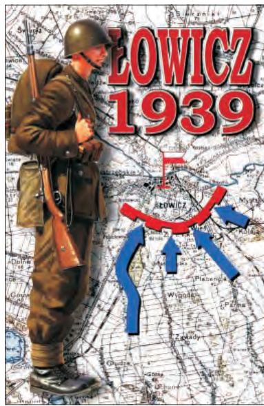
Plakat zapowiadający łowicką rekonstrukcję walk z 1939 roku.

szy w czasie II wojny światowej posłużyli się żywą tarczą z ludności cywilnej (żołnierze 16 DP by uniknąć wśród cywilów ofiar podjęli walkę na bagnety). Podkreślił, że Łowicz doskonale spełnia warunki do przeprowadzenia takich inscenizacji i chciałby, by była to pierwsza, ale nie ostatnia tego typu impreza.