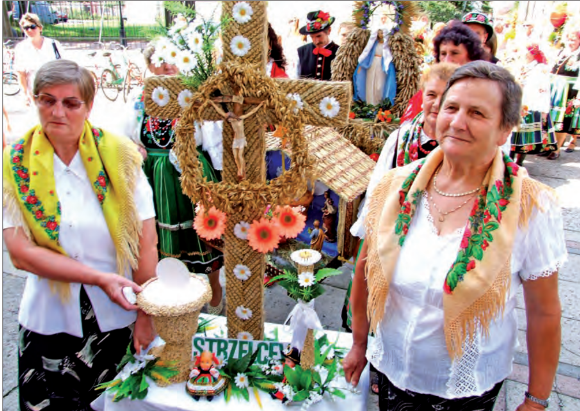
Krzyże, domki, kapliczki, monstrancje wykonane z różnych zbóż - takie wieńce w tym roku można było zobaczyć na dożynkach katedralnych.