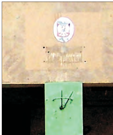
Karygodne, że tak wygląda wiszące na starej „Dwójce” godło państwowe.