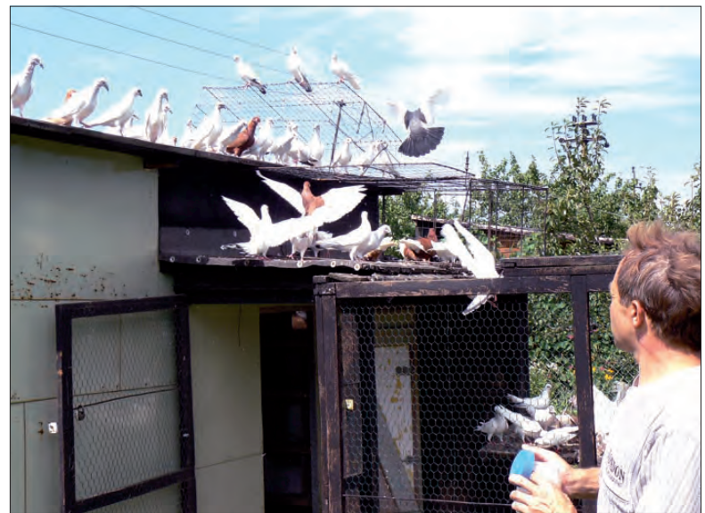
Jedni mają kwiaty, inni gołębie. Ważne, że można realizować tu swoje pasje.

Ważna jest jednak systematyczność. - Umówiłam się z mężem na mieście o 13.00 i nie wiem, czy zdążę - mówi inna nasza rozmówczyni. - Nie mam nawet czasu, aby dziś na działce i pracy jest strasznie dużo - dodaje, dzwigając wiadło pełne świeżo zerwanych pomidorów.