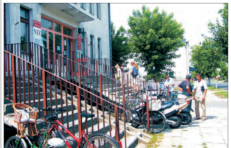
Stan techniczny przychodni przy Kościuszki wymaga dużo pracy i pieniędzy.

Jutro w Częstochowie pielgrzymów powita grupa pięćdziesięciu głownian, którzy przyjadą tam na pielgrzymkę autokarową zorganizowaną przez Miejski Dom Kultury w Głownie. Wróć autokarami w poniedziałek, 27 sierpnia w godzinach południowych. Rodziny witac ich będą tradycyjnie na stacji PKP, a następnie pielgrzymka przejdzie do kościoła św. Jakuba Apostoła, by zakończyć tydzień modlitwy. (ljs)