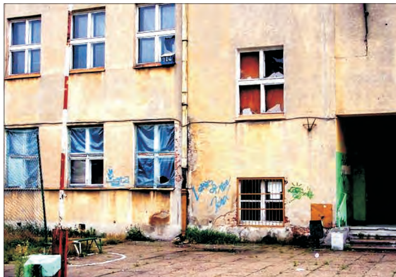
Powybijane szyby, bazyliki na murach, zniszczone kosze i ławki - to robota wandalów, którzy upodobałi sobie to miejsce.

urządzono sobie w rejonie starej „Dwójki”. Byłem tam wraz z sekretarzem miasta - zresztą odwiedziliśmy także tereny innych szkół - i już wydałem dyspozycje, by dyrektorzy tych placówek zadbałi o uporządkowanie terenów szkolnych. - poinformował burmistrz. Jak mówi, pomysł na starą „Dwójkę” ma i prezentowaliśmy go już swego czasu na łamach Więści. Do dziś zdania w tej kwestii nie zmienił. W jego opinii budynek ten powinien być rozebrany, teren uporządkowany i przeznaczony pod boisko.