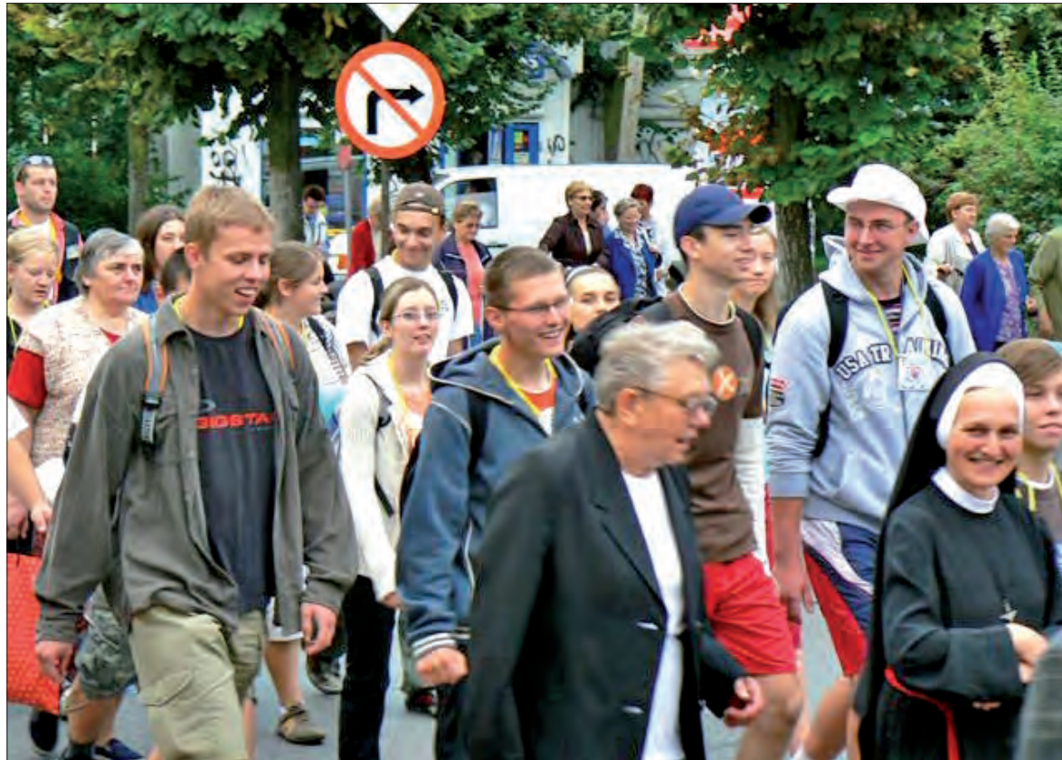
Od samego początku narzucili sobie spore tempo marszu i wesoły charakter śpiewu. Na Łowickiej zęgnali ich wielu głównian - więcej czytaj na str. 3.

■ Oświadczenia majątkowe naszych radnych powiatowych. czytaj na str. 32