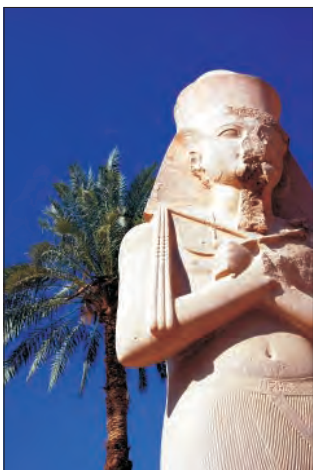
Świątynia w Karnaku.

A Luksor? No cóż, Luksor wspominać będziemy gorąco. Po pierwsze, ze względu na niezwykle miłe przyjęcie w hotelu, w którym się zatrzymaliśmy. Po drugie, z powodu upałów. Luksorskie temperatury dały nam się porządnie we znaki, utrudniając zwiedzanie architekto-