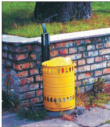
Notoryczne niszczenie koszy na śmieci odbywa się na parkingu przy strykowskiem zalewie.

Przypomnijmy, że firma DRO BUD nie popisała się też przy realizacji innej inwestycji drogowej w gminie Stryków. Drogę w Kolonii Koźle oddała do użytku z opóźnieniem, bo - jak tłumaczyła - w wyniku krachu na rynku surowców próbowała położyć asfalt na gruzie, z którego wystawały śmieci. Za to również ma ponieść finansową karę.