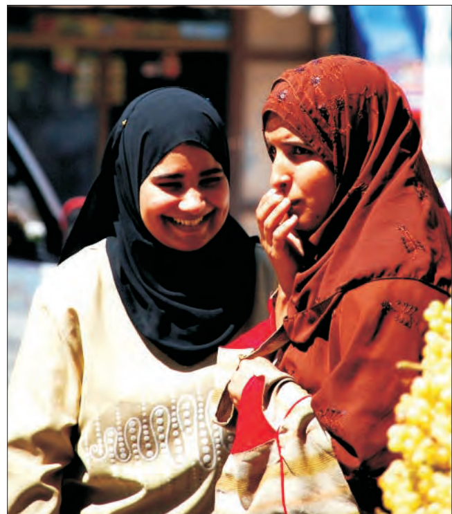
Taki widok to nic dziwnego na egipskich ulicach.