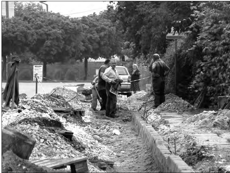
Na ulicy Ułańskiej pracownicy ZUK rozpoczęli odtwarzanie chodników po pracach przy budowie kanalizacji sanitarnej.

Układanie sieci kanalizacyjnej dobiega już końca, roboty są prowadzone obecnie na ul. Jana Pawła II w okolicach ul. Cebrowskiego, czyli na końcu liczącej 1,5 kilometra sieci zaplanowanej w tym roku do budowy. Pelka podkreśla, że prace były dość złożone,