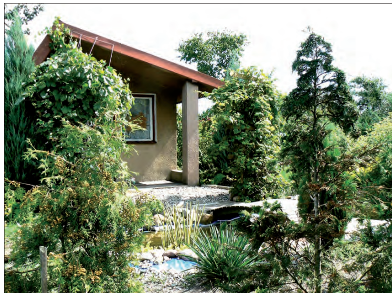
W takiej scenerii naprawdę można się zrelaksować.

Niektórzy działkowicze tworzą z posiadanych przez siebie zakątków prawdziwe dzieła sztuki, z żwirowymi alejkami, mostkami, oczkami wodnymi itd. A znaleźć można także siedzącą na dachu domku sowę, która dopiero przy bliższych oględzinach okazuje się być sztuczna, albo naturalnej wielkości wypchaną małpę, odstraszającą szpaki od drzew czereśniowych. (wcz)