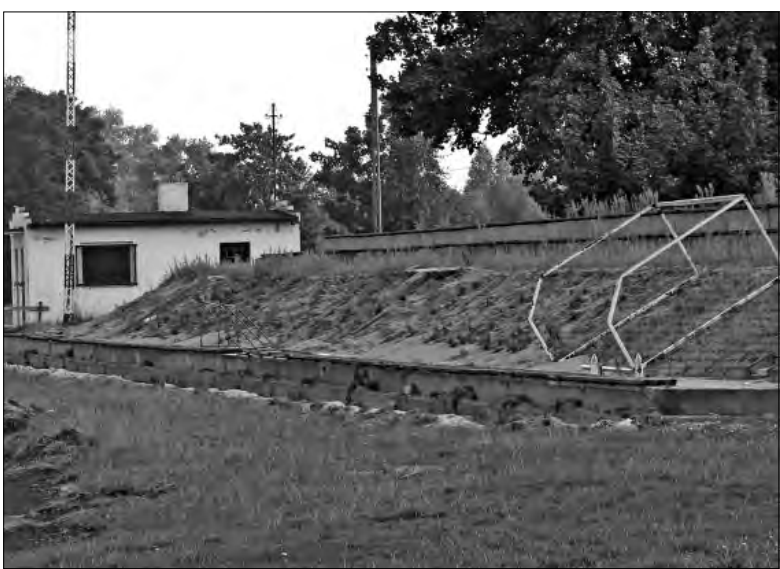
Stare trybuny zostały już zburzone.