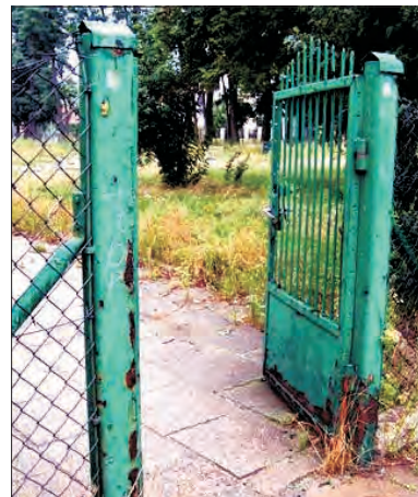
Teren przy starej „Dwójce” stoi otworem dla każdego.