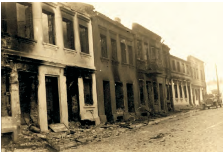
Zniszczona w czasie września 1939 roku ul. Zduńska.