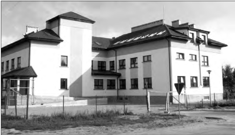
Prace w środku budynku trwać będą do wiosny przyszłego roku.