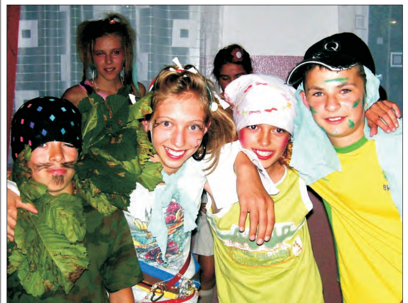
Jak widać, kolonistom nie brakowało pomysłów na dobrą zabawę.