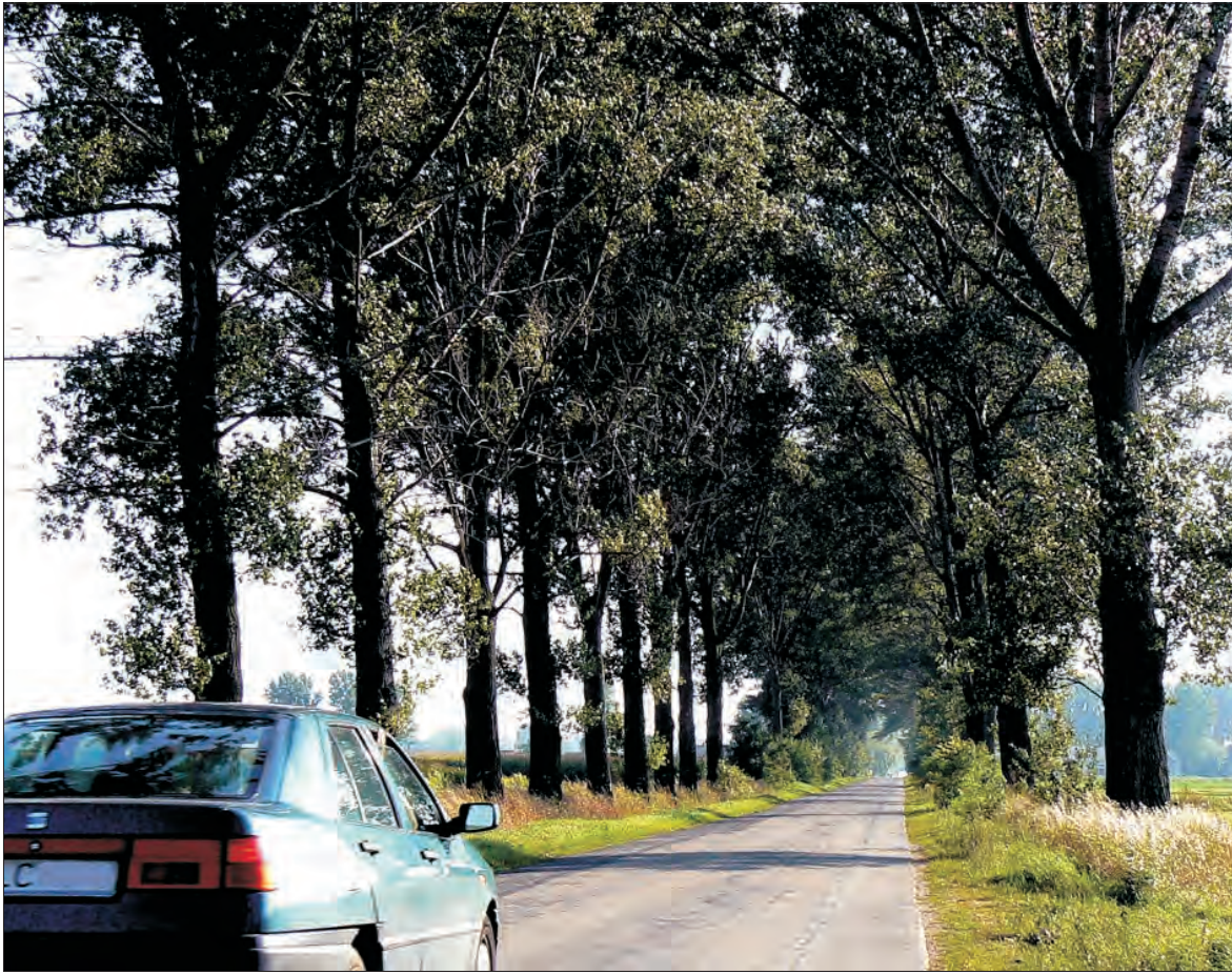
Topole rosnące przy drodze ze Zdun do Wierznowic stanowią coraz większe zagrożenie.