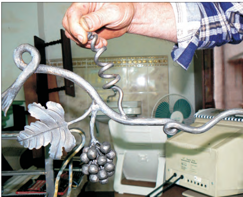
Takie cuda wyczarowuje kowal swoimi spracowanymi rękoma.

Decyzja z 2000 roku nie była jakimś nagłym impulsem. Przez wszystkie lata myślał o powrocie do tego, co kochał od zawsze. - Na początku nie było łatwo, wiele rzeczy trzeba było sobie przypomnieć - mówi. W słuszności decyzji utwierdziła go nagro-