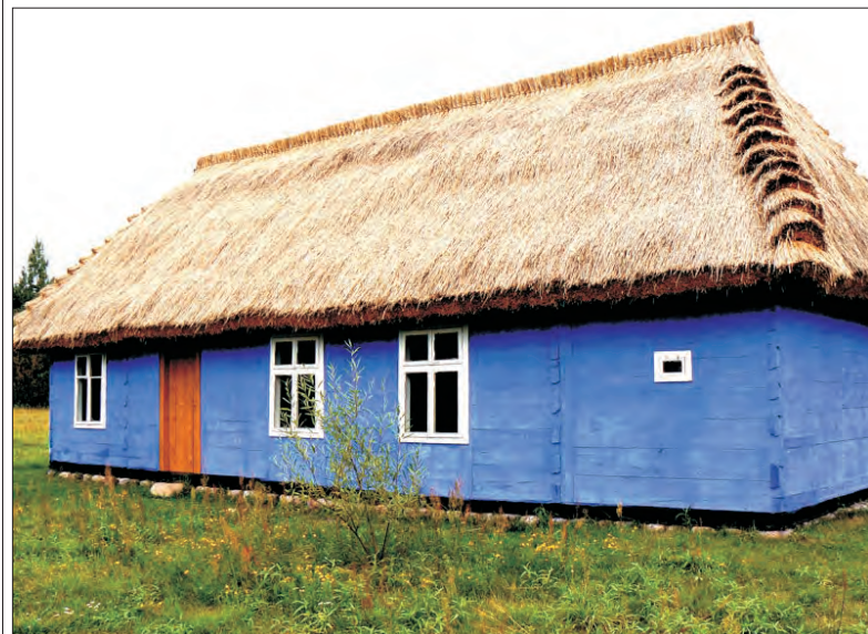
Chata ze Żłakowa Borowego jest jeszcze zamknięta dla turystów.