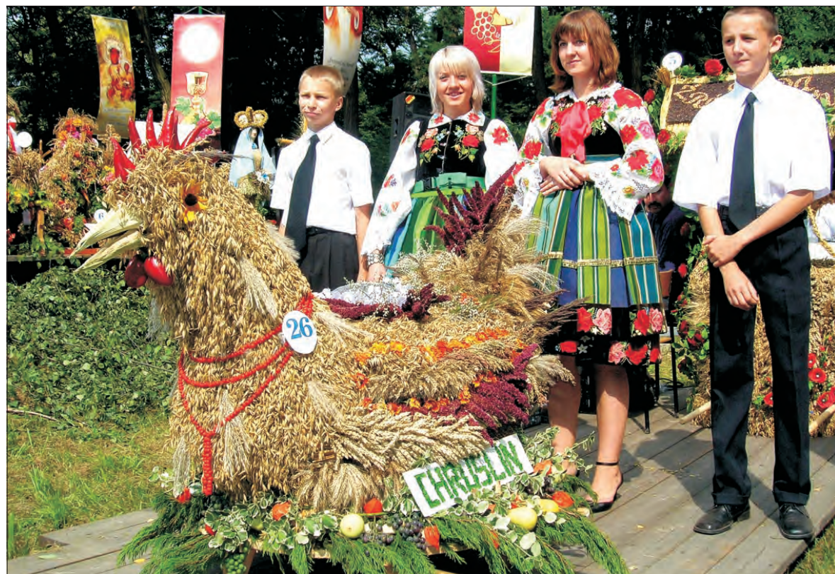
Zwycięski wieniec w konkursie dożynkowym.