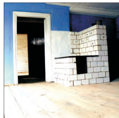
Wnętrze już zostało wykończono, ale czeka jeszcze na skompletowanie wyposażenia.

W planach na ten rok jest ponadto zakup stodoły z tego samego siedliska w Żłakowie Borowym i przewiezienie jej do skansenu. Stodoła stanowiłaby częściowe uzupełnienie zagrody, jaką muzeum planuje odtworzyć. (eb)