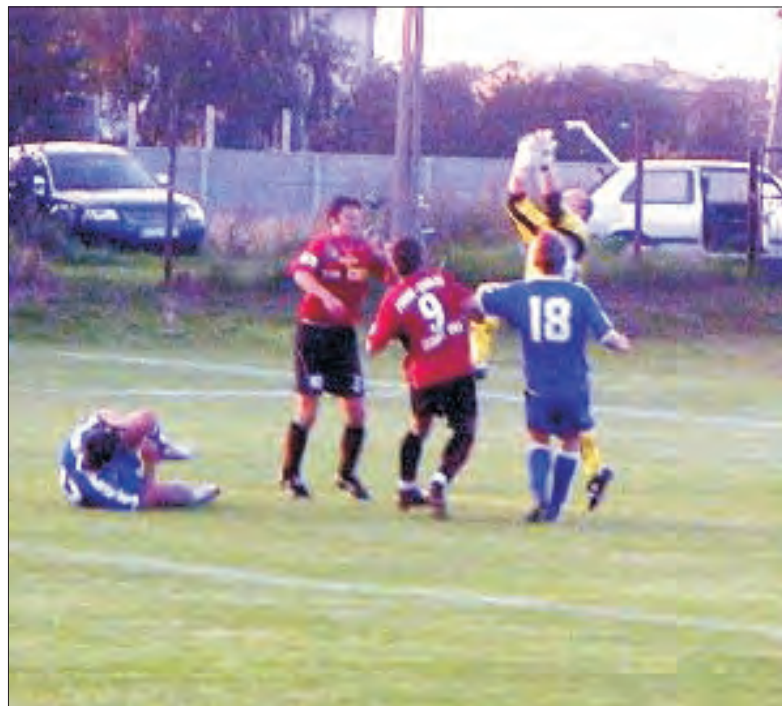
Piłkarze Zjednoczonych Stryków są nadal niepokonani.