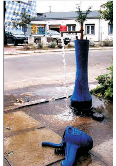
Im większy pobór wody, tym lepsza jej jakość - mówi ZGKiM. Według tej teorii z poniedziałkowej awarii hydrantu przy pl. Łukasińskiego mieszkańcy powinni się tylko cieszyć.

Tylko jak to wytłumaczyć gospodyni domowej, która nie może być pewna tego, czy pranie po wyjęciu z pralki będzie białe, czy może brudne; nie mówiąc już nic o wrażeniach estetycznych tych, którzy chcieliby widzieć w szklankach krystalicznie przejrzystą wodę, a czasami widzą lurę.