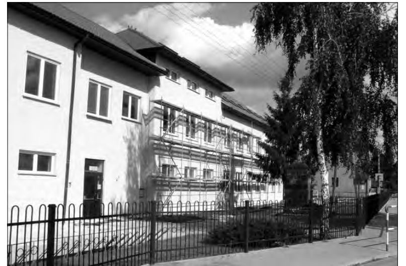
Od strony ulicy elewacja Zespołu Szkół jest już prawie skończona. Od strony boiska zostało jeszcze dużo prac do wykonania.

Zgodnie z umową gmina miała zapłacić Sochaczewskiemu Przedsiębiorstwu Produkcyjno-Handlowo-Usługowemu „Probud” 209.463 zł brutto. (mwk)