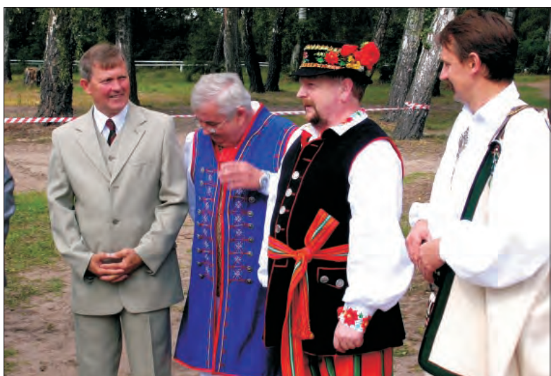
W dożynekach udział wzięli starostwie trzech powiatów: kartuskiego, łowickiego i zakopiańskiego.