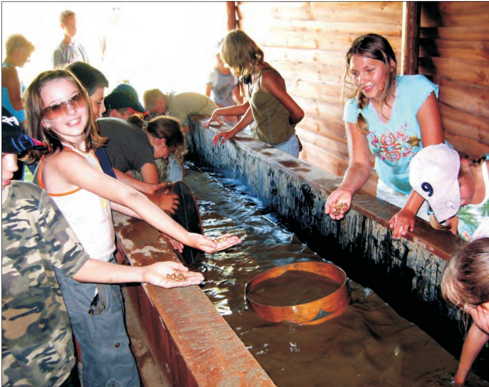
Złoto w Krainie Westernu nie było prawdziwe, ale radość towarzysząca tej zabawie - jak najbardziej.