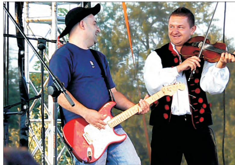
Na góralską nutę zagrała Kapela Pieczarków.

śno. Rywalizowały one m.in. w dyscyplinach: cięcie pnia na czas, toczenie beczki, przeciąganie bryczki.