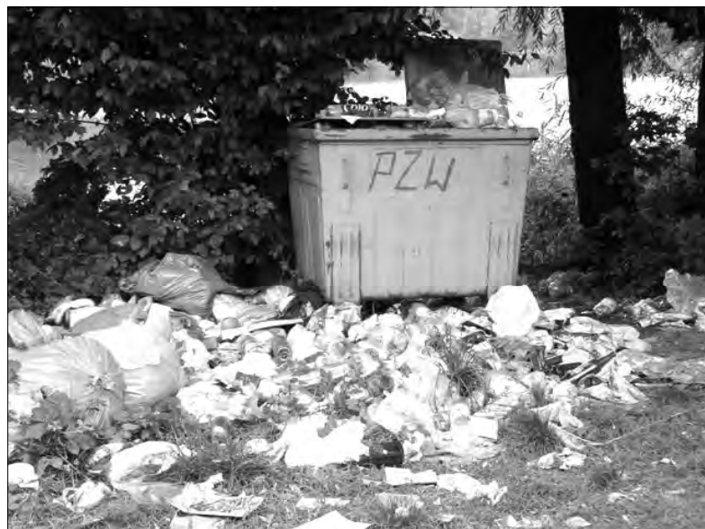
Przepełniony kontener nad zbiornikiem Osiny odstrasza turystów.