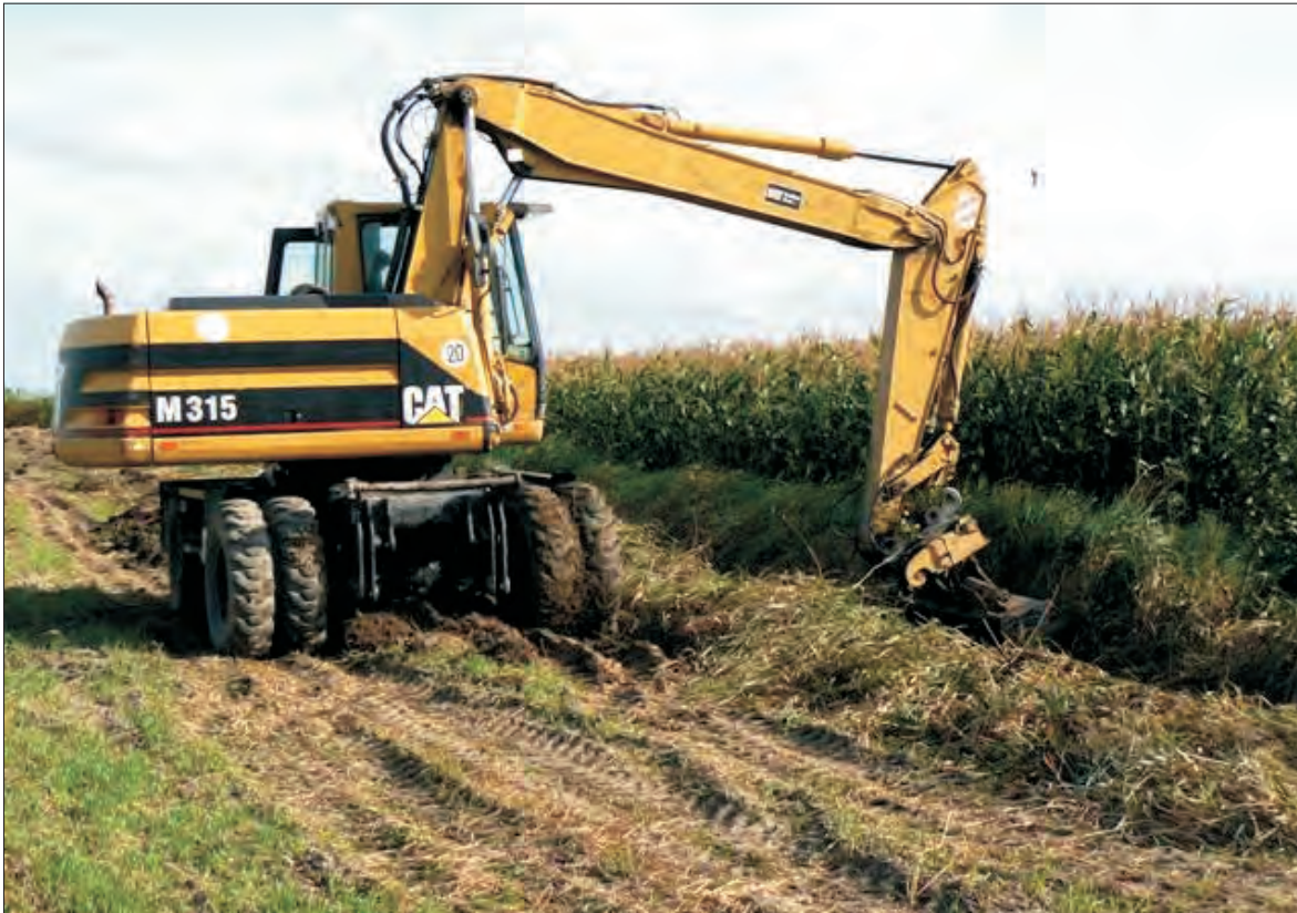
Konserwacja silnie zakrzaczanego rowu w Popówku wymaga użycia ciężkiego sprzętu.