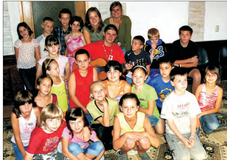
Młodsza grupa kolonii w Spale z trójką opiekunów (u samej góry).