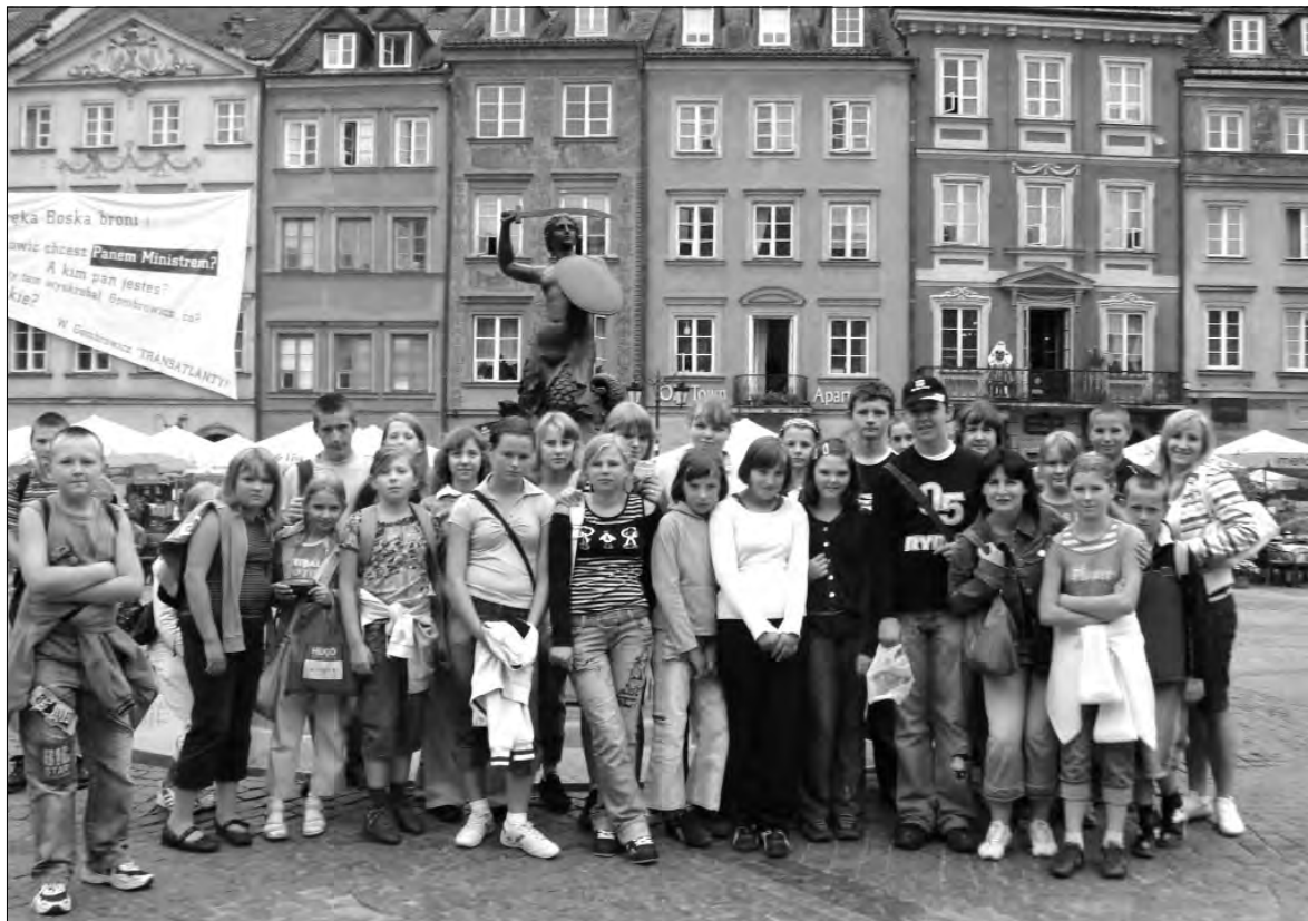
Pamiątkowe zdjęcie na warszawskiej Starówce.