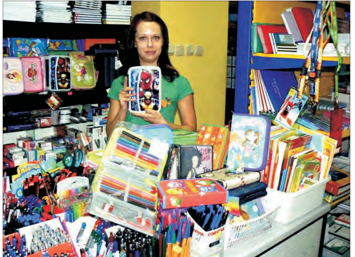
W tym roku najbardziej „trendy” są akcesoria ze Spidermanem.