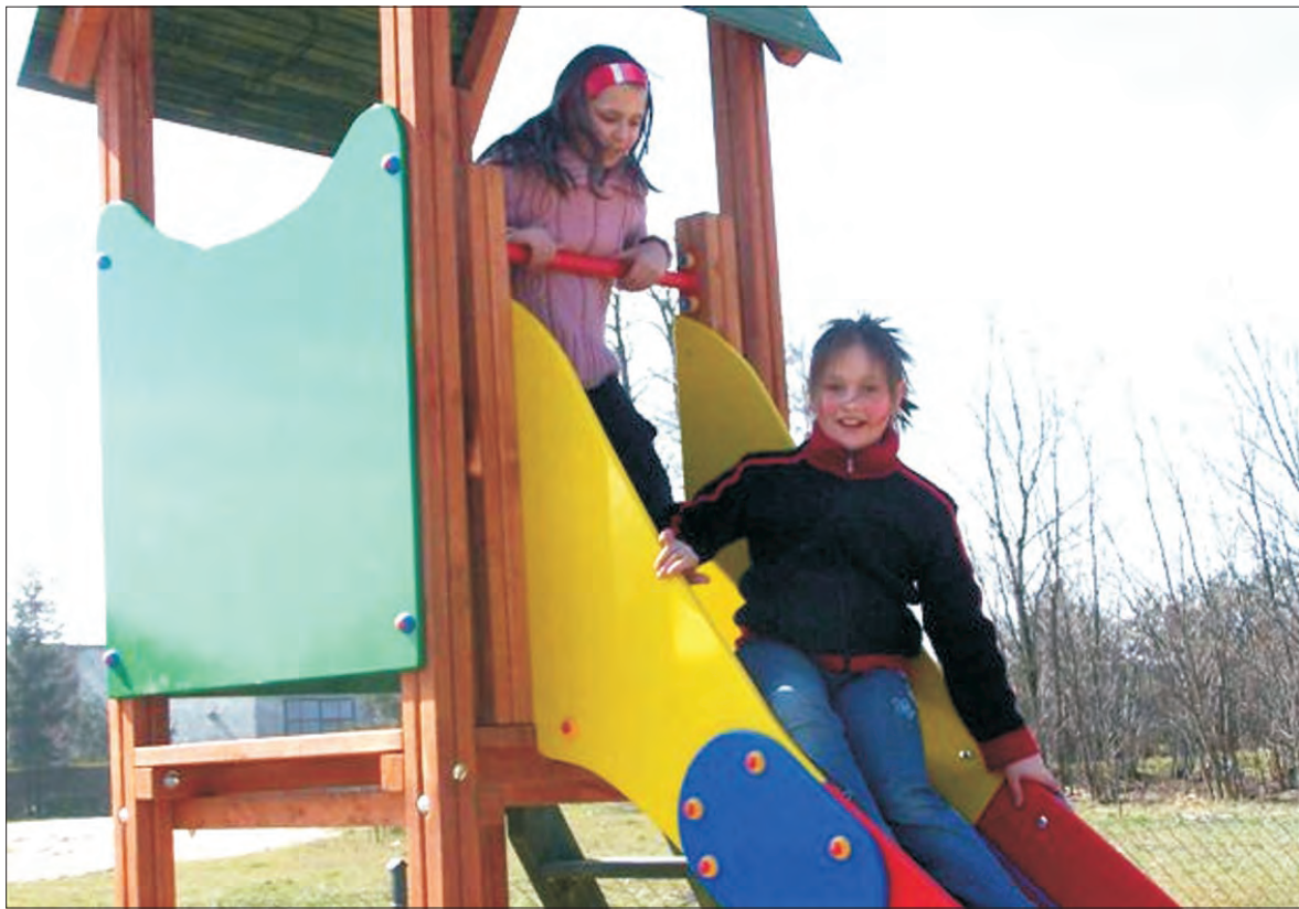
Nową zjeżdżalnię na osiedlu Kopernika przychodzą wypróbować dzieci z całej okolicy. Z regulaminem czy bez - uważać trzeba zawsze.