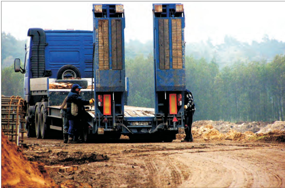
Odcinkiem drogi, z którego nie mogą teraz korzystać mieszkańcy Cesarki, całkowicie zawładnęły maszyny i samochody budujące wiadukt autostradowy.

Przypomnijmy, że w nieciekawej sytuacji znaleźli się też przedsiębiorcy z Cesarki.