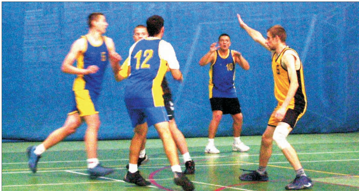
Koszykarze ZS nr 1 im. Cebertowicza Głowno wywalczyli drugie miejsce podczas mistrzostw powiatu zgierskiego szkół ponadgimnazjalnych.