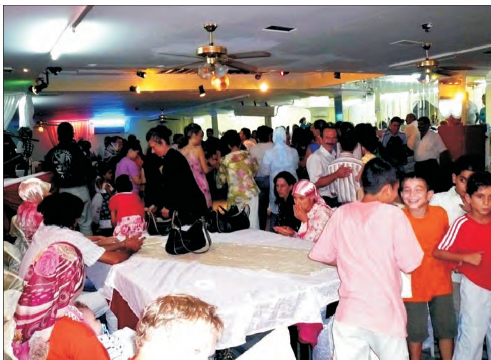
Tureckie wesela w salonie ślubów w Adanie - przy pustych stołach.

Szybko przekonałam się, że tureckie wesela w ogólnej swej oprawie nie wybiega zbytnie poza „nasze” przyzwyczajenia: panna młoda miała na sobie białą suknię, większość mężczyzn pod krawatem, stroje kobiet bardziej zróżnicowane, generalnie jednak odświętne (jedne bardziej „europejskie” w balowych sukniach, wymyślnych kokach, barwnym makijażu; inne - bardziej skromne w obszernych spódnicach i chustkach na głowach). Na podwyższeniu DJ operujący tradycyjną turecką muzyką, a w tłumie gości - kamerzysta.