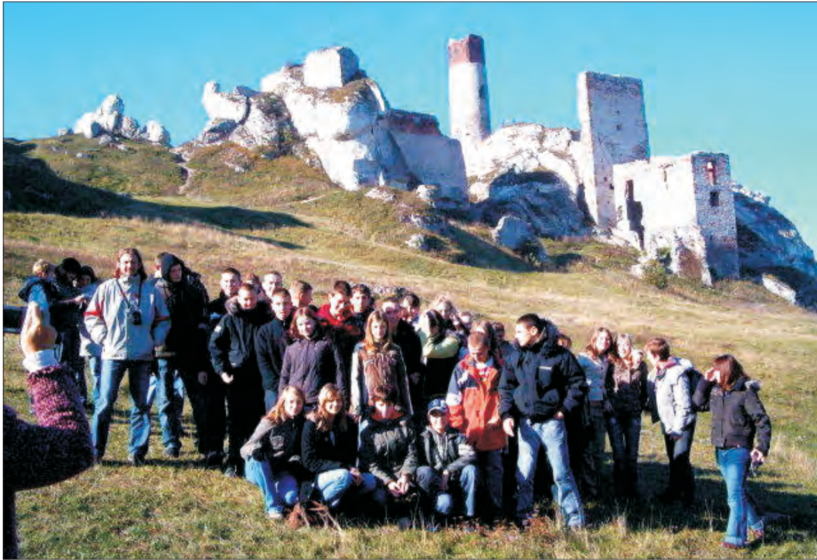
Gimnazjaliści ze Strykowa na wycieczkowym szlaku, w tle ruiny zamku w Olsztynie.