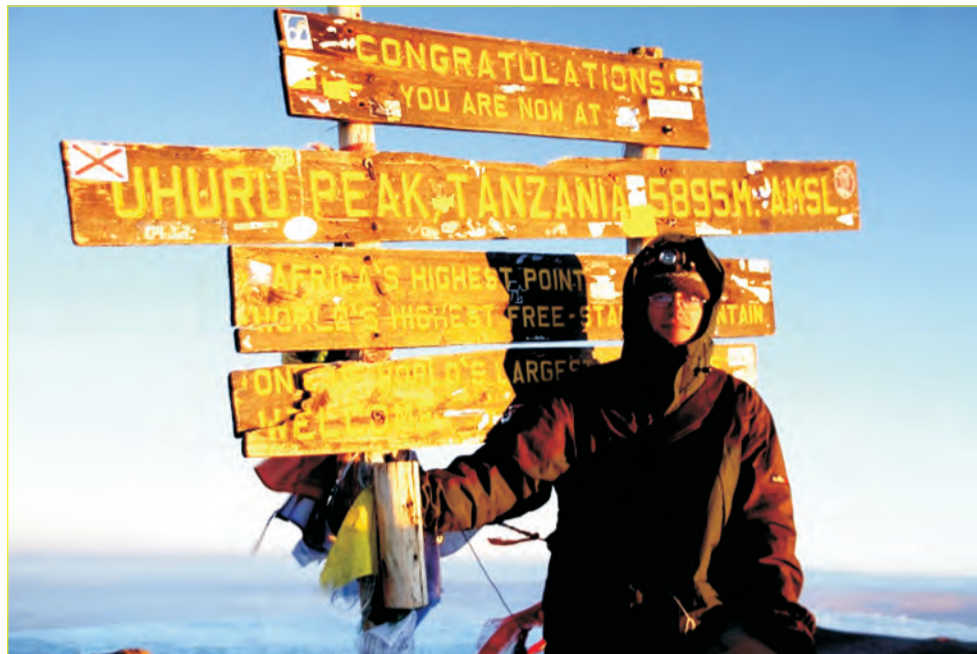
Na szczycie Kilimandżaro.