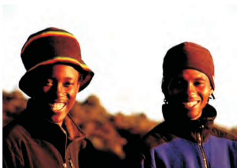
Tragarz i przewodnik - jakże inni niż w Himalajach.

mocników. „Prawdziwy wspinacz” nie wypuszcza się bowiem w góry bez kucharza i tabunu tragarzy przenoszących czasem tak dziwne sprzęty, jak składane stoliki czy nawet prywatne toalety! Przy tym wszystkim ja - idący na górę jedynie w towarzystwie obowiązkowego przewodnika i jednego tragarza - wyglądałem co najmniej dziwnie. Nie mniejszą atrakcją była też moja 20-letnia kuchenka benzynowa. „To przecież sprzęt z muzeum” skomentował jeden z tragarzy. „Ale wciąż działa!” zripostowałem.