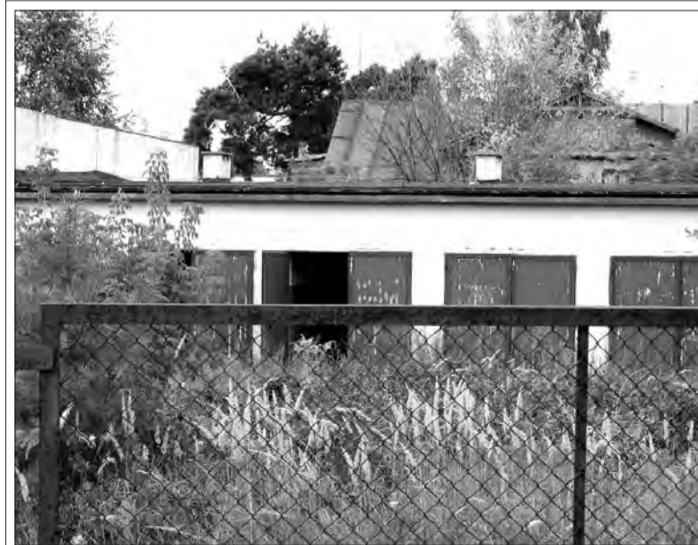
W tym dawnym budynku garażowym powstają 13 mieszkań komunalnych.