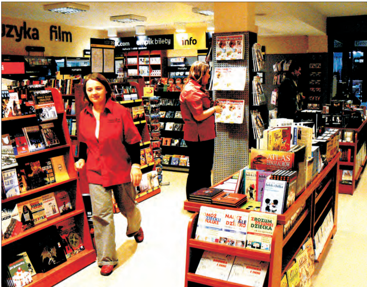
Cicha muzyka w tle i duży wybór książek. Czy Empik przyjmie się w Łowiczu?

W łowickim salonie działa też „empikowy” system kupowania biletów na imprezy muzyczne w całej Polsce, można też będzie bezpłatnie odebrać książki zamówione na stronie internetowej www.empik.com . Klient bez gotówki, ale za to z kartą kredytową lub bankomatową nie tylko może za-