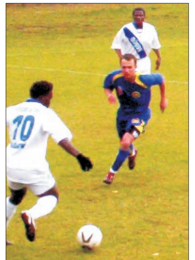
Kibice GOSSO Stali Głowno w kolejnym meczu nie udało się zainkasować przynajmniej jednego punktu.