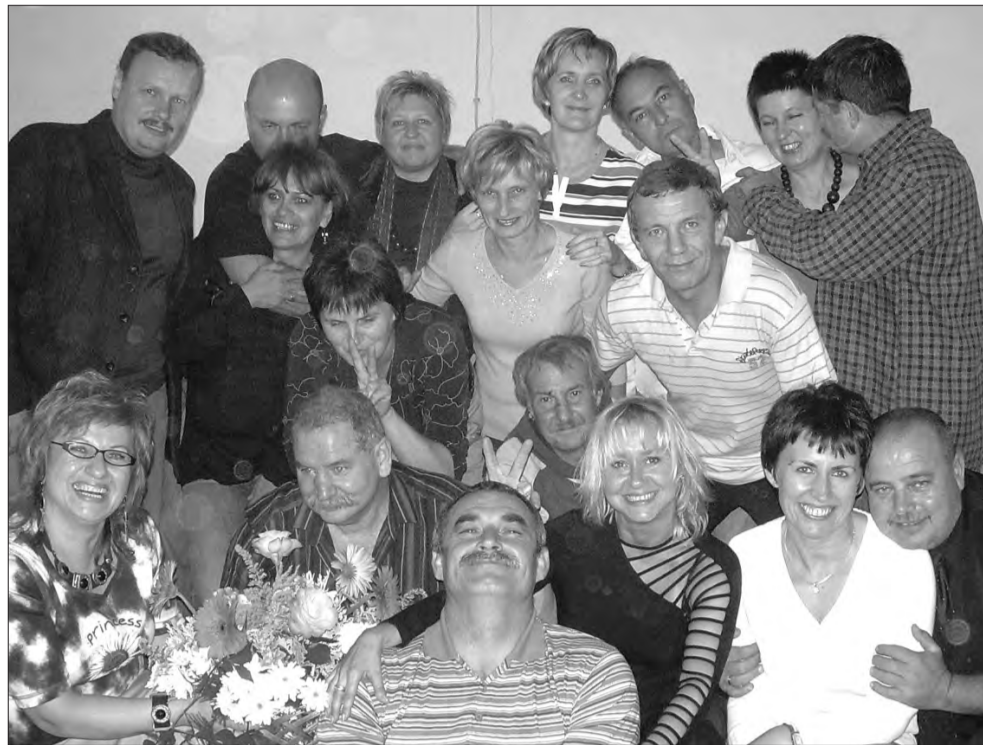
Ciut starsi, ale wciąż młodzi uczniowie „Dwójki”, rocznik 1962.