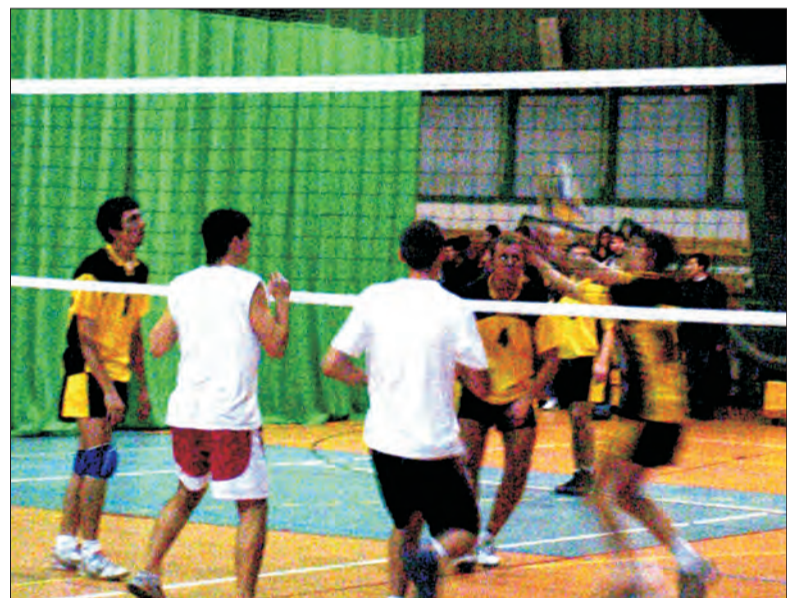
Tym razem głowieńskiej młodzieży (białe koszulki) nie udało się wygrać meczu w drugoligowych rozgrywkach AMŁ w siatkówce.