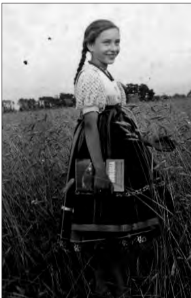
Jako młoda uczennica Liceum Pedagogicznego w Zgierzu.