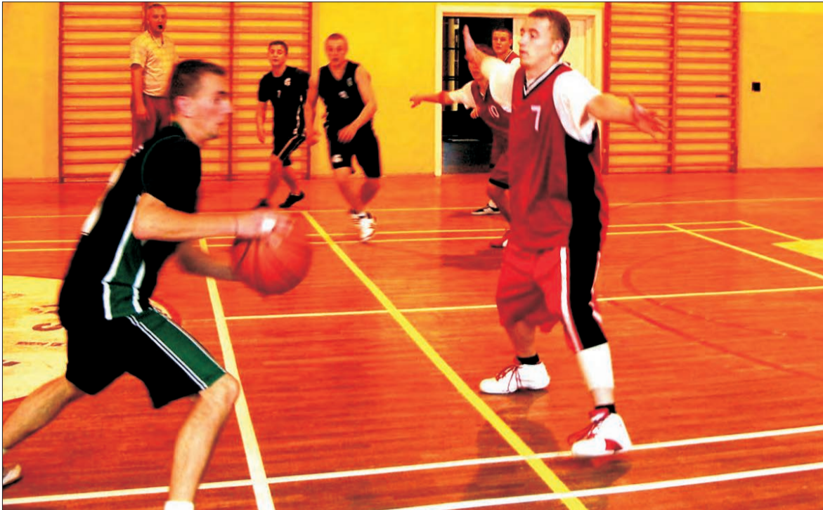
Uczniowie z Bratoszewic (czarne koszulki) zakończyli swój udział w mistrzostwach na meczu ćwierćfinałowym.