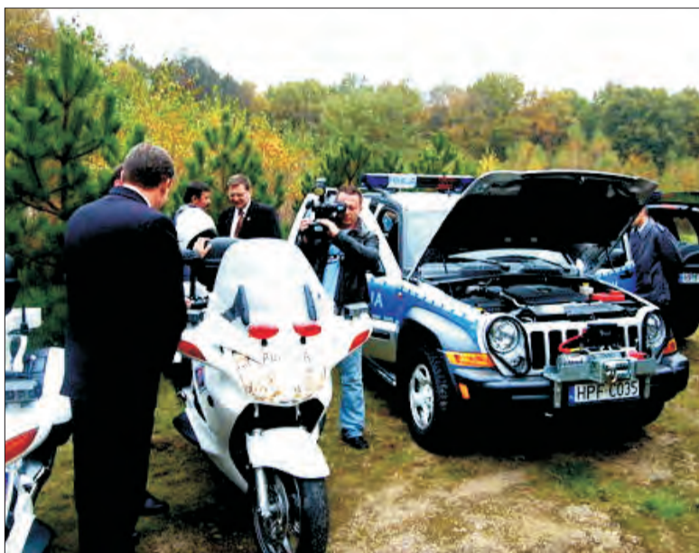
Ciekawym dopełnieniem konferencji w Dobieszku była możliwość obejrzenia najnowocześniejszego policyjnego sprzętu.

Dyskusja toczyła się w kontekście możliwości, jakie w najbliższych latach przyniosą naszemu regionowi środki płynące z Unii Europejskiej w sferze działania policji, straży pożarnej i wojska. Takie możliwo-