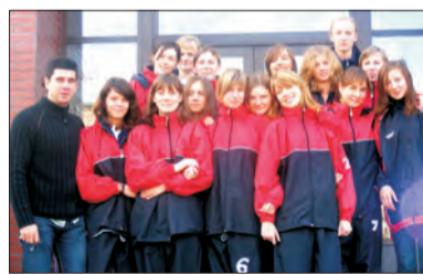
Reprezentacja Gimnazjum Miejskiego im. Jana Pawła II Głowno podczas mistrzostw województwa łódzkiego spisała się jeszcze lepiej niż w mistrzostwach rejonu.