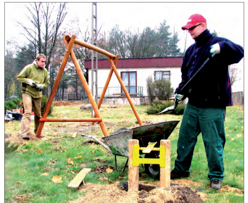
Plac zabaw przy szkole w Jamnie został zamontowany w ciągu jednego dnia, 6 listopada.