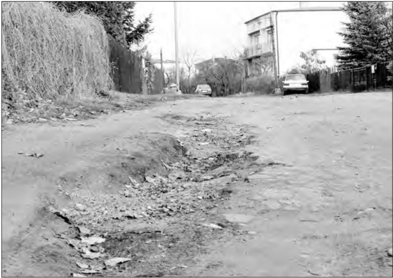
Duże nachylenie ulicy powoduje, że każdy materiał, którym jest ona doraźnie utwardzana, podczas opadów jest wymywany i zmywany w kierunku ul. Bielawskiej.