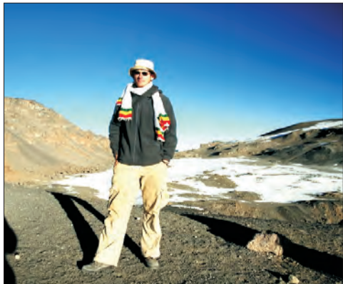
A to już na zejściu na szczycie krateru.

Jak już wspomniałem, wejście na szczyt nie było trudne. Przez pierwsze 4 dni (do wysokości 4600 m) musiałem co prawda walczyć z grypą i strasznym katarem. Na sam atak finałowy na szczęście wydobrzałem i to do tego stopnia, że na szczycie byłem za wcześnie, bo aż godzinę przed wschodem słońca. Warto było poczekać. Widok jaki ukazał się moim oczom zapamiętam jeszcze długo. Cała okolica na wysokości około 3000 tonęła w morzu chmur. Ponad nimi wystawał tylko czubek Mt. Meru (drugiego co do wysokości szczytu Tanzanii) i ja, stojący na szczycie Kilimandżaro - najwyższej góry Afryki (5895 m). Nic dziwnego, że radość z dokonanego wyczynu była ogromna.