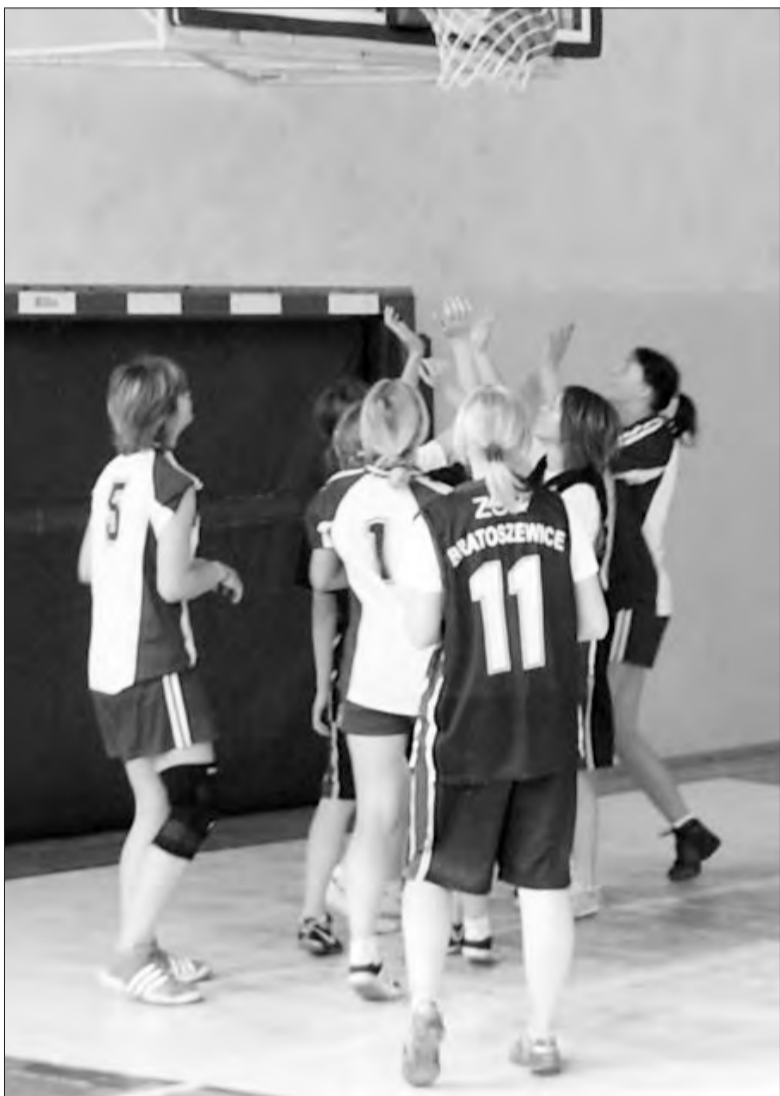
Koszykarki ZSR Bratoszewice nie dały rady rywalkom i odpadły z mistrzostw powiatu zgierskiego po meczach eliminacyjnych.

W pierwszym meczu reprezentacja „ekonomika” rozgromiła Liceum Ogólnokształcące Ozorków 77:18. Ozorkowianki w meczu ostatniej szansy na zakwalifikowanie się