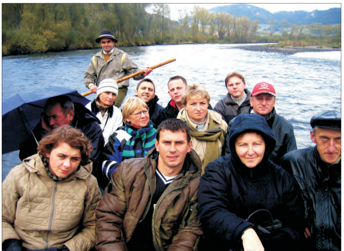
Słoneczny weekend 20-21 października nauczyciele i pracownicy Zespołu Szkół Publicznych w Mąkolicach (gm. Głowno) spędzili na wycieczce w Pieninach. Uczestnicy wyprawy zwiedzili Szczawnicę, gdzie skosztowali tamtejszych leczniczych wód mineralnych, wjechali wyciągiem na Palenicę i zmierzli się z wąwozem Homole. W tak krótkim czasie zdążyli zaliczyć „obowiązkowy” w Pieninach spływ Dunajcem na flisackich tratwach, z których podziwiali malowniczy górski krajobraz. Wysoko nad ich głowami górowały Trzy Korony i Sokolica. (ewr)