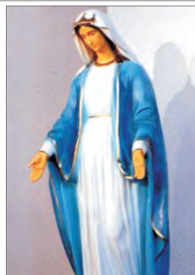
Ufundowana przez parafian figura Matki Bożej stanie w pobliżu granicy dzielnicy Zabrzeźnia w Głownie.

Biskup Andrzej Franciszek Dziuba wizytację parafii kontynuował we wtorek 6 listopada. Tego dnia od rana odwiedził m.in. pensjonariuszy Domu Pomocy Społecznej, dzieci z Przedszkola Miejskiego nr 3 i uczniów Szkoły Podstawowej nr 3. (ewr)