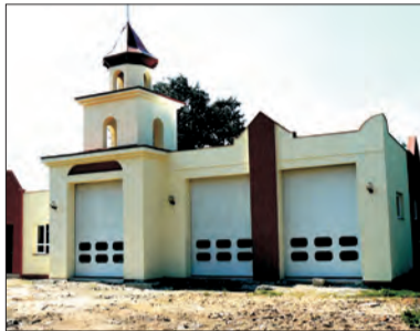
Strażnica OSP w Łyszkowicach już stoi. W przyszłym roku ma szansę rozpocząć się budowa strażnicy w Gzince.

O budowach dróg, strażnicy w Gzince, remoncie stadionu, ociepleniu bloku przy Głowackiego, wymianie przystanków autobusowych i wielu innych inwestycjach planowanych na 2008 rok, mówił na sesji 31 października wójt gminy Łyszkowice Włodzimierz Traut.