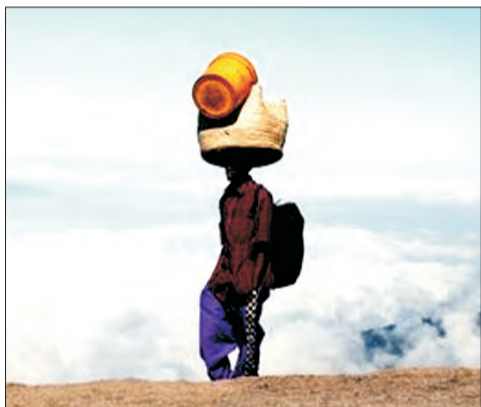
W drodze na szczyt: tragarz idzie tak prosto, że ładunek niesie na głowie.

mocników. „Prawdziwy wspinacz” nie wypuszcza się bowiem w góry bez kucharza i tabunu tragarzy przenoszących czasem tak dziwne sprzęty, jak składane stoliki czy nawet prywatne toalety! Przy tym wszystkim ja - idący na górę jedynie w towarzystwie obowiązkowego przewodnika i jednego tragarza - wyglądałem co najmniej dziwnie. Nie mniejszą atrakcją była też moja 20-letnia kuchenka benzynowa. „To przecież sprzęt z muzeum” skomentował jeden z tragarzy. „Ale wciąż działa!” zripostowałem.