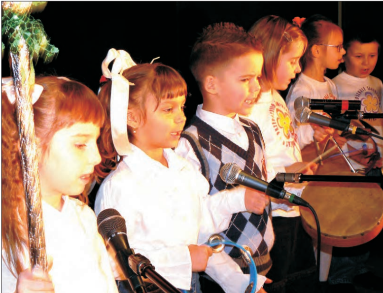
Tak podczas ubiegłotygodniowego przeglądu prezentował się zespół Puzony z Przedszkola Samorządowego w Strykowie.