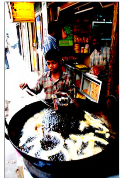
Indyjska egzotyka: chłopiec smażyący banany na ulicy w Delhi na zdjęciu R. Taflńskiego.

Pierwsze zdjęcia Radka z Indii trafiły już do naszej redakcji, a wraz z nimi krótka relacja z pierwszych dni pobytu. Podróżnik pisze, że podróż minęła mu bez większych problemów. Problemy pojawiły się w miejscu, gdy okazało się, że nie udało mu się