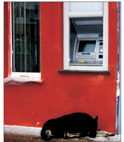
Klientów jeszcze nie ma, pogoda „pod psem”, więc można poleniuchować.