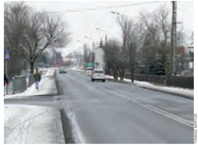
Widok na ul. Warszawską od strony mostu na Bzurze.