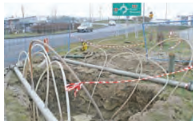
Miejsce awarii wodociągowej w ulicy Jana Pawła II znajduje się na łuku jezdni, który stanowi dojazd do ronda w ul. Prymasowskiej i Łódzkiej.