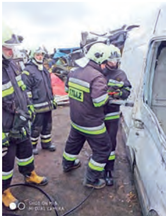
Strażacy z zaprzyjaźnionych jednostek OSP Pilaszków i Rogóźno doskonalili się w ratownictwie drogowym. F

Bielawy | Małżeństwo trafiło do szpitala