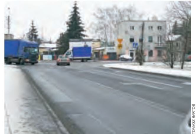
Ulica Bolimowska, widok w kierunku skrzyżowania z ul. Warszawską.