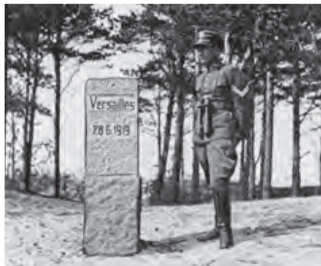
Stup graniczny koło Piaśnicy na granicy polsko-niemieckiej.

Premier Ignacy Jan Paderewski podczas debaty: Ojczyzna nasza wolna nareszcie! Traktat pokojo- wy, podpisany przez Niemców, uznał niepodległość Polski, głów-