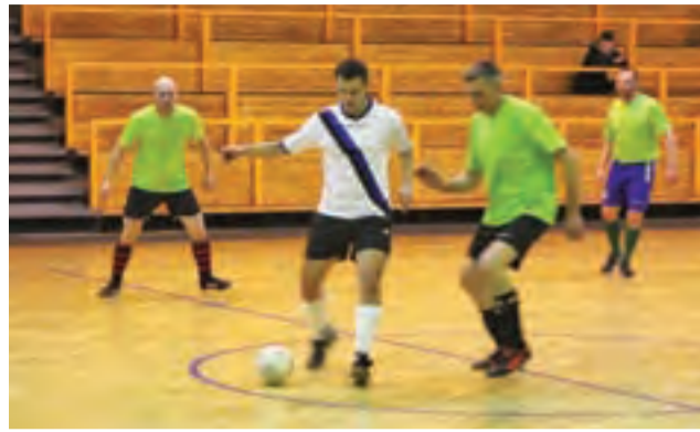
Akacja podzieliła się punktami z Dąbro Łowicz.

■ JURNY GLADIATOR Żychlin – LAKTOZA Łyszkowice 3:6