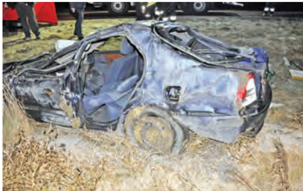
Strażacy ewakuowali kierowcę przez tylne drzwi samochodu.

Jako pierwsi na miejscu zdarzenia byli strażacy z Ochotniczej Straży Pożarnej w Sannikach. Zostali zaalarmowani przez dyżurnego Komendy Powiatowej PSP w Gostyninie, który to z kolei otrzymał zgłoszenie, tzw. format-