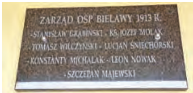
Pierwszy zarząd OSP Bielawy uwieczniony. Na murze strażnicy zamontowano tablicę, którą odsłonięto i poświęcono 3 lutego.

Podczas zebrania sprawozdawczego, które odbywało się 3 lutego w sali konferencyjnej Urzędu