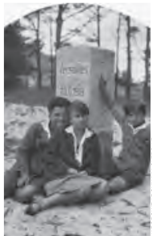
Granica polsko-niemiecka koło Piaśnicy.

tam na zachodzie stanęła pokaź- na i piękna część państwowego gmachu Polski, stanęła mocno, w prawnych podstawach, uzna- na przez wszystkie ludy i narody, przez wszystkie największe świa- ta potęgi. (brawa, głos: A gdzie jest Gdańsk?) [...]. Interes nasze-