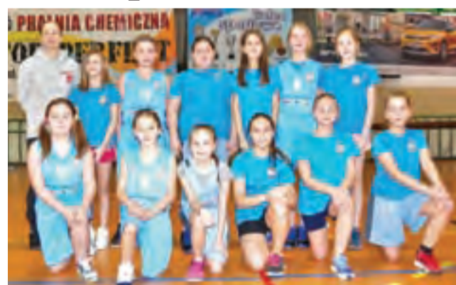
Drużyna żaczek zaczęła ligę od wysokiej porażki, ale nie poddaje się.

1. runda wojewódzkiej ligi koszykówki żaczek U-12: