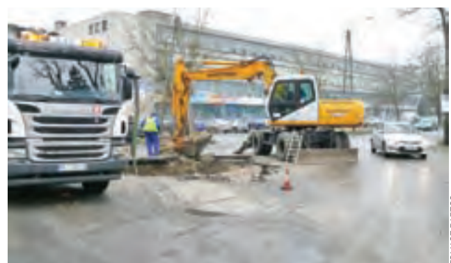
Awaria wodociągowa w ul. Powstańców spowodowała nie tylko brak wody u jej mieszkańców, ale też utrudnienia w ruchu.