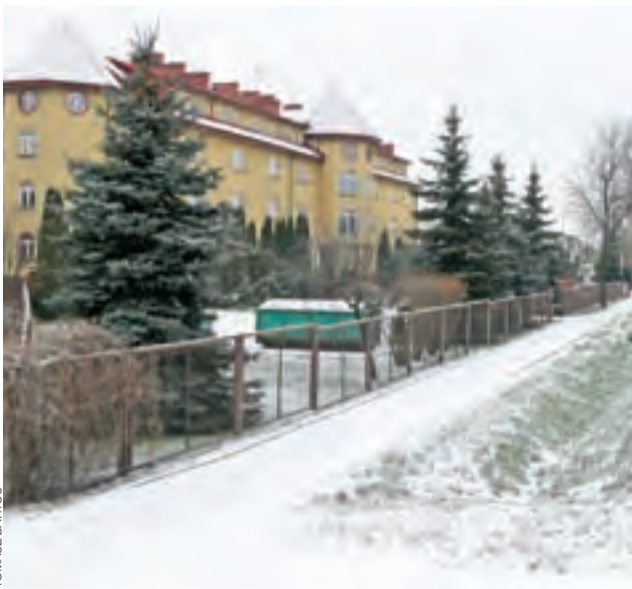
W miejscu ogrodzenia przed Hotelem Lovicz powstanie ul. Wyzwolenia.