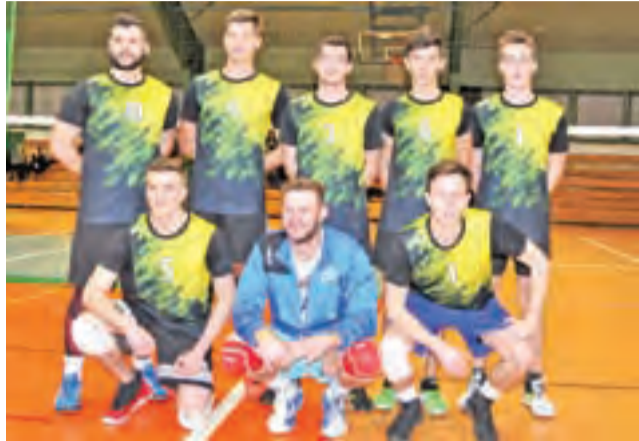
UKS Korabka Łowicz zdobyła tytuł mistrza Łowicza.

Najwięcej emocji przyniosło trzecie spotkanie, pomiędzy I LO Łowicz a Mnichami z Południa Głowno. Niespodziewanie „liceliści” odwrócili losy meczu, dochodząc do głosu w trzecim secie. Zaangażowanie i wola zwycięstwa łowiczanie była tak duża, że Mnichom nie udało się już wygrać żadnego seta. W efekcie I LO zakończył spotkanie wynikiem 3:2 i to była niespodzianka ostatniej kolejki. Mimo porażki drużyna z Głowna zakończyła rozgrywki na miejscu trzecim, a I LO Łowicz na pozycji czwartej. Na piątym miejscu uplasował się OSP Seligów, a tabelę zamknęła UKS Pijarska Łowicz, która pokazała się z bardzo dobrej strony w walce ze starszymi i bardziej doświadczonymi zespołami.