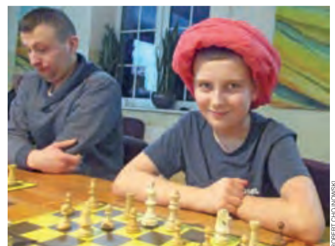
Szachiści też mają poczucie humoru.