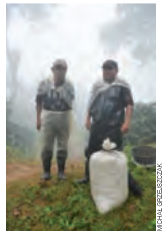
Kraje regionu kojarzone są nie tylko z przestępczością, ale i doskonałą kawą. Plantacje położone są tu nierzadko bardzo wysoko.

kościelnej kruchty, dała mu jedno z czołowych miejsc na listach krajów do podróży nie polecanych. W czasie gdy producenci okrzykniętego mianem kultowego już serialu „Narcos” zarabiają na nim kokosy, mieszkańcy Salwadoru z kokosów mogą co najwyżej napić się soku. Za sprawą gangów zła sława poszła w świat i, choćby stojąc na głowie żonglować tu kowadłami, nijak nie można jej odwrócić. Masowej turystyki w Salwadorem jak nie było, tak nie ma. Acajutla, w której piję pierwszą poranną kawę, sprawia wrażenie wyrwanej z zimowego snu. Życie tętni, ale tylko w okolicach targu i czteropasmowej autostrady prowadzącej tiry z ogromnego