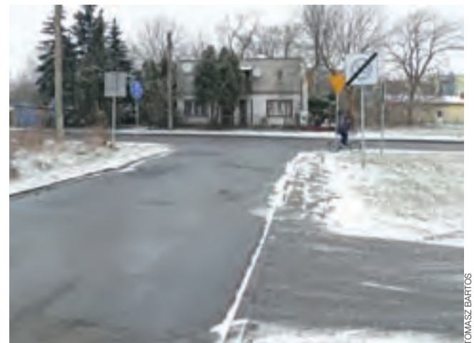
Wyjazd z ul. Nieborowskiej na miejsce, w którym powstanie rondo.