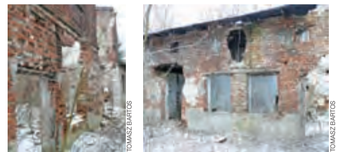
Garaże i stary budynek – do rozbiórki – znajdujące się w śladzie projektowanej nowej ul. Bolimowskiej.