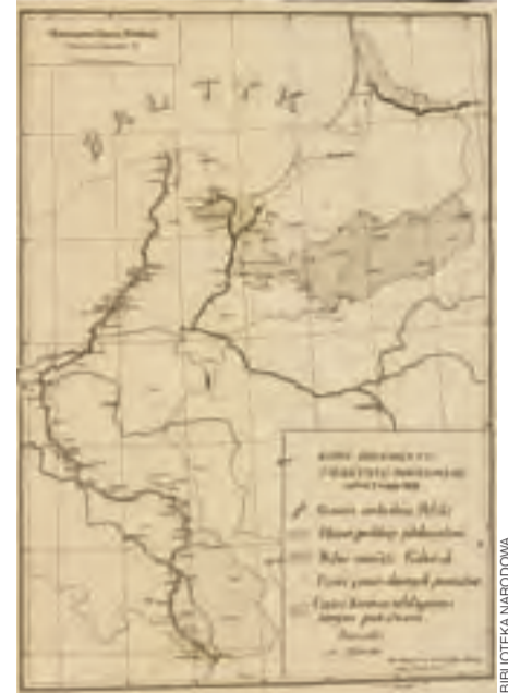
Kopia mapy granicy polsko-niemieckiej z projektu traktatu pokojowego, odrzuconego przez Niemcy 7 maja 1919.