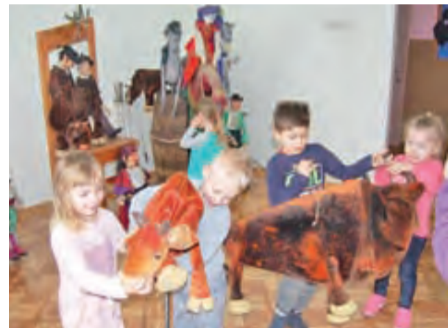
Dzieci chętnie oglądają wystawę lalek i dekoracji z Arlekina.