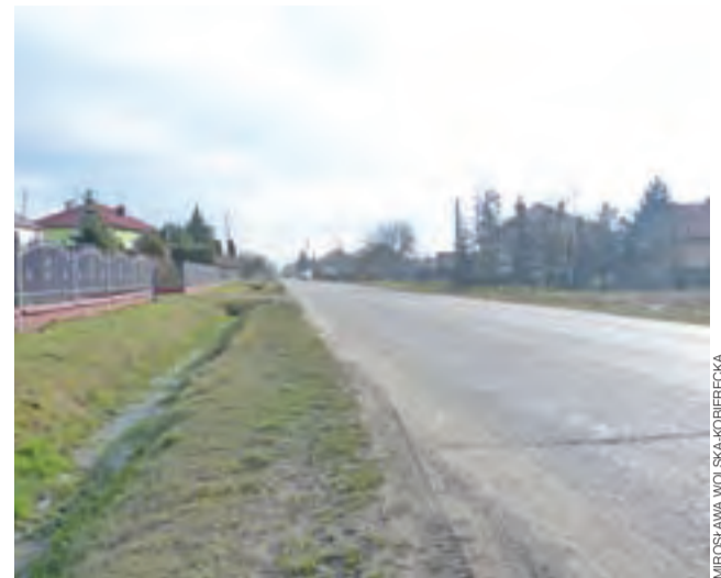
Janowice, położone między Bednarzami a Nieborowem