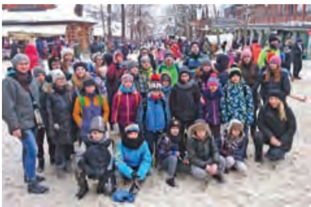
Łowiccy judocy na spacerze na Krupówkach.

Największą atrakcją była oczywiście pobliska stacja narciarska. Z racji tego że warunki śniegowe