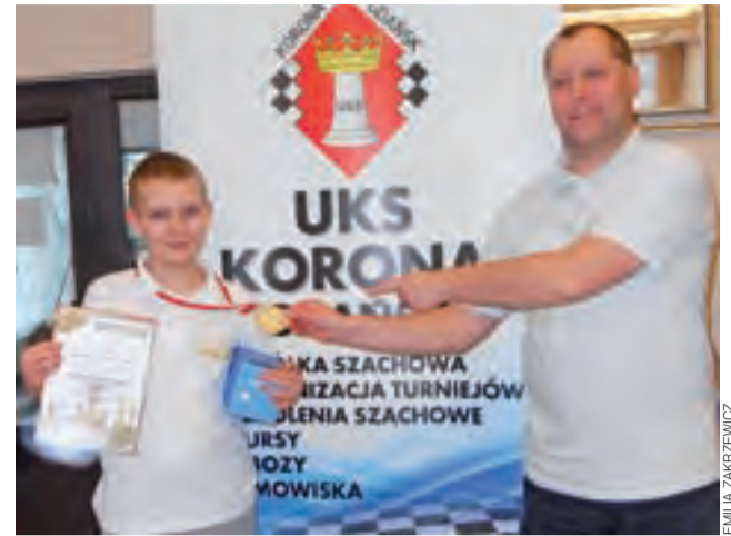
Dobra współpraca na linii zawodnik – trener to podstawa sukcesu.