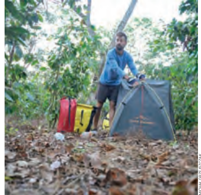
Nocleg w ogrodzie kawowym to jedna z częstych atrakcji podróży po Ameryce Środkowej.

Droga prowadzi mnie gładko przez Sonsonate i przepięknie położone Jezioro Coatepeque, do jednego z trzech, największych miast kraju, Santa Ana. Nazwę wzięło od najwyższego, liczącego 2381 m n.p.m., jednego z trzech mieszczących się po sąsiedzku wulkanów. W mieście mają swoje siedziby uczelnie, zarabia się tam spore pieniądze, a w parkach i na basenach spędza się spokojnie czas. Życie, choć w polskim ministerstwie trudno w to pewnie uwierzyć, płynie tu standardowo przyjemnie. By wyjaśnić jednak, skąd bierze się zła fama kraju, wchodzę rano do pierwszej z brzegu kawiarni i sięgam po pierwszy z brzegu dziennik. „Ciągnęli jego ciało za samochodem!” – krzyczy z pierwszej strony gorący tytuł. Fotografia wymowna: ciało z foliową torbą na głowie i rękoma przywiązanymi do stóp powrozkami leży na ulicy. Z reklamówki wylewa się krew, jeansy starte od bioder w dół. Obok policjant z dochodzeniówki notuje coś w swoim dzienniku. Ktoś widocznie nie zapłacił, ktoś zapomniał o terminie, ktoś myślał, że jest cwańszy. Narcos znów na fali. Komentant wypowiada się na temat zwłok, a fotografie przybliżają wstrząśniętym czytelnikom obraz tego, co mogło się tam wydarzyć. Odwracam stronę. To samo. Kon-