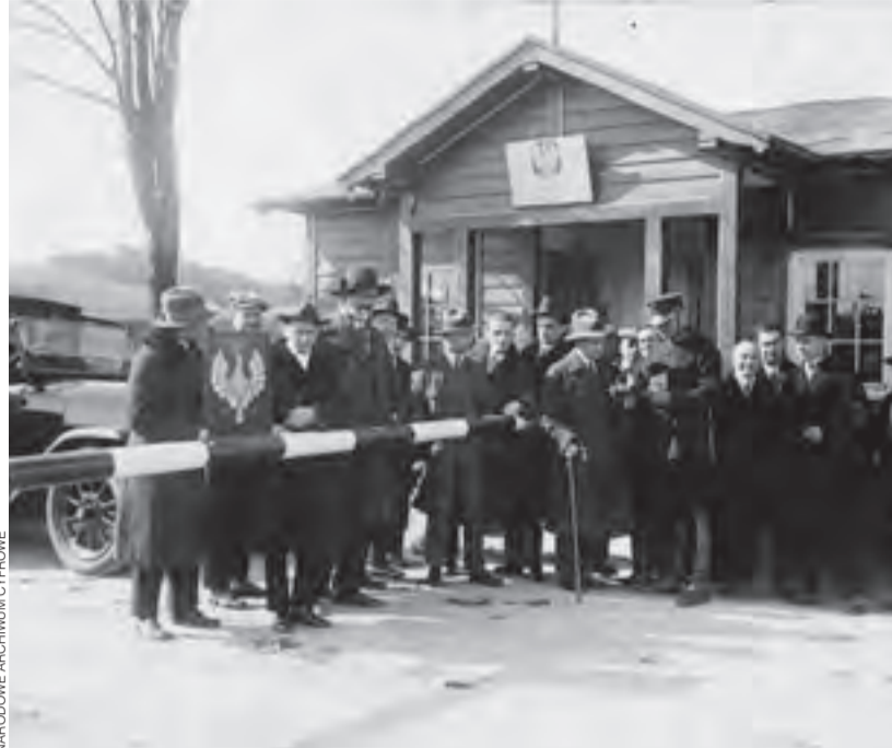
Kolibki. Posterunek Straży Granicznej na granicy Polski i Wolnego Miasta Gdańska.

o emigracji z Polski i jak można się odnaleźć – lub nie – na obczyźnie.