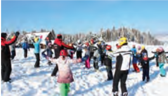
Celem wyjazdu była, poza aspektem religijnym, by aktywny wypoczynek na świeżym powietrzu – jazda na nartach.

Ale celem wyjazdu był też aktywny wypoczynek na nartach.