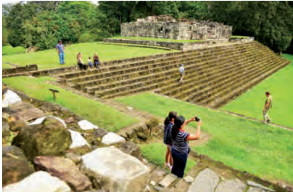
Ameryka Łacińska bogata jest w legendarne, antyczne pozostałości po prekolumbijskich mieszkańcach. Będąc za oceanem warto je odwiedzić.

Na stronie polskiego MSZ, w zakładce iPolak, każdy przed wyjazdem za granicę może zapoznać się z informacjami o kraju czy regionie do którego się wybiera. O Szwajcarii pisze się bardzo pozytywnie, o Irlandii nie pada złe słowo, o Włoszech standard. Nie wspomina się o Szwecji, że niewiarygodnie wzrasta tam od dwóch lat liczba gwałtów, czy o Niemczech i Francji, że stanowią dzisiaj główny cel arabskich terrorystów w Europie. O Czechach czy Słowacji jest niewiele, w szczególności wypraw pieszych, rowerowych, motocyklowych, a także własnym lub wynajętym samochodem”. Kto pisał powyższe wprowadzenie, raczej nie ufa ludziom... Przez zamieszanie z pieczętką i wymuszoną łapówką, pozbawia-