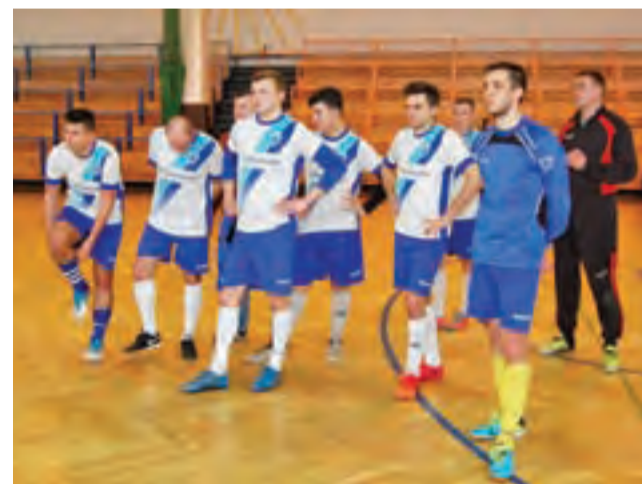
Vagat bardzo dobrze spisał się w turnieju finałowym LZS.

■ LKS Victoria Żytno – LKS Bzura Młogoszyn 2:1