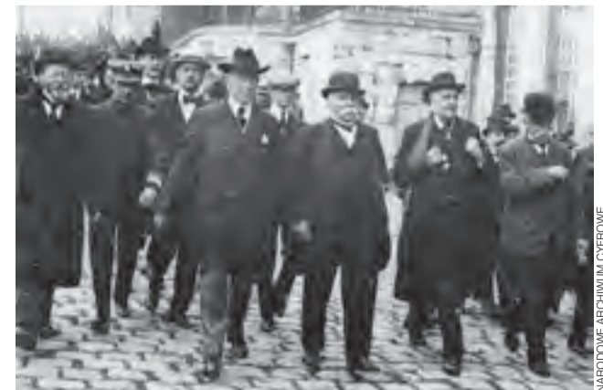
Paryż, 28 czerwca 1919 r. Przedstawiciele państw ententy po podpisaniu traktatu pokojowego: prezydent USA Woodrow Wilson (1. z lewej), premier Francji Georges Clemenceau (w środku), minister spraw zagranicznych Wielkiej Brytanii Arthur James Balfour (2. z prawej).

■ 21 stycznia 1920 – koń- czy się paryska konferencja po- kojowa.