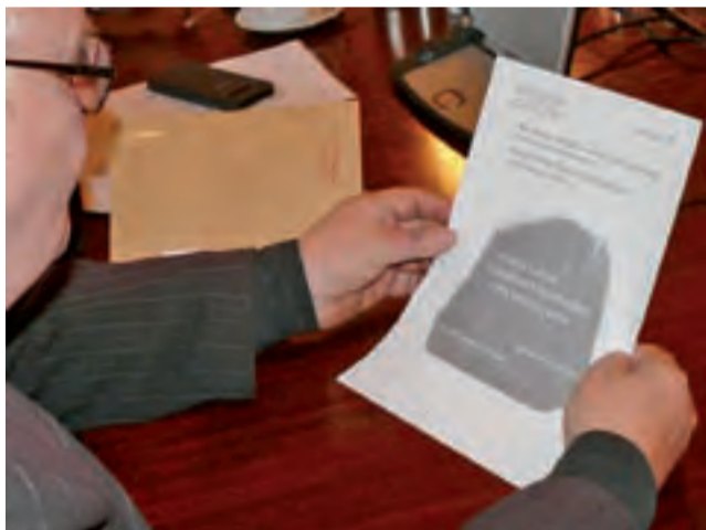
Tak ma wyglądać pomnik pamięci ofiar katastrofy smoleńskiej.

Szczegóły uroczystości jeszcze nie są znane, ale wiadomo natomiast, jak pomnik będzie wyglądał i gdzie zostanie umiejscowiony. Wiadomo też, że może wzbudzać kontrowersje. Po zamieszczeniu informacji na ten temat na naszym portalu www.lowiczanie.info oraz