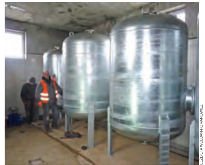
Prace w hydroforni w Sobocie. Potężne zbiorniki o pojemności 2 tys. litrów zamontowano na stacji 15 lutego.

także pod warunkiem, że ma zasądzone alimenty od drugiego rodzica dziecka. Zdarzają się jednak przypadki, że rodzic wychowujący dziecko nie występuje o zasądzenie świadczenia, bo np. umawia się z byłym partnerem na przekazywanie stałych niskich kwot. W innym przypadku, jeśli rodzic otrzymuje najniższe wynagrodzenie i dodatkowo alimenty w wysokości 500 zł, to dochód na jedną osobę w rodzinie przekracza kryterium dochodowe dla przyznania wszystkich wymienianych wyżej świadczeń, w tym wychowawczego (nie może skorzystać z programu 500+). ■