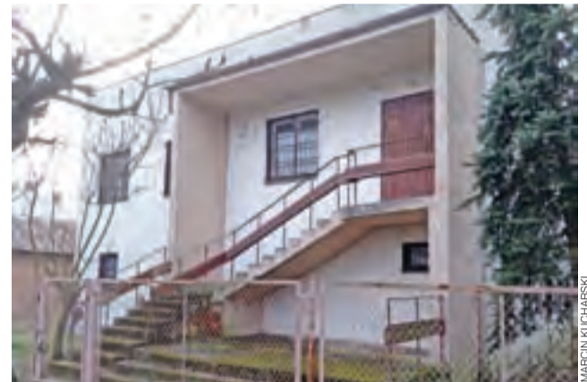
Stary budynek komisariatu w Nieborowie, który policja opuściła kilka lat temu, nadaje się do rozbiórki.

przekaze policji pomieszczenia na zasadach co najmniej 10-letniego użyczenia z możliwością przedłużenia.