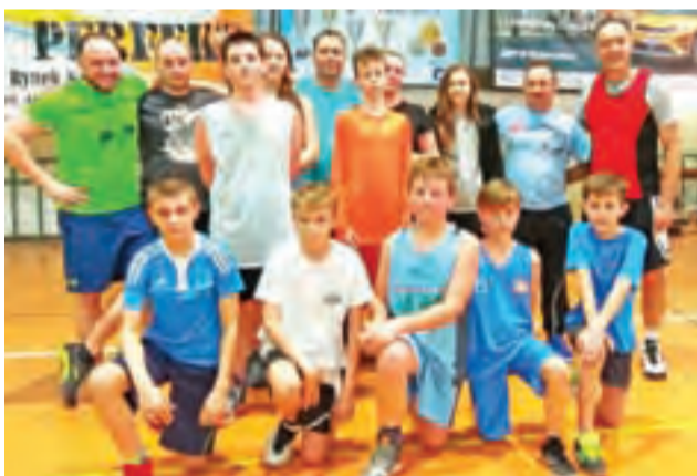
Niedzielne wspólne granie integruje rodziców i zawodników.

Jeżeli finanse i wszystkie rzeczy wokoło będą temu sprzyjały to