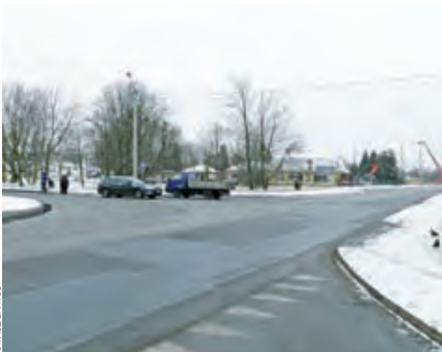
Widok na skrzyżowanie ulicy Warszawskiej z ul. Bolimowską widziane od ul. Gdańskiej