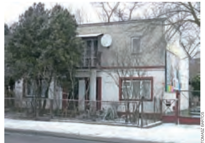
Budynek, który zostanie rozebrany pod rondo w ul. Bolimowskiej.