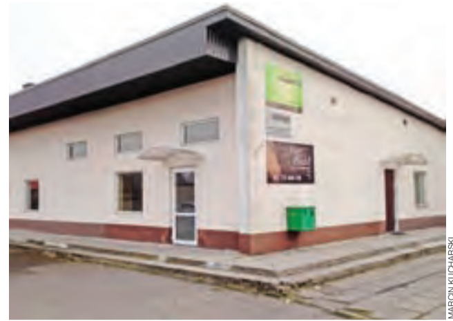
W tym budynku powstanie komisariat policji w Nieborowie.

Umowę na dzierżawę pomieszczeń Gminna Spółdzielnia podpisał z Urzędem Gminy w Nieborowie. Wstępnie padła kwota ok. 30 tys. zł rocznie. Gmina później