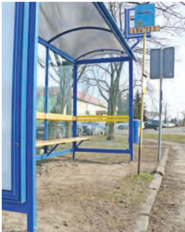
Wiaty przystankowa przy ul. Starzyńskiego na wysokości bloku nr 7. Zacinający deszcz szybko sprawi, że sucha na zdjęciu ziemia zamieni się błoto.