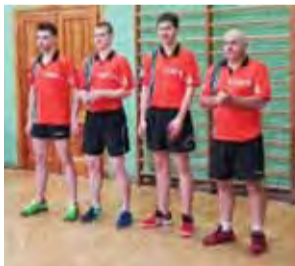
Łowicki zespół tenisistów UMKS Księżak Łowicz.

UMKS Księżak-2005 Łowicz – MUKS Belchatów (s. godz. 9.00), MUKS Belchatów – KKS Pro-Basket Kutno (s. godz. 11.00), KKS Pro-Basket Kutno – UMKS Księżak-2005 Łowicz (s. godz. 13.00).