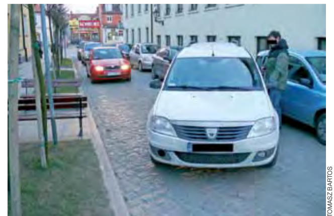
W czwartek, 22 lutego, około godz. 17.00, samochód osobowy Dacia, zaparkowany na chodniku przy ul. Pijarskiej, stoczył się z niego i zatarasował ruch. Pojazd otarł się o inny zaparkowany po lewej stronie ulicy, ale nie wyrządził mu szkody. Szybko za autem ustawiono się kilka samochodów, których kierowcy zaczęli trąbić. Po kilku minutach na miejscu pojawił się kierowca Dacii, który zaktopotany stwierdził, że najprawdopodobniej zerwała się linka od hamulca ręcznego. Wsiadł do auta i odjechał. tb