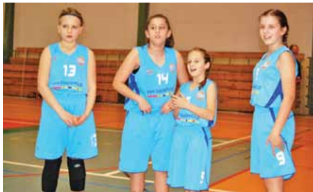
Młodziczki Księżaka nie miały powodów do radości po turnieju w Skierniewicach.

W drugim meczu, w starciu z gospodyniami, łowiczanki były bezradne. Dopiero w czwartej odsłonie, gdzie może zagrać już dowolna piątka zawodniczek, była wyrównana walka. Patrząc na wyniki kwart widać wyraźnie, że łowiczanki mają nierówny skład