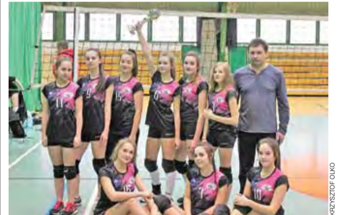
Siatkarki z Domaniewic wygrały rywalizację powiatową.

Sport Szkolny | Miejska mini siatkówka chłopców