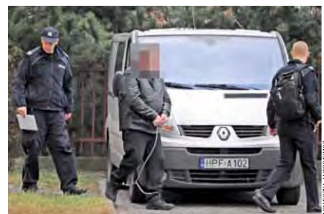
Obywatel Łotwy do sądu doprowadzany jest konwojem z zakładu karnego.

w niewielkiej odległości przebiega rurociąg paliwowy, na miejscu zabezpieczono je w ilości aż 8 tysięcy litrów. Za kradzież z włamaniem oraz niszczenie mienia Łotyszowi grozi do 10 lat więzienia.