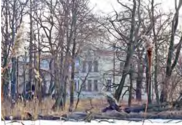
Dwór w parku w Psarach. Stan na 28 lutego.