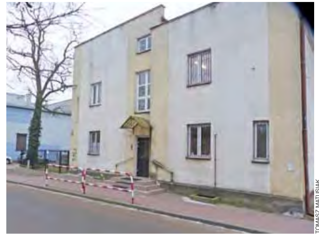
W dawnej siedzibie ZGM przy ul. Nowej od początku lutego mają swoją siedzibę Zarząd Zlewni oraz Nadzór Wodny w Łowiczu.

Krótką wizytą przy Nowej wystarczy, by zauważyć też braki w wyposażeniu – na pierwszy rzut oka widać, że brakuje krzesel i sprzętu komputerowego. Pracownicy nie mają służbowych