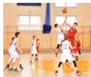
O wyniku meczu z ŁKS-em zdecydował świetny początek.

Mecz rozegrano w sobotę, 17 lutego, w hali sportowej ZSP nr 3 na ulicy Powstańców, która jest bardzo dobra na takie imprezy. Podopieczni trenerów Dragana Ristanovića i Macieja Siemieniuczka spotkanie z ŁKS-em zaczęli bardzo dobrze i po 5. minutach prowadzili 15:2. Taka przewaga dała młodym koszykarzom pewność siebie. Nasz team grał bardzo dobrze w obronie i szybko w ataku. Łodzianie po słabym początku zaczęli odrabiać straty, ale zdołali dojść Książaków tylko na 9-10 oczek. Po chwilach przestoju nasi gracze znów zdobywali kilka punktów i powiększali przewagę. Najlepiej młodzi koszykarze spisali się w czwartej kwarcie. Grali bardzo skutecznie i praktycznie każdy zawodnik punktował dla swojej ekipy.