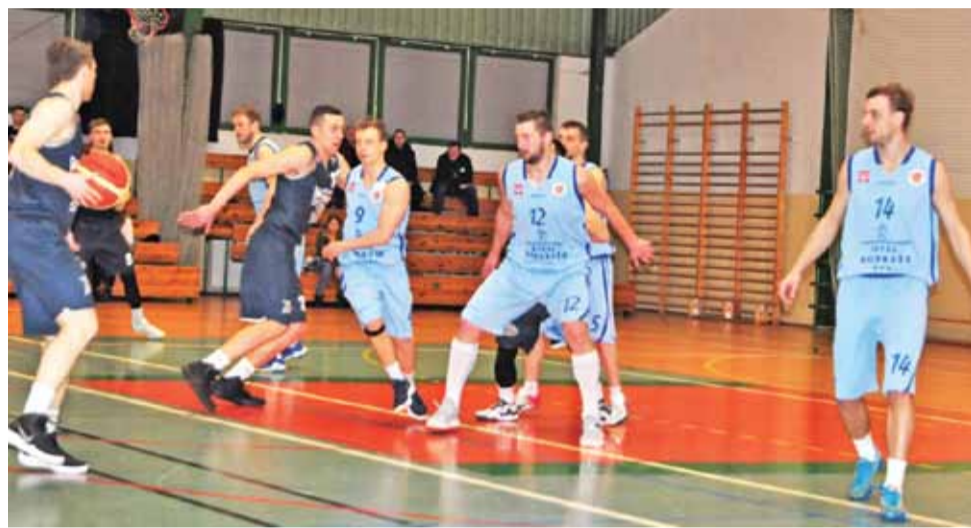
Książacy słabo bronili w meczu z Dzikami i to była przyczyna porażki.

Po pierwszych minutach nikt nie przypuszczał, że goście będą w stanie nam zagrozić. Obiecują-