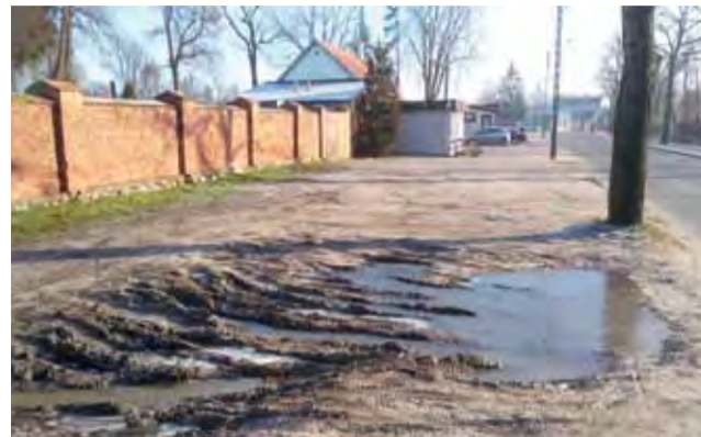
To miejsce na co dzień wykorzystywane nie jest, ale gdy ruch przy cmentarzach wzrasta – parking w tym miejscu przyda się na pewno.

Drugi przetarg dotyczy miejskiego targowiska i przewiduje przesunięcie obecnego panelowe-