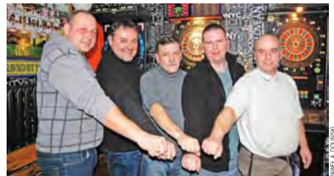
Niska frekwencja nie spowodowała odwołania turnieju.