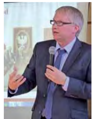
Ekonomista i członek Rady Polityki Pieniężnej prof.

że jest za zachowaniem złotówki jako waluty narodowej, powołując się na argumenty, że wejście do strefy euro to „bilet w jedną stronę”, gdyż nie wypracowano jak dotąd odpowiednich procedur jej opuszczenia, zaś przeniesienie polityki monetarnej do Frankfurtu nad Menem (siedziba Europejskiego Banku Centralnego) sprawi, że wpływ Polski na tę politykę będzie znikomy. Zdaniem prelegenta strefa euro to nadal eksperyment i obszar stagnacji gospodarczej.