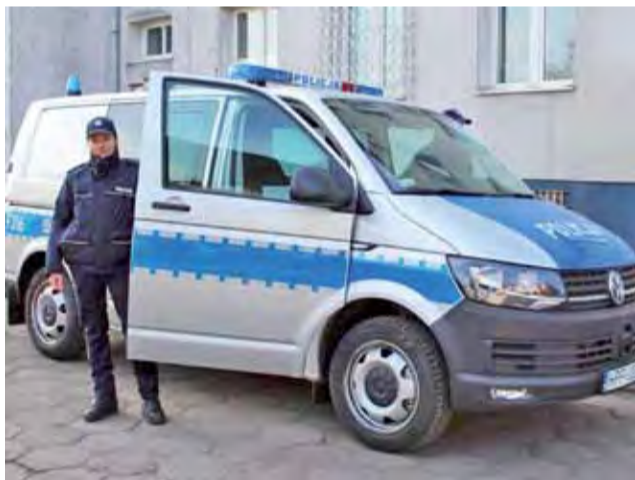
Nowy radiowóz łowickiej policji.

Jednocześnie jednak zapowiada, że kontrole na łowickim targowisku oraz sklepach typowanych „w wyniku działań operacyjnych” będą odbywały się z większą niż do tej pory regularnością. Ponadto osoby, które już raz zostały zatrzymane podczas handlu „lewymi” papierosami, mogą liczyć się z ponownymi kontrolami. Właścicielom sklepów grożą wysokie grzywny oraz postępowanie karne-skarbowe. Uszczuplenie podatku akcyzowego celnicy oszacowali na ok. 16 tys. zł. mak