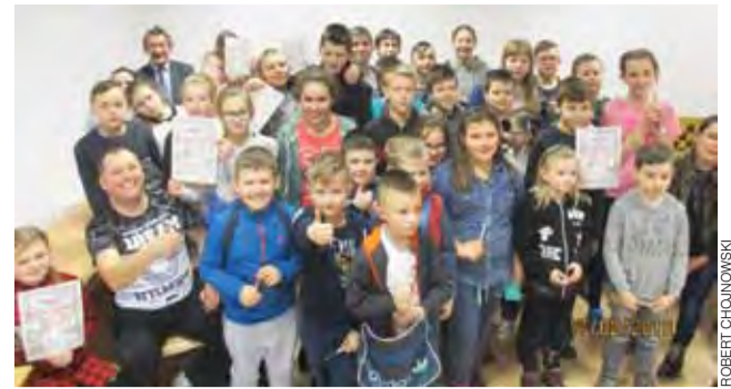
Rekordowa ilość drużyn wystąpiła w 3 turnieju drużynowym.