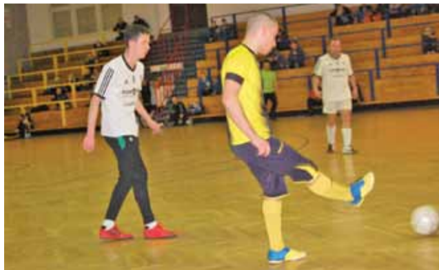
Mecz Bo-Dachu z Chińską był bardzo emocjonujący.

Do kolejnej rundy awansowali również Renix Eko-Plast, Al-