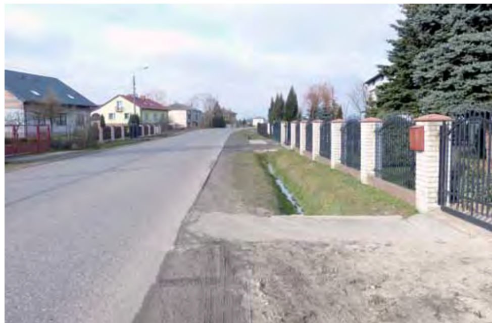
Julianów jest gęsto zabudowaną miejscowością. Droga powiatowa biegnąca przez wieś nie ma bezpiecznych poboczny. Mieszkańcy oczekują, że powstanie tu chodnik.

Przed oczami ma widok dzieci, które szły do kościoła w Nieborowie rowami, bo „mama kazała im uważać”. Bały się iść krawędzią drogi, na której jest bardzo duży ruch, a bezpiecznych poboczny nie ma.