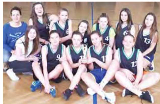
Ekipa dziewcząt z Ekonomika z pucharem za 1. miejsce na mistrzostwach powiatu łowickiego.

W meczu finałowym tytułu mistrzowskiego broniła ekipa II LO Łowicz. Jednak rywalki z ZSP nr 4 były w tym roku bardzo mocne i miały kilka zawodniczek, które trenowały wcześniej koszykówkę w UMKS Księżak Łowicz. To zdecydowało o końcowym wyniku. Zespół z Ekonomika wygrał finał bardzo pewnie 28:16 i wywalczył awans do półfinału wojewódzkiego.