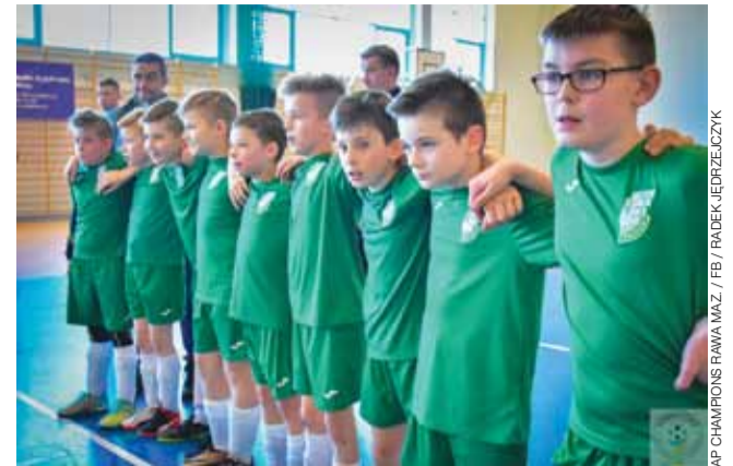
Gracze MUKS Pelikan przegrali w finale w rzutach karnych.

■ Mecze ćwierćfinałowe XXV edycji Pucharu Ligi ŁoLiF: FC Łaguzzew - Reklama Frog Blokiersi Łowicz 2:7 (0:5); Bo-Dach Grudze - Chińska Tor-Rem Subiekt Haczykowsky Łowicz 5:5 (3:3), w rzutach karnych 2:1; Fantazja Głowno - Drużyna KIA Łowicz 2:5 (1:1); Renix Eko-Plast Łowicz - Kancelaria Bosz Centrum Tor-Rem Belchów 3:5 (2:2).