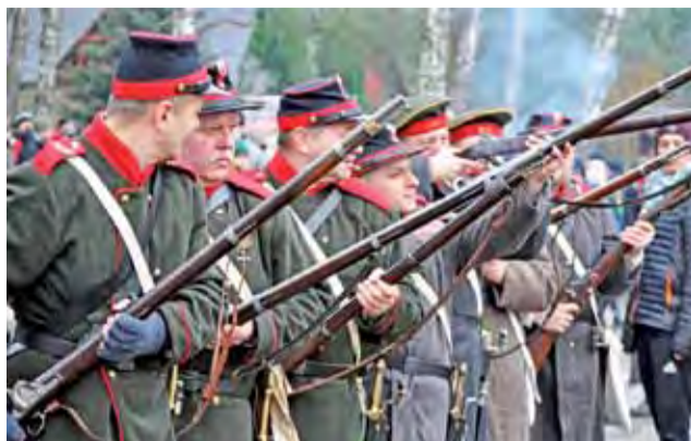
W Moskali wcielili się m.in. członkowie GRH „Strzelcy” z Mszczonowa oraz rekonstruktorzy z Małogoszczy.