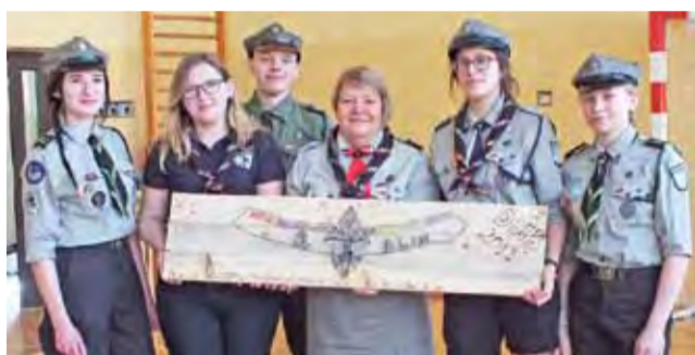
„BLIH” otrzymał prezent od drużyny „Silva” – plakietkę Szczepu, odwzorowaną na drewnianej desce.