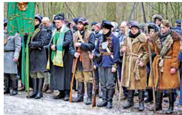
Rekonstruktorzy najpierw uczestniczyli w polowej mszy świętej przy pomniku upamiętniającym bitwę.

Joachimów Mogiły | XVIII Rajd Szlakiem Powstania Styczniowego