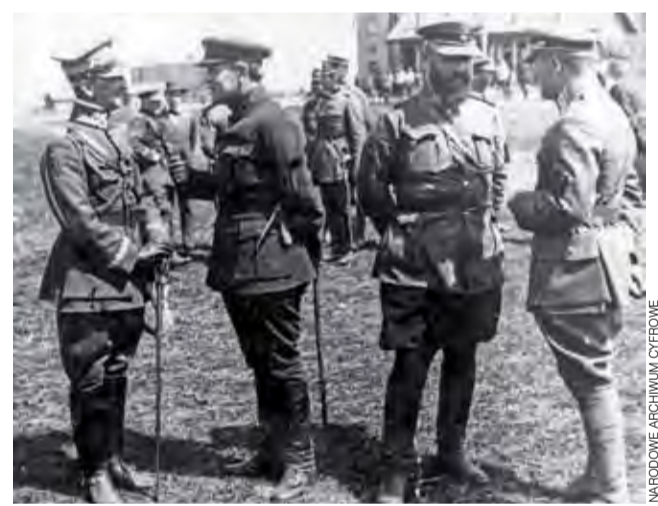
Kwiecień 1920. Gen. Antoni Listowski (pierwszy z lewej) podczas rozmowy z atamanem Symonem Petlurą.

W o j s k a Rzeczpospolitej Polskiej na rozkaz mój ruszyły naprzód, wstępu-