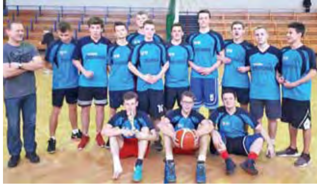
Koszykarze z Chełmońskiego byli najlepsi na zawodach powiatowych.