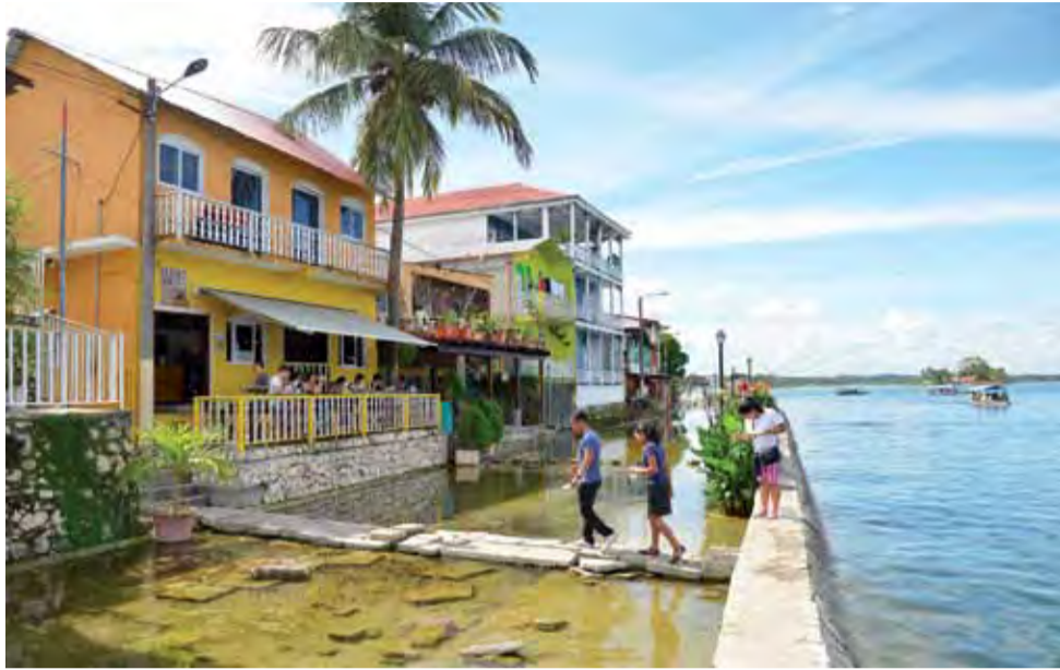
Gdyby nie odległość, do wielu napotkanych miast chcielibyśmy wracać zdecydowanie częściej.

Tydzień później. Godzina 17 i 27 stopni (Celsjusza). Dysząc i pocąc się niemilosiernie kręcąc pod górę na ostatnim tego dnia podejździe. Za przełęczą czeka mnie tylko kilkukilometrowy zjazd do Comayagua i szybko zbliżający się zmrok. Dobrze byłoby, gdybym w ciągu pół godziny znalazł miejsce do spania, potem może być trudno. Skupio-