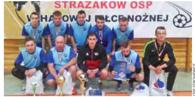
Siatkarzom ze Stroniewic niewiele zabrakło do reprezentowania województwa.