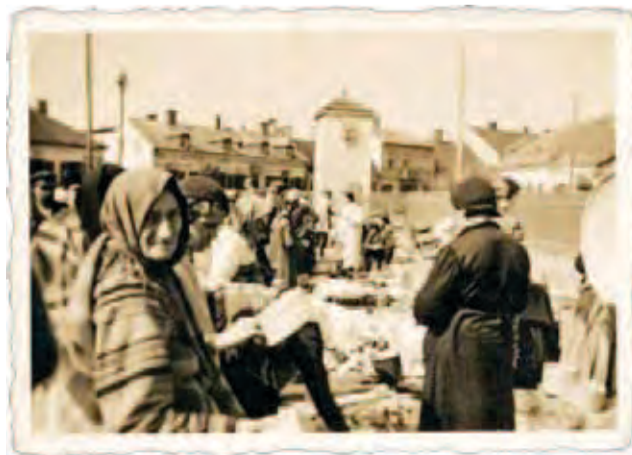
Nowy Rynek w Łowiczu, rok 1940 lub 1941, strona „aryjska”, widok w kierunku ul. Bielawskiej, w głębi widoczny płot – ogrodzenie getta.

Wracając do liczby Polaków straconych za ukrywanie Żydów: udokumentowanych przypadków mamy około tysiąca, ale możemy zakładać, że jest ich wielokrotnie więcej, może kilkanaście, może kilkadziesiąt tysięcy.