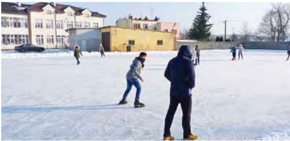
Z lodowiska korzystają uczniowie szkoły, ale mogą pojeździć też wszyscy chętni. Zdjęcie ze stycznia.