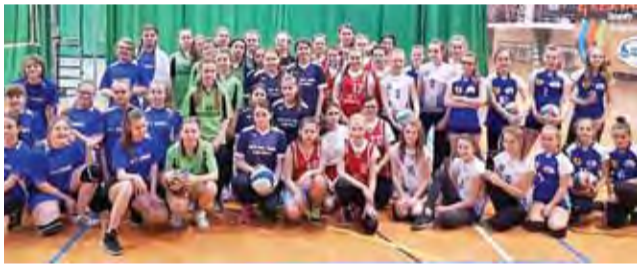
W rywalizacji dziewcząt o mistrza powiatu zagrało 5 reprezentacji.

Zespół SP Domaniewice, który opierał się na siatkarkach Asi-ka wygrał cztery spotkania, a trzy z nich kończyły się tie-breakami.