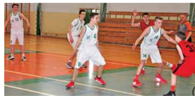
Kadeci Książaka zagraли mocno w obronie i skutecznie w ataku i cały czas walczą o 5. miejsce w lidze wojewódzkiej.

Nasi koszykarze dali pogrążyć swoim rywalom tylko przez pięć minut. Potem szybko weszli na wyższy poziom i przejęli kontrolę nad tym meczem. Po 10 minutach wygrali 27:8 i już było widać, że łodzianie będą się bronić przed wysoką porażką. Najbardziej wyrównana była czwarta kwarta. Książacy walczyli w niej o 100 punktów, jednak trener Rutkowski tym się nie przejmował i dawał więcej pogrążyć zmiennikom, którzy w niektórych meczach gra-