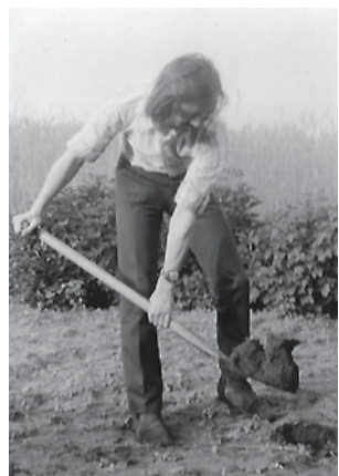
Wykopalka archeologiczne, prawdopodobnie w Droguszy w gm. Bielawy.