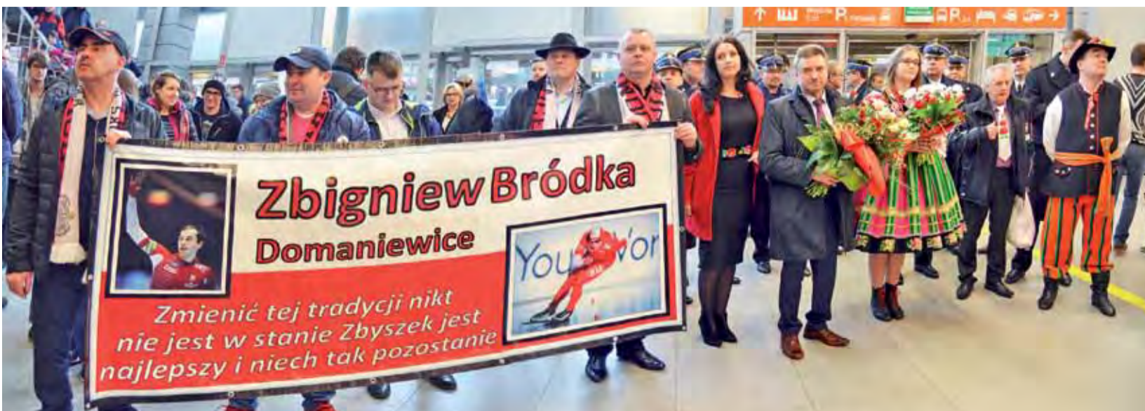
22 lutego na lotnisku Warszawa Okęcie czekali na Zbyszka Bródkę wierni domaniewiccy kibice z banerem.

Zbigniew Bródka powoli kończy tegoroczny sezon. – Generalnie, jestem już w okresie roztrawiania – powiedział nam 23 lutego. – Nie planuje już startów w tym sezonie. A co będzie dalej? Zobaczymy.