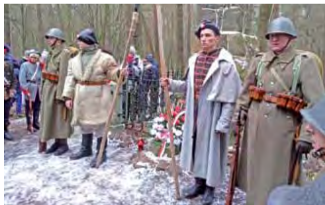
Wartę przy pomniku wystawili m.in. przedstawiciele Stowarzyszenia Inicjatywa Ziemi Bolimowskiej i członkowie SH 10 Pułku Piechoty.

zostały kwiaty, zapalone znicze. Po mszy można było obejrzeć krótką rekonstrukcję historyczną, w której wzięło udział ponad 30 osób, ubranych w stroje powstańcze i mundury wojska rosyjskiego