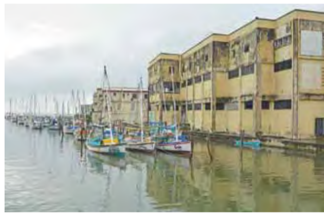
Specyficzny klimat krajów karaibskich: wilgoć, nieład i duża dawka energii.

Spotkaliśmy się już wcześniej, 300 km temu, w Teli, nad Morzem Karaibskim. Z nas dwojga, tylko on jednak o tym wiedział.