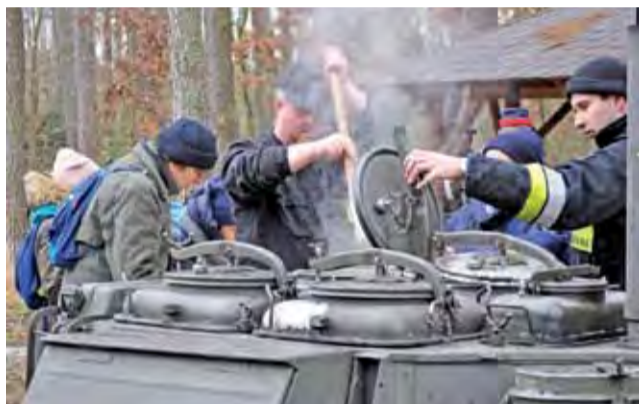
Można było również skosztować przygotowanej przez strażaków grochówki z kuchni polowej oraz ogrzać się przy ognisku.

Wartę przy pomniku wystawili przedstawiciele Stowarzysze-