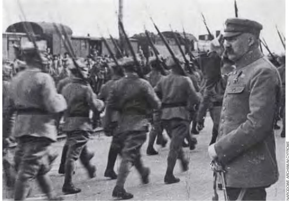
Wiosna 1920. Marszałek Józef Piłsudski odbiera defiladę oddziału piechoty Wojska Polskiego.