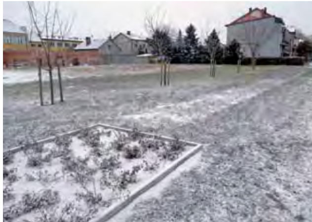
Skwer Ofiar Katastrofy Smoleńskiej. Pomiędzy widocznymi na zdjęciu rabatami z różami stanie już niedługo pamiątkowy kamień.