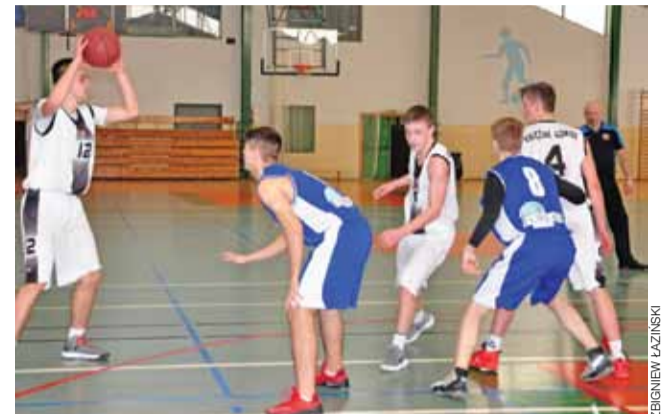
Dobra postawa łowiczanie dała zwycięstwo w derbowym pojedynku z ekipą ze Skierniewic.

■ UMKS Książak-2001 Łowicz – AZS PWSZ Skierniewice 71:63 (11:14, 30:19, 10:20, 20:10)