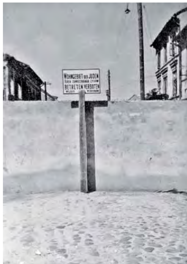
Mur lowickiego getta przecinał w poprzek ul. Zduńska, kilkanaście metrów za kościołem pijarskim, mniej więcej na wysokości dzisiejszej ul. Chopina.

Wielu Polakom udawało się uniknąć kary śmierci za ukrywanie Żydów. Polscy policjanci, przejmując schwytanych, nierzadko starali się chronić ratujących, sami „załatwiali” sprawę z Żydami.