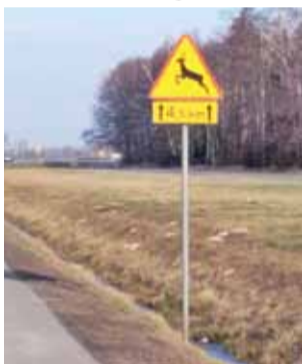
Co kilkaset metrów można spotkać na DK 70 znaki ostrzegające o dzikich zwierzętach.

Mniej szczęścia miał kierowca Alfę Romeo, który 23 sierpnia 2015 roku pod Nieborowem zde-