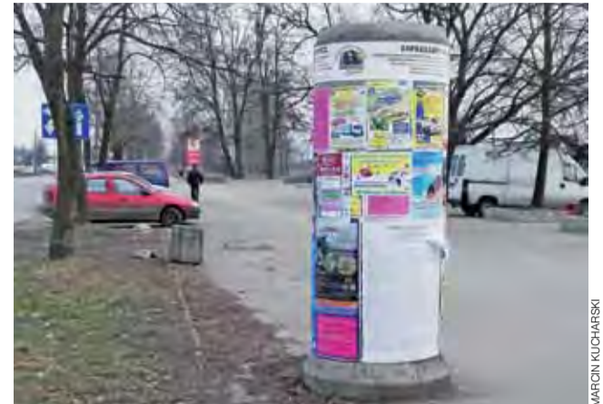
Sześć słupów ogłoszeniowych rozmieszczonych na terenie miasta poddanych zostanie konserwacji. Chodzi przede wszystkim o zabezpieczenie i pomalowanie kolorowych „daszek” na tychże słupach oraz zamontowanie w górnej części słupów opaski z informacjami o tym, kto nimi administruje. mak