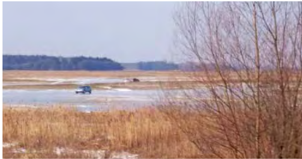
Samochody jeżdżące na lodzie na rozlewiskach Bzury w okolicach mostu na DK 14.