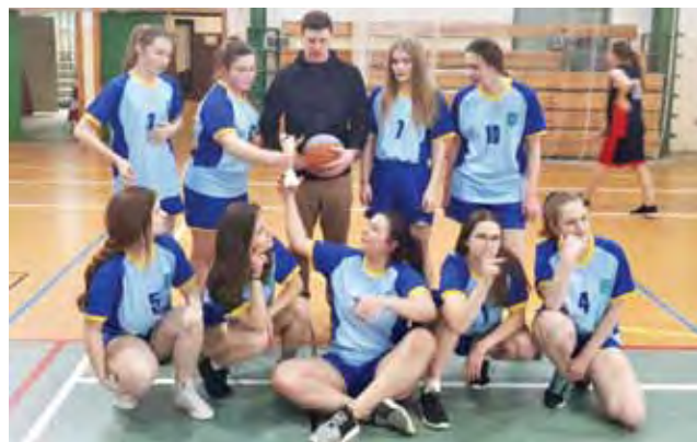
Dziewczyny z SP4 powróciły do tradycji i zdobyły mistrzowski tytuł.