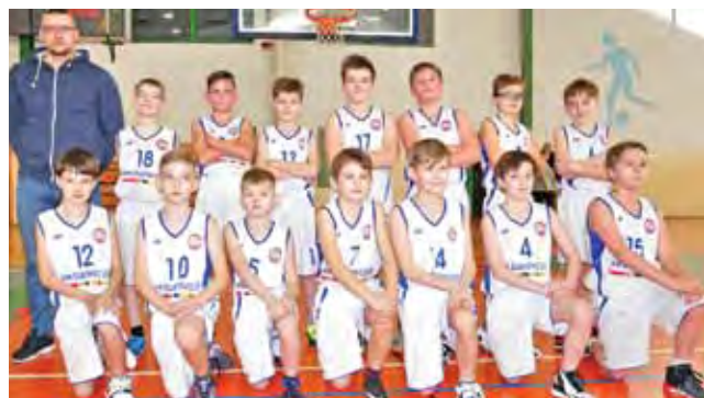
Najmłodszy koszykarze Książaka zaczynają koszykarską przygodę.

– W tym wieku nie należy przepłacać się wynikami. Nasz zespół jest dopiero w budowie. Start drużyny stał pod znakiem zapytania, ponieważ brakowało