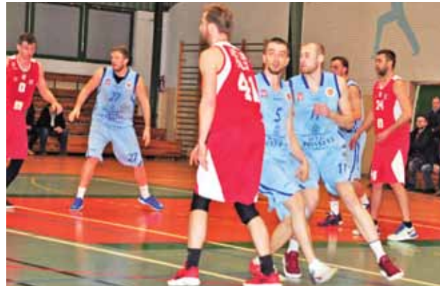
O zwycięstwie w meczu z AZS UJK Kielce zadecydowała dobra, zespołowa obrona.

Ostatnią część pojedynku lepiej zaczęli Akademicy z Kielc, którzy doprowadzili do stanu 65:59. Po chwili znów dobry fragment zagrał duet Nieporęcki i Cukierta i Książacy prowadzili 75:63. Od tego momentu widać już było