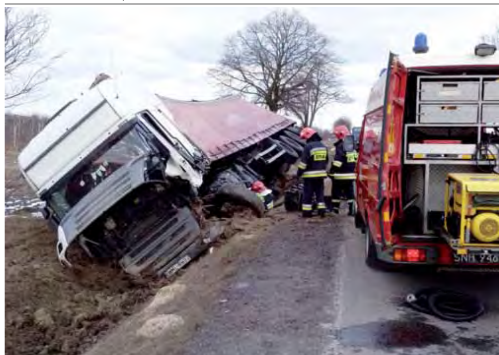
Scania zderzyła się z Jeepem. W środę, 21 marca ok. godz. 15 na drodze krajowej nr 92 w okolicach Patok w gminie Nieborów samochód terenowy Jeep zderzył się z ciężarówką Scania z naczepą, w wyniku czego Scania zatrzymała się w rowie. Do szpitala trafił 42-letni kierowca terenówki ze Skierniewic. Scanią kierował 29-letni mieszkaniec woj. warmińsko-mazurskiego. Uczestnicy wypadku byli trzeźwi. Przez około 2 godziny droga była całkowicie zablokowana. mak

RZUT OKIEM | WYPADEK NA DRODZE KRAJOWEJ W KOMPINIE