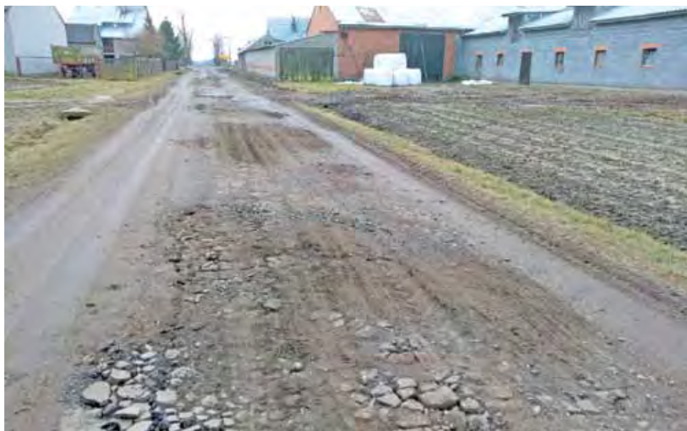
To kiedyś była droga asfaltowa, gruntownej naprawy należy spodziewać się po zakończeniu modernizacji DW 703.

Sęk w tym, że inwestycja dopiero się rozpoczęła, potrwa prawie dwa lata i będzie prowadzona kilkusetmetrowymi odcinkami. Wyższy niż dotychczasowy ruch lokalnymi drogami będzie więc dotyczył różnych dróg w różnych miejscowościach wzdłuż modernizowanego 9,5-kilometrowego odcinka drogi nr 703. Obecnie najbardziej rozjeżdżane są drogi lokalne prowadzące od DW 703 w stronę Gaju – dalej przez Wojewodę i Nowy Chruślin, do drogi prowadzącej od oddziału rehabilitacji w Stanisławowie w kierunku okolic Chruśli. – Teraz jest mokro, ziemia jest miękka, więc z tych dróg niedługo niewiele zo-