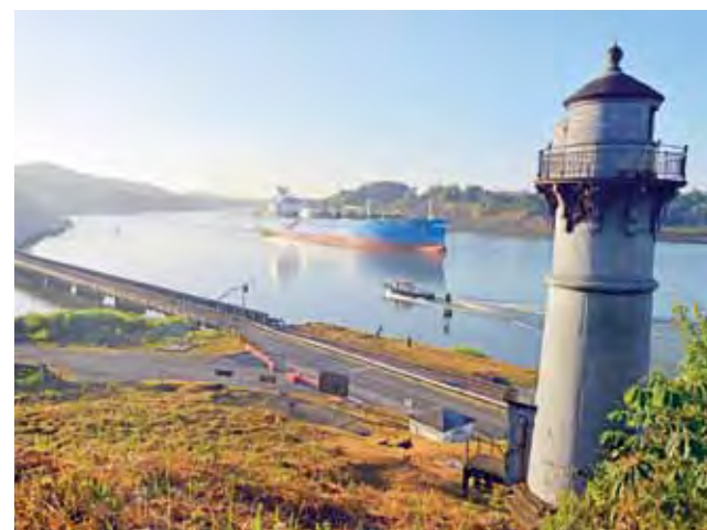
Widok statków przepływających Kanałem Panamskim o świcie na długo pozostanie w mej pamięci.