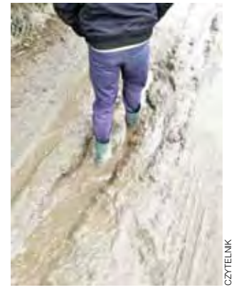
Suchą nogą po tej drodze nie da się przejść.

Zapytaliśmy na komendzie policji czy rzeczywiście policjanci zainteresowali się sprawą zgłaszaną przez mieszkańców. – Zapewniam, że policjanci z Komendy Powiatowej Policji w Łowiczu od pewnego czasu zajmują się tą sprawą. Szereg różnorodnych działań podjął zarówno dzielnicowy, jak i inne służby. Z naszych ustaleń wynika, że problem mieszkańców bloku być może niedługo zostanie rozwiązany – lokatorzy wskazywanego mieszkania wyprzedzą się – odpowiedziała nam podkom. Urszula Szymczak z KPP w Łowiczu. Szczegółów działań jednak nie przedstawiła. Może więc wkrótce lokator, który uszkodził domofon, będzie miał motywację do tego, żeby go naprawić? mak