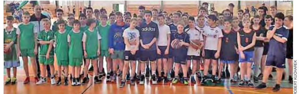
Uczestnicy mistrzostw powiatu w mini koszykówce chłopców.

Pierwsze miejsce wywalczyła ekipa chłopców ze Szkoły Podstawowej nr 2 w Łowiczu (nauczyciel w-f Bartosz Włuczynski), która w finale pewnie pokonała Szkołę Podstawową nr 7 im. Jana Pawła II w Łowiczu (nauczyciel w-f Zbigniew Łaziński). W zawodach miejskich o mistrzostwo zdecydowała dopiero druga dogrywka, jednak tym razem w SP 7 nie zagrał podstawowy zawodnik