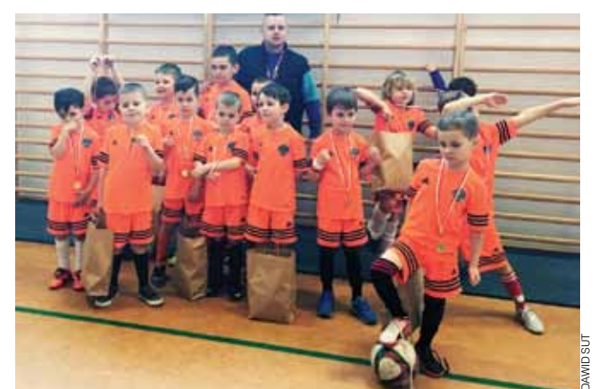
Drużyny Soccer Kids Łowicz po zakończonej rywalizacji.