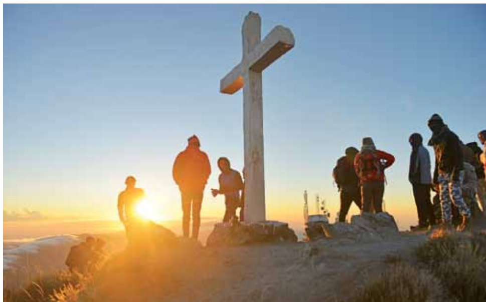
Widok z wulkanu Barú warto podziwiać o wschodzie słońca.

Barú to jednocześnie najwyższe położone miejsce w kraju. Dopiero stojąc u stóp wulkanu dane jest nam odczuć prawdziwą potęgę natury. Z solidnej, masywnej podstawy, bryła pnie się strzeliście