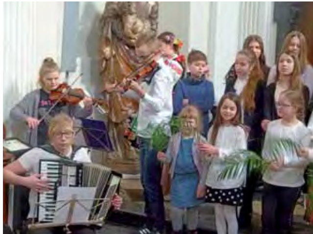
W czasie corocznego koncertu „na przywitanie wiosny” nie brakowało też występów zbiorowych.

Zagrali wszyscy podopieczni CEM, zarówno ci, którzy uczyli się od kilku lat, jak i ci stawiają-