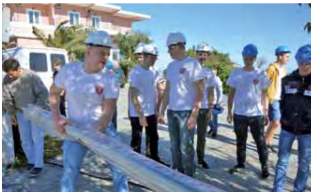
Uczniowie kształcący się na elektryków nabierali doświadczenia zawodowego w montażu instalacji elektrycznych w hotelu (oraz przy nim) powstającym w miejscowości Dion.

Uczniowie z technikum kształcącego informatyków pracują z urządzeniami sieciowymi, tj. ro-