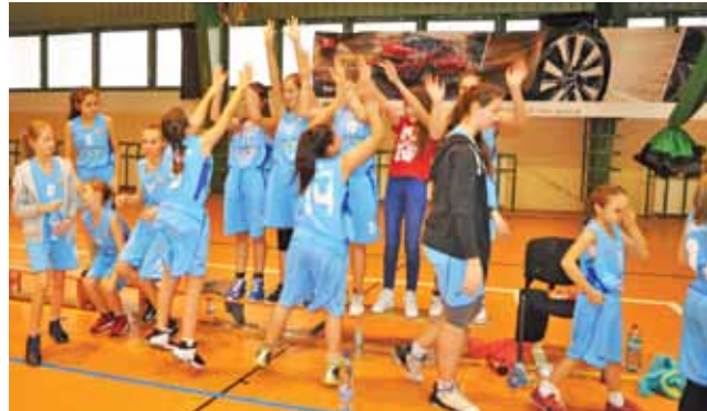
Książaczki-2005 zagrały dobry mecz na zakończenie sezonu.