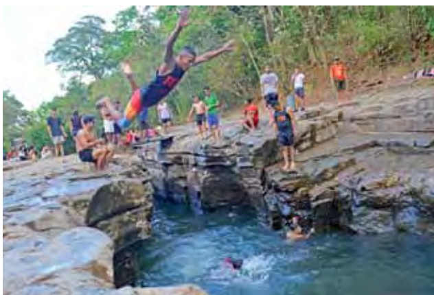
Wakacje w Panamie trwają od grudnia do początku marca.