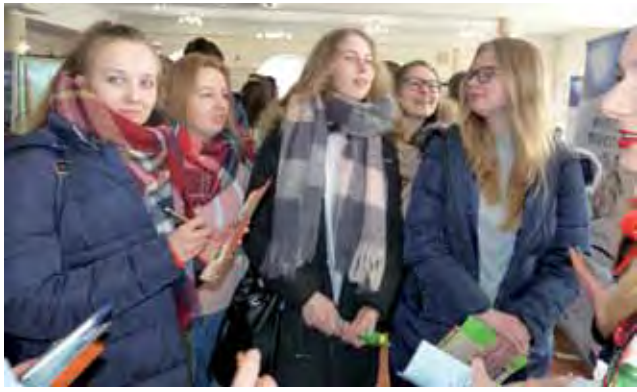
Gimnazjaliści odwiedzający targi pytali przede wszystkim starszych kolegów o to, jak jest w danej szkole.

Targi zostały zorganizowane 20 marca w restauracji Szkiełka w Łowiczu. Stoiska wystawowe od godz. 10 do 12.30 czekały na gimnazjalistów, którzy przyjechali ze wszystkich gmin powiatu łowickiego. Część uczniów targi traktuje jednak jako rozrywkę, dzięki której część lekcji przepada, inni starają się dobrze wykorzystać ten czas, aby zadawać py-