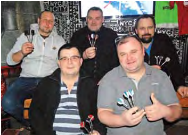
Na niedzielny sukces zapracowała cała piątka zawodników ŁKD Leg Łowicz.