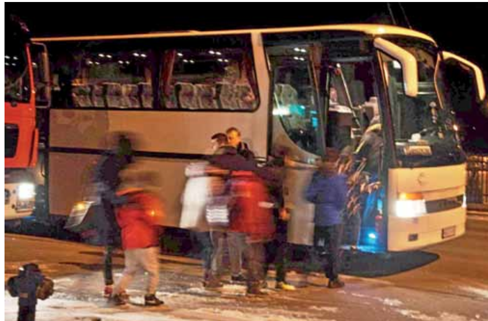
Dzieci z Bełchatowa oczekiwały na autobus zastępczy w remizie OSP Łyszkowice.

Jak ustalili strażacy, busem podróżowało 18 osób, w tym 14 dzieci. Na miejscu wszystkich obejrzel ratownicy me-