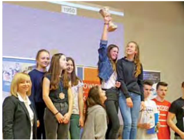
W klasyfikacji gimnazjów zwyciężył oddział gimnazjalny Szkoły Podstawowej nr 2 w Łowiczu.

Najlepszy czas w rywalizacji męskiej i zarazem w całych mi-