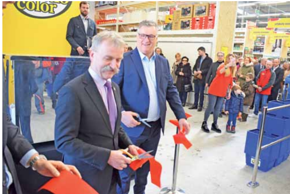
Oficjalne przecięcie wstęgi zgodnie z planem nastąpiło 17 marca w samo południe.

Tylko przez pierwsze cztery godziny otwarcia wystawionych zostało ponad 600 paragonów, a wynik całego pierwszego dnia sprzedaży to 1700 paragonów. Oczywiście trudno będzie powtórzyć taki wynik, ale można go odczytać jako dobry prognostyk dla właścicieli. Piotr Stępkowski ocenia, że już 1000 dziennie będzie dobrym wynikiem. Firma na razie zatrudnia w Łowiczu 32 pracow-