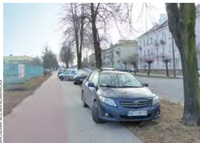
Tym razem kierowcom, którzy zaparkowali na pasie zieleni i ciągu pieszo-rowerowym, upiekło się, bo mandatów uniknęli.

15 marca przed godz. 18 w Alejach Sienkiewicza policjanci patrolujący miasto postanowili wylegitymować mężczyznę, który według nich zachowywał się on na ich widok nerwowo, jakby próbował coś ukryć w kieszeni. Okazało się, że miał przy sobie niewielką ilość amfetaminy. Usłyszał zarzut posiadania narkotyków z ustawy o przeciwdziałaniu narkomanii. mak