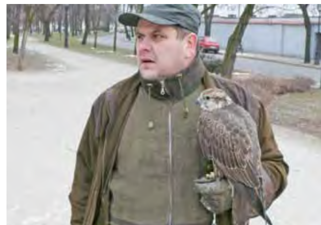
Tym razem miasto nie skorzystało z usług sokolnika – jak to było w roku 2013.

Naczelnik WSK zapowiada, że parki będą doglądane przez miejskie służby porządkowe w celu sprzątnięcia i usuwania nieczysto-