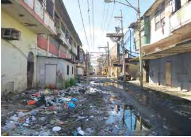
Slumsy w Colon straszą i inspirują.