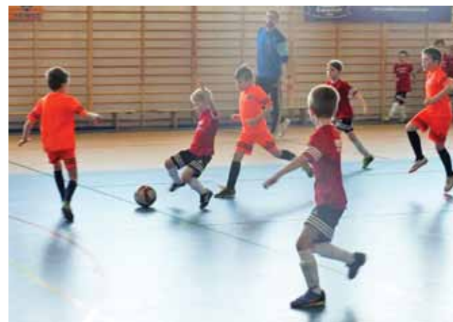
Emocji w turnieju rocznika 2010 nie brakowało.

W niedzielę UKS Soccer Kids wystawił do rywalizacji dwie drużyny, a oprócz Soccer Kids do Zdun przyjechały drużyny Widoku Skiermiewice, Unii Skiermiewice, AP Żyrardów, Zrywu Wygoda, Królewskich Płock oraz