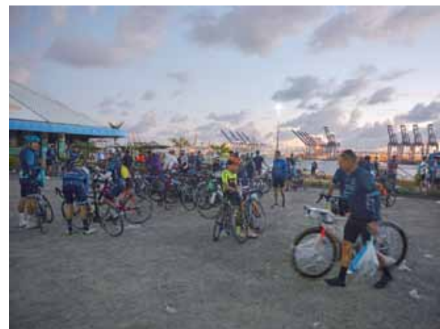
Międzynarodowy wyścig kolarski pomiędzy dwoma oceanami rozpoczyna się w Colon, a kończy w Panamie.

ku niebu, sprawiając, że w bezpośrednim jej obliczu czujemy się jeszcze bardziej bezbroni i małej. Trzeba mieć dużo szczęścia, by „jego wysokość” móc podziwiać w całości. Od wczesnych porannych godzin koroną kołosa szczególnie przykrywa bowiem gęsta poducha z chmur, która niechętnie i rzadko kiedy odkrywa