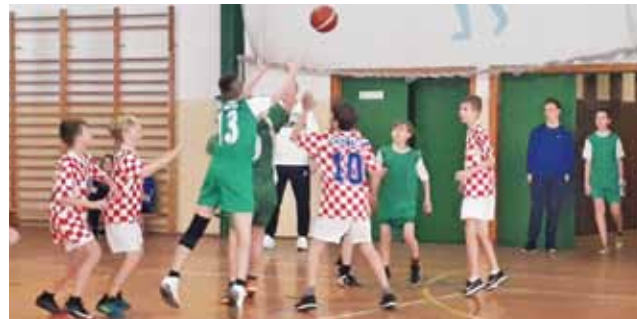
Walka o każdą piłkę była naprawdę zaciętą.

Piłka nożna | Soccer Kids Cup – rocznik 2010