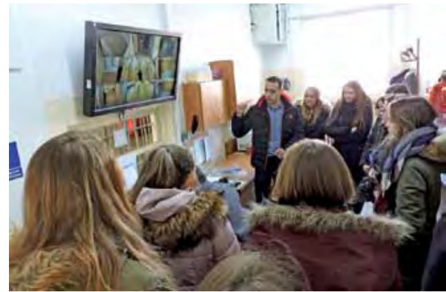
Uczniowie klasy mundurowej mogli obejrzeć pomieszczenia, do których na co dzień nie mają wstępu goście z zewnątrz.

Są to uczniowie maturalnej klasy o profilu „obrona i bezpieczeństwo publiczne”, więc byli przygotowani. Na zajęciach teoretycznych w szkole poznali już historię więziennictwa, przepisy i zasady odbywania kary pozbawienia wolności, regulacje międzynarodowe dotyczące więziennictwa, zasady funkcjonowania zakładów karnych w Polsce. Zapoznawali się z zasadami przyjętymi do Służby Więziennej oraz specyfiką pracy w poszczególnych działach służby. Teraz mieli okazję porównać teorię z praktyką.