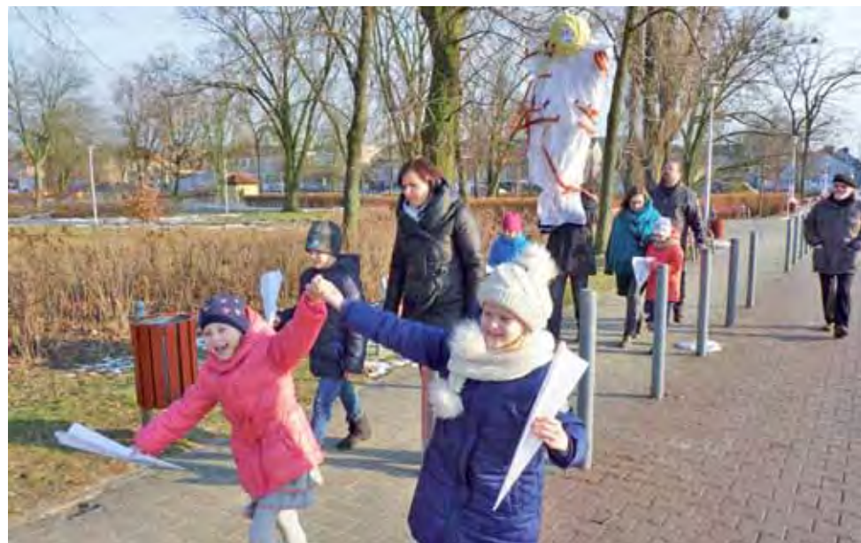
Grupa plastyczna Akwarelki w drodze na przystań kajakową nad Bzurą, gdzie odbył się obrzęd topienia Marzanny.

– Przepisy ciągle się zmieniają, także w trakcie trwania projektu umijnego, z którego zakupiono autobusy, musimy być z nimi w zgodzie, aby nie narażać jego realizację – komentuje Suchanek. ■