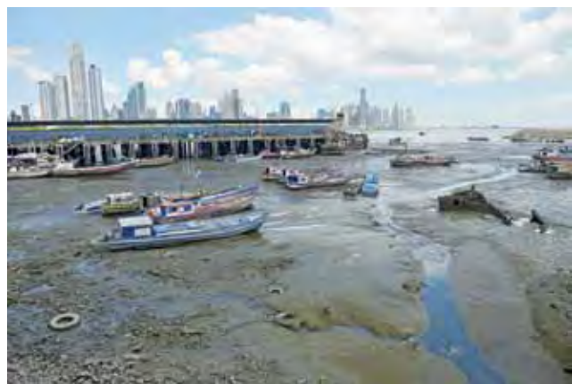
Port rybacki w centrum Panamy.