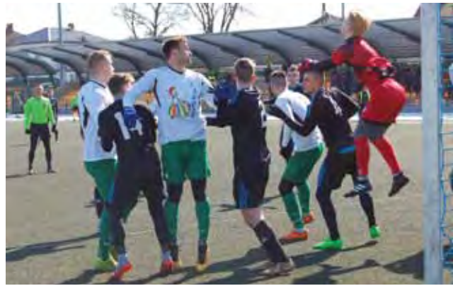
Stałe fragmenty gry były mocną stroną Pelikana.