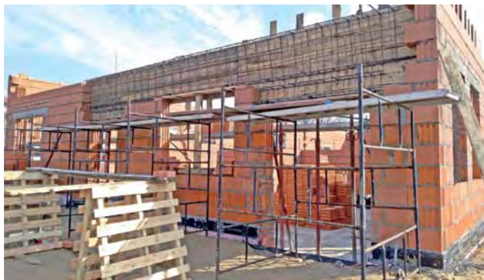
Prace budowlane przy Lokalnym Centrum Sterowania były wstrzymane na czas mrozów.