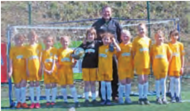
Pierwsze miejsce wywalczyła drużyna dziewcząt z SP Bąków.