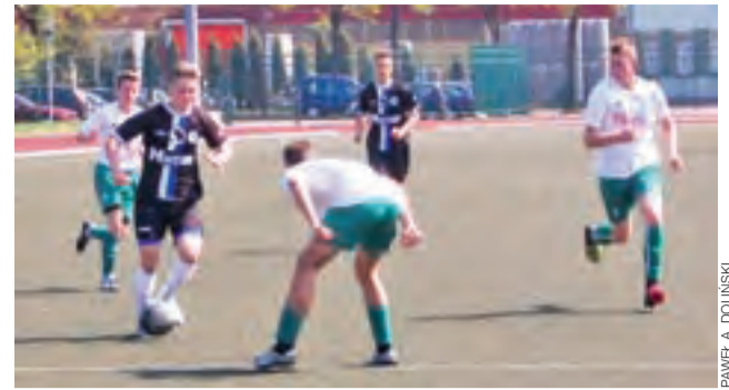
Pelikan 2001 jest już wiceliderem tabeli!