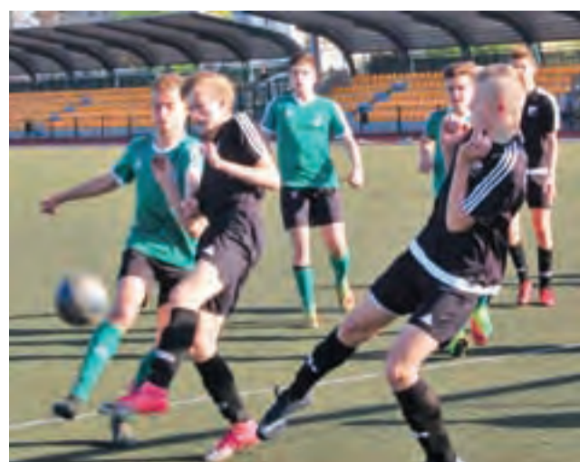
Pelikan 2003 wreszcie się przełamał i wygrał z Widokiem.

W sobotę 28 kwietnia łowiczanie zagrają wyjazdowy mecz z UKS Warta Sieradz jr. ever