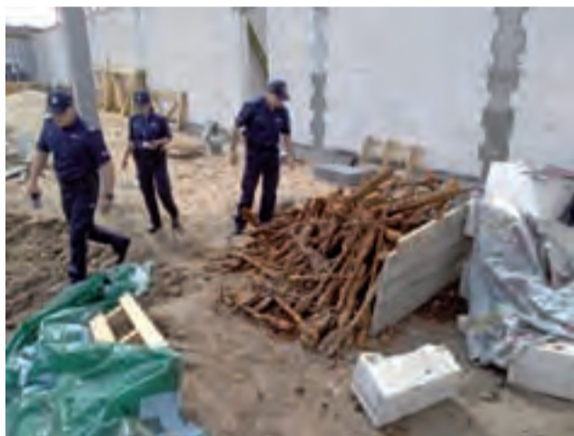
Ilość znalezionej broni wystarczyłaby przed laty do uzbrojenia kompanii wojska.

podobnie są też elementy broni produkcji czeskiej, której na naszym terenie używała policja. Są też elementy większych działek. Wszystko to jest – jak powiedział nam Piotr Marciniak na podstawie pokazanych mu zdjęć – „w agonalnym stanie”. Mimo to posiada niezaprzeczalną wartość historyczną.