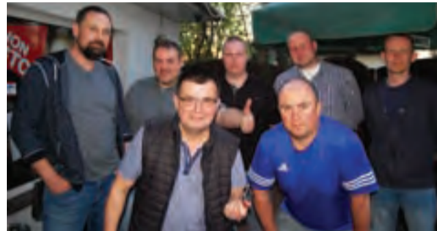
Turniej odbył się dzięki operatywności chętnych do gry w darta.