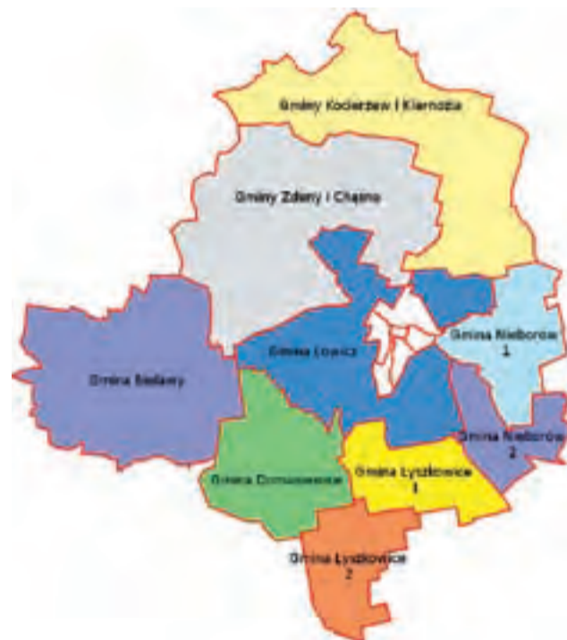
Rejony dzielnicowych w gminach powiatu łowickiego.

13 (północna część Łyszkowice) i 14 (część południowa gminy Łyszkowice) – jeden dzielnicowy sierż. sztab. Dariusz Kotus tel. 46 830-95-70 lub 516-438-070; nr 15 (północna część gminy Nieborów) i 16 (południowa część gminy Nieborów) – mł. asp. Witold Dylik tel. 46 830-95-70 lub 516-435-930.