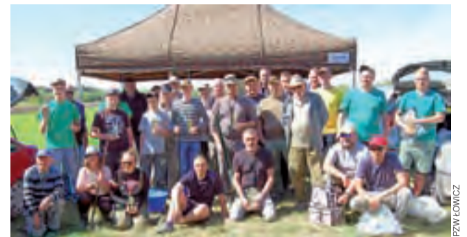
Do rywalizacji o mistrzostwo koła PZW Łowicz przystąpiło 29 wędkarzy, w tym dwie panie.