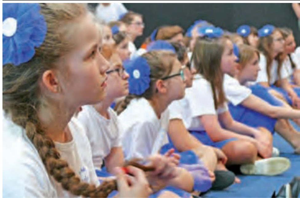
Ponad 300 dzieci ze scholi pijarskich, działających przy prowadzonych przez ten zakon szkołach w wielu miastach Polski, przyjechało do Łowicza na przegląd i warsztaty. Było wesoło i głośno. Więcej na str. 14.