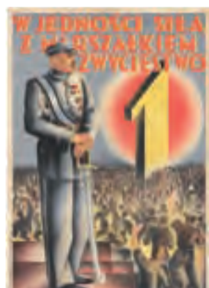
1930. Plakat wyborczy BBWR.

Wincenty Witos (przywódca PSL „Piast”, były więzień Brześcia) w ostatnim słowie oskarżonego podczas procesu Istnieje w tym społeczeństwie olbrzymia przepaść. Ktokolwiek dokonał tego niesłychanego podziału społeczeństwa, [...] wyrządził narodowi i państwu olbrzymią krzywdę. Ten system policyjny, protekcyjny, zagląający do każdej komórki, nie oszczędzający nikogo, zamierzający wykonywać wszystko przy pomocy aparatu państwowego, stał się niesłychanie szkodliwy. Warszawa, 8 stycznia 1932