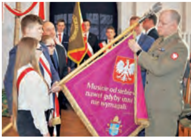
Ceremonia udekorowania sztandaru SP nr 3 w Łowiczu repliką Odznaki 10 Pułku Piechoty.