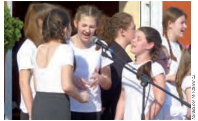
Imprezę otworzył koncert grupy wokalnejskiej „Tęcza”.

Na koniec zaplanowano otwartą dla wszystkich imprezę taneczną, która trwać będzie do późnych godzin nocnych. kl