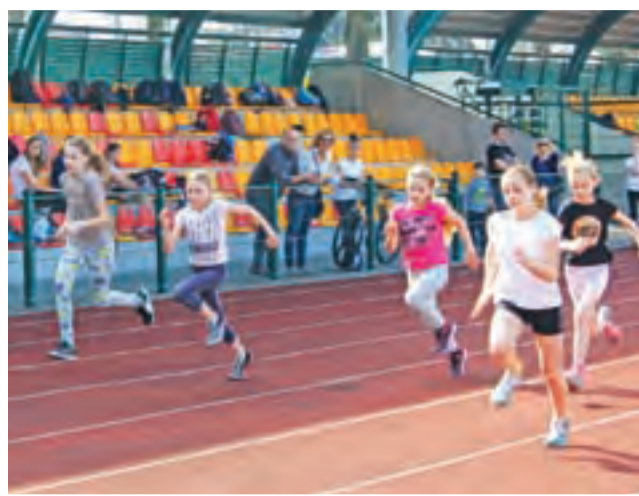
Sprint na 60 metrów jest jedną z biegowych konkurencji.