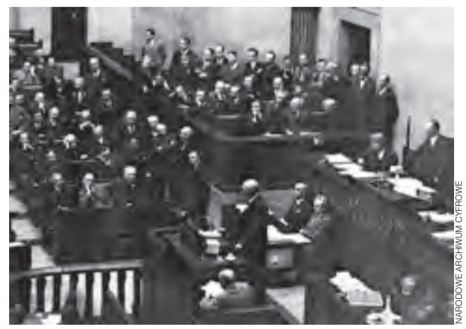
Nocne posiedzenie Sejmu , na którym poruszano sprawę procesu brzeskiego. Warszawa, 26/27 stycznia 1931.