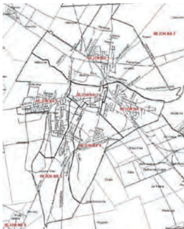
Rejony dzielnicowych KPP w Łowiczu na terenie Łowicza i gminy Łowicz.

Rejony 7 i 8, choć są na terenie gminy Łowicz, to w tym podziale są „miejskie”. Rejon nr 7 to wschodnia część gminy Łowicz, dzielnicowy sierż. sztab. Katarzyna Król-Bińczak tel. 46 830 95 68 lub 516-435-902, mail dzielnicowy.lowicz7@lowicz.ld.policja.gov.pl; nr 8 – zachodnia część gminy Łowicz, dzielnicowy st. sierż. Michał Walkiewicz tel. 46 830 95 68, 516-435-927, mail dzielnicowy.lowicz8@lowicz.ld.policja.gov.pl.