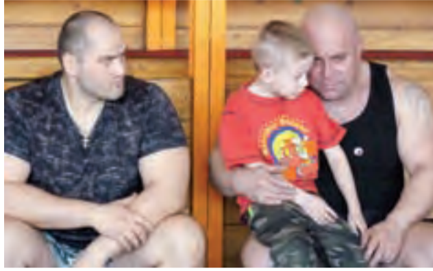
Oni tylko wyglądają tak groźnie... W rzeczywistości są troskliwi i opiekuńczy.

Zachęcamy do oglądania zdjęć i filmów z wydarzenia na www.lowiczain.info