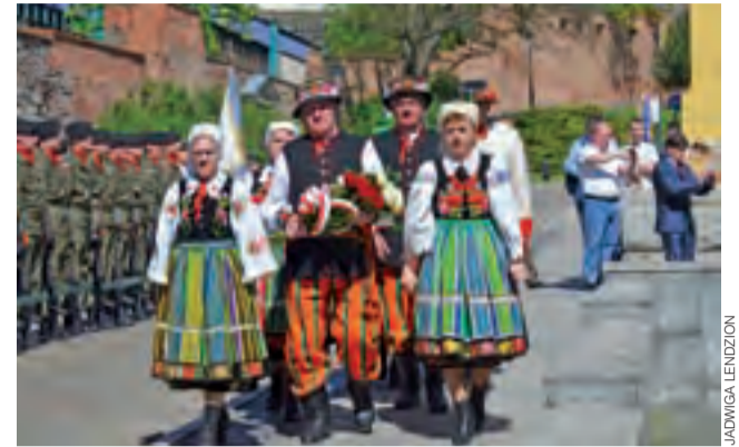
Ksiazki z wiankami kwiatów, które za chwilę złożą pod pomnikiem 15. Pułku Ułanów Poznańskich.

– Chwała im za to, że oni chcą pracować, że łowicki folklor sprawia im tyle radości – dodaje Strycharski. mwk