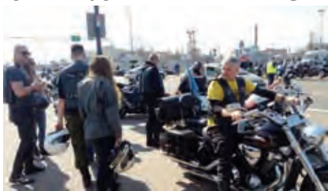
Członkowie łowickiego klubu w czasie otwarcia sezonu w Łodzi.