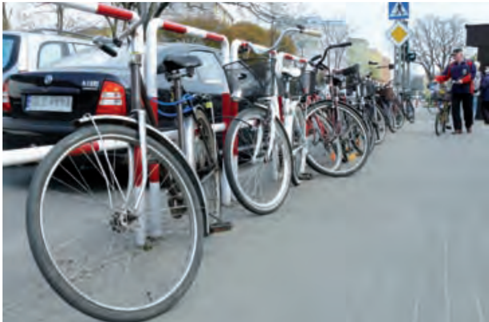
Ilu rowerzystów odwiedza targ w dzień targowy? Trudno powiedzieć, ale jeśli jest to dzień słoneczny, na pewno setki.