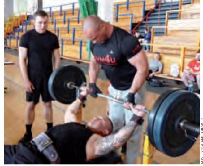
Wyciskanie sztangi 100 kg.