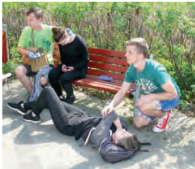
Członkowie drużyn mieli za zadanie w tym przypadku poradzić sobie z atakiem epilepsji i krwotokiem z nosa.