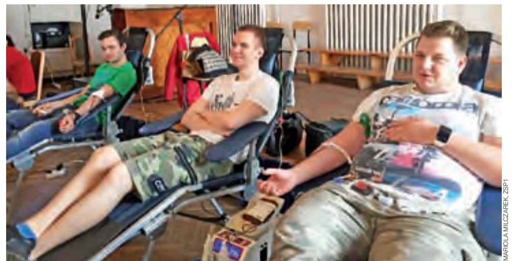
Podczas ostatniej akcji krew oddało 12 uczniów.