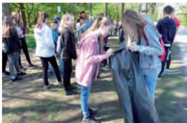
Zbiórka przed rozpoczęciem sprzątnięcia. Uczestnicy zostali wyposażeni w worki i rękawiczki.