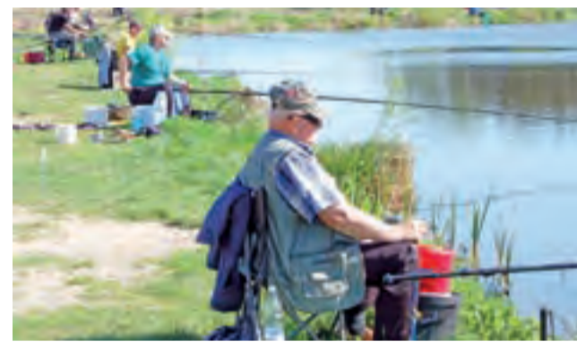
Stanowiska do wędkowania zostały wyznaczone co kilka, kilkanaście metrów.

Łowickie koło zaprasza na kolejne zawody, które odbędą się 6 maja na zalewie za Laskiem Miejskim. Będą to zawody feederowe (gruntowe), bez podziału na kategorie. Zapisy w dniu zawodów od 6. do 6.30. opr. mak