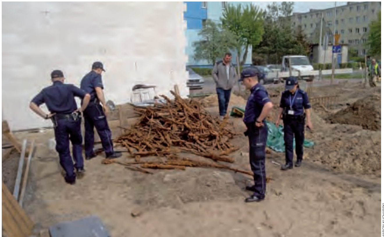
Odkrycia dokonał operator koparki podczas robót ziemnych. Broń została złożona w jednym miejscu.

Pierwsze informacje na temat znaleziska wskazywały, że na miejscu odkopane zostały m.in. karabiny maszynowe MG 42, rosyjskie karabiny powtarzalne Mosin, pistolety maszynowe MP 40 – takie jakie są znane np. z filmu o kapitanie Klossie. Prawdo-