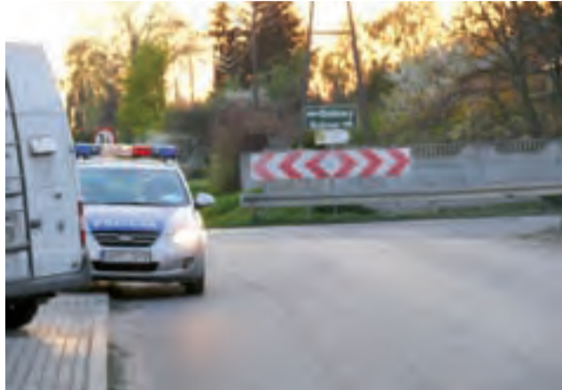
Tragedia zdarzyła się na tym skrzyżowaniu.

W odpowiedzi na wezwanie pomocy pod numer alarmowy, na miejsce zjawiała się, policja, pogo-