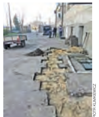
Początek prac nad położeniem nowej nawierzchni.

Inne planowane w Łyszkowicach zadania z tego funduszu to zakup poduszek ciśnienia dla Ochotniczej Straży Pożarnej