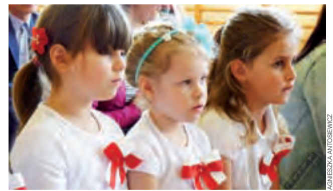
Elementy patriotyczne zaakcentowane były m.in. w ubiorze dzieci.

Przedszkolaki z przejęciem śpiewały o miłości do Ojczyzny, np. słowami piosenki: „Jesteśmy Polką i Polakiem, dziewczynką fajną i chłopakiem. Kochamy Polskę z całych sił, chcemy być również kochać ją i ty i ty”. Dzieci