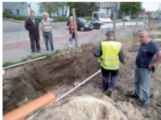
To właśnie w tym miejscu, tuż przy chodniku, na głębokości nieco ponad 1 metra, znaleziony został skład broni.