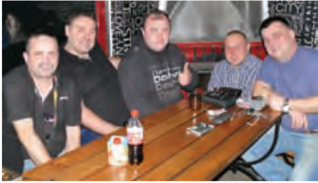
Każdy z pięciu graczy zapunktował w niedzielnym spotkaniu.

Kolejne spotkanie to zaległy mecz 11. kolejki I ligi ŁSD, podczas którego LKD Leg Łowicz zmierzy się z drużyną Dartsway