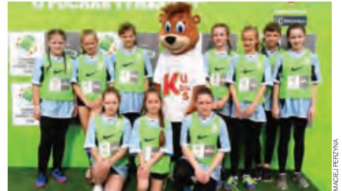
Zawodniczki z Nowych Zdon zdobyły srebro.

Piłka nożna | XVIII edycji Z podwórka na stadion o Puchar Tymbarku