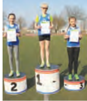
Najlepsi z poszczególnych konkurencji otrzymują pamiątkowe dyplomy.