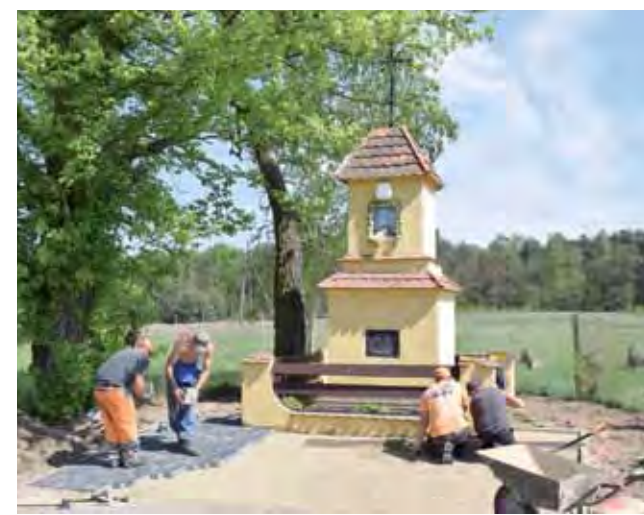
Przed kapliczką w Woli Lubiankowskiej kostkę brukową układa profesjonalna ekipa.

nią od kiedy tu zamieszkała, czyli od 48 lat. – Była co jakiś czas odnawiana, ale takiego remontu jak w tym roku, to chyba jeszcze nie było – mówi.