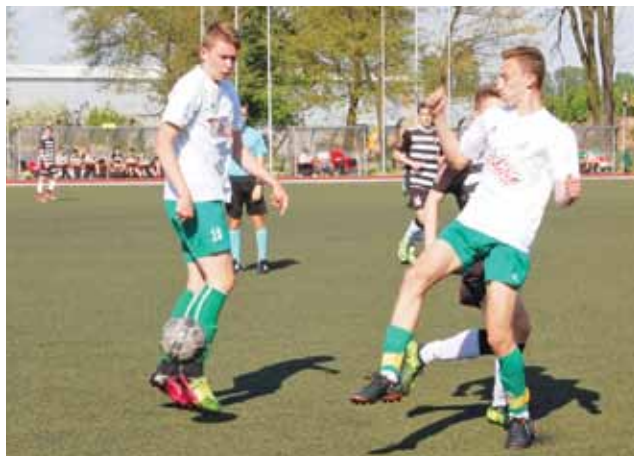
Gracze Pelikana 2001 mogli zdobyć punkty z Borutą.

6. kolejka I ligi wojewódzkiej juniorów młodszych B1: