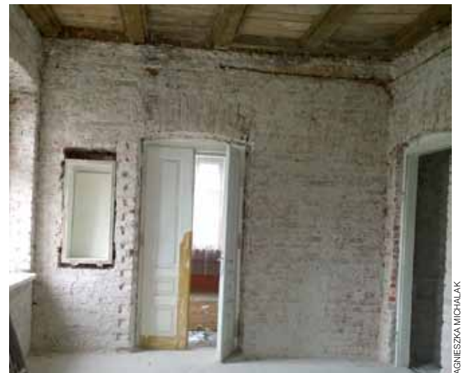
Nowi właściciele skuli wewnątrz kamienicy tynki. Planują, aby po remoncie, w wielu miejscach, były one odstonięte.

wówczas uzyskać zgody na budowę u starosty łowickiego, lecz u wojewody. Wystąpił o nią do starosty, ale ten przesłał ją dalej. Zanim zgodę uzyskał, to oficyna już stała. Wojewoda przejeżdżając przez Łowicz zauważył to i napi-