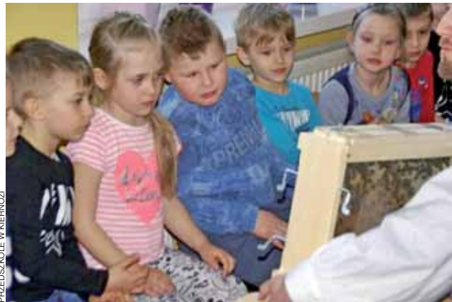
Dzieci miały okazję podpatrzyć też żywe pszczoły w specjalnym szklanym ulu.