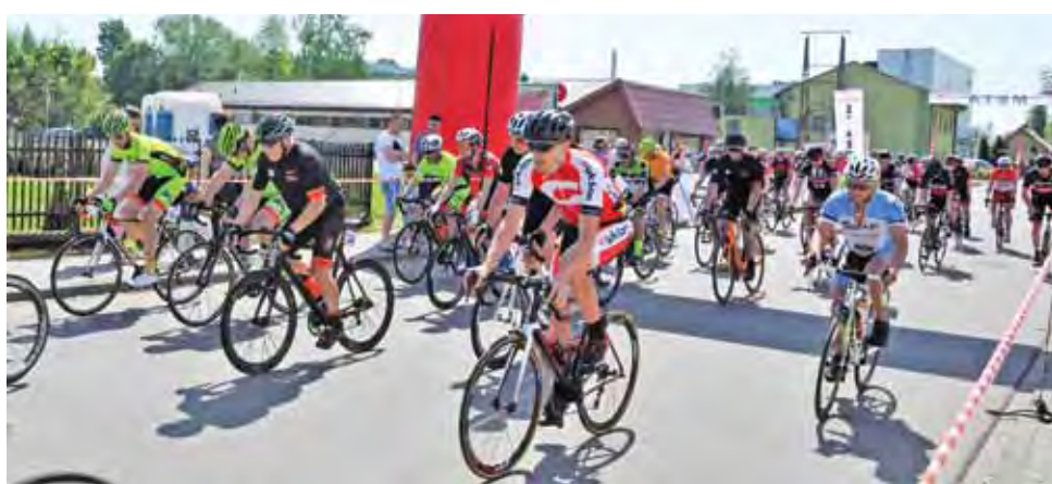
Kolarze tuż po starcie wyścigu Fit Race.

– 24 km runda najczęściej była oceniana jako urozmaicona i trudna technicznie. Sporo ciasnych