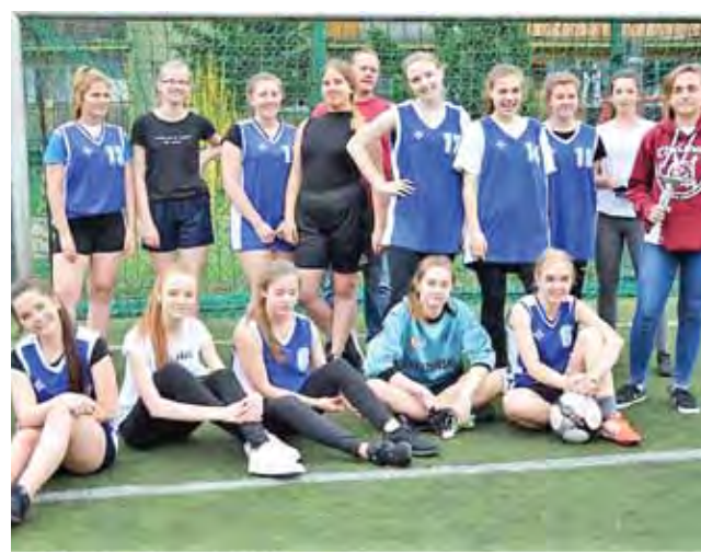
Piłkarki z I LO Łowicz obroniły mistrza powiatu.

Po emocjonujących grupowych pojedynkach, w meczu finałowym spotkały się piłkarki z Pijarskiej i ekipa I LO Łowicz. Mecz był wyrównany, ale ostatecznie podopieczne Przemysława Popławskiego z reprezentacji Chełmońskiego zdobyły dwie bramki i zapewniły sobie mistrzostwo powiatu łowickiego. W meczu o 3. miejsce ZSP nr 4 w Łowiczu pokonał Zespół Szkół Centrum Kształcenia Rolniczego w Zduńskiej Dąbrowie 1:0.