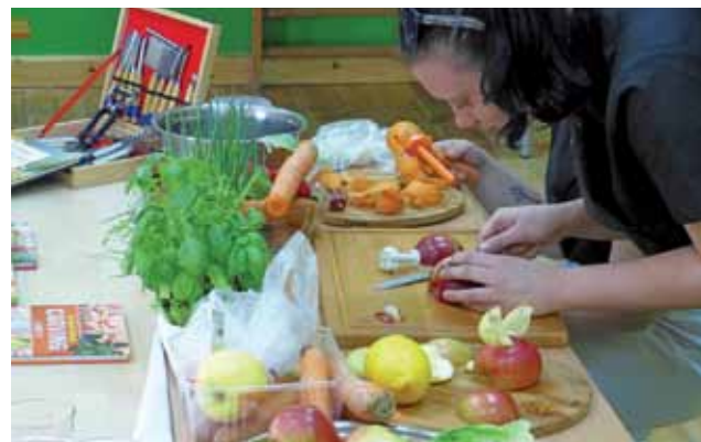
Technikę carvingu zaprezentowały uczennice ZSP nr 3 w Łowiczu.

Motywy przewodnim była marchewka, więc dominował kolor pomarańczowy, ale towarzyszyły jej też inne składniki.