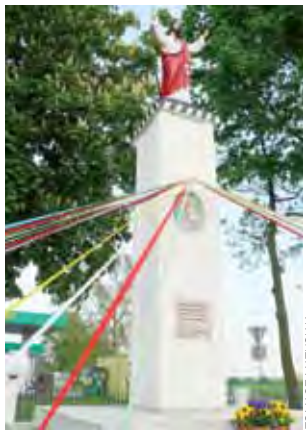
Kapliczka w Bednarach została w ubiegłym roku wyremontowana przez Gminę Nieborów, dziś przystrojona na wieczorne spotkania, cieszy oko jak nigdy przedtem.

Kolejnym miejscem, gdzie 30 kwietnia wieczorem spotkaliśmy osoby prowadzące porządkę, był krzyż przy drodze wojewódzkiej z Łowicza do Kiernozi, obok stacji paliw i przystanku autobusowego w Goleńsku . Jak się okazało, o to miejsce dbają mieszkańcy tzw. Goleńska Małego. Zawsze przed majem przychodzi tu, aby posprzątać i przystroić krzyż wstążkami. Nie wymaga to specjalnego ustalania dnia i godziny prowadzenia tych prac, bo osoby zaangażowane w to wiedzą, że na 1 maja kapliczka ma wyglądać na zadbane miejsce.