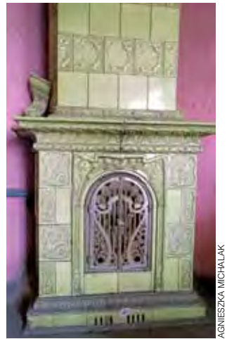
W budynku zachował się jeden oryginalny piec kaflowy oraz fragmenty innego. Właściciele chcą zachować widoczny na zdjęciu piec i odtworzyć drugi.

sał do młynarza pismo z prośbą o wyjaśnienie. Korespondencja ta zachowała się, stąd wiadomo, iż doszło do takiej sytuacji.