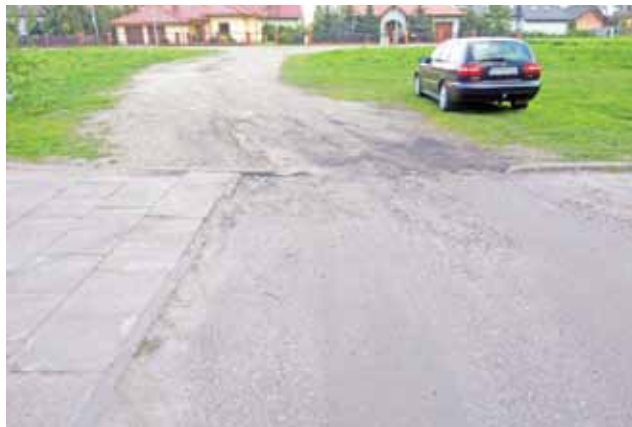
W planach ŁSM jest również połączenie uliczki wewnątrzosiedlowej z miejską – ul. Bursztynową.

Nawierzchnia z kostki ma też powstać w szczytach budynków bloków 27 do 35. W tym przypad-