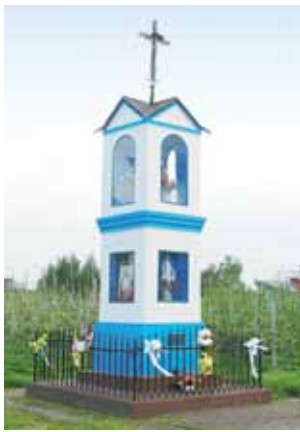
Kapliczka w Zabostowie Małym, która stoi na samym początku wsi, została przed majowymi spotkaniami pomalowana przez mieszkańców.

Przy krzyżu widnieje data 1993, ale zdaniem osób, które tak spotkaliśmy jest to rok ustawienia metalowego krzyża w miejscu, gdzie wcześniej stał drewniany.