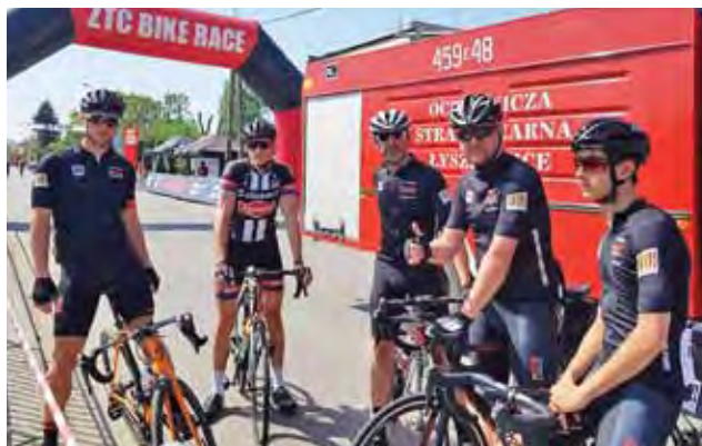
Mocna ekipa Klubu Kolarskiego Łowicz

Koszykówka | Wojewódzka liga kadetów U-16 M – finał B