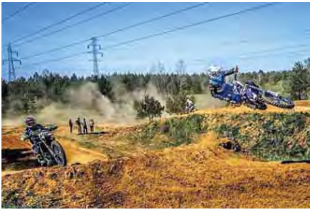
Super pozycja Pawła Wizgiera w locie.