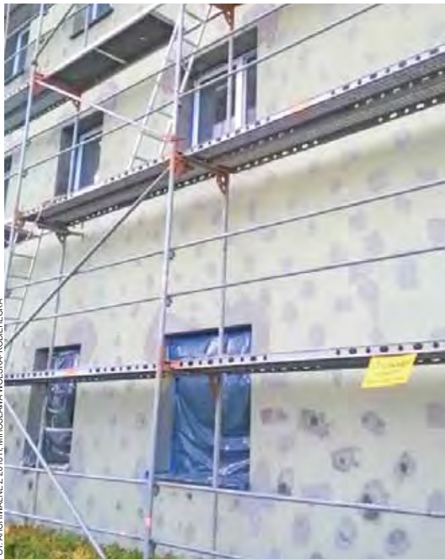
Członkowie wspólnoty z własnych kieszeni musieli m.in. pokryć koszty naprawy ocieplenia ściany szczytowej.

Głównymi organizatorami konkursu są Polski Związek Motorowy, Policja, Wojewódzki Ośrodek Ruchu Drogowego i Kuratorium Oświaty. tm