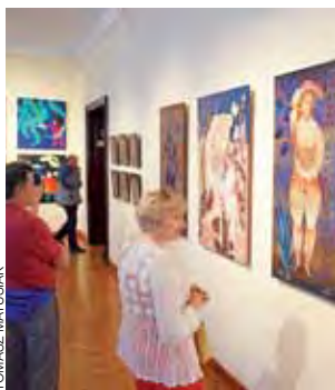
Prezentowane prace przenoszą oglądających do świata fantazji, snów, baśni i mitów.