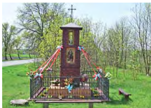
Kapliczka przy skrzyżowaniu drogi krajowej nr 14 z drogą na Błota Krępskie (gmina Domaniewice).