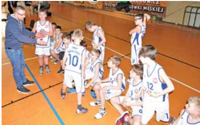
Młodzi koszykarze muszą dużo i sumiennie pracować, by dogonić rywali.

Esbank Junak Radomsko – UMKS Książek-2006 Łowicz 42:22 (12:3, 11:6, 10:4, 9:9)