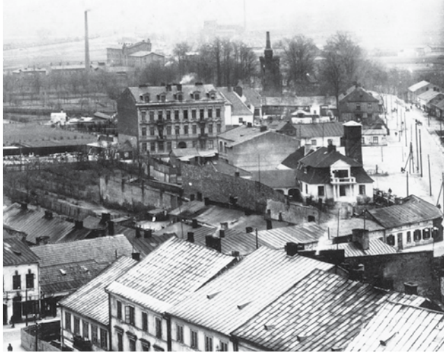
Młyn Moszka Żelechowskiego był niegdyś jednym z najwyższych budynków w Łowiczu. Na tym zdjęciu, wykonanym z wieży katedry w 1929 roku, jest on widoczny u góry po lewej stronie.

Nowi właściciele chcą w niej urządzić siedzibę firmy Dora Digital, która działa w wynajmowanych pomieszczeniach przy ul.