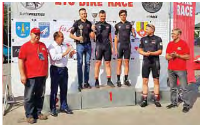
Najlepsi łowiczanie na podium.

– Mam oczywiście pewien niedosyt... Na takie zawody przyjeżdża zazwyczaj 200-300 osób z różnych stron Polski, często z rodzinami. Nie jest dla nich problemem kupno roweru o wartości dobrego auta. Pytanie, czy dowiedzieli się czegoś o Łowiczu lub okolicy?! Zaproszenie, oferta zwiedzania itd... NIC. Miało być nawet nie racy poinformować o wydarzeniu, powiat podobnie. Szkoda, bo klienci podani są na tacy. Wystarczy chcieć. Zwracam na to uwagę przy każdej okazji. Nie jestem organizatorem tych zawodów, a jedynie ich „dobrym duchem”. W sumie nic nie mogę... – podkreślił prezes. zł