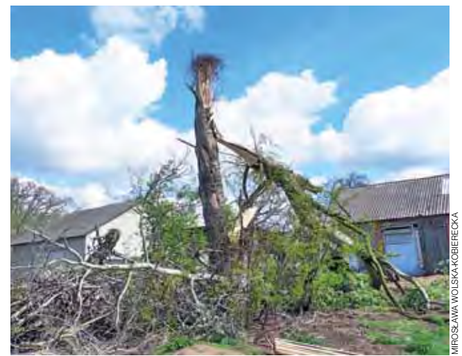
Tak wyglądała topola biała w Wygodzie, z której spadło gniazdo bocianie. Na zdjęciu nie ma jeszcze zamontowanej platformy, ale widać, że ptaki już próbowały odbudować gniazdo.

Początkowo wydawało się, że będzie można zaangażować w to straż. Ta jednak nie przyjechała, uznając, że nie jest to sytuacja, która zagraża bezpieczeństwu ludzi, więc zgłoszenie jest nieuzasadnione. Bociany po utracie gniazda były jednak tak zdeterminowane, że podjęły próbę odbudowania go na złamanej topoli, co im się nie bardzo udawało. Mało tego – zaczęły też znosić gałęzie na kominy dwóch budynków mieszkalnych w sąsiedztwie posesji, na której mieszkały, więc