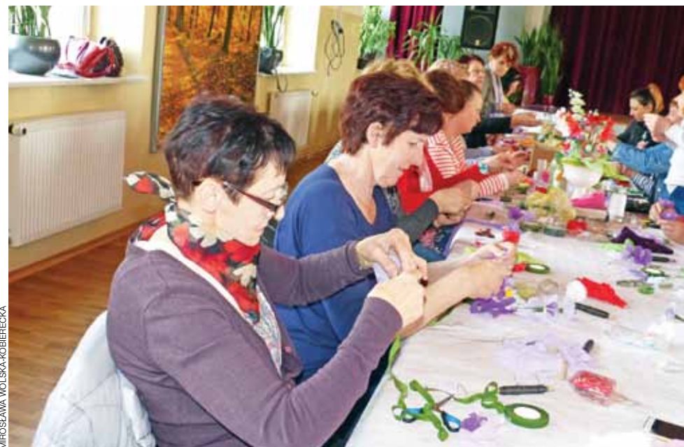
Czas na warsztatach panie spędziły naprawdę pracowicie. Technika robienia kwiatów, której nie znały, choć okazała się pracochłonna, to nie była trudna.

czas rekonwalescencji po operacji, natrafiła w internecie na instrukcję jak można z kolorowych dziecięcych rajstopek wykonywać kwiaty, a z nich – kompozycje i stroiki.