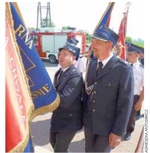
Gminny Dzień Strażaka w Chańsku. Pocztę sztandarową wchodzi do kaplicy.