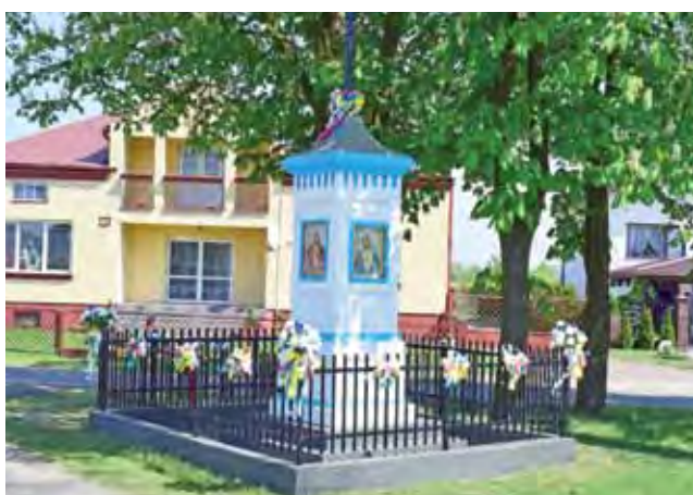
Kapliczka na skrzyżowaniu w Domaniewicach po gruntownym odnowieniu.