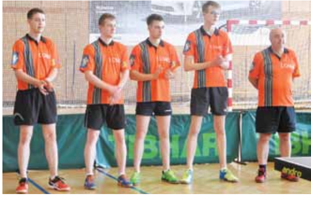
Teniści UMKS Książak Łowicz zwycięstwem zakończyli sezon.