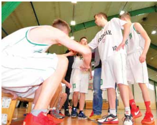
Kadeci Księżaka Łowicz w dobrym stylu zakończyli sezon.

Ośmiym zwycięstwem z rzędu łowiczanie zakończyli sezon. Zajęli piąte miejsce w gronie 9 ekip