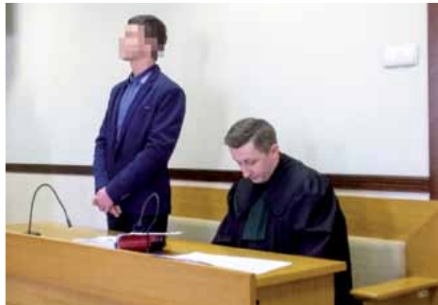
Oskarżony (dziś już skazany) podczas jednej z rozpraw w tej sprawie. Na ogłoszeniu wyroku nie stawiał się osobiście.

W procesie zastosowano przepisy z ustawy o ochronie zwierząt, w brzmieniu obowiązującym w momencie dokonania mordu, według których oskarżonemu groziło do 3 lat więzienia. Według znolizowanej, zaostrożonej wersji ustawy, która weszła w życie