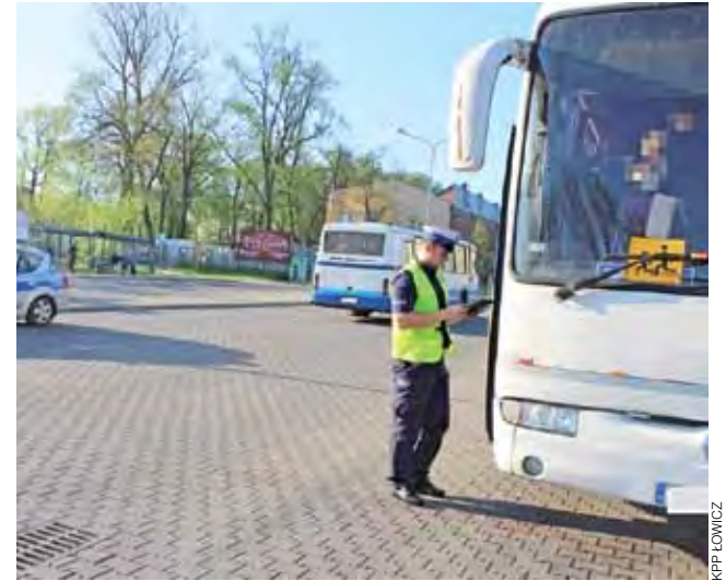
Kontrola autobusów odbywa się na parkingu za miejskim ratuszem.

23 kwietnia funkcjonariusze z „drogówki” łowickiej policji