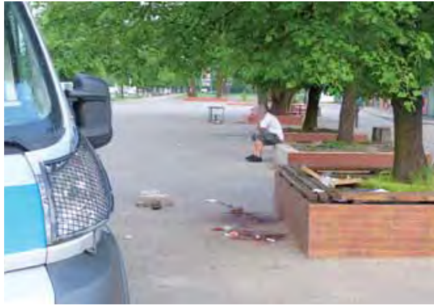
Miejsce morderstwa. Gdy tam byliśmy, na kostce były jeszcze ślady krwi.

– Z widzenia to się ich znało pewnie wszystkich. Siedzieli całymi dniami, jak mieli pieniądze to wypili, jak nie – to tylko posiedzieli. Czasami się pokłócili, poszarpani, ale to nie było groźne towarzystwo, innych nie zaczepiali – mówią osoby pracujące na targowisku. – O co tym razem poszło?