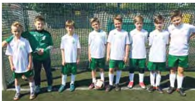
„Biali” pokonali Unię Skierniewice 9:6.

■ MKS Unia Skierniewice – MUKS Pelikan „Biali”-2008 Łowicz 6:9 (0:3, 4:2, 2:4); br.: 6 (32,