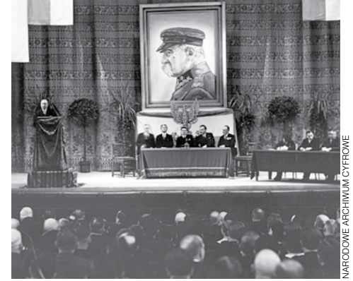
Warszawa, 7 kwietnia 1935. Odczyt wicemarszałka sejmu Stanisława Cara „O nowej konstytucji” w Teatrze Wielkim.