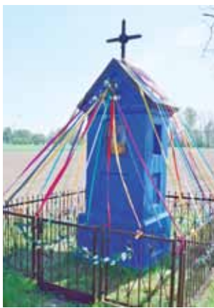
Jedna z kilku kapliczek przy drodze krajowej nr 14, przy skrzyżowaniu z drogą na Wygodę.