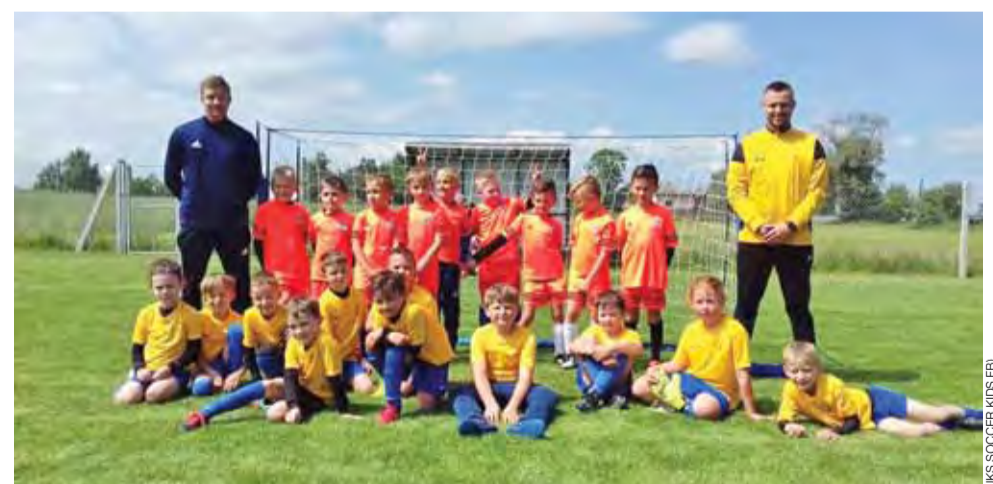
Wspólne zdjęcie zawodników Soccer Kids i UKS AP Rawa Mazowiecka.