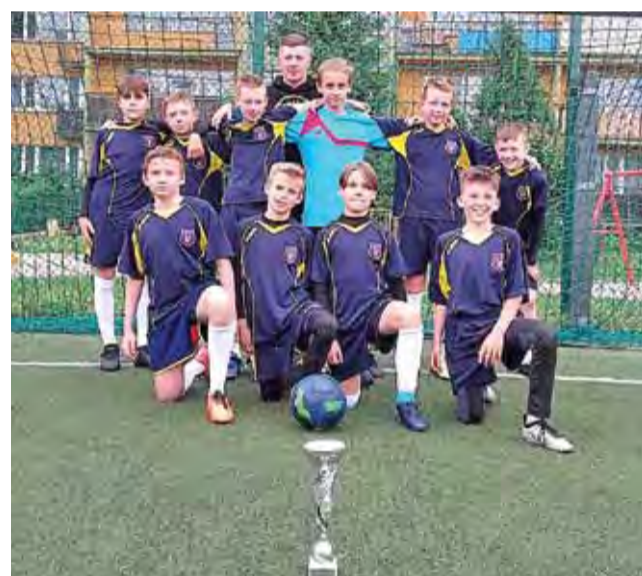
Mistrzowie powiatu w piłce nożnej z Pijarskiej Szkoły Królowej Pokoju.

Mistrzowska ekipa Pijarska SPK Łowicz grała w składzie: