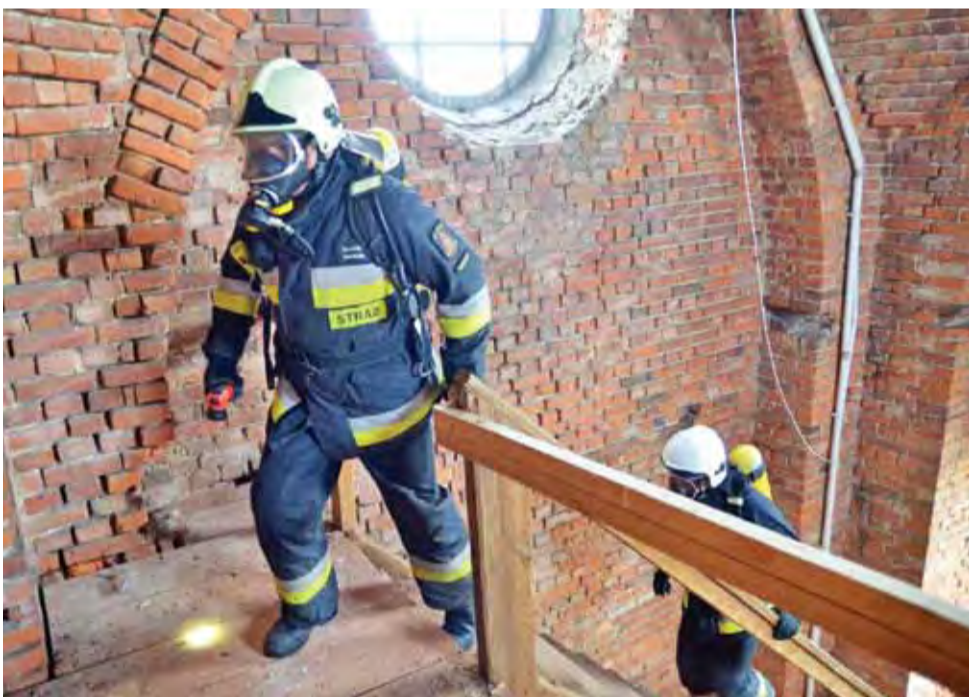
Strażacy z PSP w czasie ćwiczeń w domaniewickiej świątyni musieli wejść na wieżę.

Był trzeźwy, jednak nie uniknął mandatu karnego za spowodowanie kolizji na drodze. aa