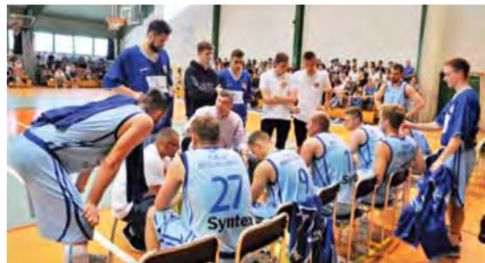
Łowiczanie marzą o wygranej w Jaworznie.

W finałowej parze AZS AGH Kraków (C1) podejmować będzie w swojej hali Górnik Trans.eu Wałbrzych. Koszykarze z Wałbrzycha u siebie przegrali 77:90, ale tutaj gra toczy się już o prestiż, bo awans mają zapewnione dwa zespoły. Na pewno Górni-