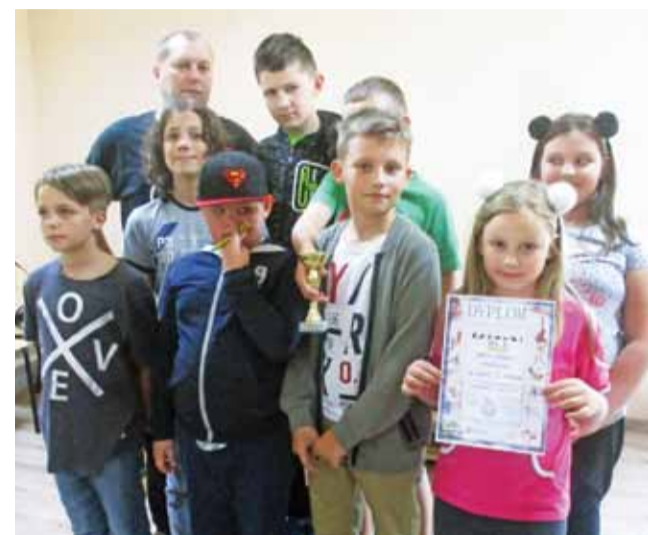
Drużyna UKS „Pałac” Nieborów wygrała wszystkie turnieje całego cyklu rozgrywek.