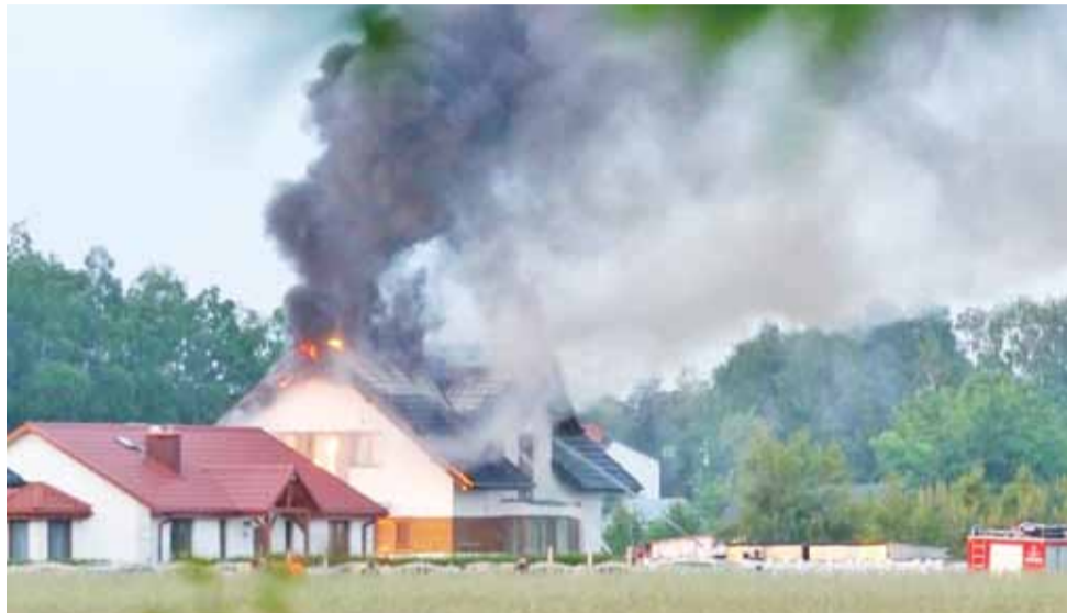
Płonący dom w Mysłakowie, dym widać było już z daleka.

Dyżurny z Państwowej Straży Pożarnej w Łowiczu skierował na miejsce siedem zastępów straży: z JRG Łowicz oraz OSP z Nieborowa, Bednar, Łowicza i Mysłakowa. Strażacy gasili pożar przy użyciu trzech prądów wody i wchodząc do wnętrza silnie zadymionego domu w aparatach ochrony dróg oddechowych. Strażacy udzielili też pierwszej pomocy poszkodowanemu mężczyźnie. Ogień szybko został opanowany, akcja trwała jednak blisko 3 godziny, bo strażacy musieli przełać wodą rzeczy, które wcześniej