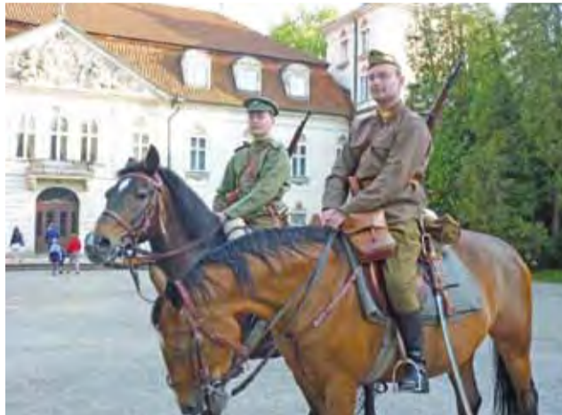
Jedną z atrakcji była prezentacja grupy rekonstrukcyjnej, odtwarzającej 14. Pułk Ułanów Jazłowieckich. Rekonstruktorzy byli obecni przed pałacem, a towarzyszyli im konie ze Stajni u Kowala.