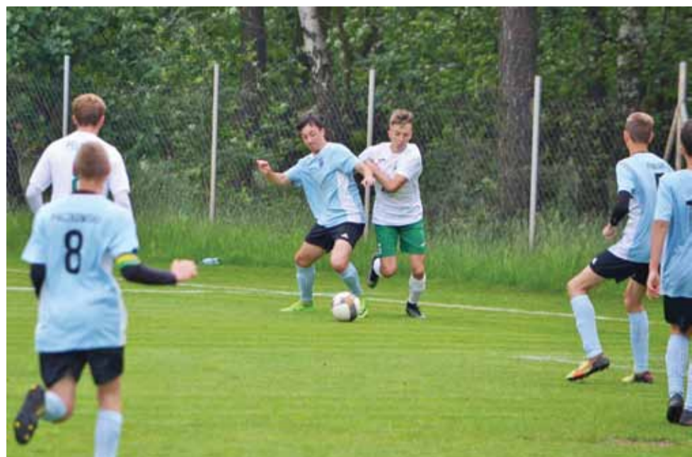
Pelikan 2002 odniósł kolejną wygraną w lidze.

Piłka nożna | Relacja z meczu Warta – Pelikan