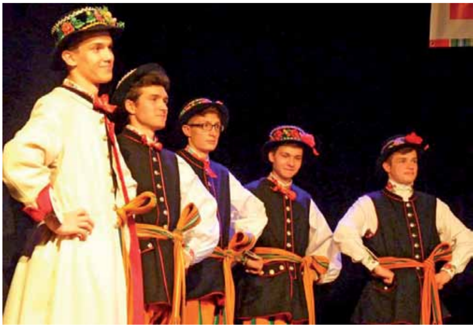
Kandydaci do tytułu Księżaka Roku 2018 podczas prezentacji w strojach łowickich.