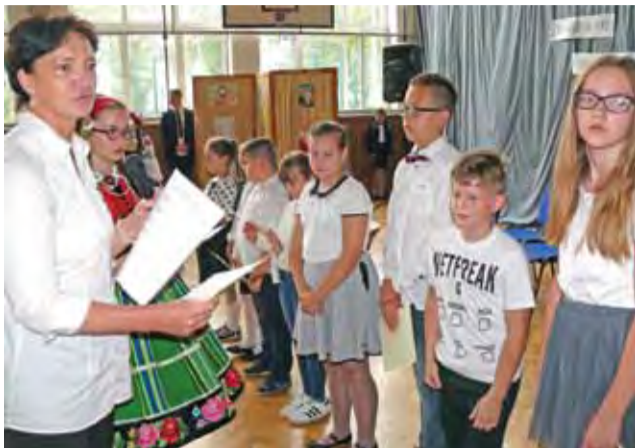
Łowicz. Akademia w Szkole Podstawowej nr 3 w rocznicę urodzin Karola Wojtyły, papieża Jana Pawła II.

Najpierw była msza święta, potem występy artystyczne i konferencja dla nauczycieli – tak w Szkole Podstawowej nr 3 w Łowiczu obchodzono 18 maja dzień patrona, kardynała Karola Wojtyły – Papieża Polaka. W obchodach udział wzięła cała społeczność szkolna oraz zaproszeni goście. Tego dnia przypadała 98 rocznica urodzin wybitnego Polaka.