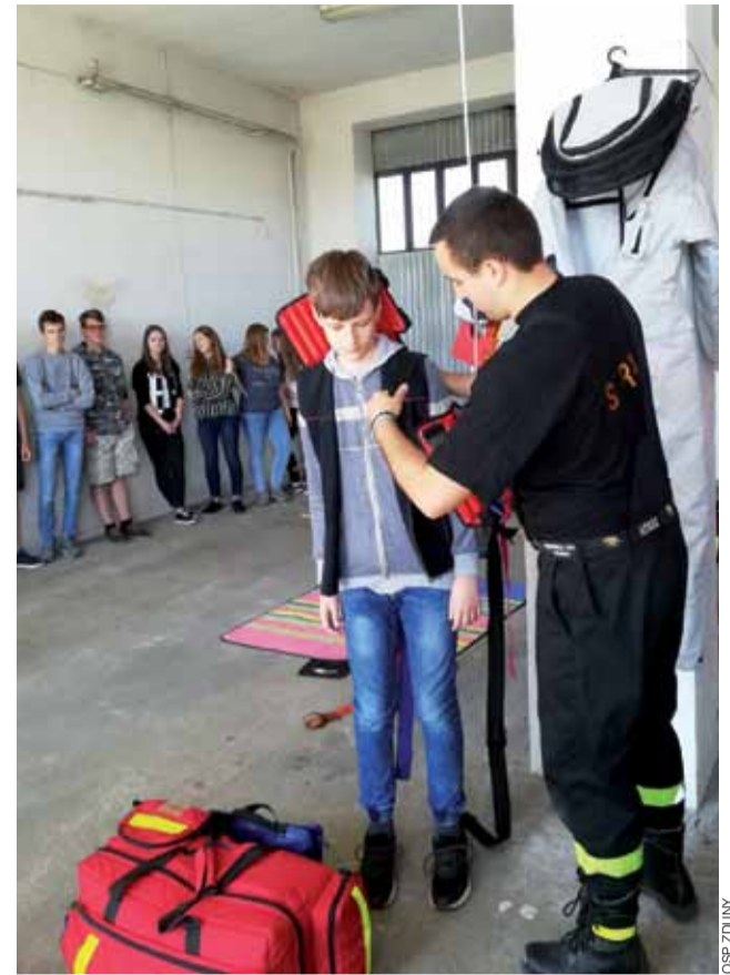
Młodzież z SP w Nowych Zdunach w czasie spotkania ze strażakami miała m.in. okazję dowiedzieć się, jak udzielać pierwszej pomocy osobie poszkodowanej.