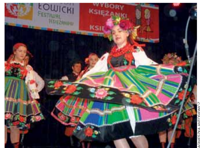
Kandydatki podczas prezentacji przed publicznością i jury w welniakach łowickich.