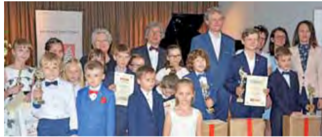
Podczas I Festiwalu Pianistycznego „Dźwięki Mazowsza” prezentowali swe umiejętności uczniowie szkół muzycznych.

Wystąpiło 32 uczniów szkół muzycznych. – Poziom, który