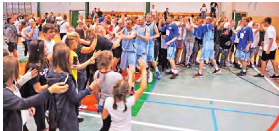
Po meczu tradycyjne podziękowania z kibicami.