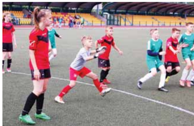
Pelikan 2006 (zielone stroje) pokonał zespół Kopernik Kiernozia.