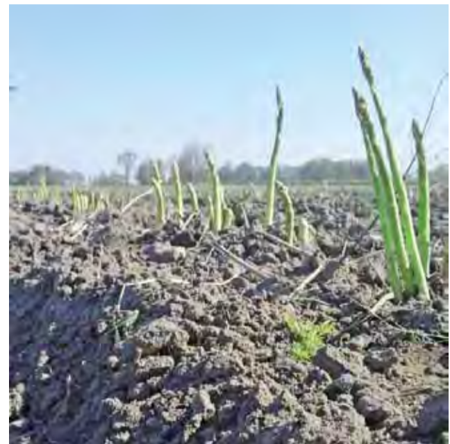
Tak wyglądają dojrzałe szparagi na polu przed ścięciem.

Szparagi od dawna uchodziły za przysmak kojarzony z luksusem. Były też cenione jako afrodyzjak. Współcześni dietetycy jak najbardziej potwierdzają, że ta roślina zasługuje na uwielbienie – jest skarbnicą witamin i składników mineralnych, a przy tym 100 gramów to tylko 18 kcal. ■