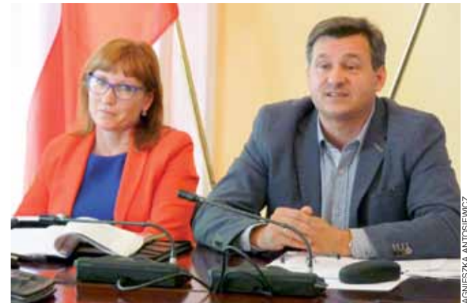
Przedstawiciele Krajowej Administracji Skarbowej omówili przepisy dotyczące sprzedaży alkoholu podczas imprez masowych.

sprzedawać żywność, jeśli ich utarg nie przekracza 20 tys. zł. Wystarczy wtedy prowadzić ewidencję sprzedaży, która powinna być uzupełniana po zakończonej