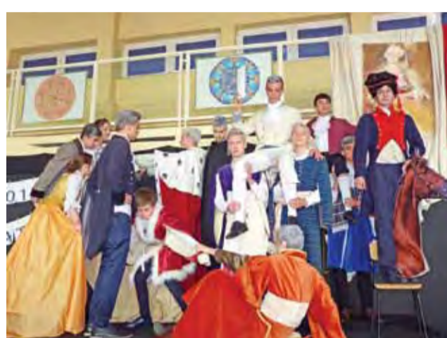
Żywa inscenizacja obrazu. Uczniowie zastygli w pozach jak na znanym dziele sztuki „Konstytucja 3 Maja 1791 roku” Jana Matejki.