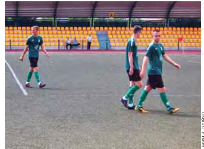
Gracze Pelikana II schodzili z murawy w kiepskich humorach.