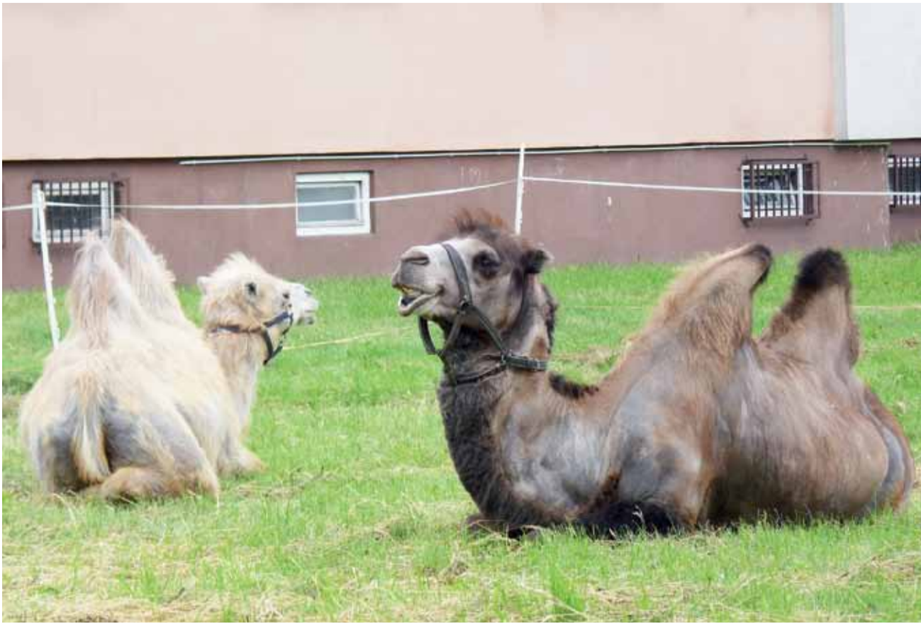
Wielbłądy w sąsiedztwie bloków i osiedla domów jednorodzinnych – taki widok przywitał w sobotę rano mieszkańców Bratkowic.

Łowicz | Niezwykły poranek na os. Bratkowice