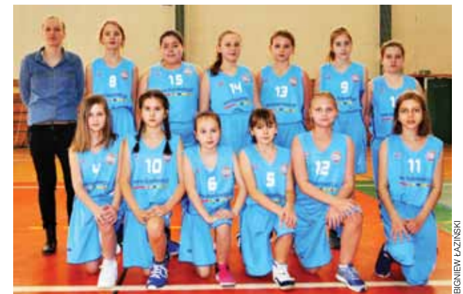
Koszykarki z rocznika 2006-2007 zagrają jeszcze turniej o miejsca 5-8.