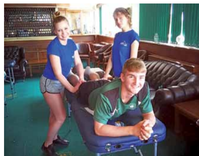
Podczas stażu Techników Masażystów w klubie piłkarskim Plymouth Argyle F.C.

Stażysty mieli również możliwość uczestniczenia w typowym treningu piłkarskim oraz obserwowania treningu zawodników po kontuzjach. Oprócz ćwiczeń praktycznych mieli także zajęcia teoretyczne z zakresu anatomii i fizjologii wysiłku oraz usprawniania po urazach sportowych na boisku.