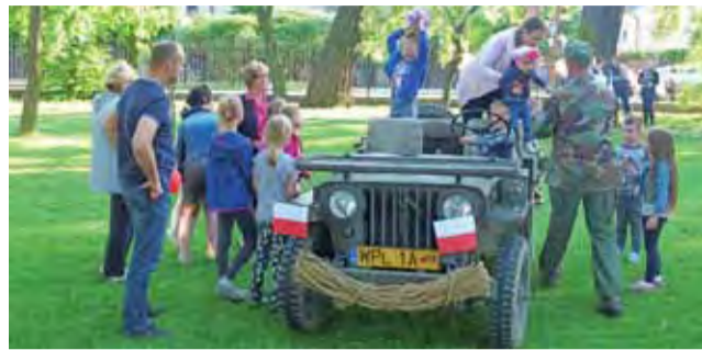
Wokół Jeepa Willysa zatrzymywało się sporo osób.