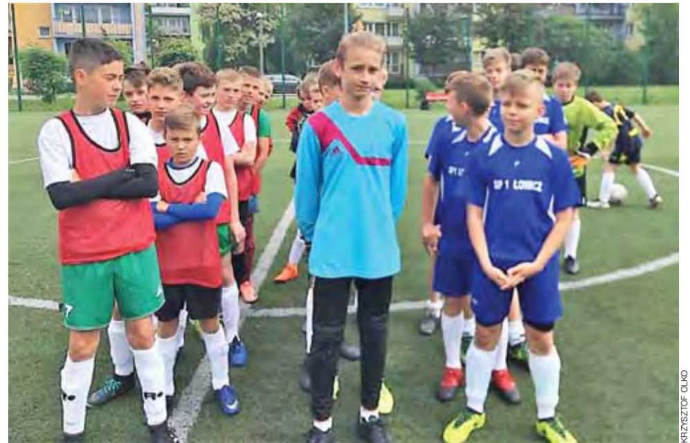
Uczestnicy Miejskich Igrzysk dzieci w piłce nożnej.