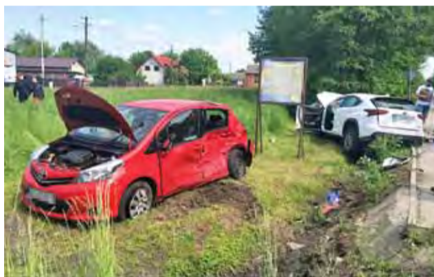
Rozbite samochody w wypadku w Sochaczewie, po lewej stronie łowicka L-ka.

Na miejscu jako pierwsze zjawili się trzy zastępy z Państwowej Straży Pożarnej w Sochaczewie, strażacy zabezpieczyli miejsce i pojazdy i udzielili pierwszej pomocy nieprzytomnej kobiecie, u której stwierdzono brak funkcji życiowych. Wykonywano u niej resuscytację krążeniowo-oddechową. Po przybyciu Zespołu Ratownictwa Medycznego zdecydowano o przetransportowaniu jej śmigłowcem Lotni-