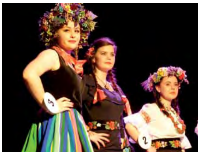
Kandydatki do tytułu Księżanki Roku 2018 w strojach inspirowanych folklorem łowickim.

choć pewien etap w ich życiu się kończy, to tak naprawdę Księżanką i Księżakiem Roku 2017 pozostaną na zawsze.