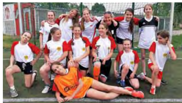
Dziewczyny z SP 4 w rzutach karnych wygrały mistrzostwo powiatu.

■ GRUPA B: SP nr 2 w Łowiczu – SP w Nieborowie 0:1, SP w Nowych Zdunach – SP nr 2 w Łowiczu