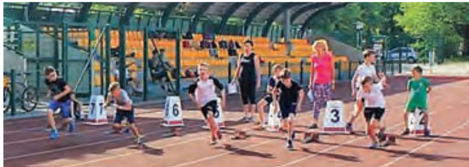
Najwięcej chętnych jest zawsze do rywalizacji w biegu na 60 metrów.