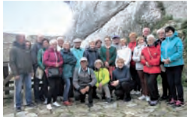
Członkowie Łowickiego Uniwersytetu III Wiek podczas zwiedzania zamku w Bobolicach i Jaskini Głębokiej w rezerwacie Góra Zborów.

Ceremonia otwarcia Olimpiady rozpoczęła się przemarszem wszystkich reprezentacji i zapaleniem znicza olimpijskiego. Seniorzy rywalizowali ze sobą w dyscyplinach tj. pływanie (50 m stylem klasycznym, 50 m stylem dowolnym), lekkoatletyka (bieg na 60 i na 200 m,