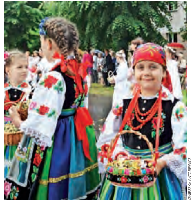
W procesji do 4 ołtarzy wzięły udział m.in. dziewczynki w łowickich strojach, które sypały kwiaty.

Co ciekawe, niewykorzystane kwiaty nie zostały zmarnowane, były sypane podczas procesji przez bielanki. Jak się dowiedzieliśmy, kwiaty z dywanu również mają swoje kolejne przeznaczenie. Po zakończeniu procesji są zbierane i suszone. Na Wielkanoc, gdy nie ma jeszcze świeżych kwiatów, są sypane podczas procesji rezurekcyjnej.