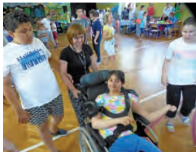
Główna część poniedziałkowej zabawy zorganizowana była w szkolnej sali gimnastycznej.

Po porannej mszy świętej w intencji ośrodka, czyli około godziny 11.00, rozpoczęła się impreza, która trwała do około 16.00. Zorganizowali ją wychowawcy, nauczyciele i pracownicy ośrodka, przygotowując zabawę z muzyką i wodzirejem, konkursy, poczęstunek inne atrakcje. Z zaproszeń skorzystało kilkanaścioro absolwentów z różnych lat, większość przyjechała na zabawę wraz z rodzicami. Wśród gości znalazła się też kilkusobowa grupa podopiecznych Specjalnego Ośrodka Szkolno-Wychowawczego w Łowiczu, w którym z kolei uczniowie z Mocarzewa gościli na Dniu Dziecka kilka dni wcześniej – placówki te ze sobą współpracują, stąd takie wzajemne wizyty i re-