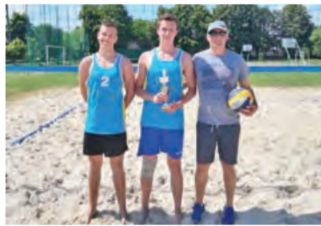
Para z I LO obroniła mistrzowski tytuł.

■ Półfinały: ZSP 1 w Łowiczu – ZSP 4 w Łowiczu 9:21, I LO w Łowiczu –