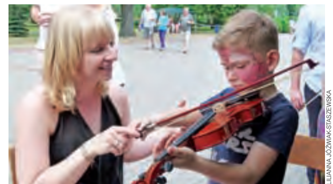
Warsztaty muzyczne oraz minikoncert muzyki filmowej zorganizowało Studio Artystyczne.

Uczestnicy mieli do wyboru m.in. pokaz dbania o higienę jamy ustnej, warsztaty wyplatania koszyków wiklinowych oraz haftu ręcznego i maszynowego, kompozycji florystycznych i haftu, stylizacji fryzur, czy darmowe porady weterynaryjne w zakresie profilaktyki. Biblioteka Pedagogiczna, która przyłączyła się do przedsięwzięcia, zainaugurowała Tydzień Czytania Dzieciom. Natomiast warsztaty muzyczne oraz minikoncert muzyki filmowej zorganizowało Studio Artystyczne. Nie zabrakło stanowisk mini golfa i konkursów z nagrodami. Naj-