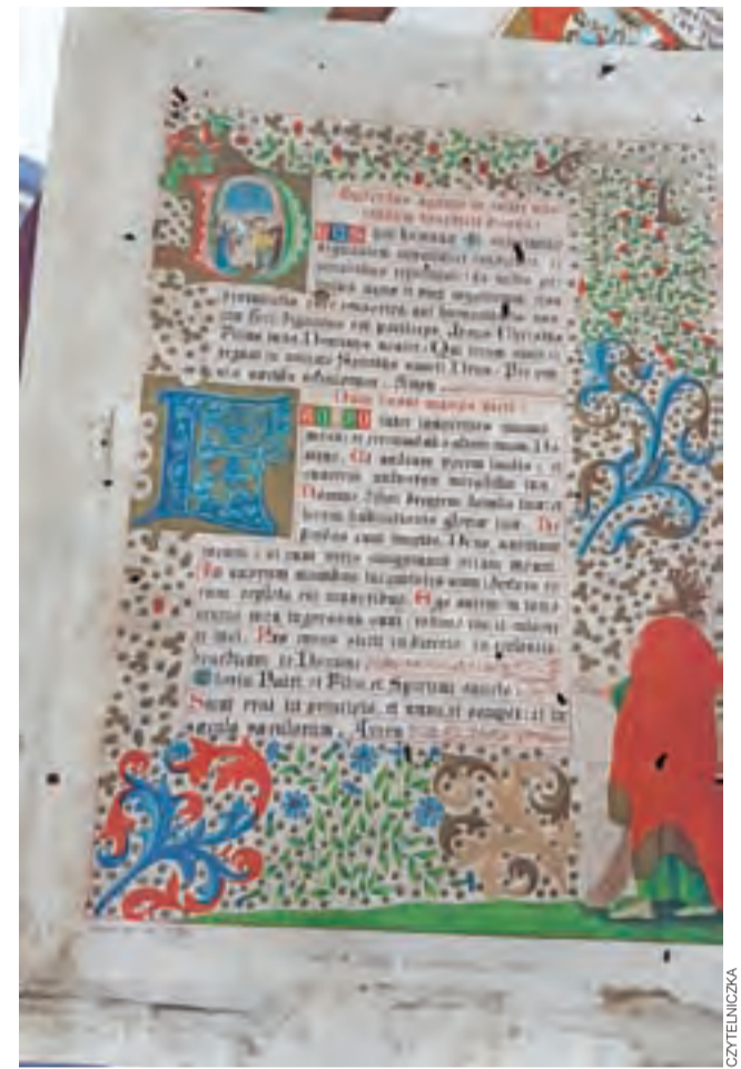
Jeden z kanonów z okresu XIX wieku, który został zabezpieczony pod kościołem w Nieborowie.

Wspólnie jeszcze z jednym mężczyzną rozbili komodę przygotowując ją do spalania, wcześniej wyjęli z niej wazy lub flakony. – Sam zawiozłem te tacki do stodoły przy plebanii – dodaje. Zapamiętał, że jedna z osób, która była przy ogni-