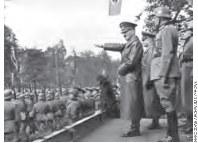
Warszawa, 5 października 1939. Adolf Hitler przyjmuje defiladę wojsk niemieckich w Alejach Ujazdowskich.