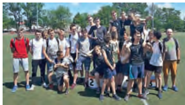
Zdobywcy pucharów w drużynowej LA chłopców.