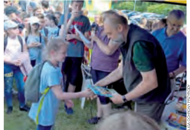
Finałem rajdu było wręczenie pucharów, dyplomów i nagród dla zwycięzców konkursów, które przeprowadzono w czasie jego trwania.