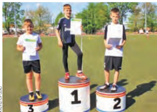
Podium i dyplom to powód do super dumy.