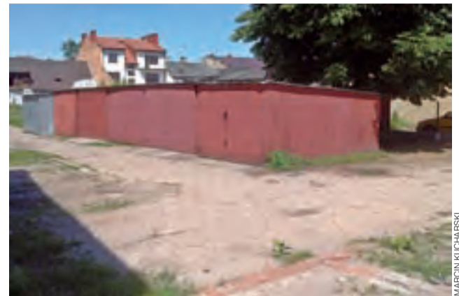
Zdarzało się tak, że parkujące na placu samochody uniemożliwiały wyjazd samochodów z garaży.

Sprawę kłopotów parkingowych próbuje ruszyć zarząd osiedla Nowe Miasto. – Napisaliśmy do komisji opiniującej zmiany w organizacji ruchu, żeby rozważyć czasowe wprowadzenie możliwości parkowania wzdłuż ul. Sikorskiego – powiedział nam członek zarządu osiedla oraz rad-