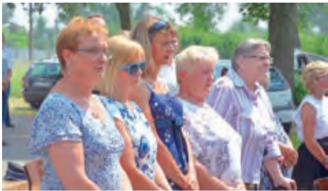
Uroczystości przed Domem Ludowym w Goleńsku odbyły się z udziałem mieszkańców.

Podczas uroczystości minutą ciszy uczczono pamięć dru-