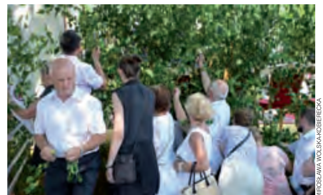
Zwyczaj zabierania gałązek brzozy z ołtarza, nie przez wszystkich akceptowany, w Księżstwie Łowickim jest – jak widać – wciąż bardzo popularny.