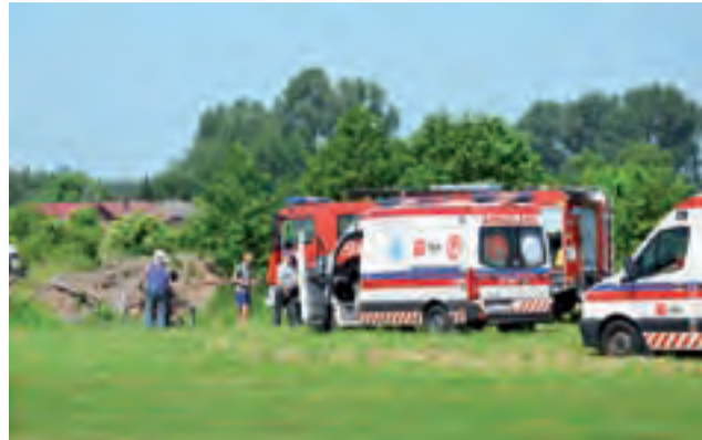
Ma miejsce wypadku lotniczego przyjechała policja, straż i dwie karetki pogotowia ratunkowego.

Osoby, które spotkaliśmy na lądowisku, utrzymywały, że lot był prezentem urodzinowym dla pasażera, ufundowanym przez jego partnerkę. Nie jest to jednak pewne, czy pilot otrzymał za lot wi-