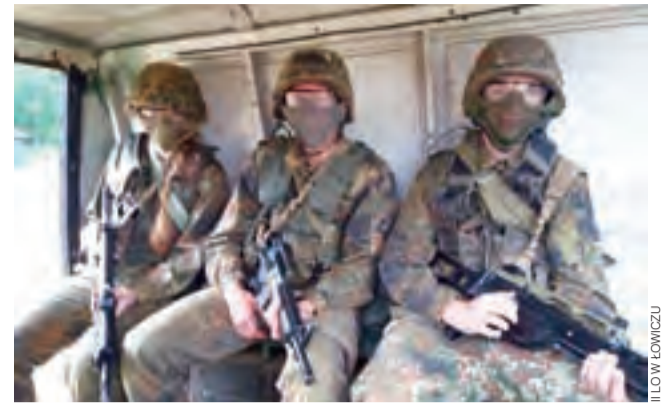
Manewry wykonywano w pełnym umundurowaniu.

Uczniowie ćwiczyli m.in. posługiwanie się bronią, działania na pojazdach wojskowych, zasady konwojowania. Wymagało to dużej wytrzymałości i zdolności do współpracy. Uczniowie uważają jednak, że 3 dni takich zajęć to była dla nich przyjemność. tm