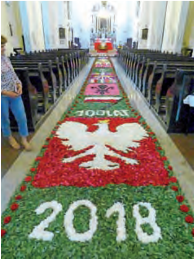
Na dywanie kwiatowym w Domaniewicach w tym roku pojawił się motyw związany z 100. rocznicą odzyskania przez Polskę niepodległości.

Po kilku latach robienia tego dywanu, panie mają w tym sporą wprawę. A wszystko to zapoczątkowała pochodząca z Rawy Mazowieckiej siostra ze Zgromadzenia Sióstr Pasjonistek Święte-