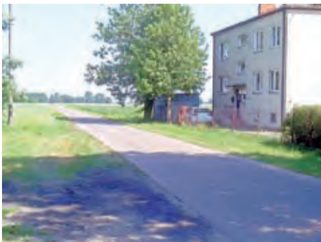
Gdzieś w tym rejonie 60-letnia kobieta została trzykrotnie ugodzona nożem przez syna.

5 czerwca, o godzinie 12 na posiedzeniu niejawnym w Sądzie Rejonowym w Łowiczu zapadła decyzja o areszcie dla zabójcy. Dzień wcześniej usłyszał on trzy zarzuty prokuratorskie. Dotyczą one zabójstwa matki, niewykonania polecenia zatrzymania pojazdu mechanicznego oraz narażenia policjantów na bezpośrednie niebezpieczeństwo utraty życia lub ciężkiego uszczerbku na zdrowiu. Za pierwszy z wymienionych czynów (art. 148) grozi mu nawet kara dożywotniego pozbawienia wolności. Zatrzymany twierdzi, że w ogóle nie pamięta wydarzeń z tego dnia. mak