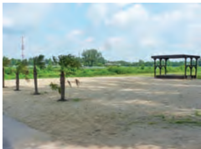
Popularne jeszcze w ubiegłym roku w sezonie letnim miejsce dziś świeci pustkami.

Zdaniem naszego rozmówcy, ta kwestia wciąż pozostaje otwarta, jednak z inicjatywą musiałaby wystąpić osoba zainteresowana prowadzeniem tego typu działalności. aw