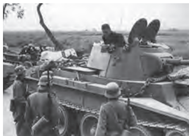
Wrzesień 1939. Spotkanie niemieckiego i radzieckiego patrolu na linii demarkacyjnej.