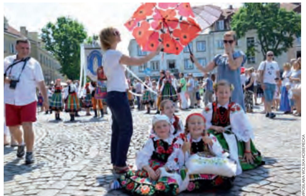
Dziewczęta w strojach ludowych odpoczywają na bruku Starego Rynku, a ich mamy stoją z parasolkami, aby choć trochę uchronić je od palących promieni słonecznych.