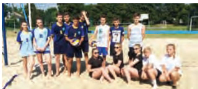
Łowicze pary walczyły o awans na zawody powiatowe.

Zawody rozegrano systemem każdy z każdym, zatem przeprowadzono łącznie cztery pojedynki. Po rozegraniu trzech spotkań w gronie dziewczyn okazało się,