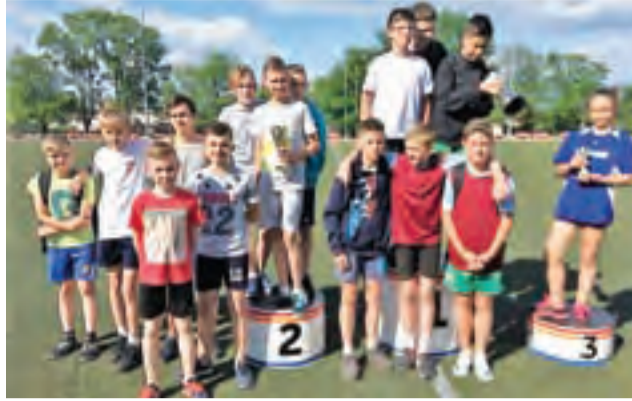
Najlepsi lekkoatleci powiatu łowickiego.