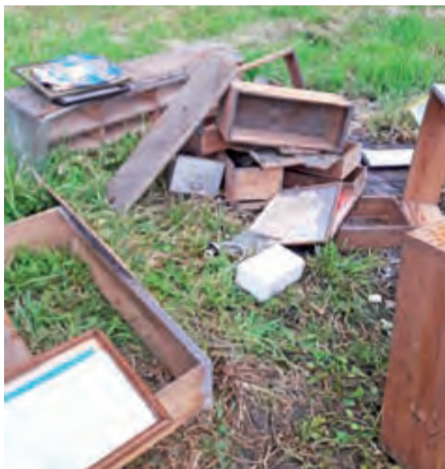
XIX-wieczna wiejska komoda, która została rozbita w miejscu paleniska. Wokół niej widać porzucane stare druki.