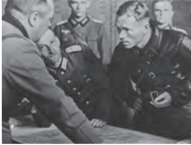
Wrzesień 1939. Spotkanie żołnierzy Wehrmachtu i Armii Czerwonej na Kresach Wschodnich II Rzeczypospolitej.