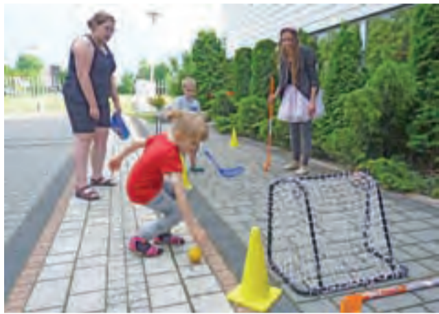
Rozgrywki w mini unihokeja dla dzieci były jedną z atrakcji spotkania.

– Długo i głęboko się zastanawiałam, czy jestem w ogóle odpowiednią osobą, żeby pełnić tutaj rolę gościa specjalnego. (...) Jest na pewno wiele kobiet, które osiągnęły spektakularne sukcesy. Ja jestem dopiero na początku swojej drogi, całkiem niedawno – bo we wrześniu – zostałam dyrektorem i tak naprawdę o sukcesie jeszcze nie mogę mówić. Mój sukces