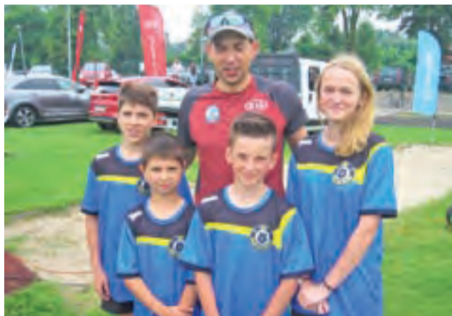
Biegacze Pijarskiej z mistrzem olimpijskim Zbigniewem Bródką.

Miłośnicy sportów wytrzymałościowych mieli do wyboru trzy konkurencje. Amatorzy chodzenia mogli spróbować swoich sił w marszu Nordic Walking na dystansie 5 km, biegacze na dystansie 5 kilometrów, a biegacze i kolarze w duathlonie – 7 km bieg, 7 km rower i 3 km bieg. W kon-