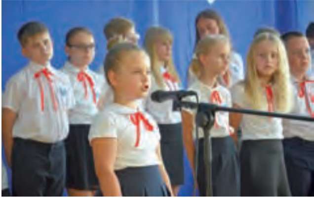
Uczniowie zaprezentowali program artystyczny nt. znaczenia szkoły w lokalnym środowisku. Był to nastrojowy montaż z wierszami i piosenkami.