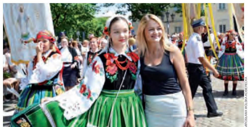
Takie sytuacje, że turyści chcą zapozować do zdjęcia z łowiczankami, są w Boże Ciało powszechne.