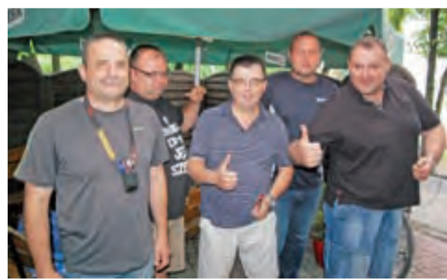
Ekipa ŁKD Leg Łowicz szykuje się do ostatniego meczu.

To duży sukces Lega Łowicz, gdyż w rozgrywkach ligowych