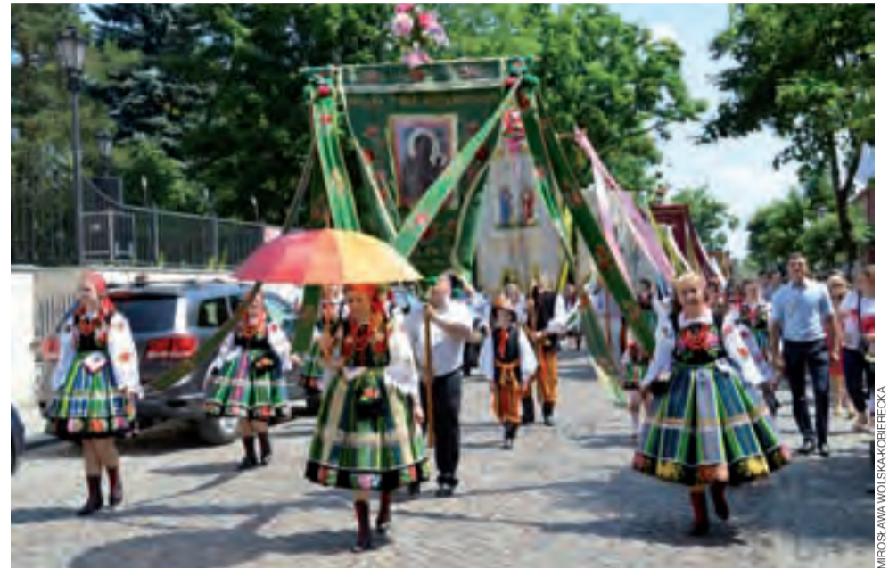
Ulica 3 Maja z szeroką jezdnią i szerokimi chodnikami, jest jednym z miejsc, gdzie procesja prezentuje się godnie.

Nieco mniej osób pozostało w Łowiczu dłużej, aby zobaczyć Paradę Pasiaków i występy zespołów folklorystycznych na scenie ustawionej na Nowym Rynku. Te trwały od 14.00 do 18.00. Najdłuższą bawiono się – w tumanach kurzu, spowodowanym suszą i pracami związanymi z prowadzoną tam budową ulicy Dmowskiego – w wesołym miasteczku ustawionym przy ul. Kaliskiej. ■