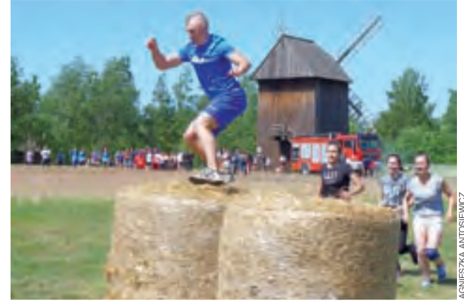
Przeskok przez baloty słomy – to jedna z przeszkód na trasie Armageddonu w Maurzycach.

Widowiskowe były międzyszkolne rozgrywki w żywe warcaby (pionkami byli sami uczniowie), w których wygrał zespół z Ekonomika. Młodzieży podobał się też występ zespołu Oldskulowe Trampki, zajęcia samoobrony prowadzone przez policjantów z Komendy Powiatowej Policji w Łowiczu oraz pokaz ratownictwa drogowego w wykonaniu strażaków z Komendy Powiatowej