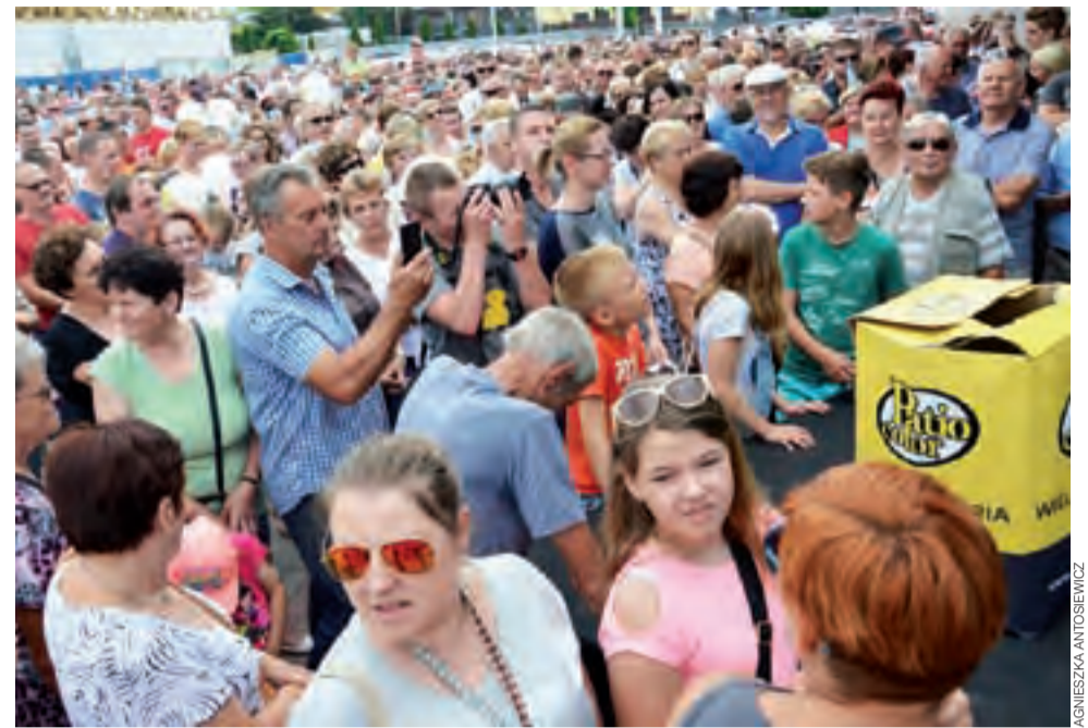
Tłumy podczas losowania nagród w loterii Patio Color.

Nieco większa kwota, 705.651 zł, została zapisana na remonty w baszcie gen. Klickiego , z czego dotacja to 466.728 zł, a wkład własny miasta – 238.923 zł. mwk