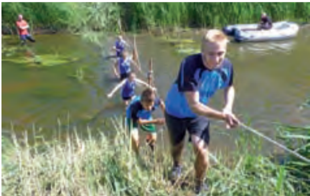
Dużym wyzwaniem było przeprawienie się na drugi brzeg rzeki Słudwi.

Podczas imprezy można też było m.in. wziąć udział w plenerze malarskim prowadzonym przez Warsztaty Terapii Zajęciowej „Tacy Sami” (chętnych było tylu, że zabrakło przygotowanych sztalug), a dzięki Ośrodkowi Szkolenia Kierowców „Rondo” i Zakładowi Karnemu odbyć spacer w alko- lub narkogoglach (symulują widzenie po spożyciu alkoholu lub narkotyków). Dostępnych było też wiele innych stoisk, czynny był bufet i grill. aa