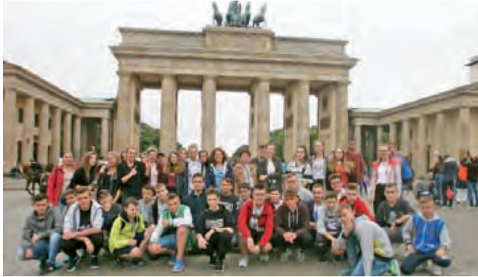
W czasie wycieczki nie mogło zabraknąć zobaczenia Bramy Brandenburskiej.

Podróż do Niemiec trwała około 6 godzin. Pierwszą część wycieczki poświęcono zwiedzaniu stolicy Brandenburgii – Poczdamu. Na początek uczestnicy udali się na spacer do Dworku Cecilienhof, gdzie na przelomie lipca i sierpnia 1945 roku odbyła się znamienna dla historii Konferencja Poczdam, w czasie której