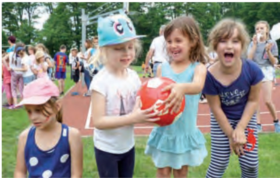
Wiele frajdy dostarczyły najmłodszym zabawy prowadzone przez animatorów.

Na sali gimnastycznej podsumowany został projekt z zakresu edukacji ekologicznej pt. „Kocierzewska atmosfera dech zapiera”, realizowany w tym roku szkolnym w szkole w Kocierzewie Płd., przy udziale dotacji z WFOŚiGW. Zo-