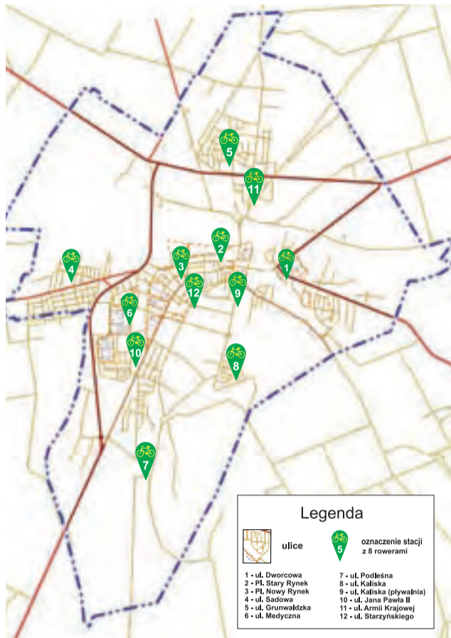
Lokalizacja stacji rowerowych w Łowiczu.

Druga uwaga dotyczy wyboru generacji rowerów, jakie mają być