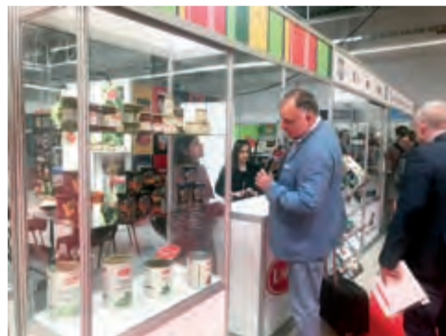
Barwne łowickie stoisko cieszyło się dużym zainteresowaniem uczestników targów żywności.

Drugi i trzeci dzień imprezy upłynęły pod znakiem spotkań z Mistrzami Tradycyjnej Kuchni Polskiej. W piątek, 25 maja, odbyło się spotkanie z Robertem Sową, zaś w sobotę na targach gościły inne sławy sztuki kulinarnej: Robert Makłowicz i Pascal Brodnicki. Szeffowie kuchni chętnie dzielili się z przybyłymi swoimi doświadczeniami oraz anegdo-