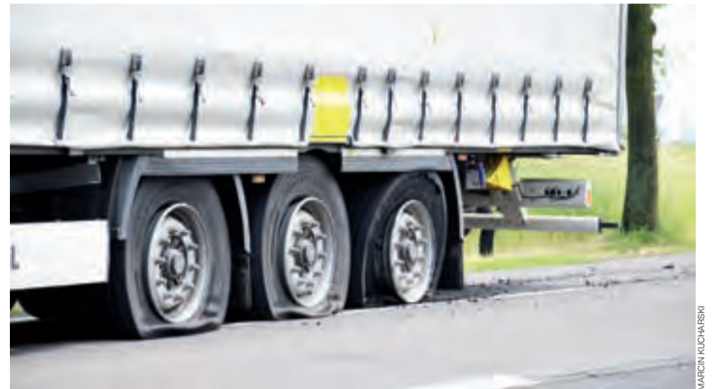
Podczas próby zatrzymania ciężarówki policja przestrelała opony.