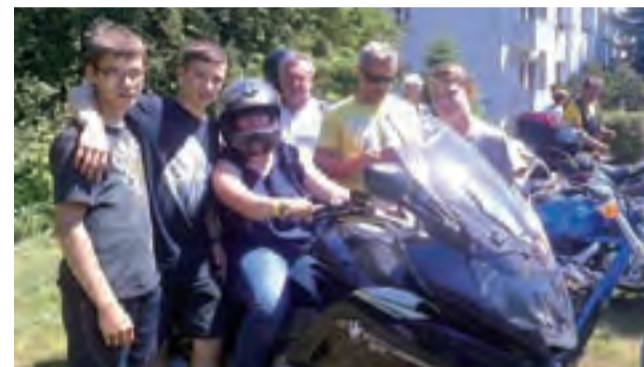
Jedną z atrakcji festynu był pokaz różnego rodzaju motocykli.

To nie jedyny akcent z Janem Brzechwą – zaprezentowa-