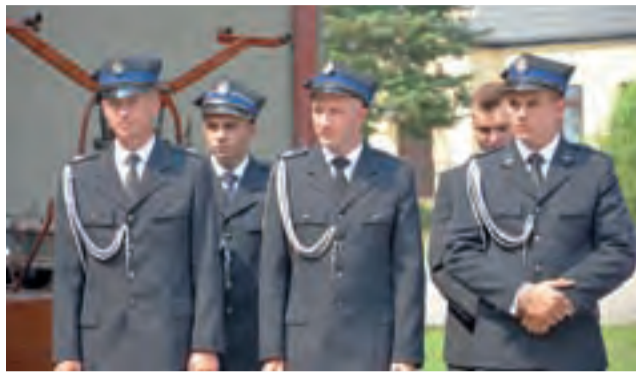
Druhowie z OPS Goleńsko podczas uroczystości 100-lecia jednostki.

Podczas uroczystości ogłoszono, że Prezydium Zarządu Związku