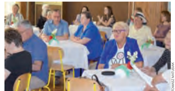
Początek karaoke – z czasem sala w dawnym Gimnazjum nr 1 zapełniała się jeszcze bardziej.

Na zakończenie spotkania publiczność miała okazję kupić książkę i otrzymać autograf autora, z możliwością tej skorzystał niemal wszyscy, zamieniając z nim kilka słów. tb