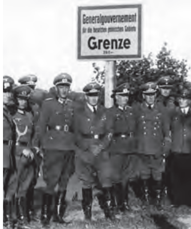
Lipiec 1940. Gubernator Hans Frank w towarzystwie oficerów na granicy niemiecko-radzieckiej.

Tematy kolejnych spacerów w czerwcu to: 10 czerwca – „Sztuka w prymasowskim Łowiczu”, 17 czerwca – „Byłem tu...! Śladami sławnych postaci w Łowiczu” i 24 czerwca – „Na szlakach Niepodległości” w Łowiczu. tb