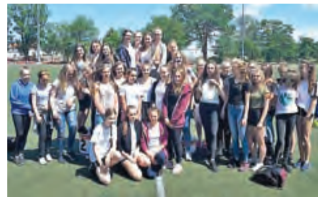
Lekkoatletki z roczników 2002-2004 na podium zawodów LA.