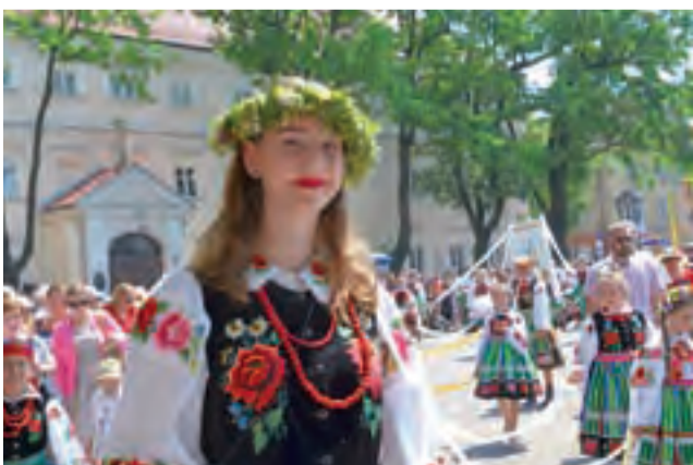
W tegorocznej procesji dało się zauważyć łowiczanki z wiankami zaplecionymi z żywych kwiatów i liści.