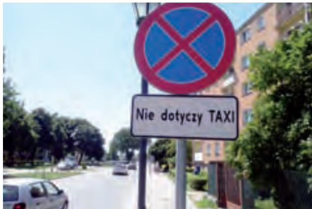
Zakaz parkowania przy ul. Sikorskiego na wysokości bloków os. Noakowskiego ciągle jeszcze obowiązuje.

– Ludzie parkowali bez pojęcia. Żona miała wiele razy problem, żeby wyjechać samochodem. Widziałem, że starszy pan, który ma