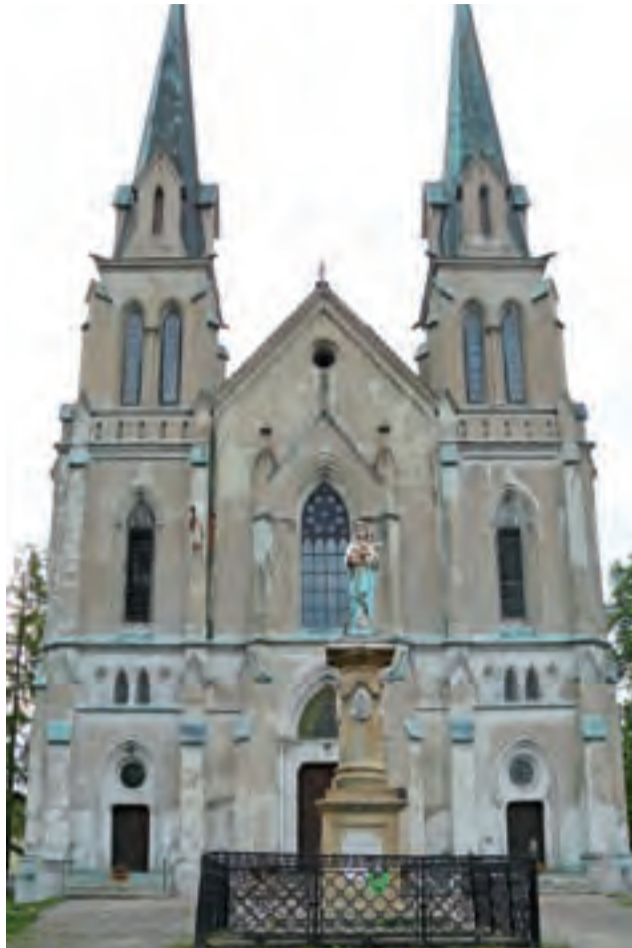
Kościół pw. Matki Bożej Bolesnej w Nieborowie to jedna z piękniejszych świątyń na terenie powiatu łowickiego, w której pochowani są członkowie rodu Radziwiłłów.

Kanony nie są rzeczami cennymi, ale ich wykonanie w stylistyce gotyckiej jest dowodem na to, że książę Michał Piotr Radziwiłł, fundując nowy neogotycki kościół chciał w przemyślny sposób go wyposażać.