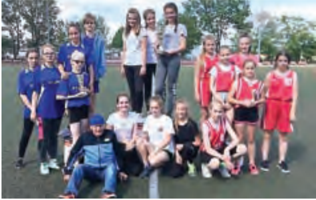
Podium reprezentacji dziewcząt.