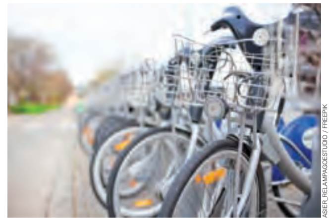
Rowery w punkcie wynajmu.

W postępowaniu przetargowym złożone zostały dwie oferty firm NB Serwis Sp. z o.o. (spółka zależna od Nextbike Polska) i EGIS BIKE Polska Sp. z o.o. Budżet zadania składa się z dwóch kwot: inwestycyjnej i eksploatacyjnej, a wynosi 28.453.212,39 zł. Wygrała oferta NB Serwis, która mieściła się w ww. cenie (oferta EGIS BIKE Polska znacznie ją przekraczała). Wybrana oferta została najwyżej oceniona i uzyskała największą liczbę punktów.