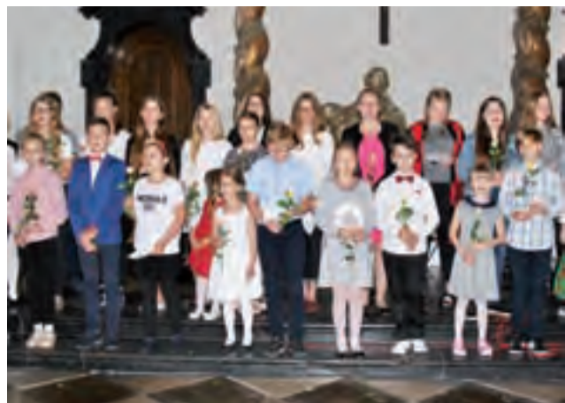
Uczestnicy koncertu z kwiatami, które za chwilę wręczą swoim mamom.