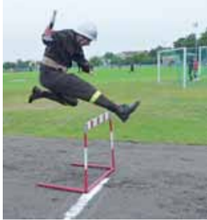
W sztafecie strażacy mieli do pokonania m.in. skok przez płotek.

Szczegółowa klasyfikacja przedstawiała się następująco: grupa A (mężczyźni): OSP Wrzeczko (wynik) 102,3; OSP Kalenice I 104,3; OSP Polesie