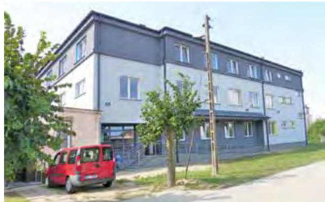
Frontowa elewacja nowo pobudowanej części MOS w Kiernozi.