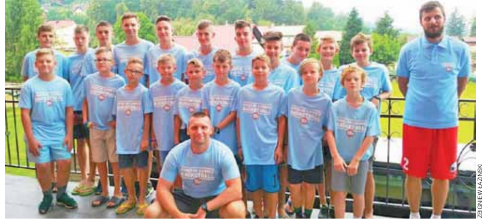
Grupa chłopców trenująca w Brennej.

Po serii treningów był czas na relaks i odpoczynek. Koszykarze odwiedzili pobliską Wisłę, gdzie aktywnie odpoczywali w Aquaparku w hotelu Gołębiewski oraz zwiedzili skocznnię narciarską. Wjazd koleją linową na górę skoczni robił duże wrażenie. Wszyscy się dziwili jak można z takiej wysokości zjechać na nartach i jeszcze oddać skok. Widoki z góry na panoramę Wisły były niesamowite. W programie było również ognisko z kielbaskami, na które uczestnicy pojechali bryczkami konnymi. Były też dwie dyskoteki. Pogoda dopisywała, zatem codziennym punktem dnia był odpoczynek nad górką potokiem Brennicą.