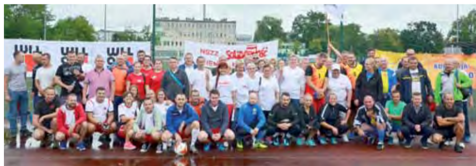
Uczestnicy III Turnieju Zakładów Pracy tuż przed jego rozpoczęciem.

Turniej rozpoczął się po godzinie 9.00 na łowickim OSiR. W sali rozgrywano mecze siatkówki, zaś na boisku piłki nożnej, zawody rekreacyjne i konkursy. Niespodzianką był turniej miast w przeciąganiu liny. W zawodach wystartowali pracownicy łowickich zakładów: ZPOW Agros Nova i Baumit, straży pożarnej i pracownicy oświaty, a także reprezentacje gości: Nestle Winiary Kalisz, Zakładów Tłuszczowych Kruszewica i Zakładów Mięsnych Animex Agryf Szczecin – łącznie ponad 100 zawodników. Szczegółowo o wynikach tych rywalizacji piszemy na stronie 38.