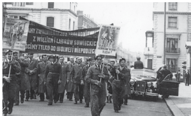
Wielka Brytania, Londyn, 22 kwietnia 1956 r. Przemarsz polskich emigrantów niosących plakat przedstawiający wychudzone polskie dzieci. Na drugim planie demonstranci niosą transparent z napisem „Żądamy zwolnienia (...) z więzień i łagrów sowieckich. Wrócimy tylko do wolnej i niepodległej [Polski]”.

■ 25 lutego 1956 – w czasie XX Zjazdu Komunistycznej Partii Związku Radzieckiego I sekretarz KPZR Nikita Chruszczow wygłasza tajny referat, w którym opisuje zbrodnie stalinowskie. Oskarża Stalina o wymordowanie tysięcy członków partii, stosowanie terroru, masowe aresztowania, deportacje tysięcy ludzi i budowanie kultu własnej osoby. Treść