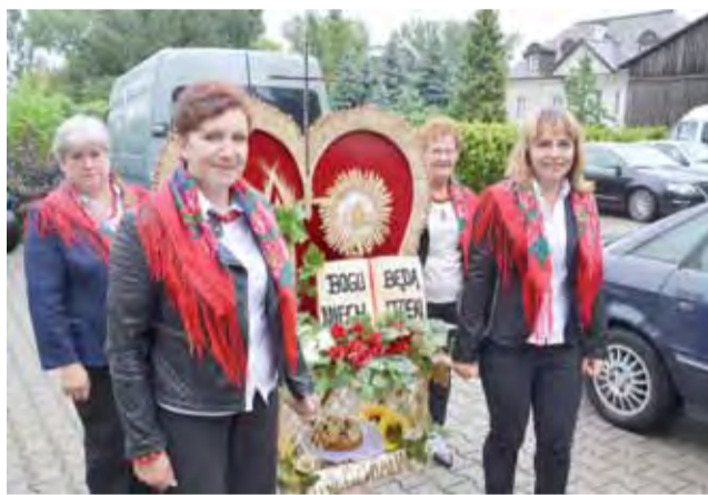
Wieńiec „Bogu niech będą dzięki” przygotowały mieszkanki Niedźwiady.

O przygotowaniach wieńca, na przykładzie pracy mieszkanki Popowa, pisaliśmy już obszernie w poprzednim numerze. W niedzielę można było się przekonać, że nie tylko Popów postarał się o jak najokazalszy wieńiec – symbol przywiązania do ziemi i jej plodów. W tym roku szczególnie dużo wieńców nawiązywało też do symboliki państwowej, podkreślając w ten sposób setną rocznicę odzyskania niepodległości.