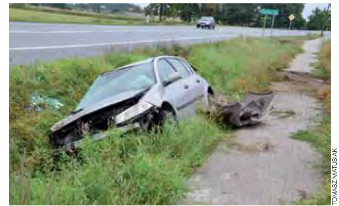
Samochód po wypadku – wyglądało bardzo poważnie.

Kiedy rozmawialiśmy na ten temat z funkcjonariuszką zastępującą rzecznik KPP w Łowiczu, nie miała jeszcze wyników badań. Nieoficjalnie jednak wiemy – bo wśród mieszkańców Bielawskiej i okolic nie jest to żadną tajemnicą – że mężczyzna od dawna miał problemy z nadużywaniem tego typu używek. tm