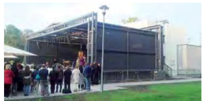
Odnowiona muszla wygląda rzeczywiście imponująco.

Sanniki od wielu lat utrzymują też partnerskie relacje z francu-