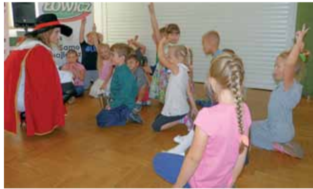
Najpierw były zabawy i konkursy, później dzieci otrzymały upominki.

cinę Galków-Walczkiewiczów. Na koniec spotkania dyrektor zakładu wręczył dzieciom upominki – plecaki z wyposażeniem w przybory szkolne, pojemniki na drugie śniadanie i artykuły spożywcze – od Grupy Maspex oraz torby z wyrobami owocowo-warzywnymi oraz reklamowymi gadżetami – od łowickiego zakładu ZPOW Agros Nova. mwk