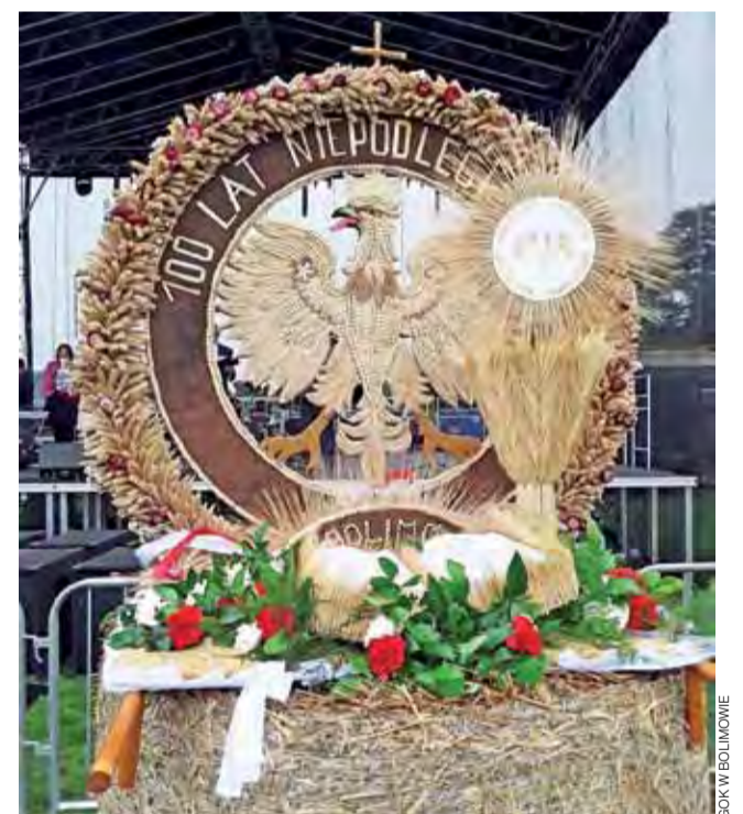
Gmina Bolimów w tym roku zaprezentowała wieniec nawiązujący do setnej rocznicy odzyskania przez Polskę niepodległości.

Istotną częścią niedzielnego wydarzenia była prezentacja dziecięciu gmin, po której odbyło się podsumowanie kilku konkursów