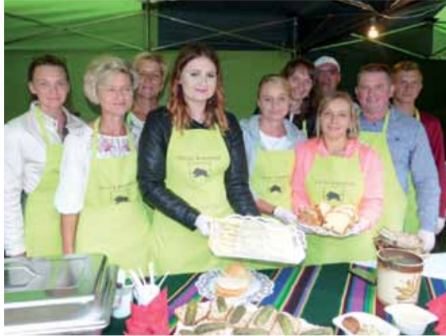
KGW Osiny całą noc poprzedzającą biesiadę lepilo pierogi.