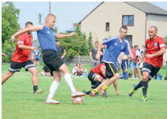
Mecz fazy grupowej pomiędzy Polesiem (czerwone koszulki) a Seligowem (niebieskie koszulki).