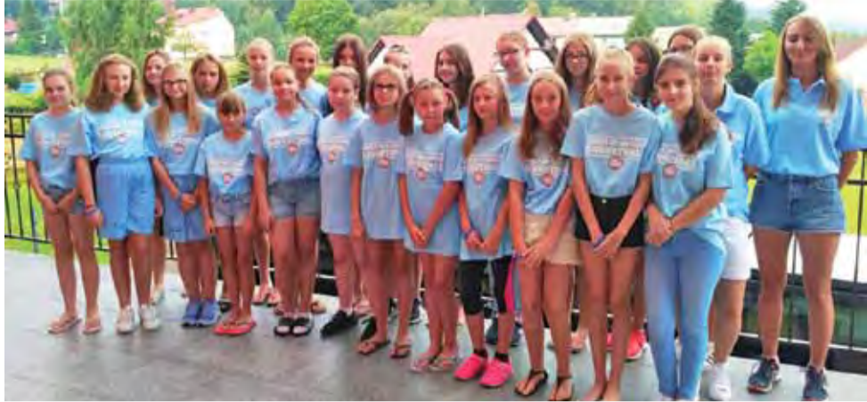
Liczna ekipa dziewczyn na zgrupowaniu w Brennej.