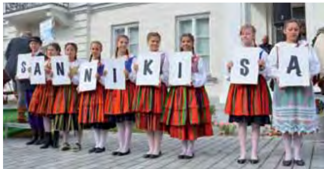
Formalnie Sanniki są miastem od 1 stycznia. Teraz, w czasie Niedzieli Sannickiej, wybrzmiało to wiele razy - wyraźnie i głośno.