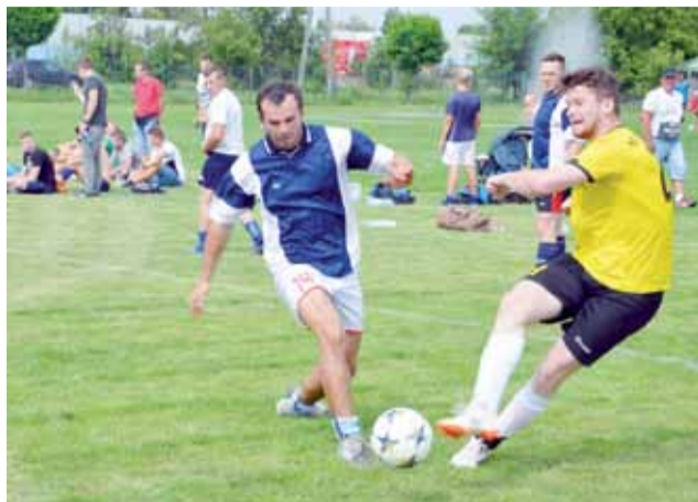
Mecz o trzecie miejsce pomiędzy Stachlewem (koszulki żółte) a Bobrową (koszulki niebieskie).

Piłka nożna | Turniej o Puchar Wójta Gminy Łyszkowice