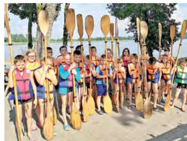
Judocy siłę trenowali na kajakach.

Już od września można rozpocząć zajęcia judo, które są organizowane w dwóch grupach naborowych. Przedszkolaki w poniedziałki 16.30-17.30 i młodzież szkolna we wtorki, czwartki i piątki od godz. 16.00 do 17.30. Szczegółowe informacje będą dostępne na na FB Zryw Łowicz i pod nr tel. 508-194-326. zł