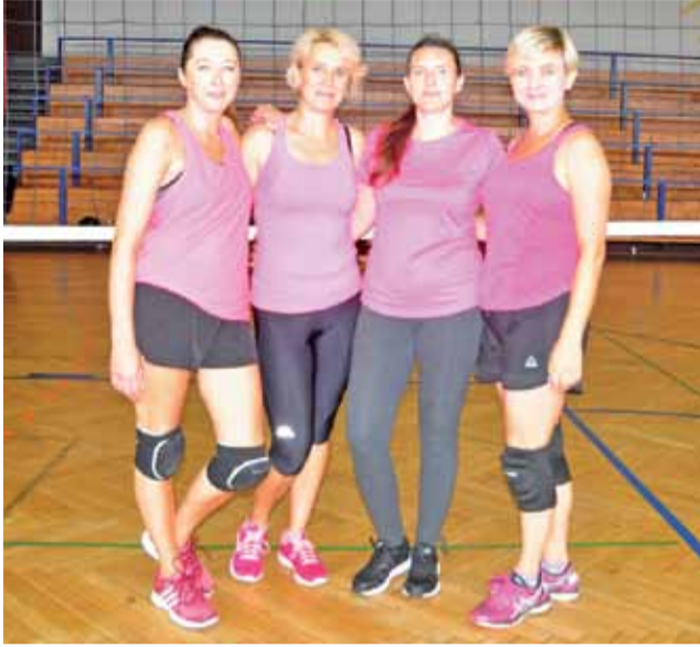
Reprezentantki Oświaty Łowicz zajęły drugie miejsce w turnieju siatkówki.