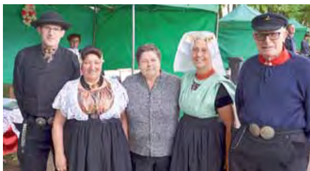
Goście z holenderskiej Zelandii przyjechali w ich tradycyjnych, ludowych strojach.