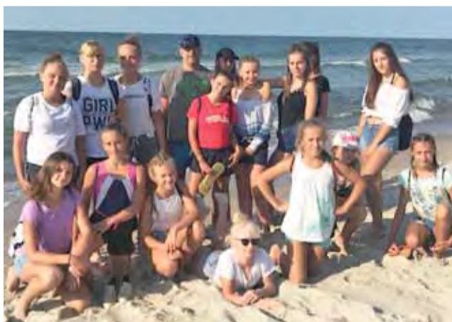
Łowiczanki szlifowały formę nad polskim morzem.