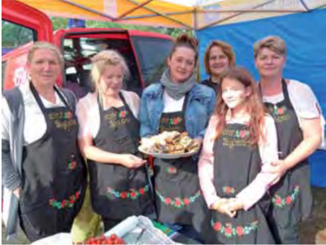
KGW Rogóźno zaprasza na stoisko zachwalając swoje wypieki.