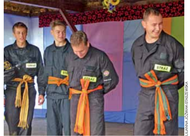
W wyborach Mistra OSP decydujące było wiązanie łowickiego pasa.