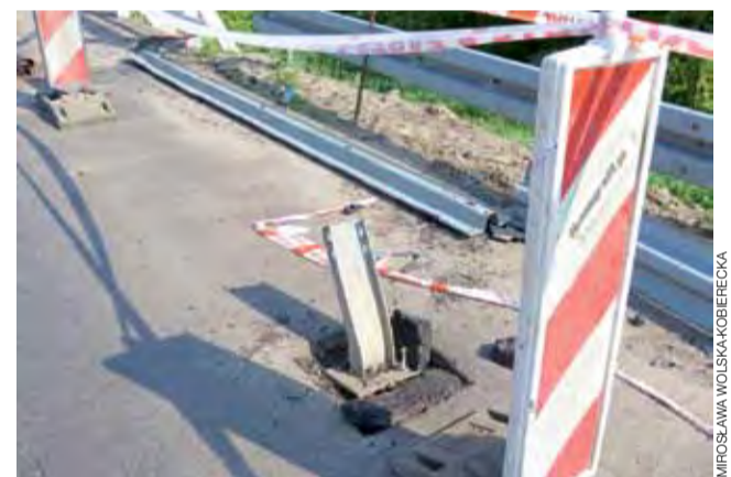
Siła uderzenia zerwała barierki energochłonne i uszkodziła słupki, które je mocują.

runku Łodzi w stronę Łowicza. Z drogi wypadł zaraz za zakrętem. Kierowała nim 23-letnia kobieta, która została ranna. Na szczęście nie były to obrażenia zagrażające życiu, ale została zabrana do szpitala w Łowiczu, gdzie pozostała. Kierująca była trzeźwa. Nie odniosła obrażeń jej pasażerka w wieku 24 lat. tm