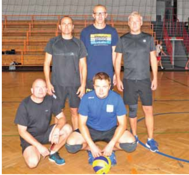
Nauczyciele z ekipy Oświaty Łowicz w tym roku byli zdecydowanie najlepsi.

Rekreacja | III Turniej Zakładów Pracy w Łowiczu