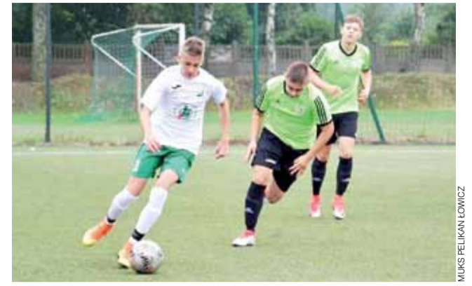
Pelikan 2002 (białe koszulki) uległ w Sieradzu Warcie 3:1.