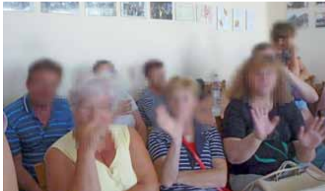
Obecni podczas głosowania mieszkańcy Bochenia kategorycznie odmówili fotografowania, dlatego ich twarze zostały ocenzurowane.

Weźcie się do jakiejś roboty, aby we wsi żyło się lepiej. Nie wiem również na jakiej podstawie odwołano mnie z funkcji sołtysa: czy tylko na podstawie tych bzdurnych zarzutów, czy na podstawie zarzutów ze strony Urzędu Gminy. Chcę to wiedzieć, bo jako oskarżony mam prawo do obrony własnego wizerunku. Chcę, by społeczeństwo dowiedziało się o praktykach zaistniałych w gminie Łowicz.