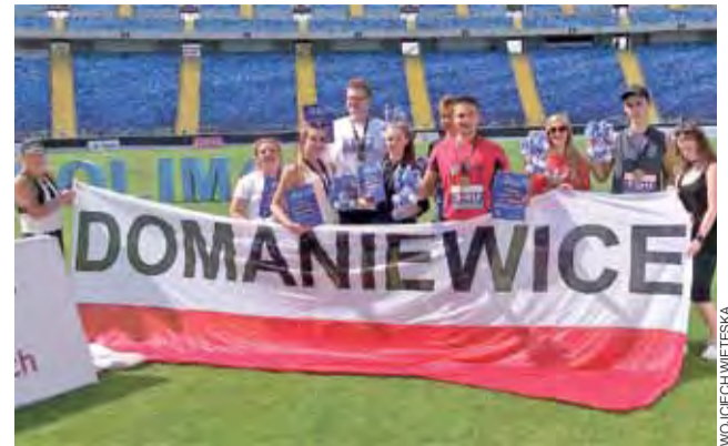
Mocna reprezentacja Domaniewic na stadionie w Chorzwie.