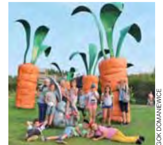
Mali mieszkańcy Domaniewic odwiedzi m.in.: Magiczne Ogrody koło Puław.

Podczas obchodów wystąpiła Sochaczewska Orkiestra Dęta. aa