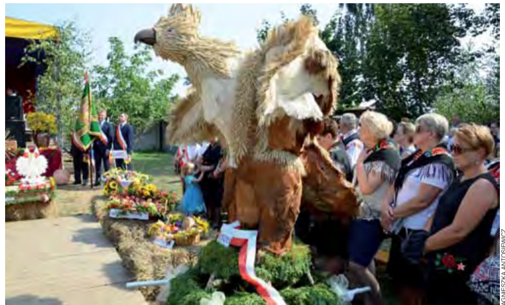
Orzeł w koronie – to chyba najczęściej pojawiający się motyw na tegorocznych dożynkach, choć ile sołectw, tyle pomysłów na jego przedstawienie. Wierca w tym kształcie nie zabrakło także na święcie plonów w Zielkowicach.

Dożynki rozpoczęły się od barwnego korowodu, który wy-