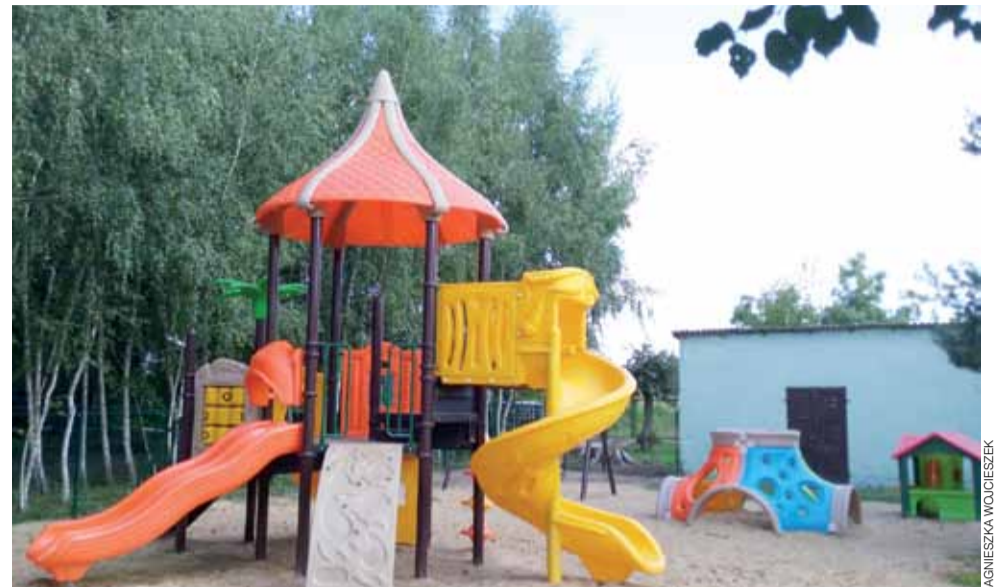
Na placu przy ZSP w Sobocie stanęły zjeżdżalnie w fantazyjnych kształtach.

– Zależało nam na tym, by zapewnić bezpieczeństwo osobom przebywającym w tym miejscu. Plac zabaw położony jest daleko od drogi, a jednocześnie ogrodzony, by opiekunowie nie musieli się martwić o swoje pociechy. Został on usytuowany na terenie zielonym, więc chętni mogą tu odpocząć w naturalnej scenerii, jak również schronić się przed słońcem w cieniu pobliskich drzew – zauważyła dyrektorka gimnazjum Wojciech Szczeciński. Chętni mogą skorzystać z placu zabaw