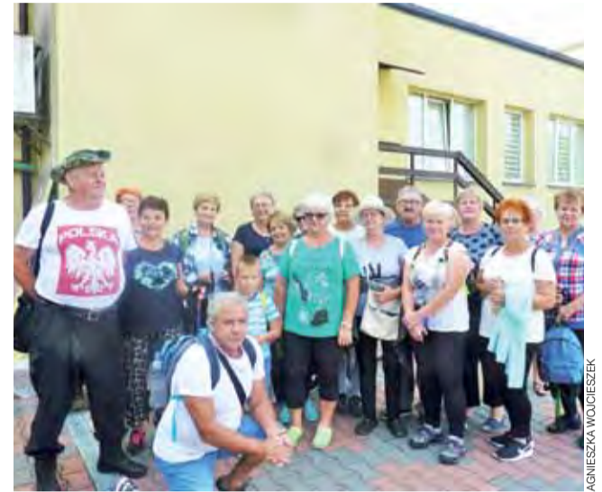
W pieszym Rajdzie do Czatolina wzięli udział seniorzy ze Stowarzyszenia „Aktywny Senior” z Domaniewic.

– Rajd zainteresował nas ze względu na aspekt patriotyczny,