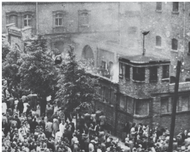
Manifestanci opanowują centralne więzienie przy ulicy Młyńskiej, godz. 9.30-11.00 (28.06.1956 r., Poznań)

Podobnie jak w latach poprzednich, będzie możliwość ostemplowania swoich książek okolicznościową pieczęcią. mwk