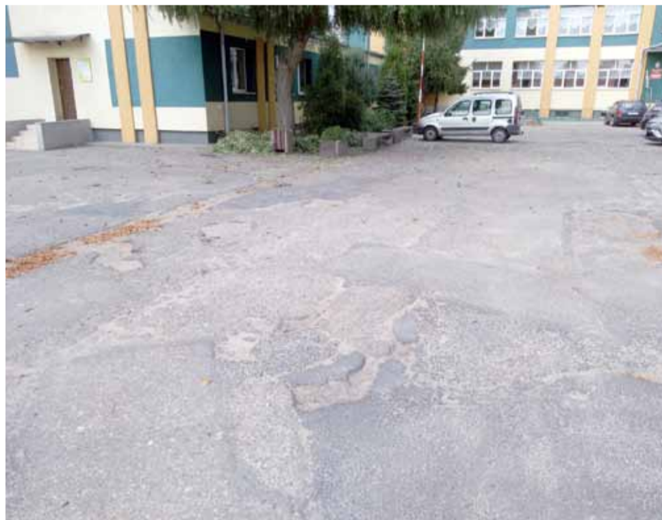
W tym roku nawierzchnia na placu przed szkołą nie będzie naprawiona.

Wynik przetargu był znany jeszcze przed sesją. Żeby podpi-