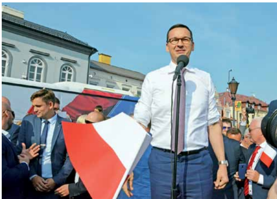
Mateusz Morawiecki przedstawił na spotkaniu w Łowiczu program PiS na jesienne wybory samorządowe.

Jeszcze przed przyjazdem Prezesa Kancelarii Rady Ministrów do Łowicza pojawiły się kontrowersje związane z tym, że w tym