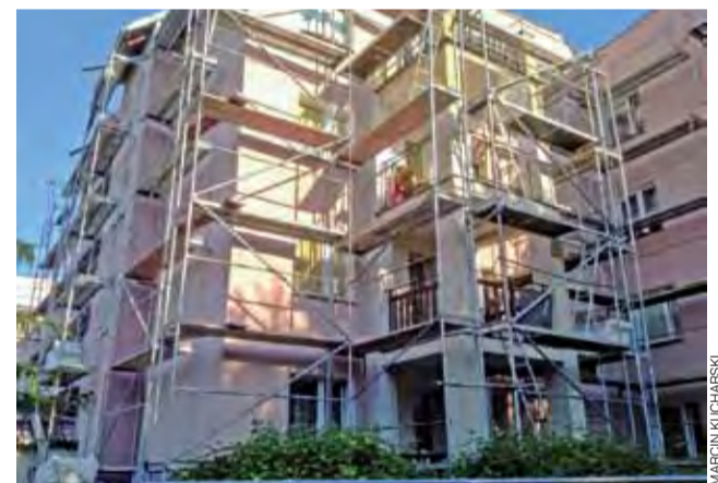
Docieplany budynek ŁSM na osiedlu Dąbrowskiego w Łowiczu.

Większość robót została już wykonana. LUX-BUD wszedł na roboty jako ostatni, stąd też i jako ostatni kończy. Żadne terminy jednak nie zostały przekro-