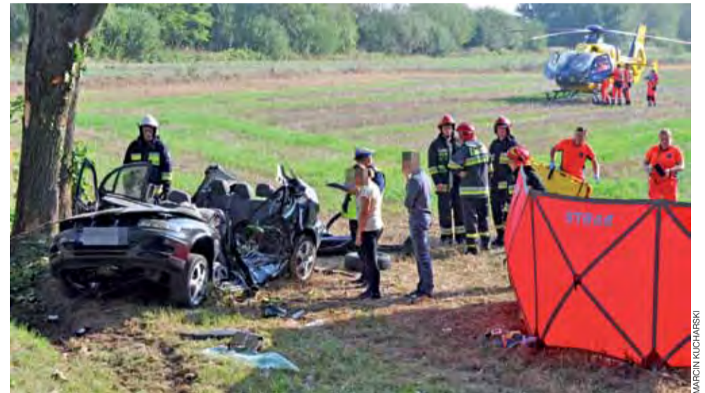
18-letni kierowca Seata Leona został zabrany śmigłowcem Lotniczego Pogotowia Ratunkowego do szpitala w Zgierzu.

Nie był to jedyny wypadek w tym zakładzie w ostatnim czasie. 20 sierpnia w godzinach popołudniowych przy linii produkcyjnej doszło do śmierci 35-letniego pracownika. Mężczyzna nagle się przewrócił, poważnie zranił się w głowę i zmarł. Pisaliśmy o tym na łamach Nowego Łowiczaniec. Postępowanie w tej sprawie też jeszcze nie zostało zakończone. mak