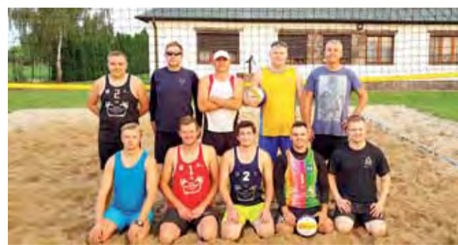
Mocna ekipa ŁAGS Awanturnik zakończyła plażowy sezon.

– Ja się cieszę, że po raz czwarty udało nam się spotkać w takim gronie. Bardzo dziękujemy pro-