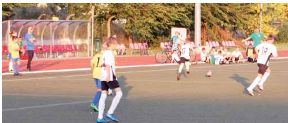
W derbach Łowicza młodzików młodszych D2 lepszy był Pelikan-2007.

– Pierwszy nasz mecz na dużym boisku po dość dużej przerwie od ostatniego razu, więc widać było duże niedociągnięcia w grze. Chłopcy jeszcze nie potrafili odnaleźć się na tej dużej przestrzeni. Mieliśmy obóz na początku lipca i wówczas gra na dużym boisku wyglądała dość dobrze. Natomiast tak, jak mówi stare powiedzenie – powtarzanie jest matką nauki. Duża część tego co się nauczyliśmy została zapomniana, więc musimy to wszystko powtórzyć i zajmie nam to prawdopodobnie 4-5 kolejnych spotkań, aby