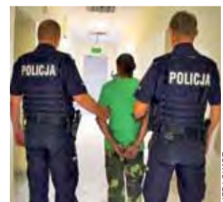
Mężczyzna podczas zatrzymania był nietrzeźwy.

W pewnym momencie rzucił w jednego z funkcjonariuszy śrubokrętem, raniąc mu – jak ustal-