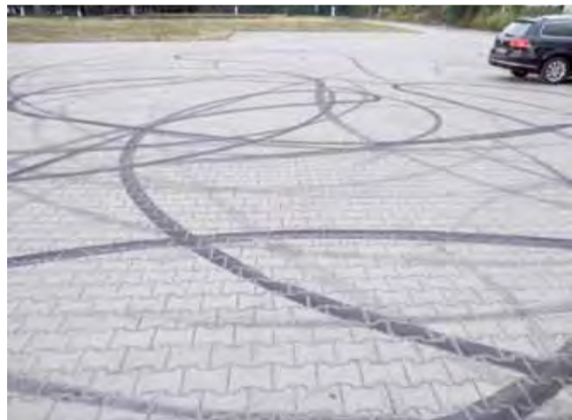
Ślady po „kręceniu bączków” na parkingu w Sannikach.

– Składaliśmy wniosek o taki monitoring – powiedział wójt. Losy wniosku jednak nie są jeszcze znane. ■