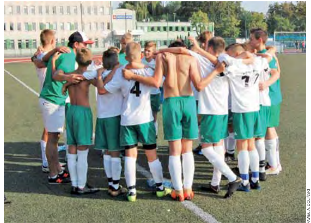
Radość graczy Pelikana 2005.