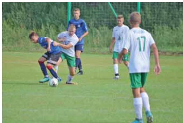
Pelikan 2002 (białe koszulki) zremisował z Włóknierzem 2:2.