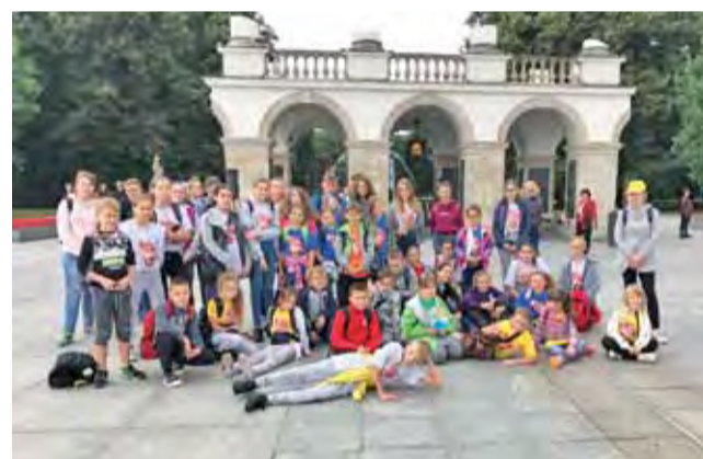
Ostatni turnus zwiedza Warszawę z muszkietierami. Na zdjęciu – przy Grobie Nieznanego Żołnierza.

Uczestnicy, pochodzący z różnych stron Polski, to dzieci z rodzin niezamożnych lub z domów dziecka. Zostali podzieleni na 8 turnusów. Dwójka z Łowicza wyjechała 26 sierpnia, a wróciła 1 września – był to ostatni turnus w tym roku. Dzieci przebywały w ośrodku wypoczynkowym w Julinku w sercu Puszczy Kampinowskiej, a jednym z punktów programu było też zwiedzanie Warszawy, w tym m.in. Centrum Nauki Kopernik, Stadionu Narodowego, Pała-