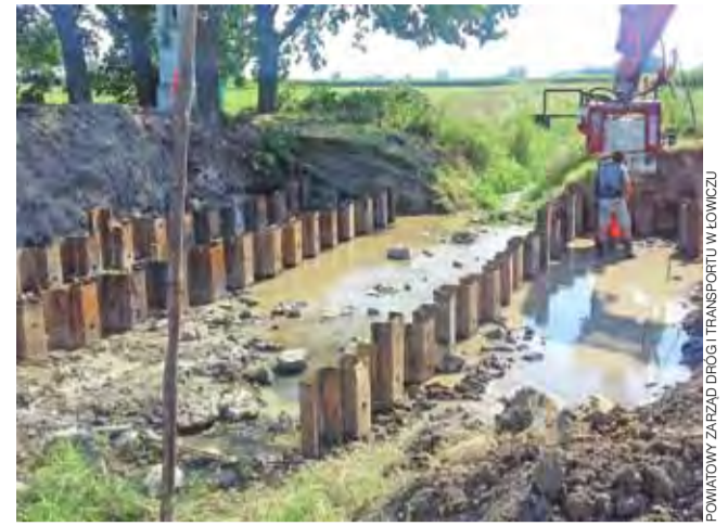
Prace przy budowie mostu w Bąkowie w ciągu drogi powiatowej do Soboty.

Wykonawcą tego zadania jest Przedsiębiorstwo Robót Inżynieryjno-Drogowych w Łowiczu, które zawarło z PZDiT umowę na 790 tys. zł. Termin jej realizacji ustalono do 15 listopada. mwk