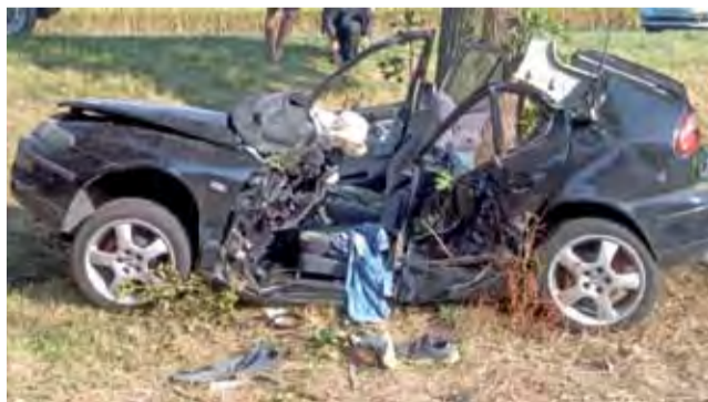
Tym samochodem jechało do szkół w Łowiczu czterech osiemnastolatków.

Do poważnego wypadku doszło we wtorek, 4 września, około godziny 7.30 na drodze wojewódzkiej 704 w okolicach Kalenic w gminie Łyszkowice.