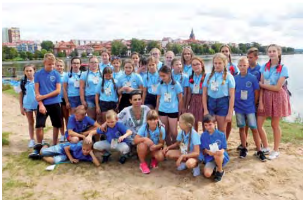
Dziecięcy Zespół Ludowy „Kocierzewiaczy” podczas pobytu na Mazurach.

Próby zespołu zostaną wznowione 7 września, o godz. 16.00, w sali biblioteki w Kocierzewie Płd. Podczas wrześniowych prób, w każdy piątek o stałej porze, będzie też prowadzony nabór dzieci do zespołu. aa