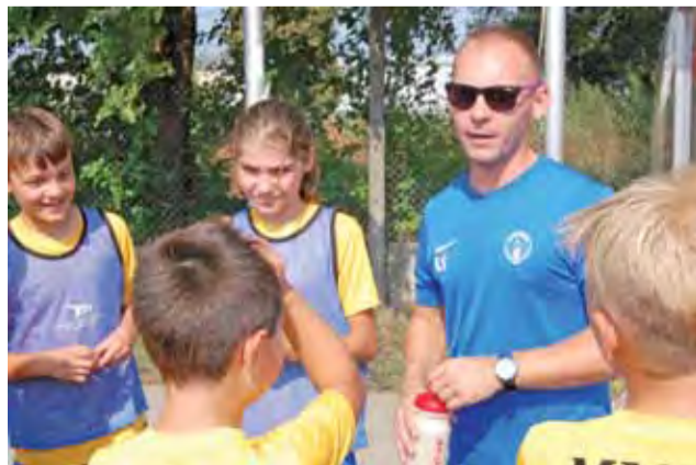
Zawodnicy Akademii w przerwie meczu omawiali z trenerem taktykę gry.

■ 3. kolejka (2018.09.08): MUKS Pelikan-2007 Łowicz – GKS Olimpia Chaśno (s. godz. 12.30), UKS AP Champions Łowicz – GKS Bedno (s. godz. 10.00), MKS Unia Skierniewice – LKS Zjednoczenie Bobrowniki Dzierzgow (s. godz. 10.00), MLKS Widok Skierniewice – SKS Astra Zduny (s. godz. 16.00)